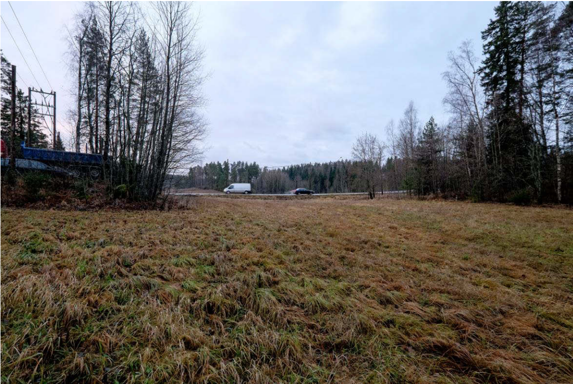
Tutkimusalue ennen kaivamista. Kuva pohjoisesta. (AKDG4601:1)