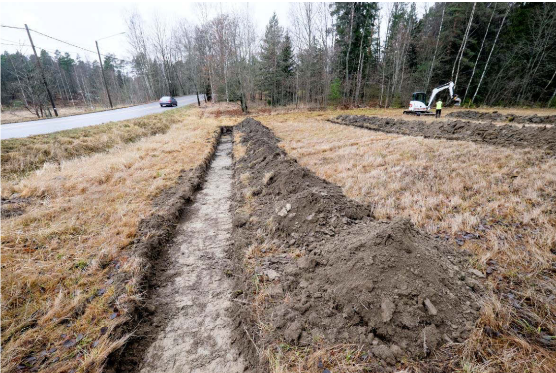
Eteläisin koeoja, peltomullan alla tuli esiin savi. Kuva idästä. (AKDG4601:6)