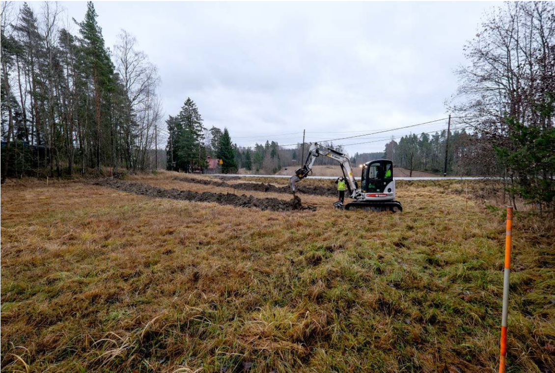
Koeojia kaivetaan tutkimusalueen etelä osassa. Kuva luoteesta. (AKDG4601:3)