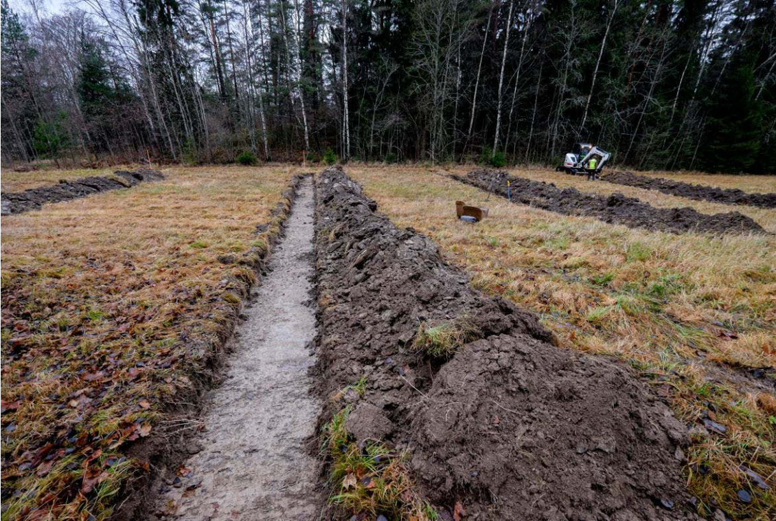
Koeoja pellon keskiosassa. Kuva idästä. (AKDG4601:7)