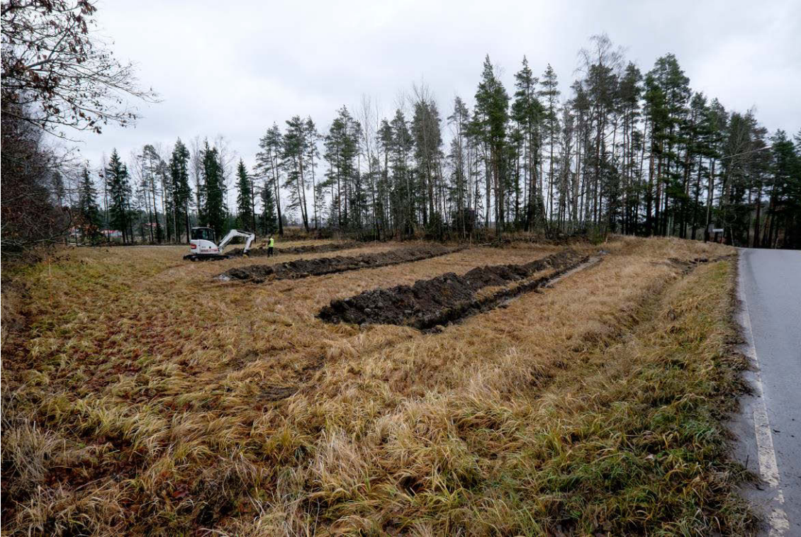
Tutkimusalue, kuva lännestä. (AKDG4601:5)