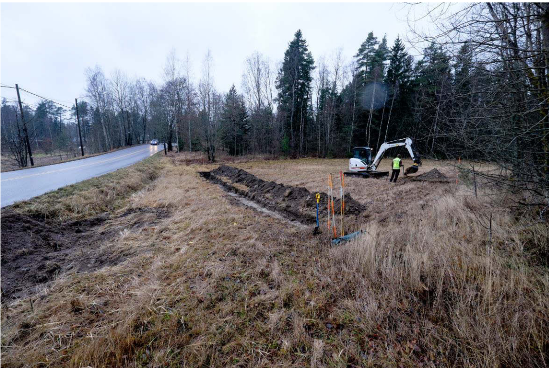
Koeojia kaivetaan tutkimusalueen etelä osassa. Kuva idästä. (AKDG4601:2)