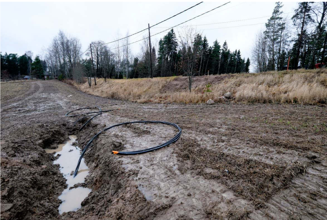
Lapinjärventien eteläpuolella olevaa peltoa, jolle on vedetty kaapeli syksyllä 2015. Kuva idästä. (AKDG4601:4)