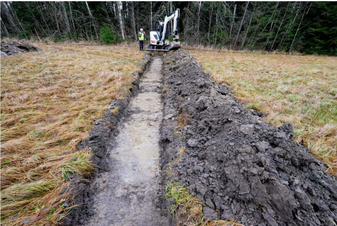
Pohjoisin koeoja pellolla. Kuva idästä. (AKDG4601:8)