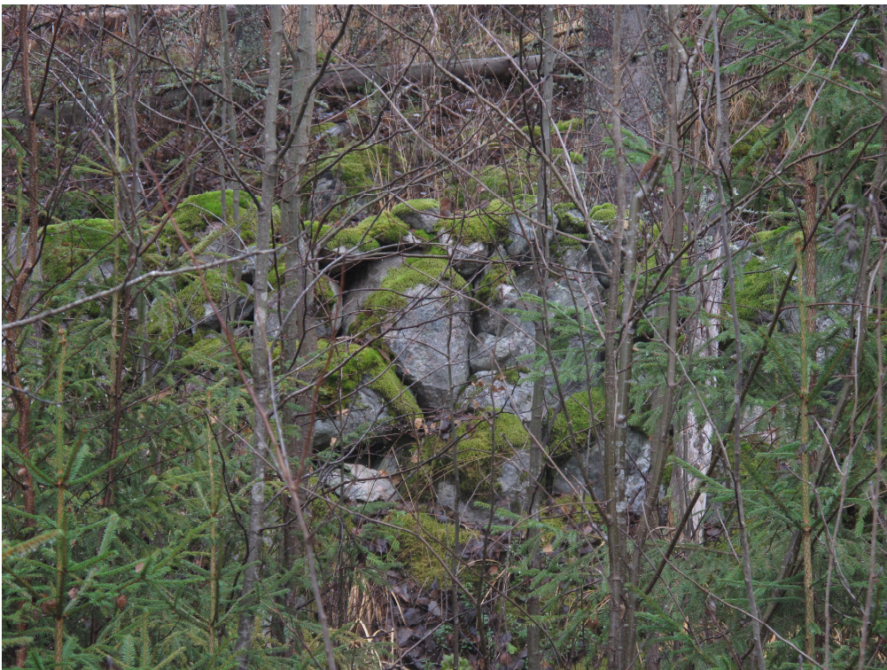
Kuva 4. Lähikuva kiviaidan rakenteesta. Kuvattu mökkitieltä.