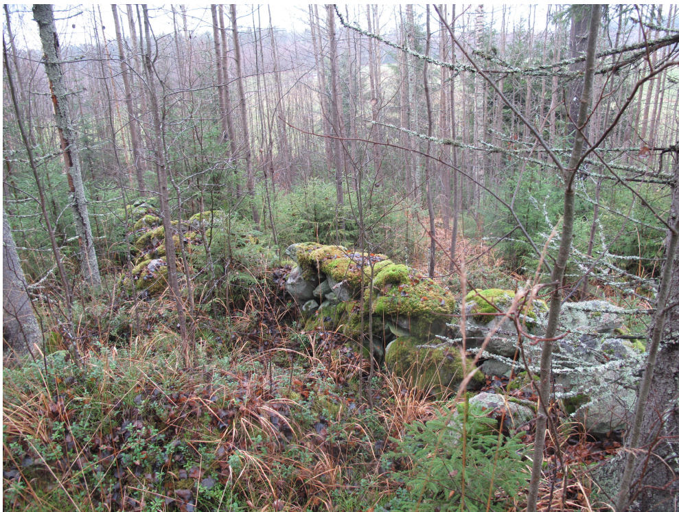
Kuva 1. Kiviaita kuvattuna mäen puolelta.