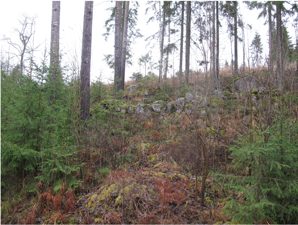
Kuva 3. Kiviaitaa mökkitieltä kuvattuna kohti pohjoista.