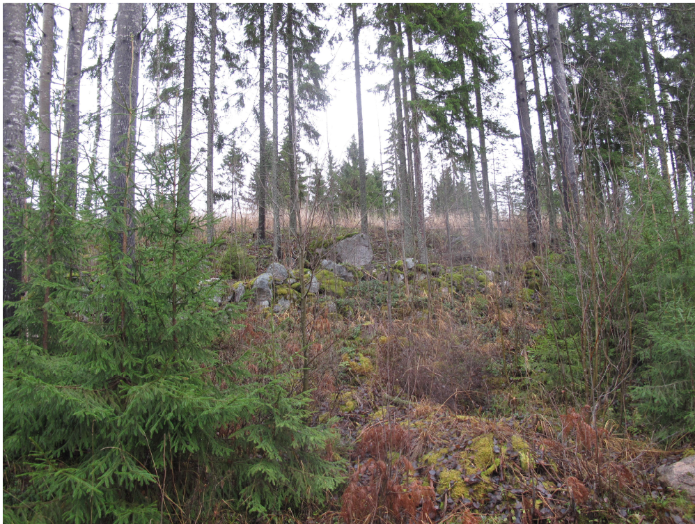
Kuva 2. Kiviaitaa mökkitieltä kuvattuna kohti pohjoista.