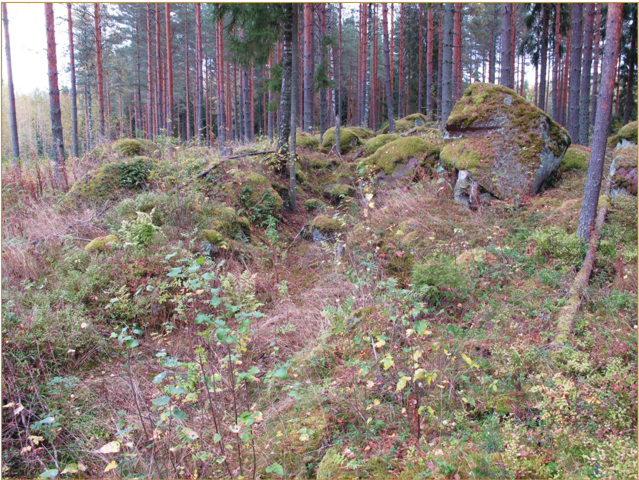
Kuva 3: Tulaseman jäännökset suunnasta NW.