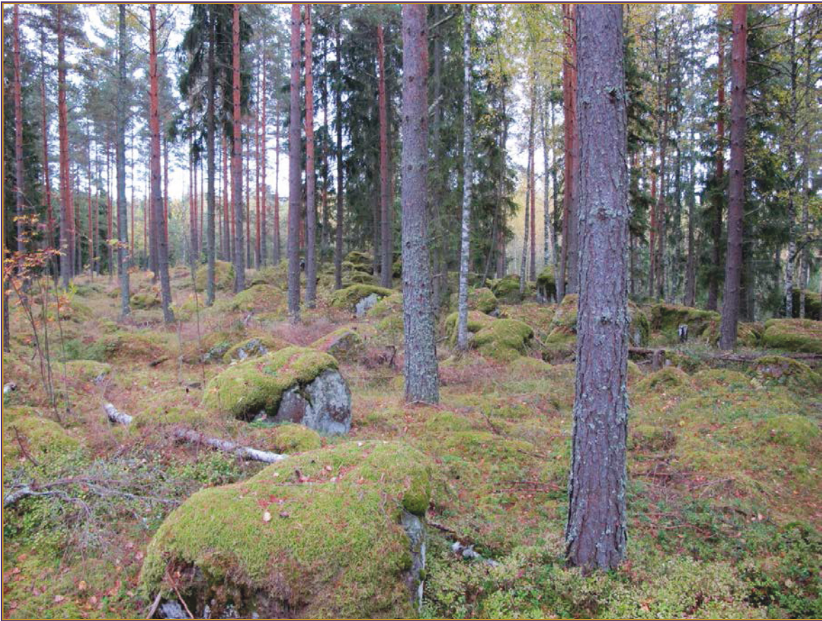
Kuva 1: Tuliaseman SE-puoleisen sivustan kivikkomaastoa ja Niemenmäen lakea. NW.