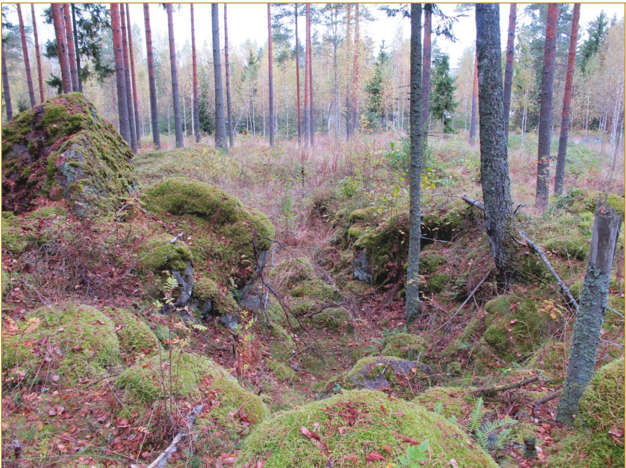
Kuva 4: Tulaseman SE-pään muodosti kivien rajaama syvä kuoppa. SE. Kuvan taustalla siintää Kymijoki.