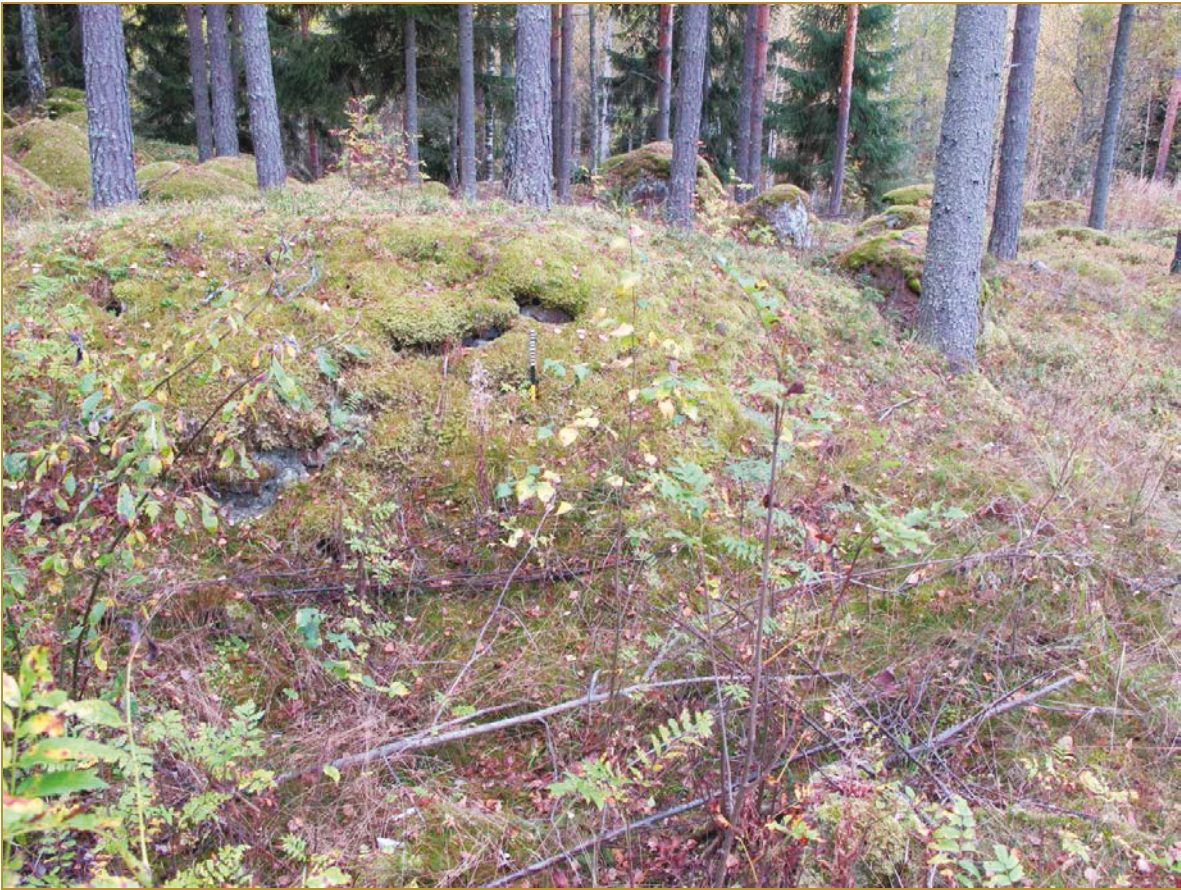
Kuva 5: Sammalkerroksen peittämää kiviatomusta tuliaseman SW-sivustalla. NE.