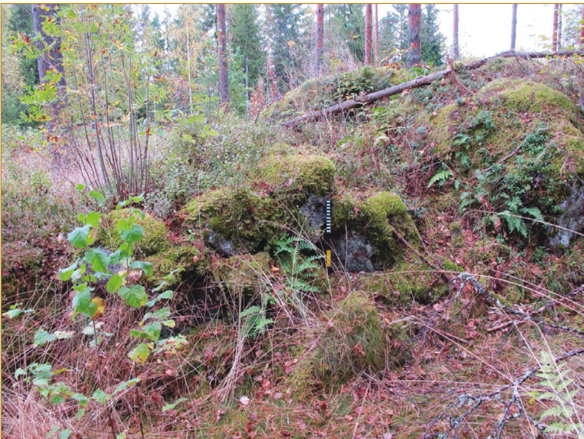
Kuva 6: Tuliaseman kiviatomusta rakenteen NE-sivustalla. SW.