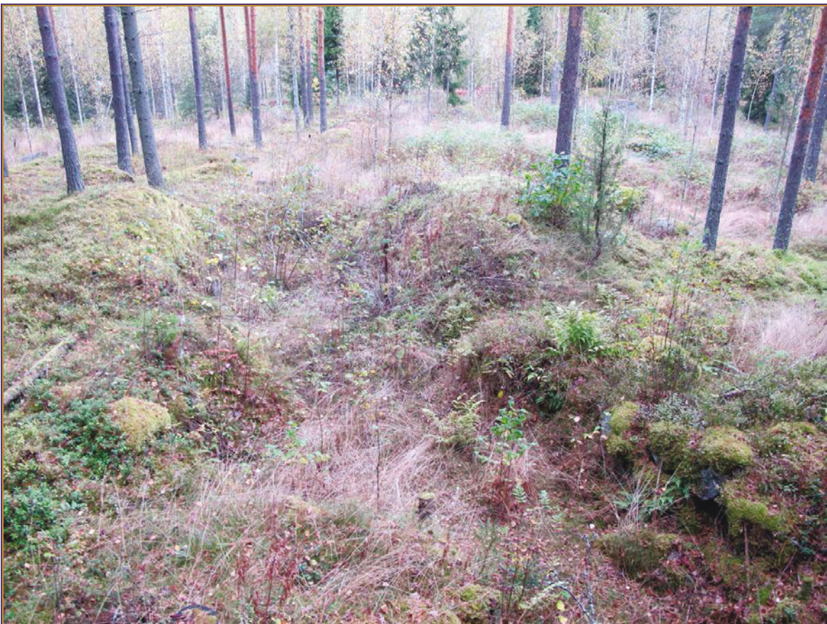
Kuva 2: Tuliaseman NW-puoleista maastoa Kymijoelle päin. NE.