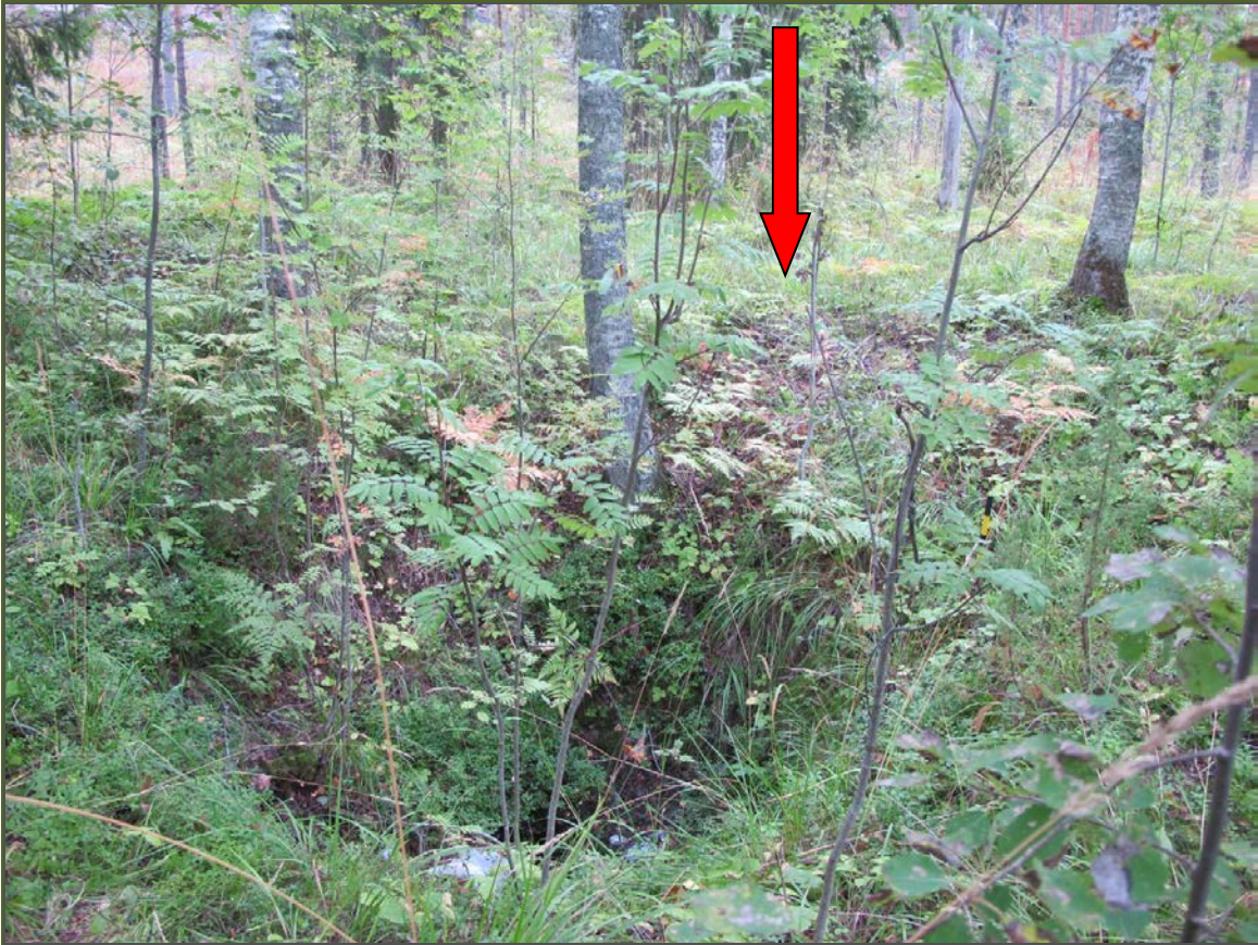
Kuva 3: Tervahaudan halssin mahdollinen sijaintipaikka (nuoli). SW.