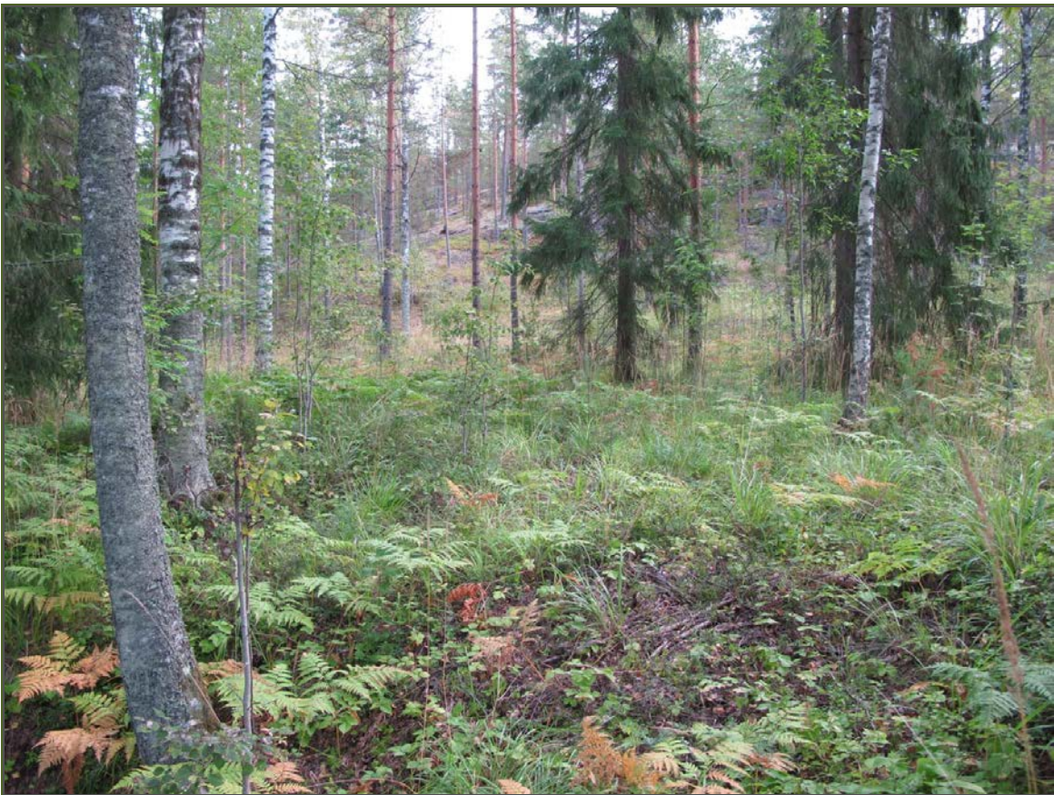
Kuva 2: Tervahaudan keskustaa suunnasta SW. Taustalla Myllymäen rinnettä.