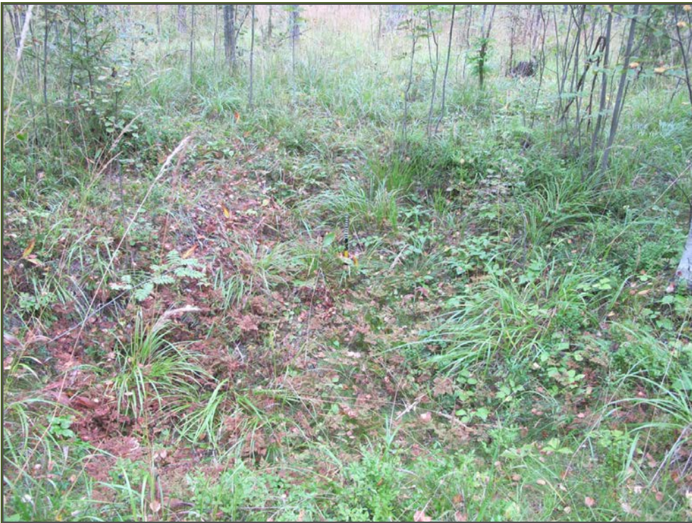
Kuva 5: Yksi tervahaudan NW-puolella sijainneista kuopanteista. SE.