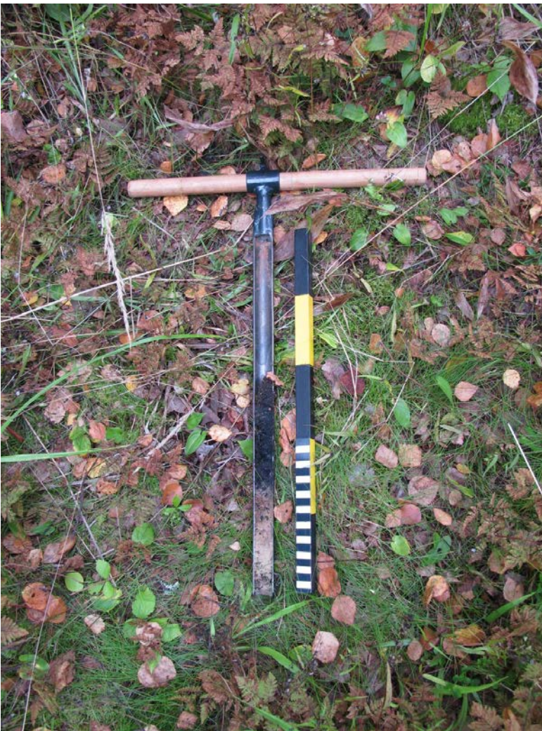
Kuva 6: Kuvan 5 kuopanteesta löytyi runsaasti puuhiiltä.