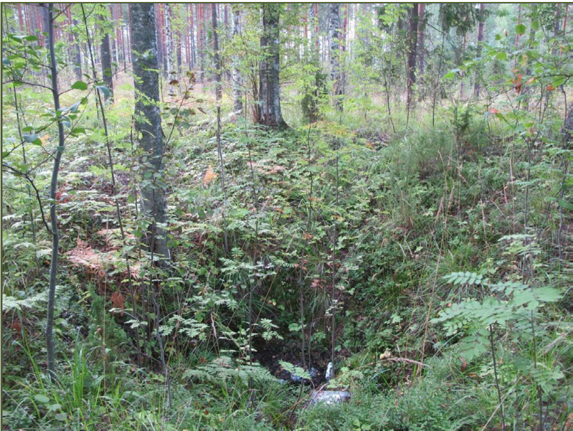
Kuva 4: Tervahaudan keskellä sijaitseva neliömäinen kuoppa, jonka pohjalla sijaitsi puinen rakenne. E.