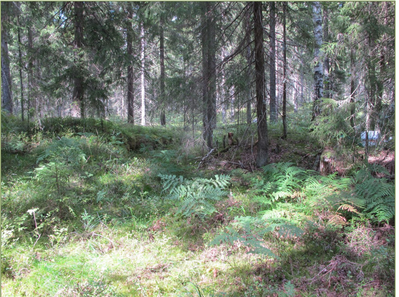
Kuva 5: Tervahaudan SW-sivustaa, jonne oli kaivettu erikokoisia kuoppia. Tervahauta kuvan vasemmassa yläkulmassa. NW.