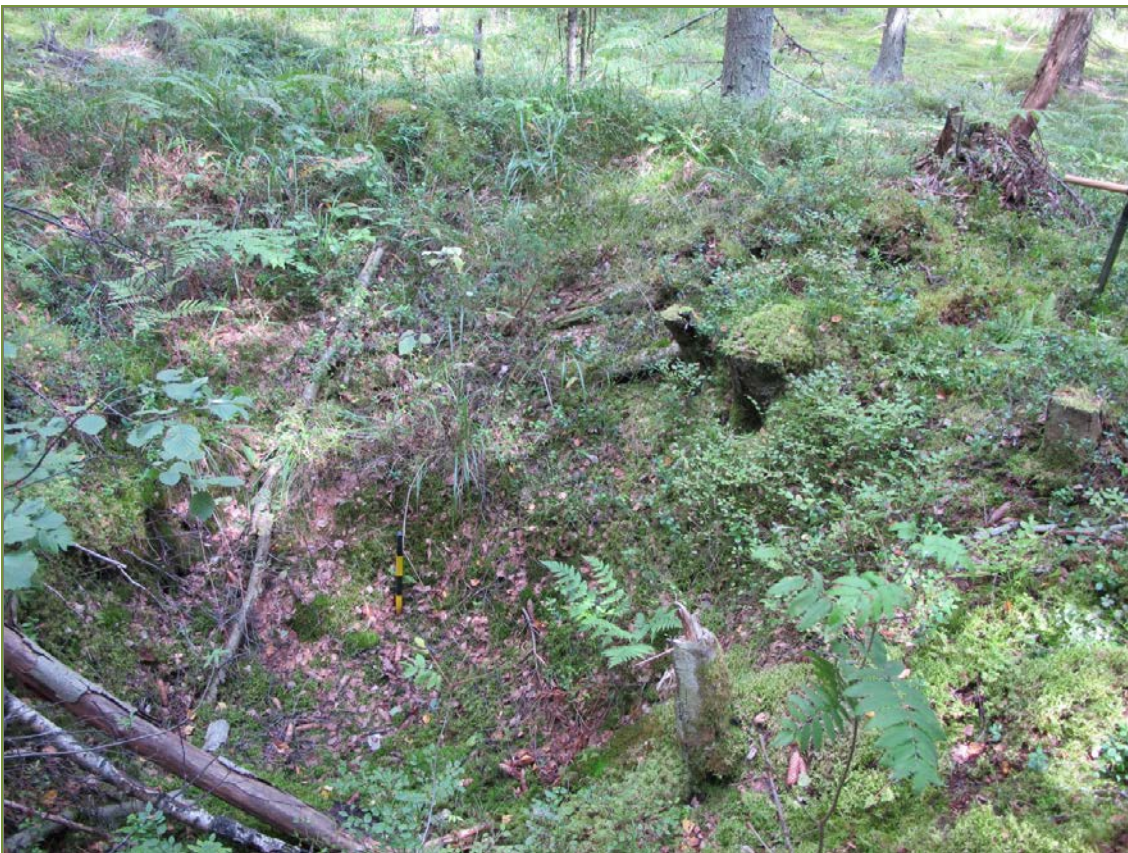
Kuva 4: Tervahaudan keskellä sijaitseva suorakaiteinen kuoppa, lähikuva. SE. Kuva: KyM/M. Kykyri.