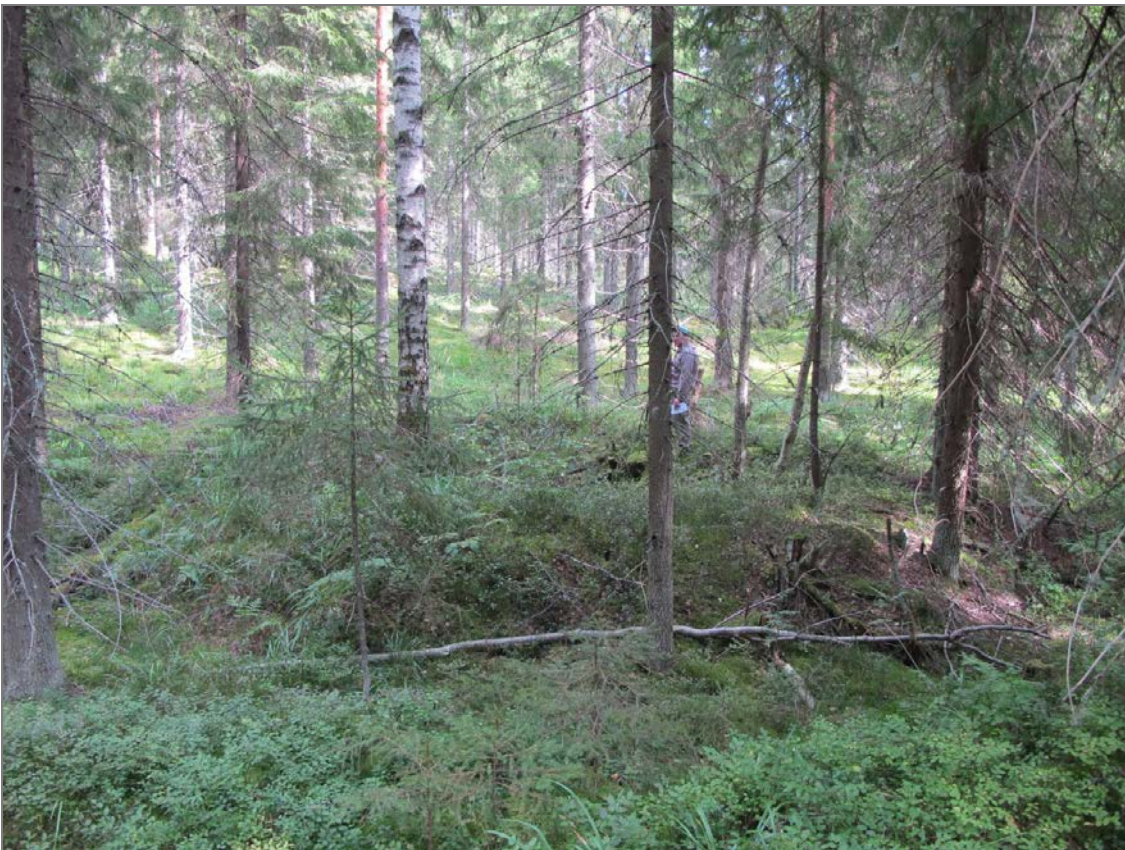
Kuva 2: Kohde suunnasta W. Opas J. Perätalo kuvassa tervahaudan vallin päällä.