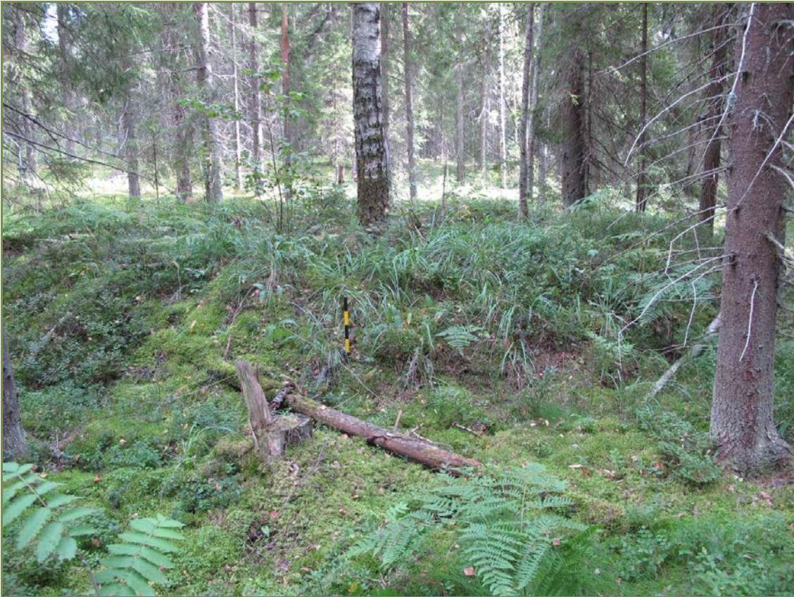
Kuva 3: Tervahaudan NW- ja W-sivustaa, lähikuva W.