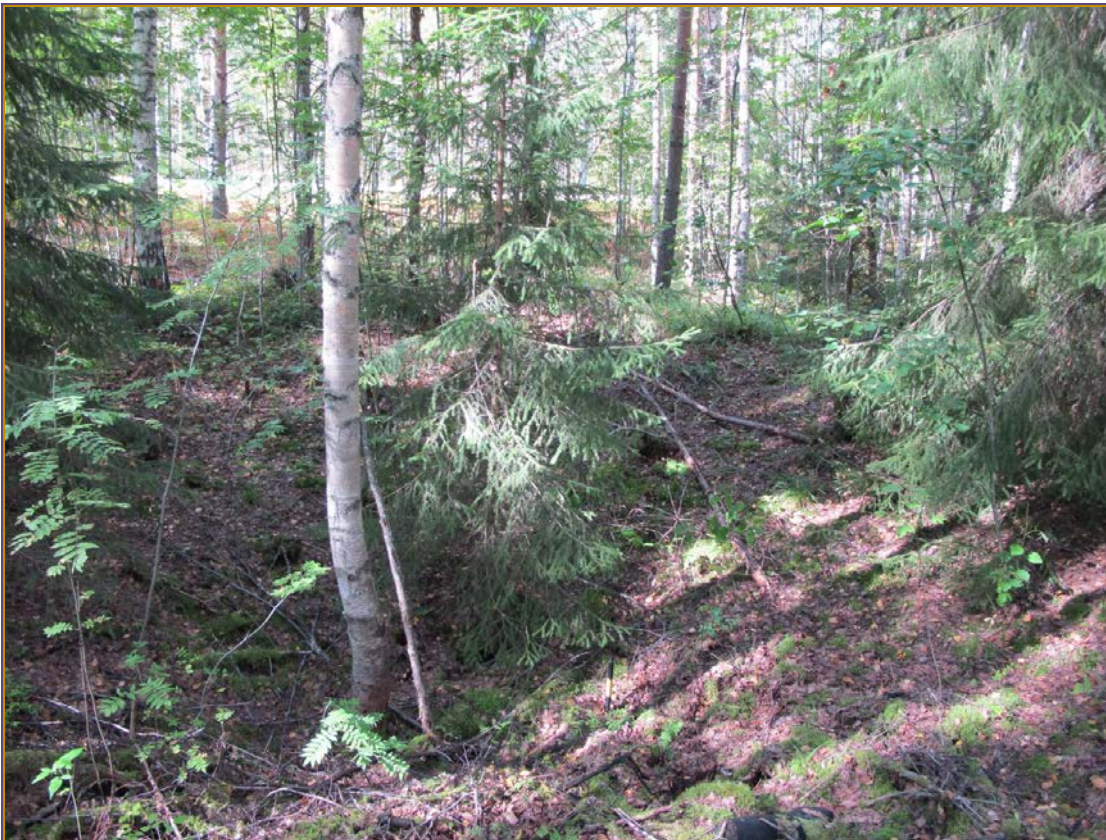
Kuva 2: Tervahaudan suppilomainen keskusta. Kuvan taustalla kulkee Mäntyharjuntie. N. Kuva: KyM/M. Kykyri.