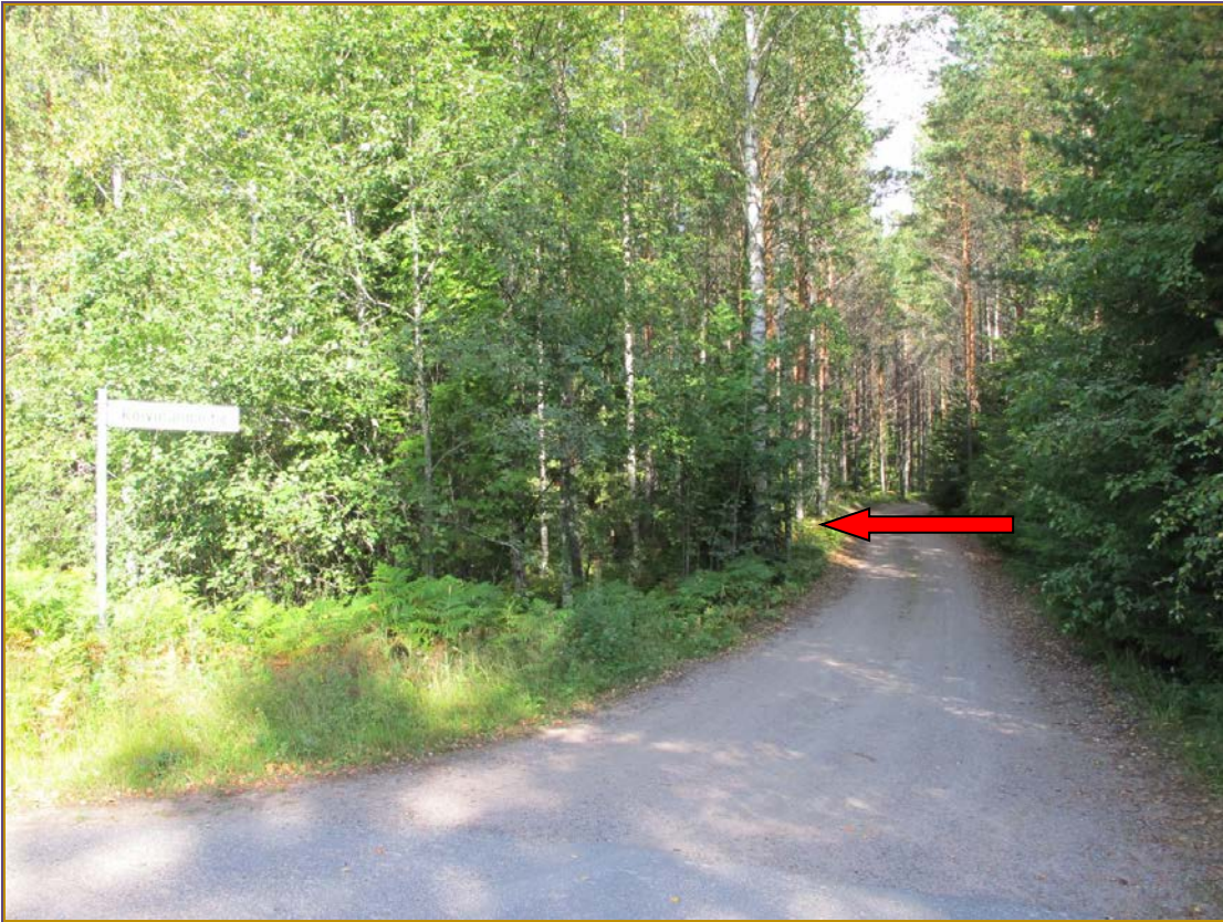
Kuva 1: Mäntyharjuntien ja Koivurannantien risteys. Kohteen sijaintia metsässä osoittaa punainen nuoli. SW.