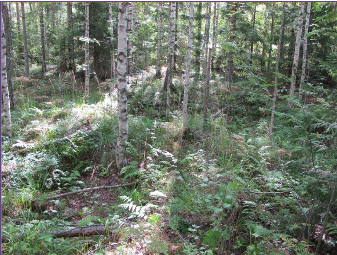
Kuva 4: Tervahaudan edustan kuoppaista maastoa. N.