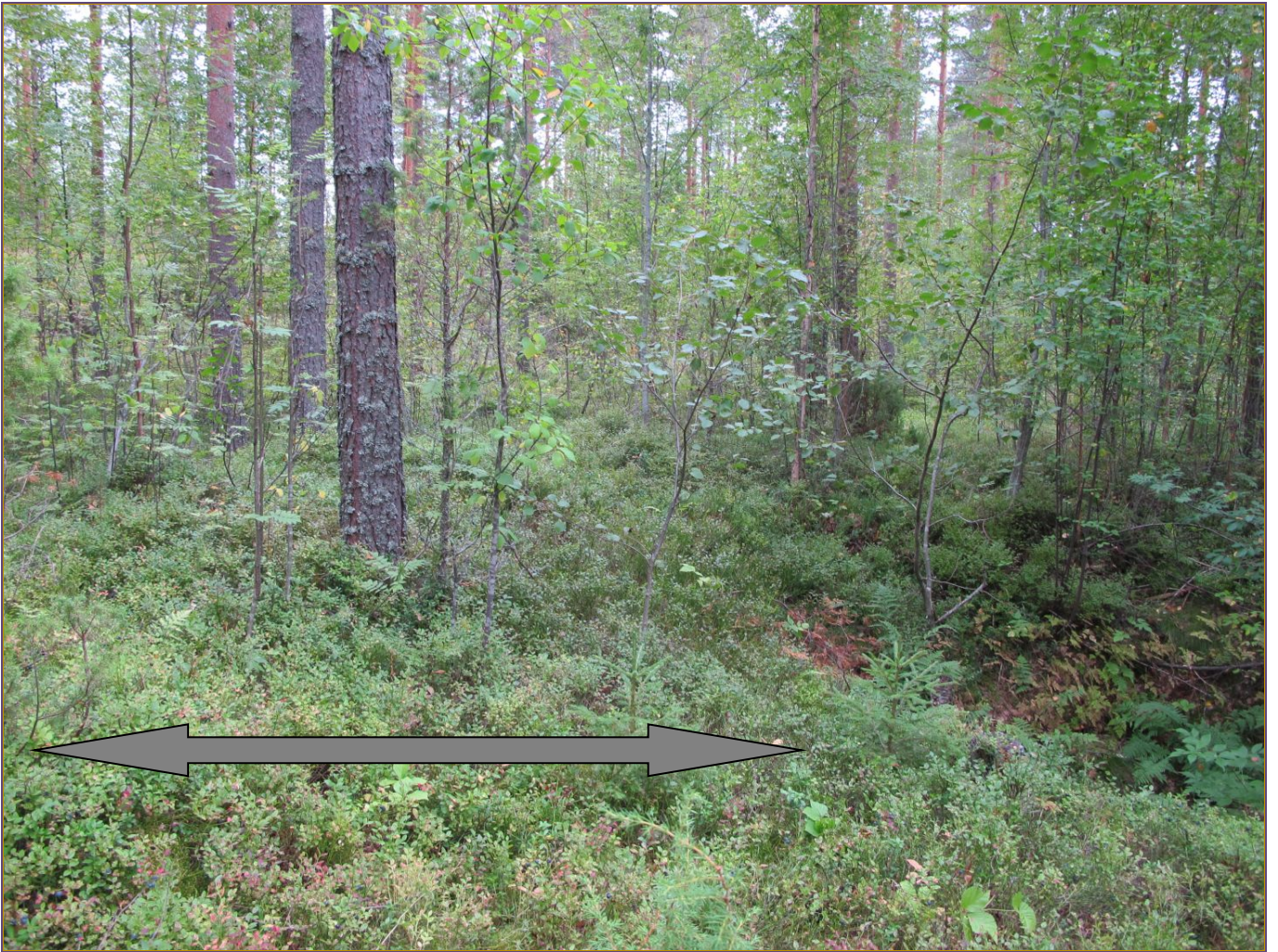
Kuva 5:Tervahaudan leveää "ympärysvallia". NW.