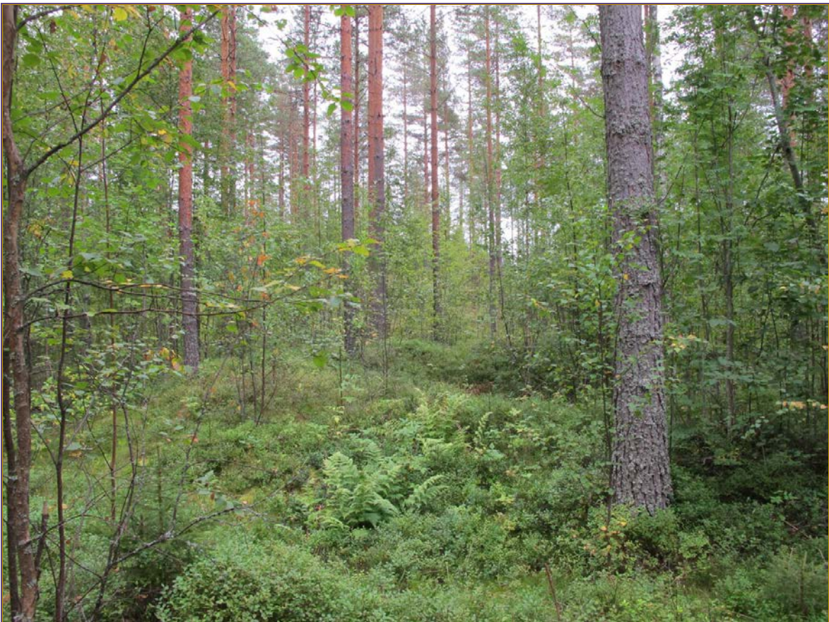
Kuva 2: Kohde suunnasta NW.