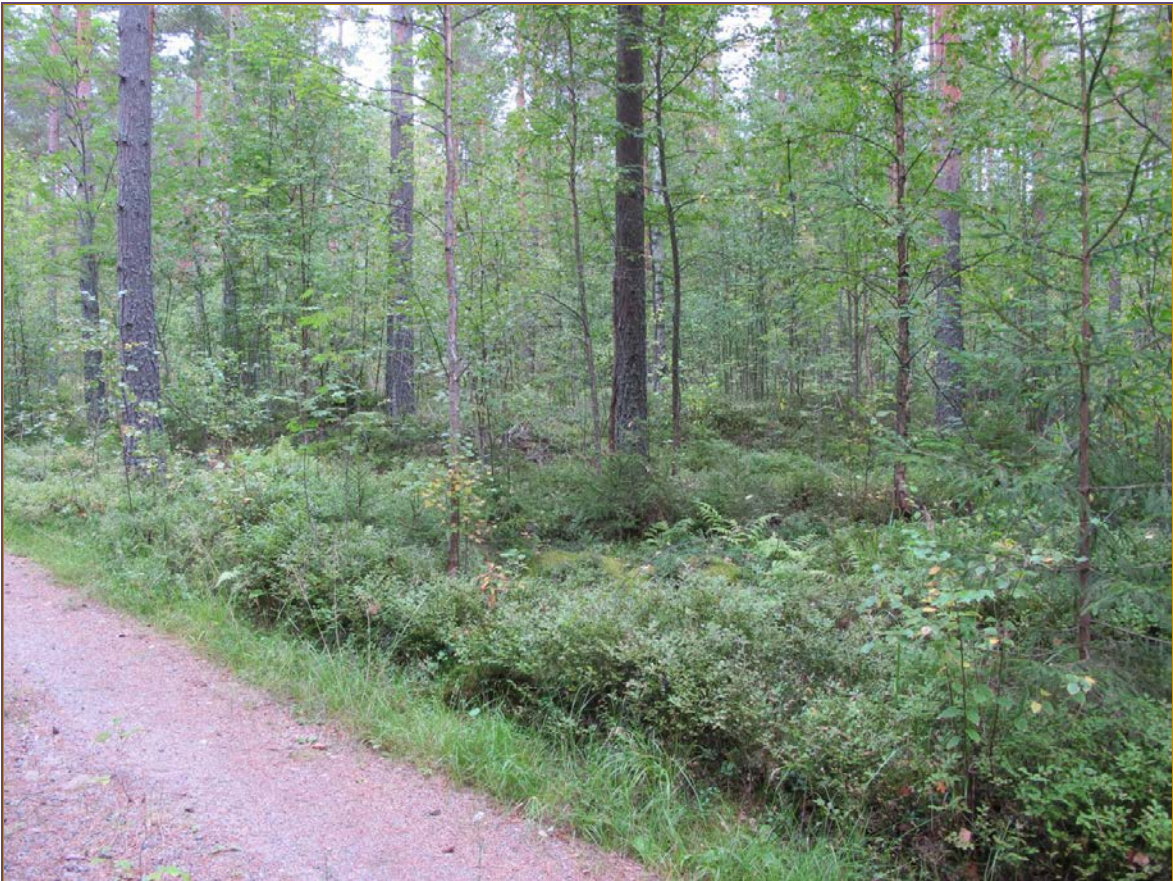
Kuva 1: Kohde suunnasta S.