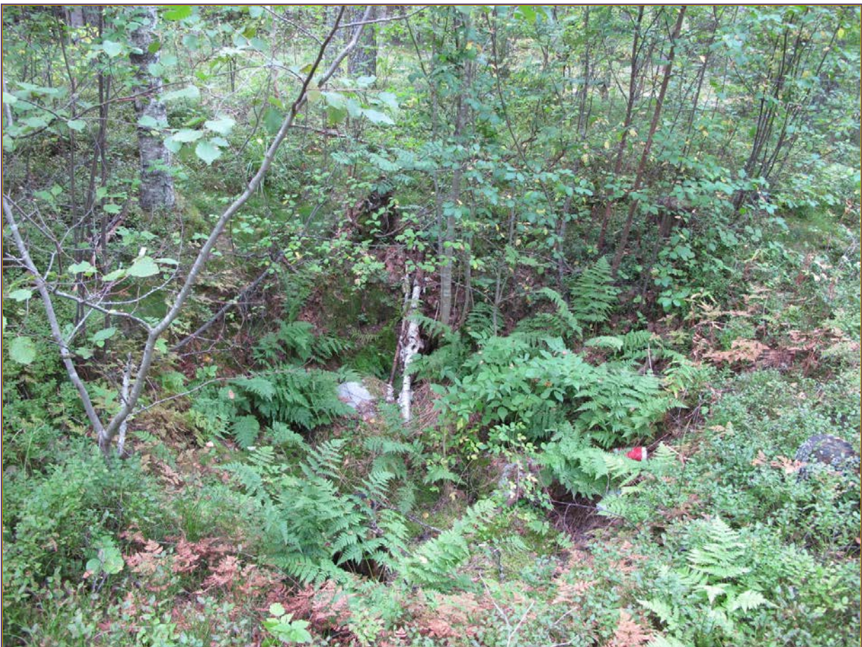
Kuva 4: Tervahaudan keskellä sijaitseva neliömäinen kuoppa, jota oli käytetty "kaatopaikkana". N.