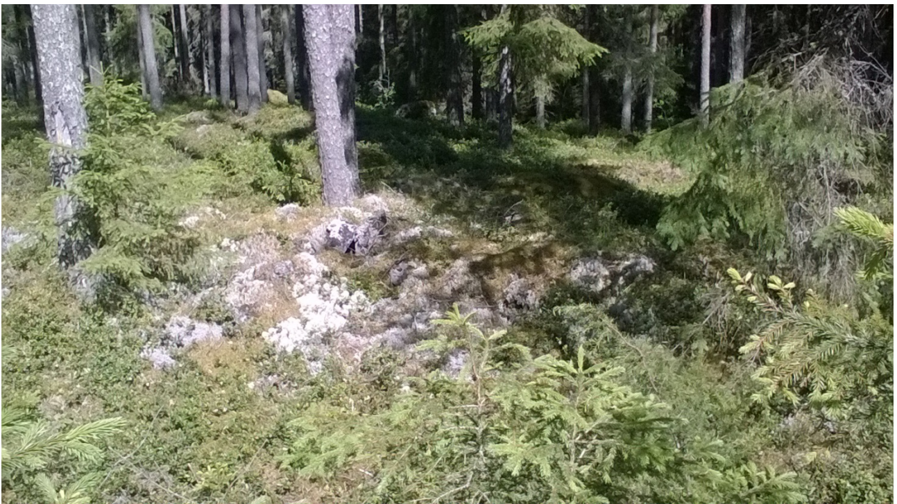
Isokallio 1 rökkiö lounaasta. Kuva Lauri Skantsi/K.H.Renlundin museo – Keski-Pohjanmaan maakuntamuseo

Rökkiö on läpimitaltaan n. 4x4m pyöreä ja voimakkaasti sammaloitunut, tasalakinen, ei kraateria keskellä. Sen vieressä on mahdollinen toinen rökkiö maakiven vieressä.