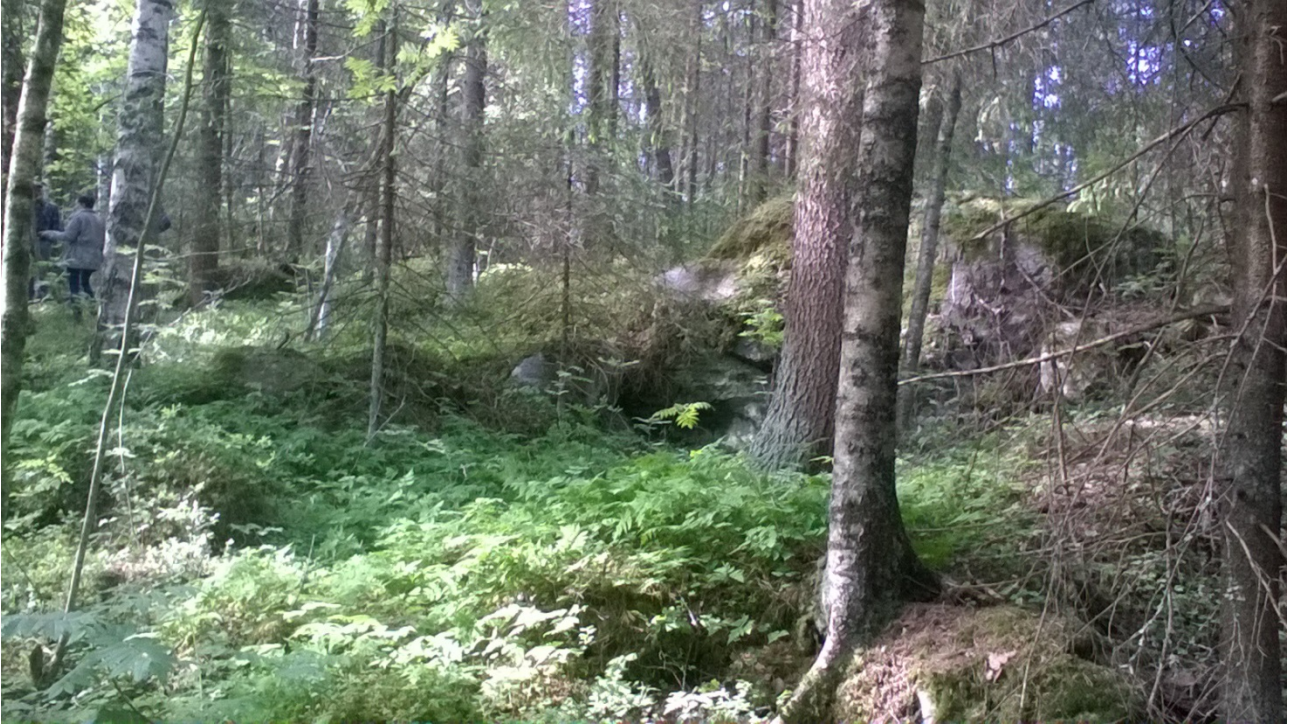
Hollanti 3.

Rakennuksen pohja, läpimitta n. 5x5m. Rakennettu ison maakiven reunaan, niin että kivi muodostaa ikään kuin rakennuksen peräseinän. Oviaukko on ollut vastakkaisella reunalla. Tästä noin 15m kaakkoon toisen samankokoisen rakennuksen pohjan jäänteitä.