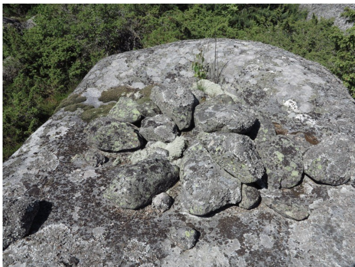
Kuva 3. Siirtolohkareelle nostettuja kiviä.

Hamskerille ovat ominaisia siirtolohkareet, joiden päälle on nostettu noin 10–30 kiveä pieneksi kasaksi tai hajanaiseksi rykelmäksi (kuva 3). Näitä siirtolohkareita merkitsin saarelta kaikkiaan 12. Rakenteiden merkitys on tuntematon.