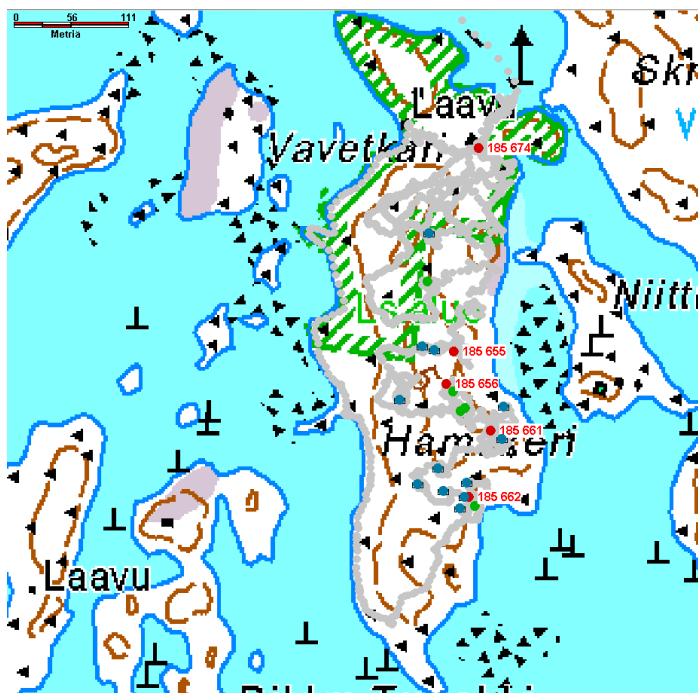
Kuva 2. Hamskerin arkeologiset kohteet (punaiset karttamerkit Reiska-numeroin), lohkareiden päälle nostetut kivet (siniset merkit), rakkakuopat, kivoikasat yms. anomaliaat (vihreät merkit) sekä kulkuloki (harmaa).