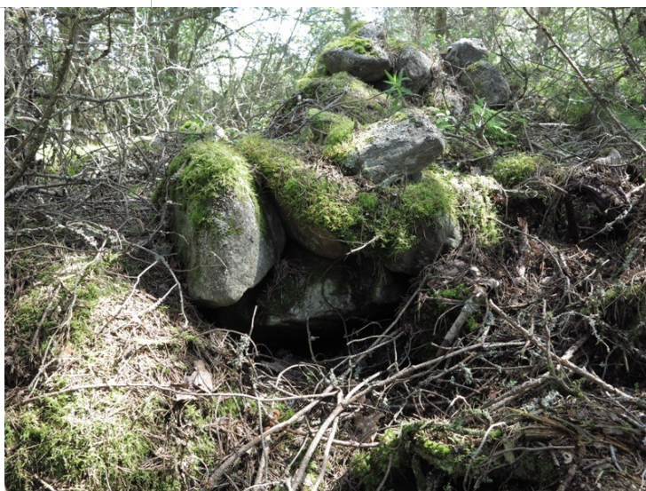
Kiviuunin tapainen jäännös muurin sisäpuolella.