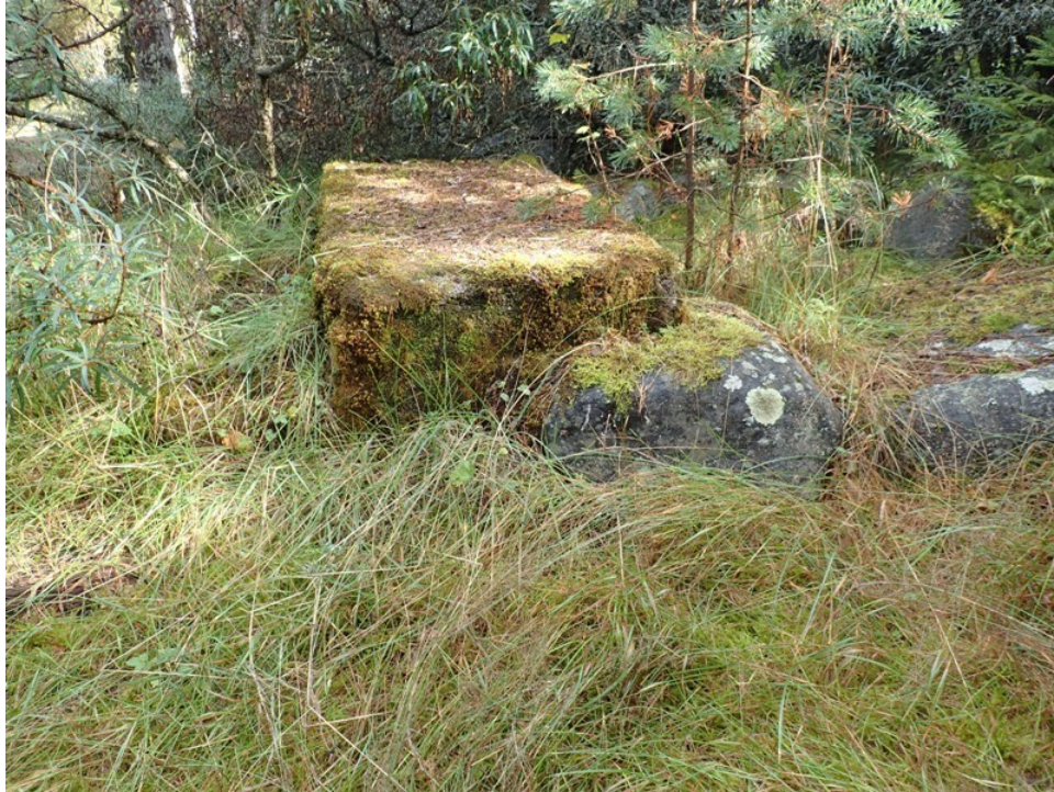
Portaat SW (valok. 25.8.2014).