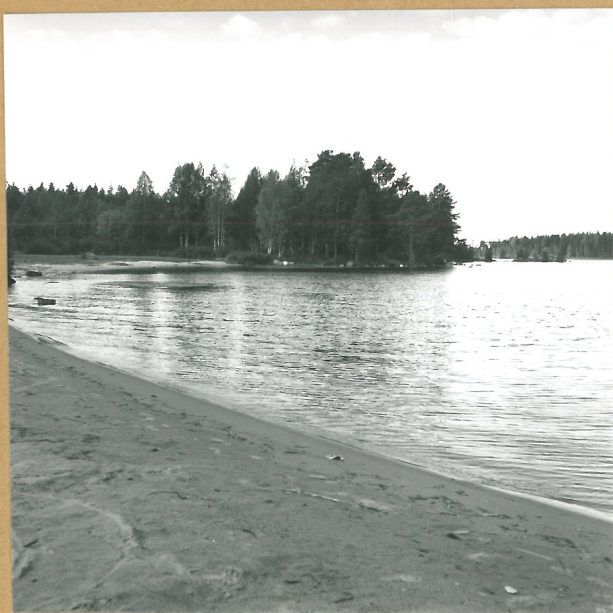
K.3. KAJAANI KESÄNIEMI UIMALA, IDÄSTÄ 59716