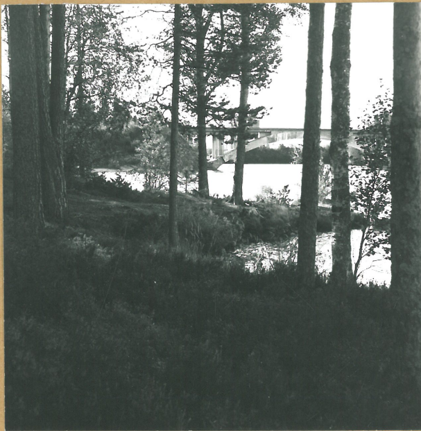
K.5. KAJAANI PYÖRRE 2, PÖHJÖISESTÄ 59727