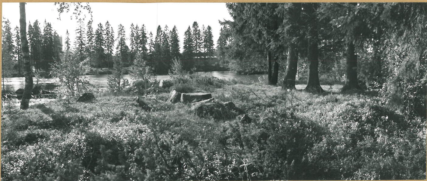
K.6. KAJAANI PYÖRRE 3, KOILLISESTÄ