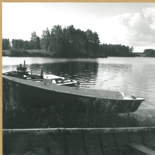
K.4. KAJAANI KÄTÖNLAHTI (PYÖRRE 1), 59726 LUOTTEESTA