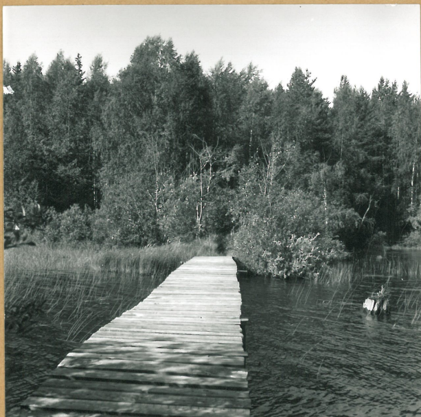
K.1. KAJAANI PETÄISENNISKA 2, IDÄSTÄ 59717