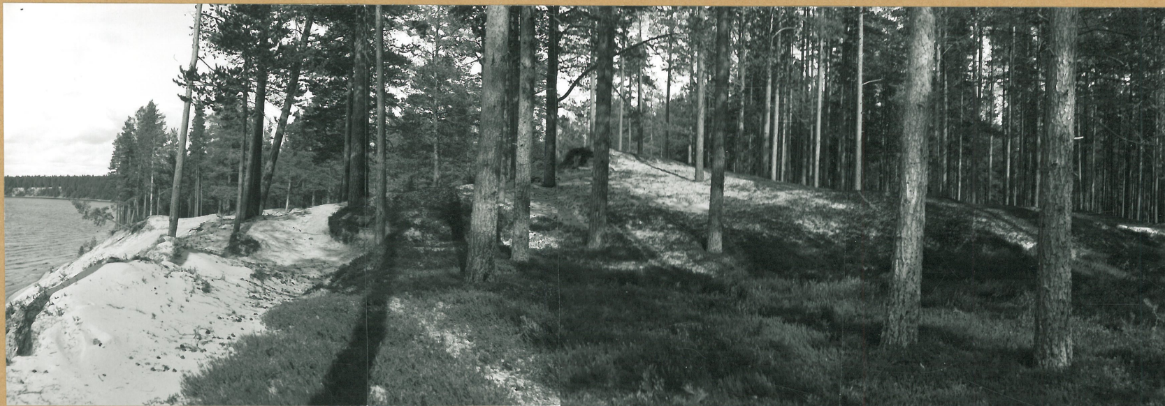
K.7. KAJAANI ÄRJÄNSAARI, PANORAAMA POROKIRKOSTA, KUV. IDÄSTÄ