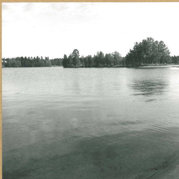
K.2. KAJAANI KESÄNIEMI UIMALA, 59715 POHJOISESTA