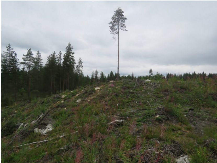
Moreenikumpare kuvattu kaakkoon

Lisäselvitys 2016: Alue on supra-akvaattista ja sijaitsee selvästi Muinais-Pielisen ja Pielisen jääjärven tason yläpuolella. Alueella ei voi olla muinaisia rantatörmäitä tai rantatasoja. Maaperä on tiivistä hietamoreenia, jossa on runsaasti isoja kiviä. Paikalla on pieni moreenikumpare. Moreenissa on melko paljon kvartsikappaleita, joista osa on äestyksessä murskautunut teräväksi palasiksi. Koekuopissa ja maan pinnassa ei havaittu mitään kivikautiseen asuinpaikkaan viittaavaa.