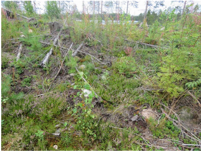
Painauma ('asumuspainanne') kuvattu pohjoiseen järvelle päin.