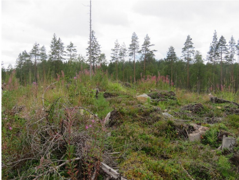
Alue tulisijan S 3 koordinaattien kohdalla.

Tulisijoja Saarijärvi S 2 ja S 3 ei havaittu tiheän aluskasvillisuuden takia.