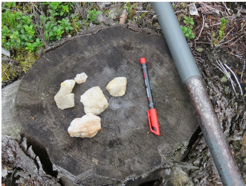
Äestysurista löydettyjä luonnollisia kvartseja.