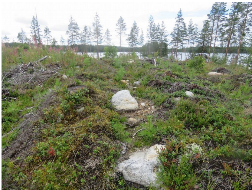
Painauma kuvattu länteen. Äestysurissa näkyy isoja kiviä ja kvartsikappaleita.