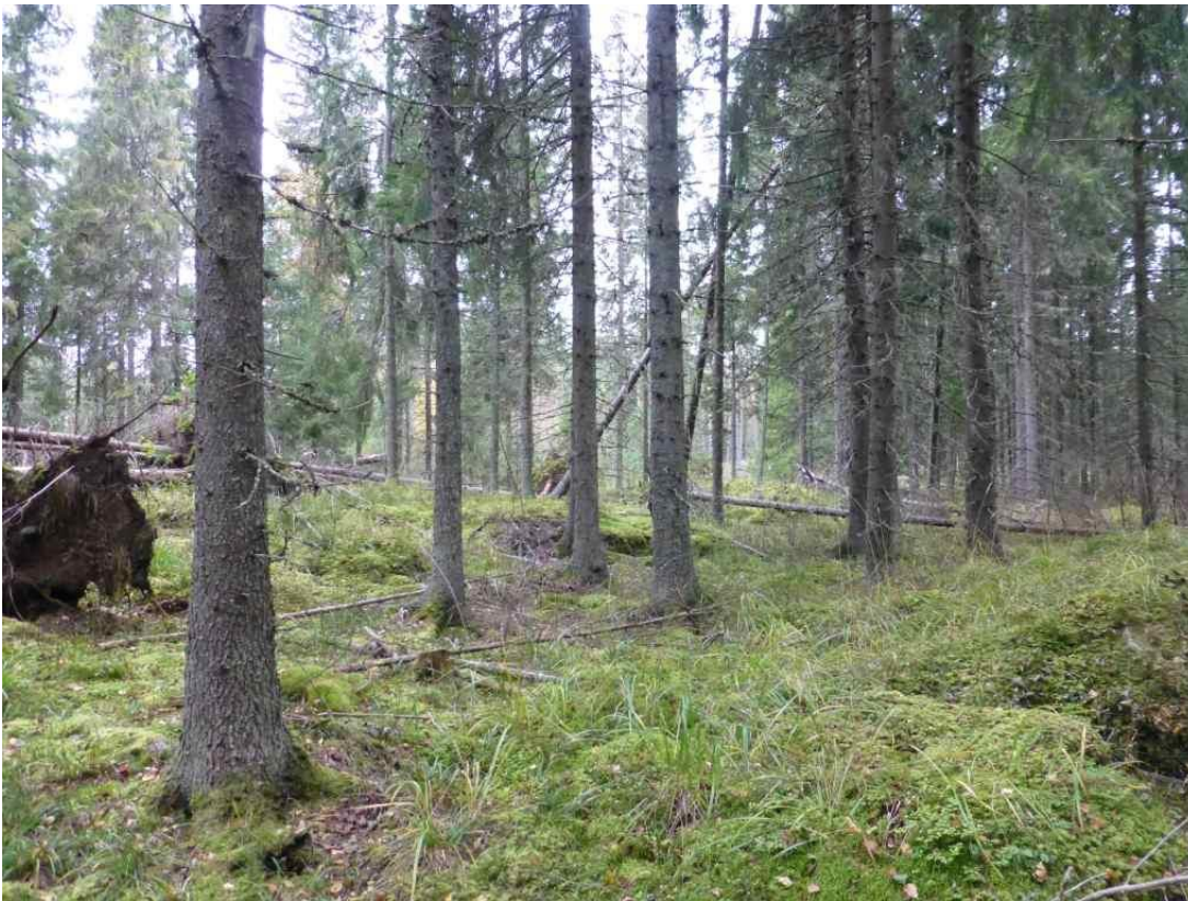
Louhos, oikeassa reunassa jätekivikasoista muodostuvaa vallia