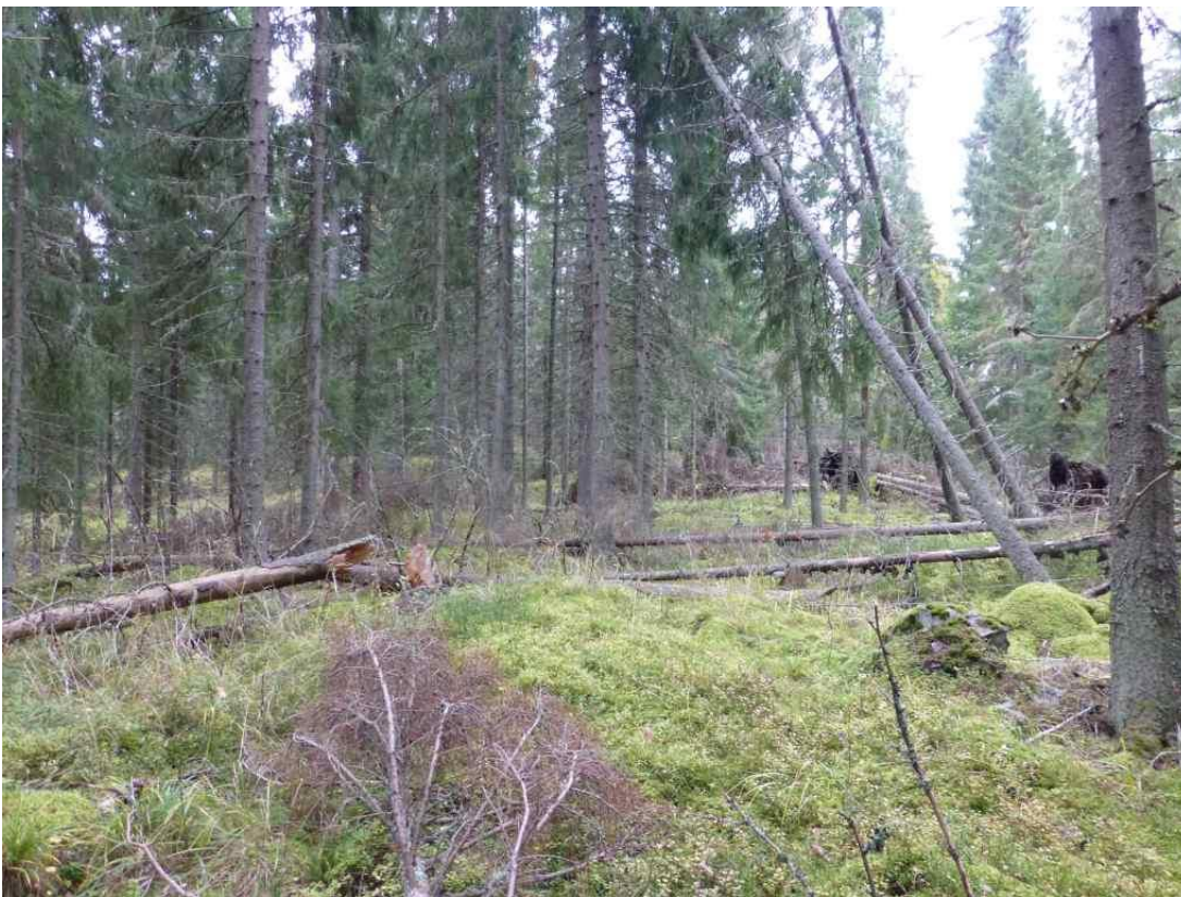
Louhoksen aluetta oikealla, suoraan edessä jätekivikasa