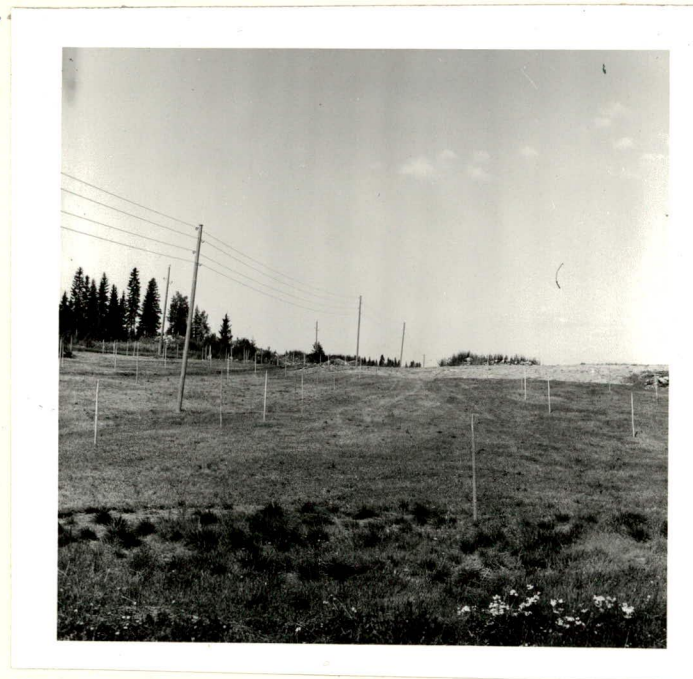
Honkakosken asuinpiikha (KM 18025), kvarterit vasemasta hiekkapellosta, kivi- asetit hainäpellosta sen alapuolelta, kuvattu lounaasta.