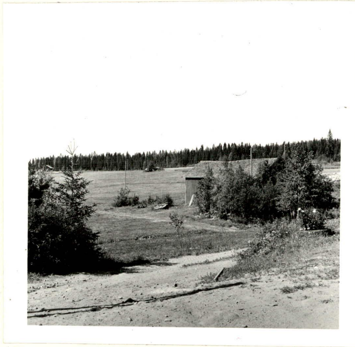
Honkakosken kivikautionen asuinpiikha puimalan takana ja kuvan oikeassa reunassa näkyvällä hiekkapellolla, kuvattu kaakosta.