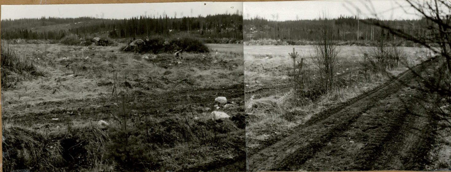
VÄLIPURON TALON VIEVÄN TIEN ITÄPUOLELLA OLEVA PELTO. KUVATTU PÖHJOISLUOTEESTA. KVARTSIT KUVAN KESKIVAIHEILTA.