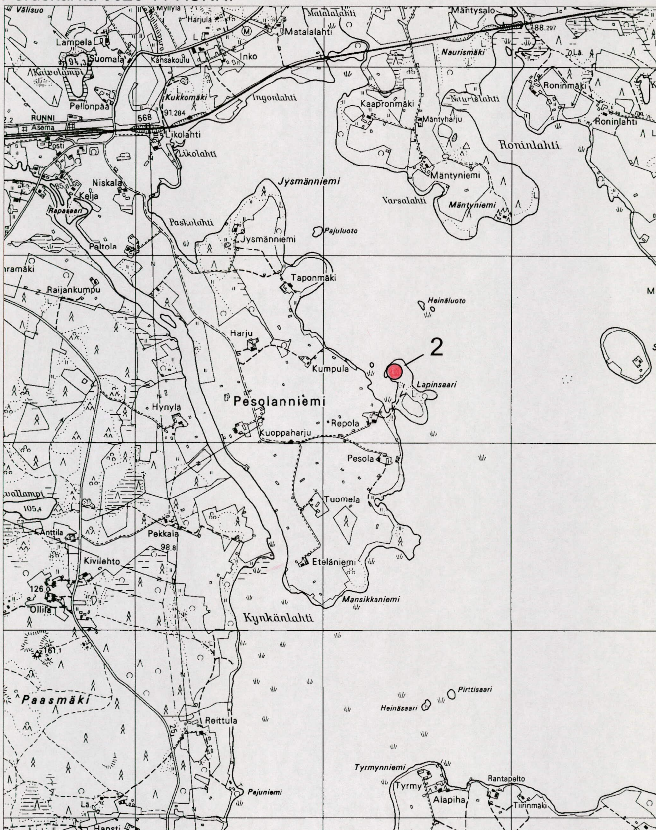
lialalmi 2 Lapinsaari