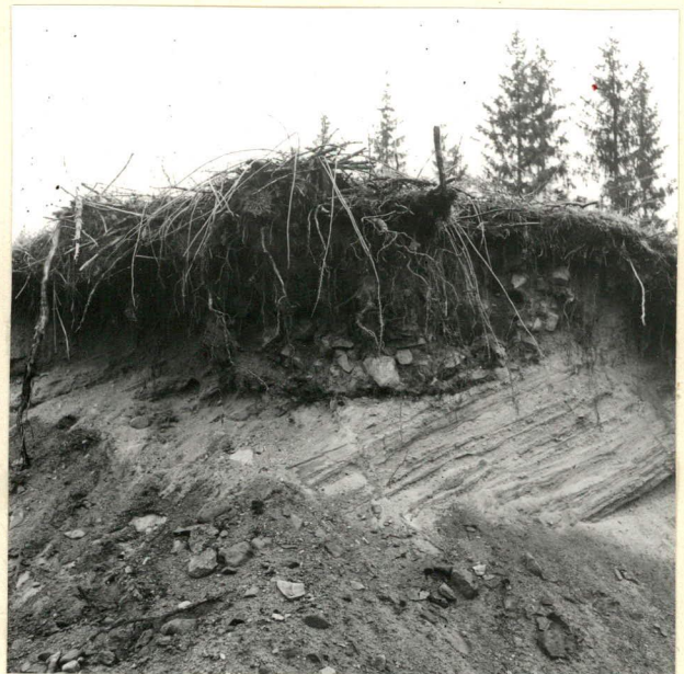
KUVA 3 LIESI HIEKKAKUOPAN REUNASSA