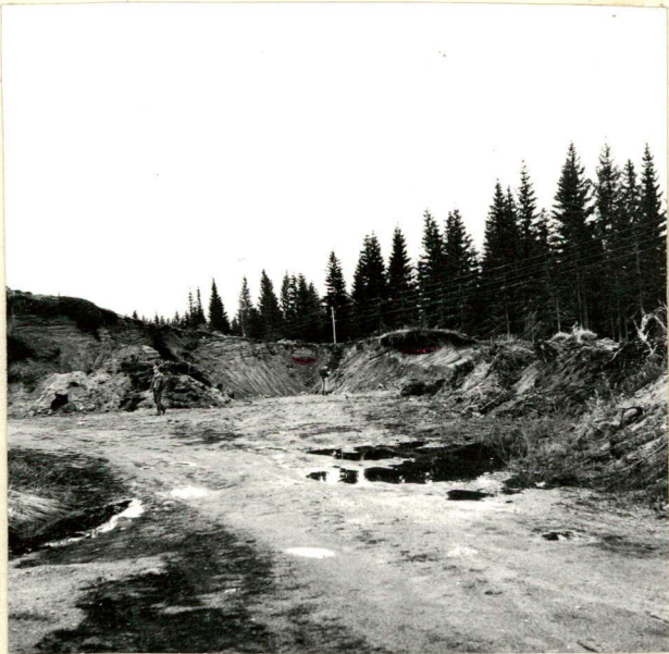
KUVA 2. HIEKKAKUOPPA IDÄSTÄ. LIESIÄ NÄKY- VISSÄ