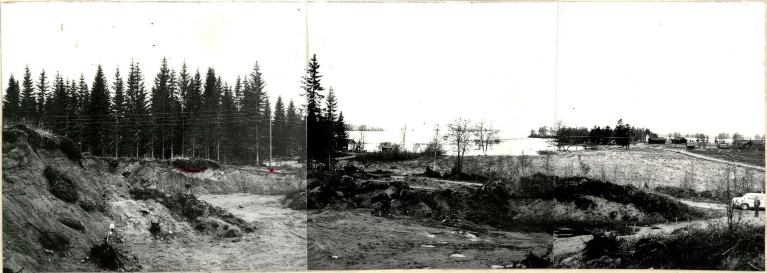
KUVA 1. PANORAAMA HIEKKAKUOPAN KAAKKOISKULMALTA, TAUSTALLA HAAPAJÄRVI JA HAAPANIEMI, KERAMIURKA KM18565 LÖYTÄNYT KUOPAN LÄNSIREUNALTA, KUVAN VASEMMASSA OSASSA NÄKYVÄN PUHELINPYLVÄÄN SUUNNASTA. TARKASTUKSEN YHTYEVDESSÄ LÖYTOJÄ PITKIN LÄNSIREUNAA. PROFILISSA EROTTUU LIESIÄ.