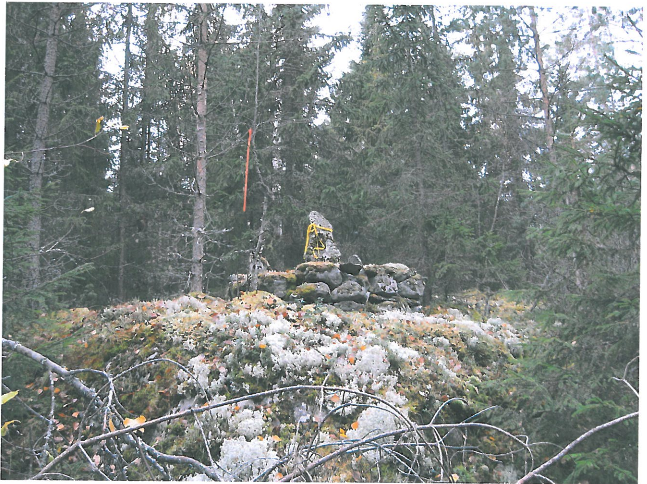
Kuva 1. Rajakivi kallioreunalla.