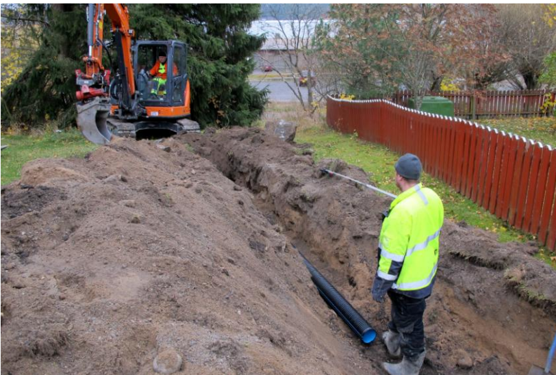
Kuva 6. Oja 2 madaltui mitä alemmas rinteeseen edettiin.

Oja 2 (kuvat 6-9) kaivettiin kahden rivitalon väliin. Rivitalo 1:n kulmaan oli jo aiemmin tehty erilaisia kunnallisteknisiä kaivantoja (mm. viemäri- ja kaukolämpölinja), joiden yhteydessä paikalle on ilmeisesti tuotu runsaasti hiekkaa. Tämä hiekkakerros vaikeutti jonkin verran havaintojen tekoa, koska hiekkaa valui kaivamisen aikana ojan reunoilta kaivannon seinämiin.