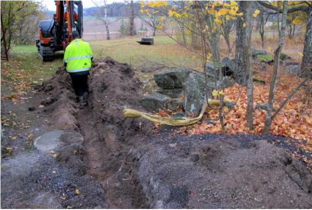
Kuva 3. Vasemmalla alhaalla jo aiemmin kaivettu kaivo.