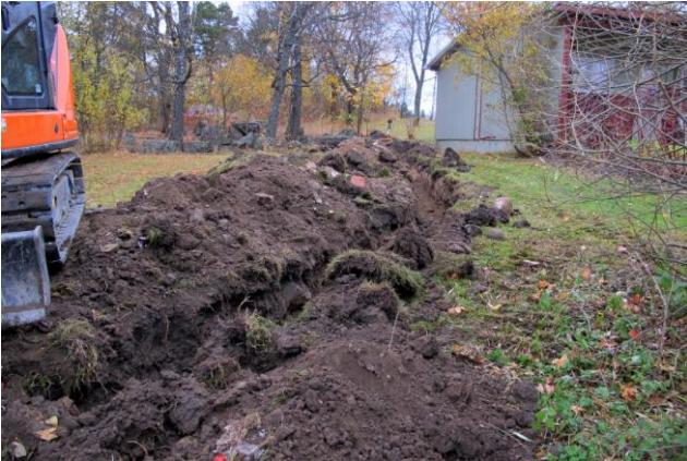
Kuva 5. Jokunen yksittäinen tiilenkappale pilkistää maakasoista.