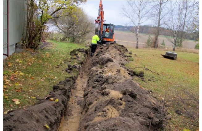
Kuva 4. Rivitalon päädystä esiin tuli muuraushiekkaa.