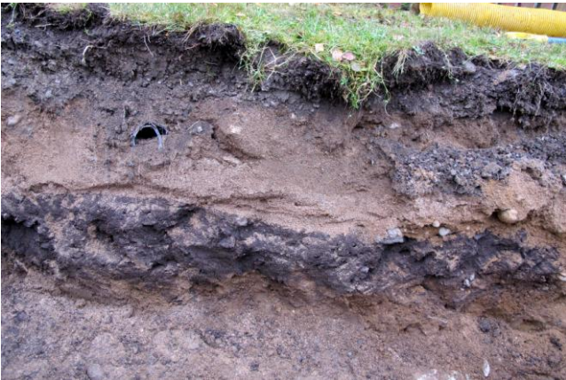
Kuva 9. Ojan 2 kulttuurikerrosta.

Kaivettaessa ojaa rinnettä alaspäin kaivussyvyys jäi matalammaksi, joten selvyttä siihen, mihin asti kulttuurikerros jatkui, ei saatu. Vaikutelmaksi jäi, että havaitulla kulttuurikerroksella on jo jonkin verran ikää. Onko kysymyksessä esim. mahdollinen tunkio tai navetan pohja?