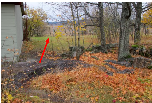
Kuva 2. Oja 1 kaivettiin rivitalon ja kivijalan välistä.

Kaivetun ojan syvyys oli noin 50-60 cm nykyisestä maanpinnasta. Talon päädyssä ojasta tuli esiin runsaasti muuraushiekkaa, joka lienee todennäköisesti peräisin rivitalon rakentamisen ajalta. Ei havaintoja kulttuurimaasta tai -kerroksista. Mahdolliset kulttuurikerrokset ovat joko tuhoutuneet rivitalon rakentamisen yhteydessä tai jos kulttuurikerrosta on vielä jäljellä, niin se on syvemmillä kuin mihin nyt kaivettiin.