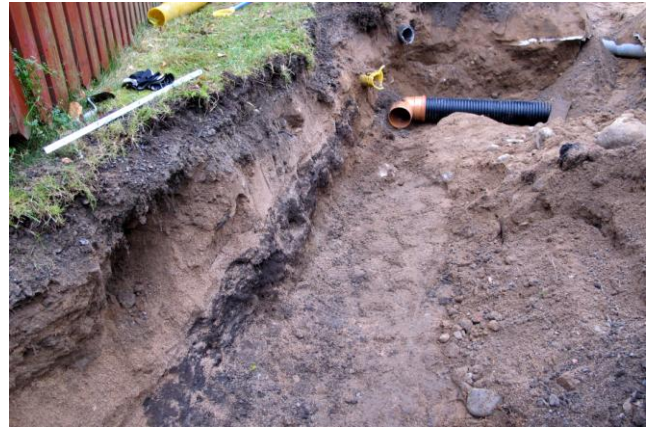
Kuva 8. Oikealla ylhäällä näkyy vanhoja putkilinjoja sekä uusi nyt asennettu sadevesiviemäriputki.