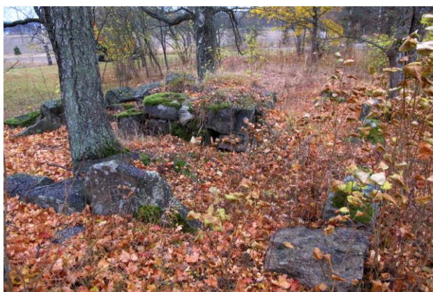
Kuva 1. Kivijalka.

Oja 1 (kuvat 1-5) kaivettiin rivitalon päädyssä olevan kivijalan viereen. Talon nurkalle oli jo joskus aiemmin asennettu kaivo.