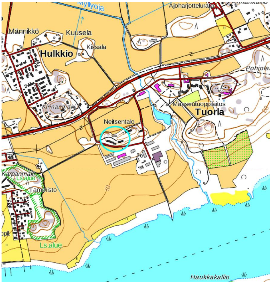
Liitekarta 2. Varsinais-Suomen maakuntamuseon lausunnossaan valvottaviksi edellyttämät alueet.

Kohde on merkitty karttaan turkoosilla ympyrällä.