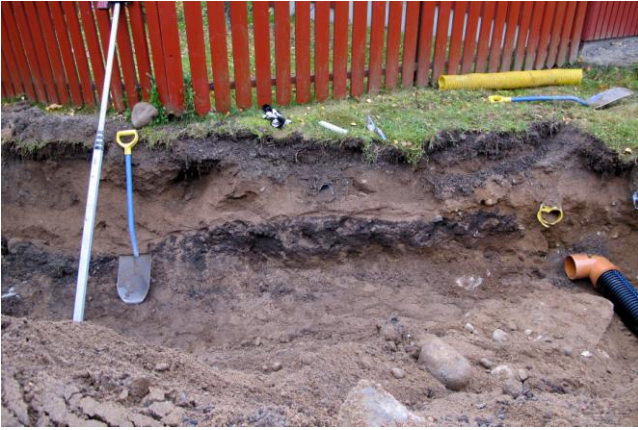
Kuva 7. Ojan 2 kulttuurikerrosta.