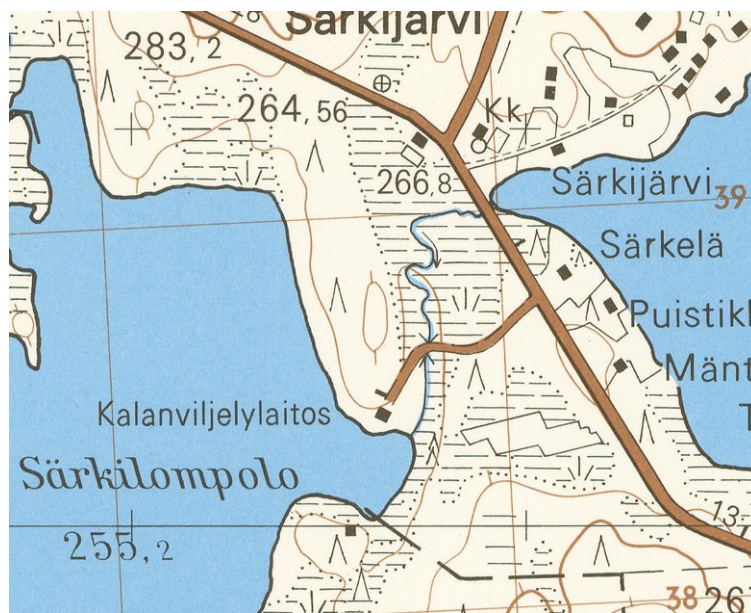
Ote vuoden 1968 topografisesta kartasta. Kartassa näkyy Lohirannantie, joka ylittää nykyisen Välijoen ja Kalanviljelylaitoksen rakennuksia.