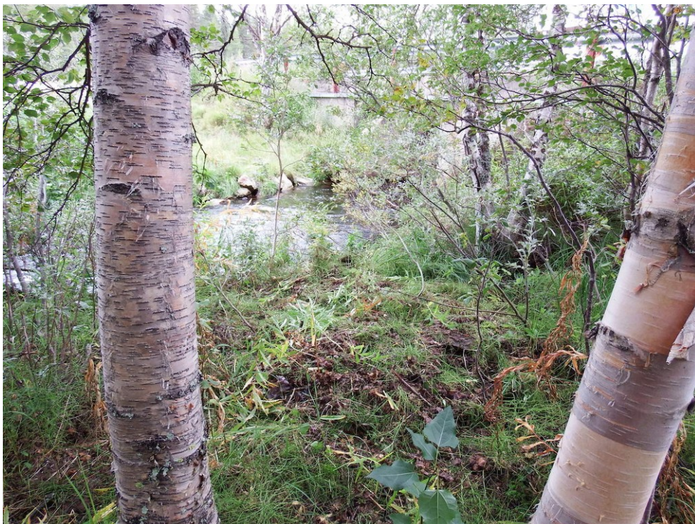
Kuva 6. Joen idän puoleisella rannalla oli kivi- ja maakumpuja. Kuvassa matala kivi-/maakumpu, jonka päältä on raivattu jonkin verran pintakasvillisuutta. Kuvattu pohjoisluoteeseen.