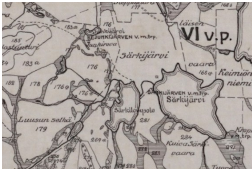
Ote vuoden 1923 Muonion hoitoalueen kartasta. Alueella ei ollut vielä teitä. Särkilompolan rantaan johtaa polku Muoniosta.

Kohteen lähistöllä ei ole historiallisia kiinteitä muinaisjäännöksiä. Lähimmät historialliset muinaisjäännökset ovat Särkijärven läheisyydessä oleva Keskisensaari (498010042) historiallinen asuinpaikka 3 kilometriä itäkaakkoon kohteelta ja Särkijärven rannalla oleva Passisenkenttä (498010041) historiallinen asuinpaikka 3 kilometriä itään kohteelta.