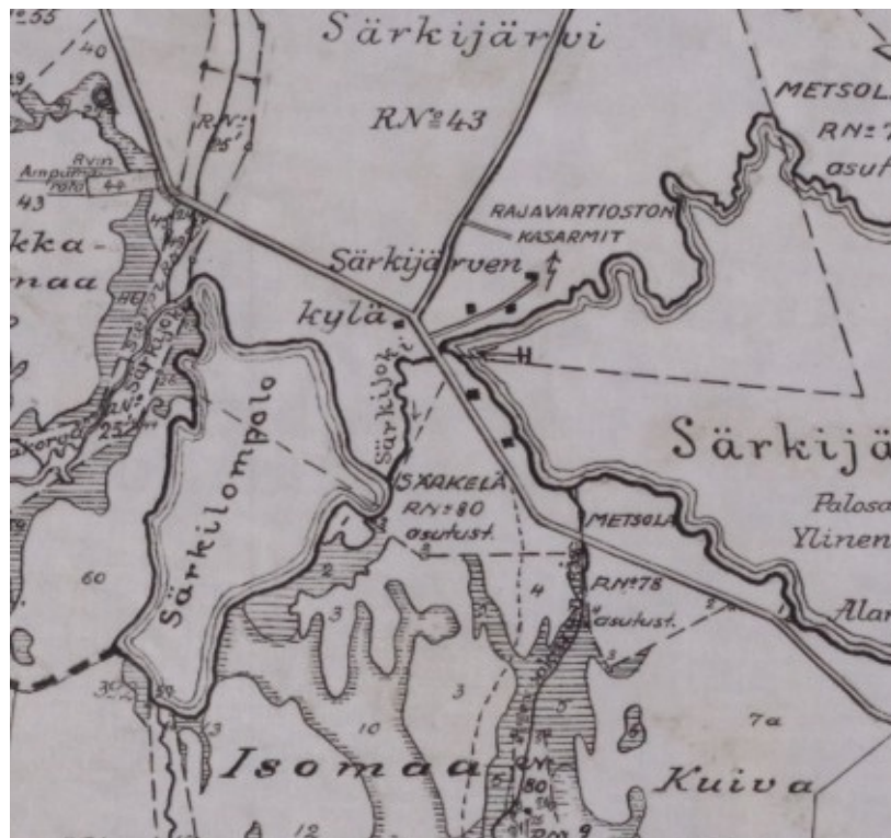
Ote vuoden 1951 Muonion hoitoalueen talouskartasta. Nykyinen Välijoki on kartassa Särkijoki nimellä.