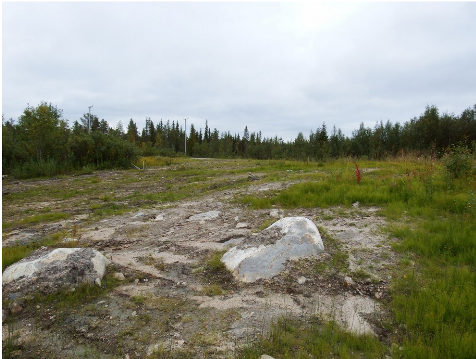
Kuva 9. Lohirannantien pohjoispuolella ja joesta itään on hieman korkeampi maa-alue, joka on todennäköisesti keinotekoinen. Kuvattu Tietä kohti kaakkoon.