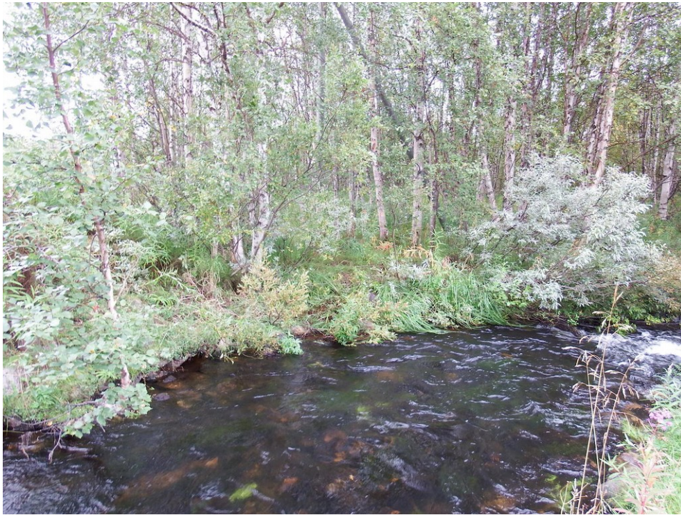
Kuva 3. Välijoen itärantaa kuvattuna lännestä. Rannat ovat alavat ja niillä kasvaa koivua, pajua ja kastikkaa.