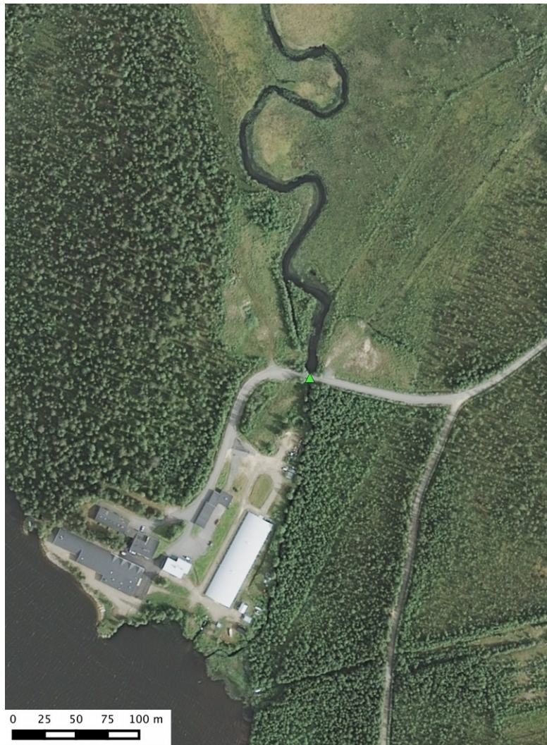
Kartta 2. Ortoilmakuva inventointialueesta ja kohteen sijainti vihreällä kolmiolla.