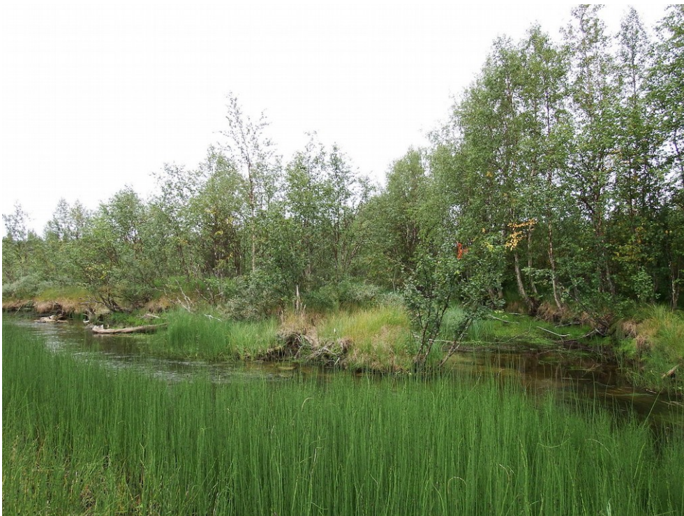
Kuva 8. Välijoen mutkaan on jossain vaiheessa kaivettu kanava oikaisemaan virtausta. Nyt kanava on tukkeutunut kasvillisuudesta ja liejusta. Kuvattu etelään.