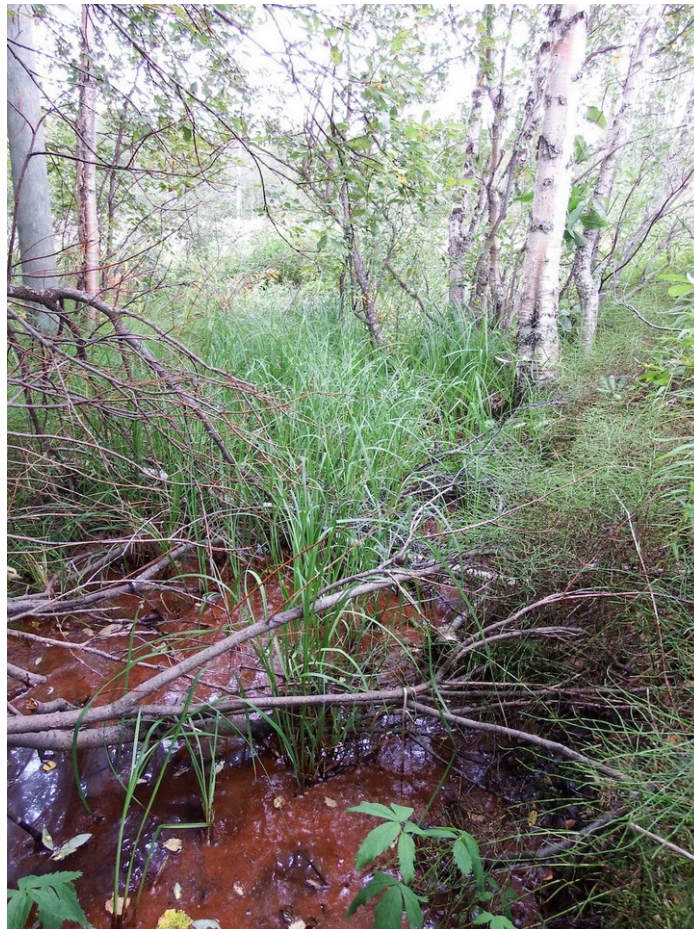
Kuva 4. Välijoen itärannalle tien suuntaisesti on kaivettu oja, joka on umpeutunut kasvillisuudesta ja liejusta.