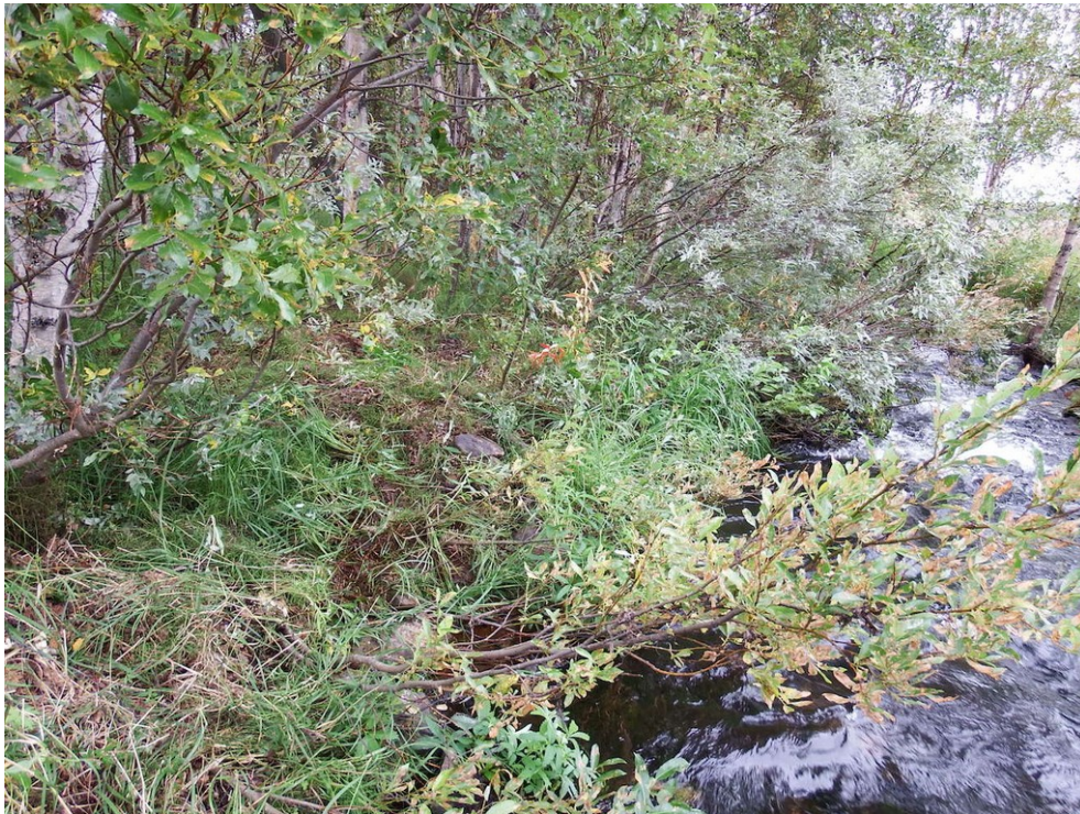
Kuva 5. Välijoen itäpuolen rannalla kasvaa koivua ja pajua.