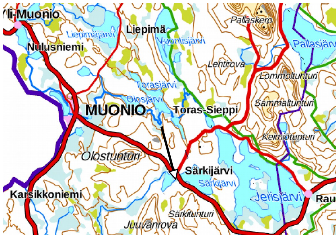
Kartta 1. Inventointialueen sijainti osoitetaan kartassa nuolella. Maanmittauslaitoksen maastokarttarasteri 1: 500 000, 8/2016.