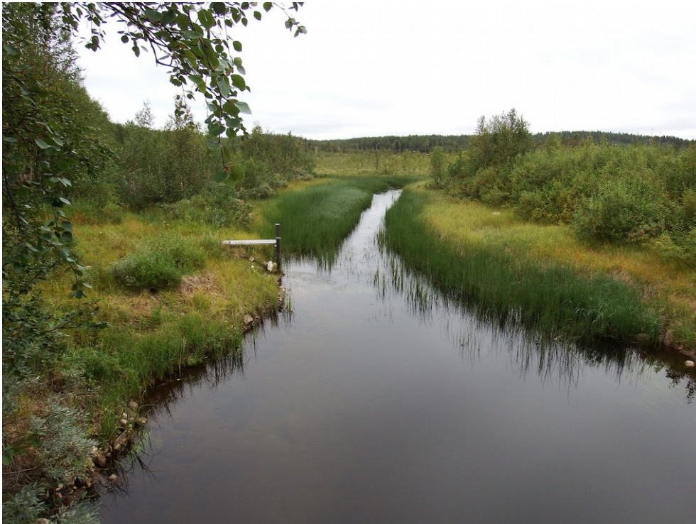
Kuva 7. Välijokea kuvattuna pohjoiseen Lohirannantien sillalta. Joessa ja rannoilla kasvaa paljon kortetta. Oikealla myös paljon pajua. Rannat ovat alavat paitsi kuvasta katsoen oikealla, jossa rannat ovat hieman jyrkemmät.