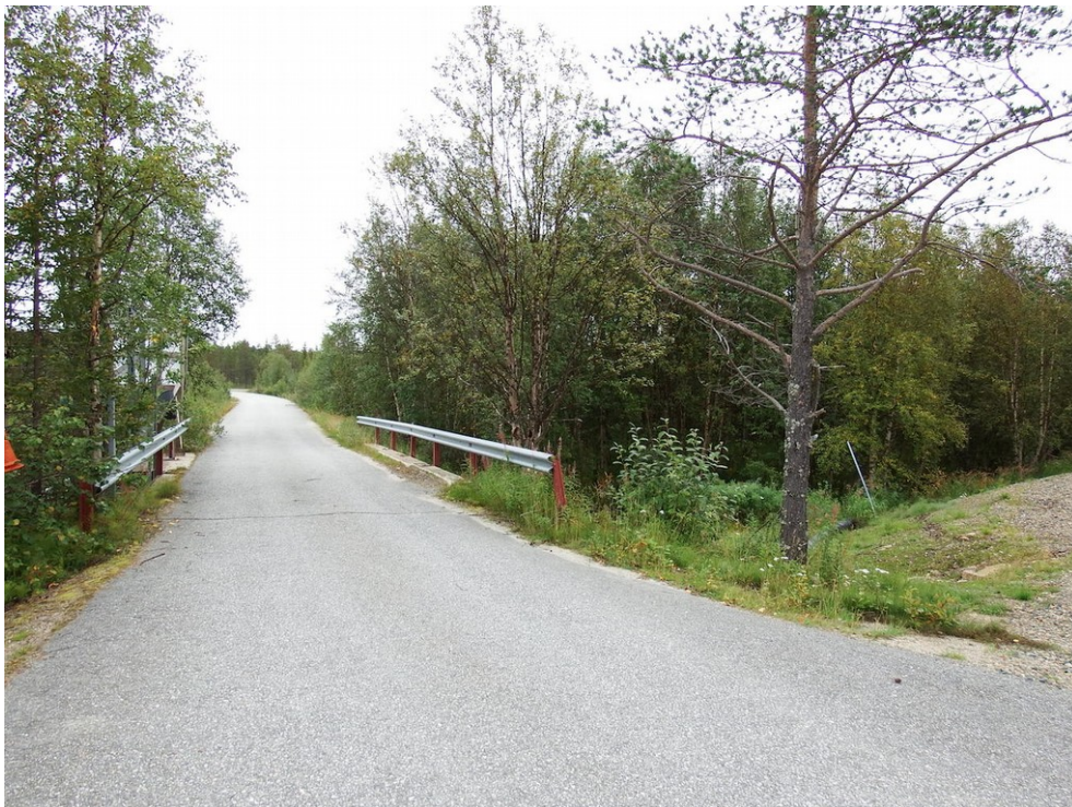
Kuva 2. Lohirannantien silta kuvattuna lännestä.