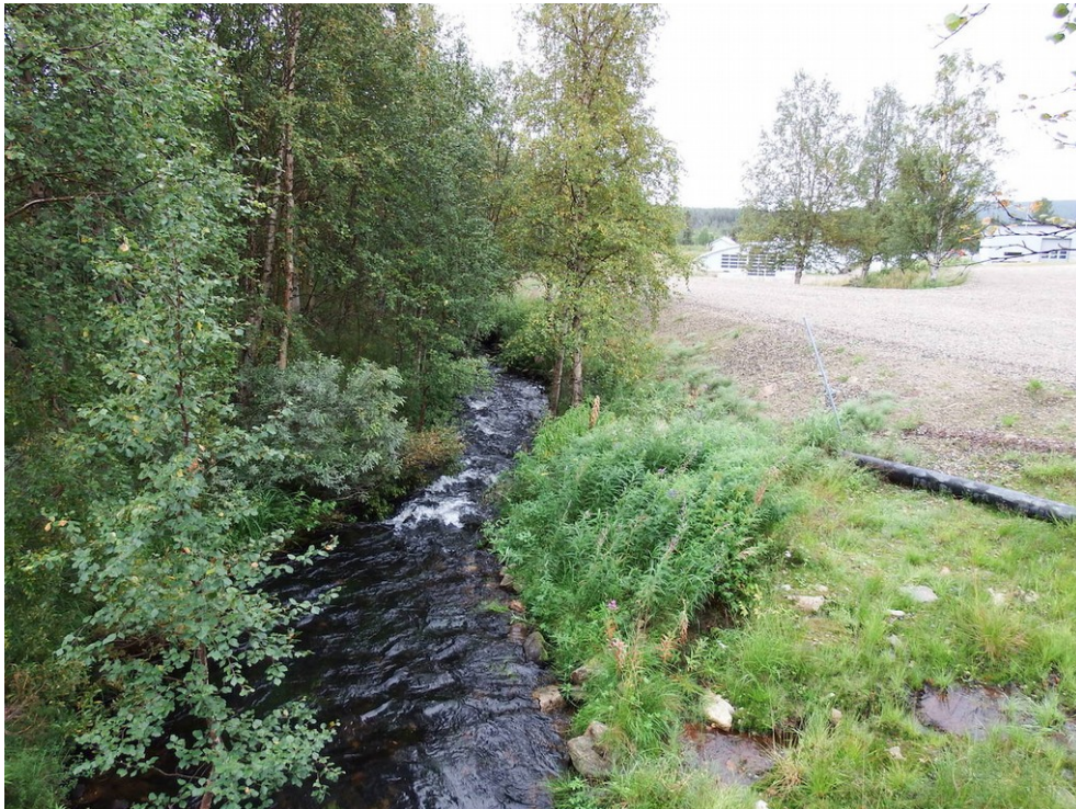
Kuva 1. Välijokea kuvattuna sillalta etelään. Oikealla näkyy sorakenttä ja sen takana kalanviljelylaitoksen rakennuksia.