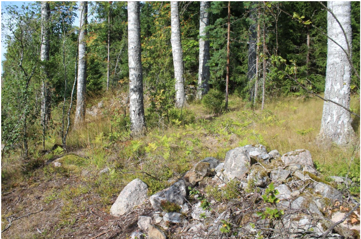
Etualalla röykkiö B, koivujen takana näkyy myös röykkiö A. Kuvattu länteen.