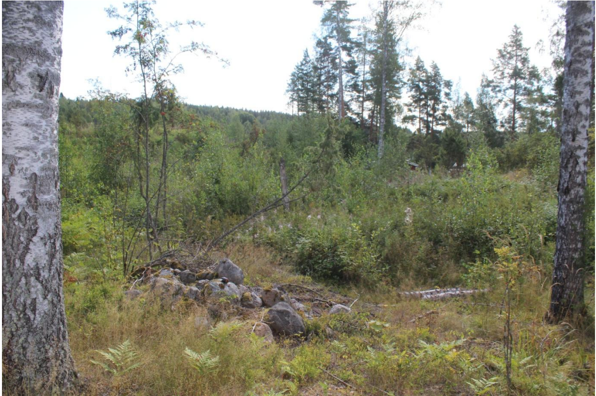
Röykkiö B kuvattu itään. Röykkiön takana kasvaa vesakko, missä maasto on louhikkoista. Horisontissa näkyvä metsänraja on Riihilahteen laskevan jokiuoman vastarannalla.