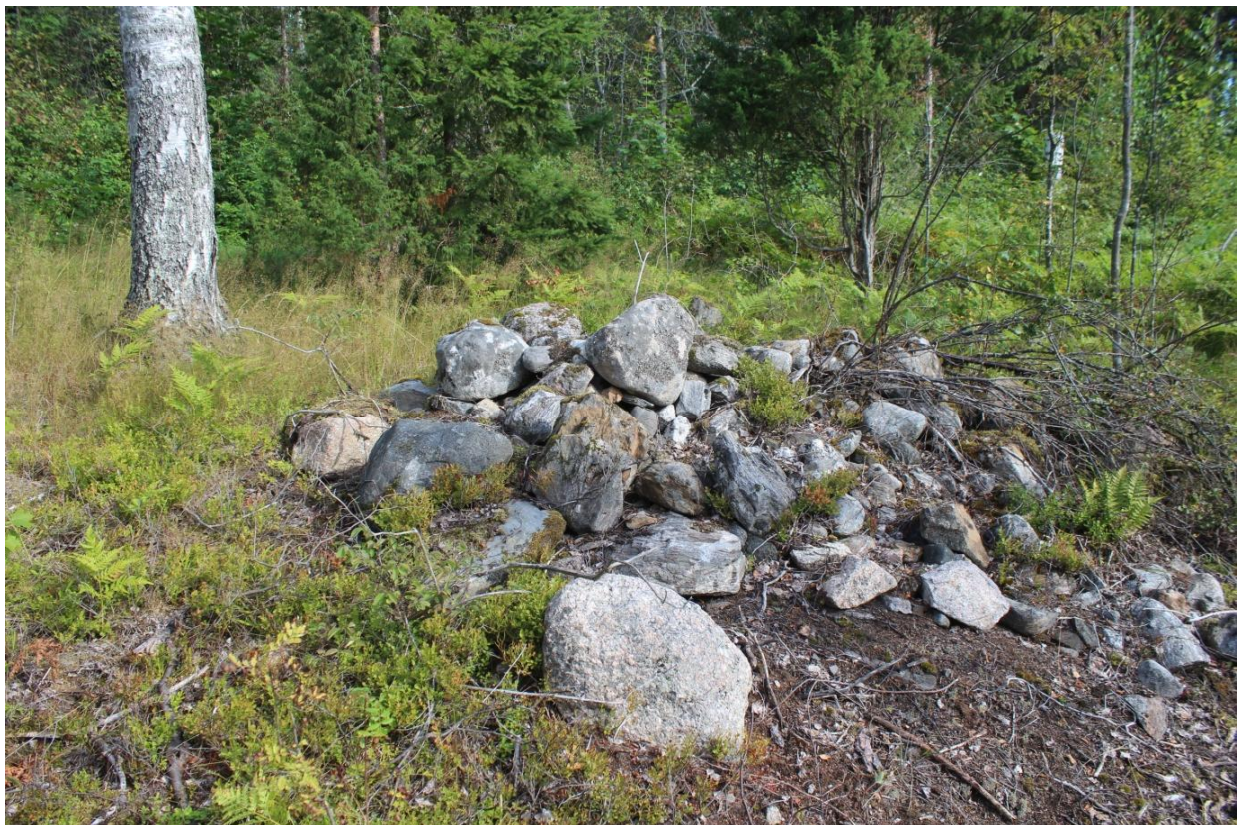
Röykkiö B kuvattuna pohjoiseen. Röykkiön vasen laita on tuhoutunut metsänhoidollisten toimenpiteiden yhteydessä.