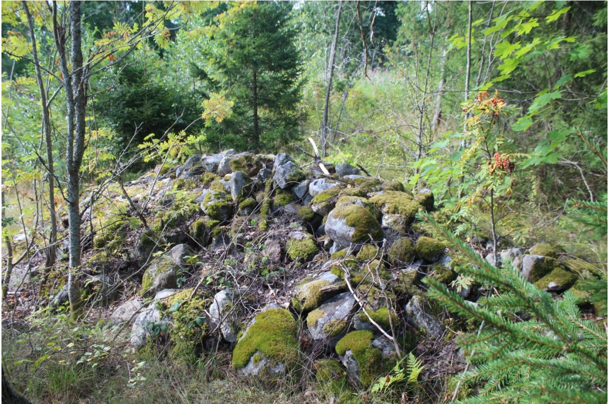
Röykkiö A kuvattuna etelään. Kuvasta näkee selvästi pitkulaisen röykkiön keskellä olevan harjanteen.