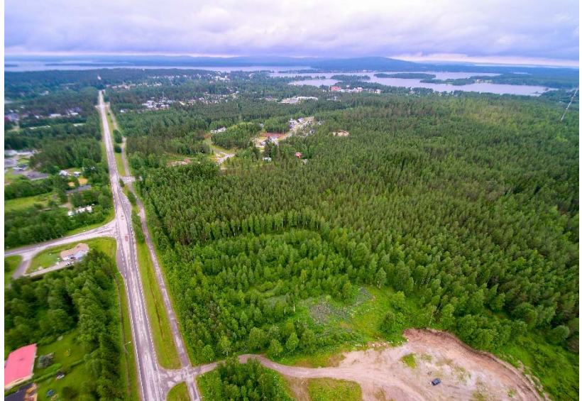
Inventointialueen eteläosaa kuvattuna sen itälaidalta lounaaseen, kohti kirkonkylää. Kuvauskopterin kuva. (AKDG4810:1)

Koko Sotkamon kunnan alueella on tehty muinaisjäännösinventointeja muutamaan otteeseen. Selvää mainintaa ei ole siitä, että Nivun alueella olisi inventoitu. Vuosina 1957–58 Martti Linkola Muinaistieteellisestä toimikunnasta (nykyisin Museovirasto) teki ensimmäisen laajan systemaattisen muinaisjäännösinventoinnin Sotkamossa. Vuonna 1981 Sotkamo inventoivat Matti Huurre ja Eeva-Liisa Nieminen Museovirastosta sekä vuosina 1991–1993 Vesa Laulumaa ja Esa Suominen Kainuun museosta.