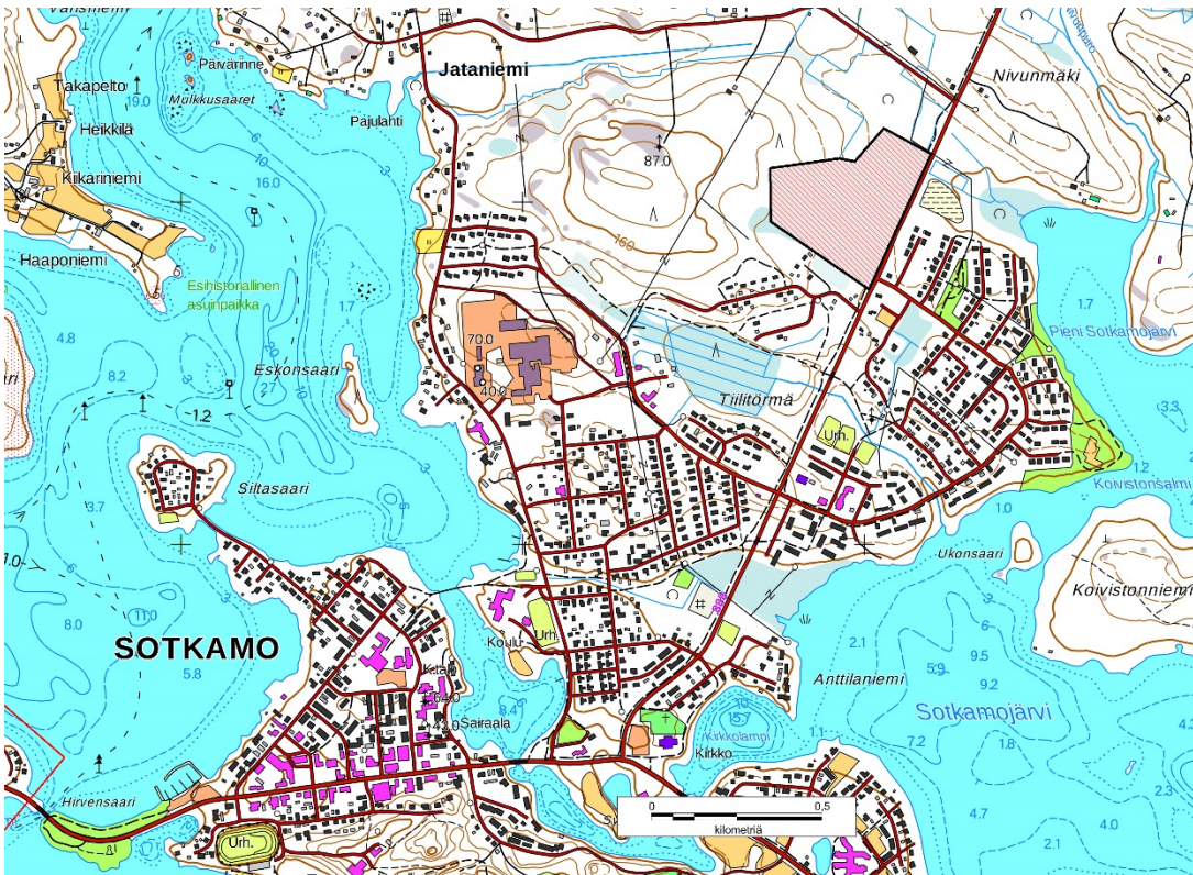
Nivun teollisuusalueen asemakaava-alue.