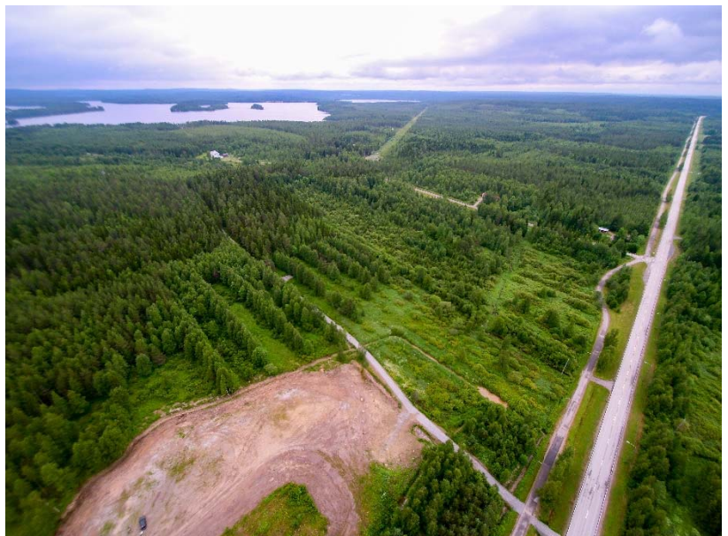
Inventointialueen pohjoisosaa kuvattuna sen itälaidalta luoteeseen. Kuvauskopterin kuva. AKDG4810:3.

Historiallisia karttoja inventointialueelta on vähän ja ne esittävät yleensä laajaa aluetta maakunnallisesti ja ovat