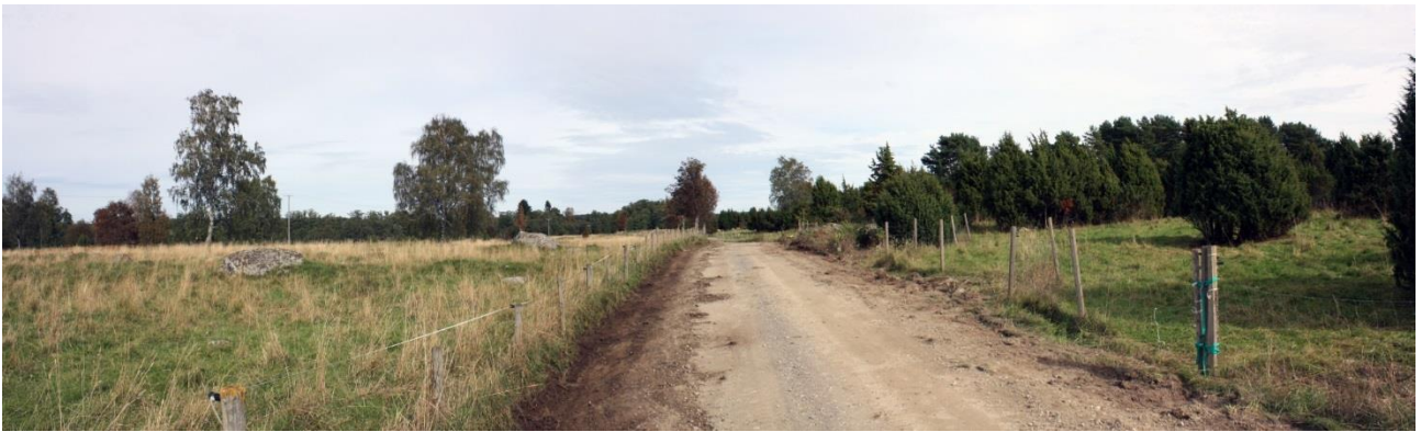
Kuva 3. Valvottavan tieosuuden länsiosa, kuvattu lounaasta. AKDG 4909:3