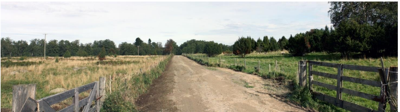
Kuva 4. Valvottavan tieosuuden keskiosa, kuvattu lounaasta. AKDG 4909:4