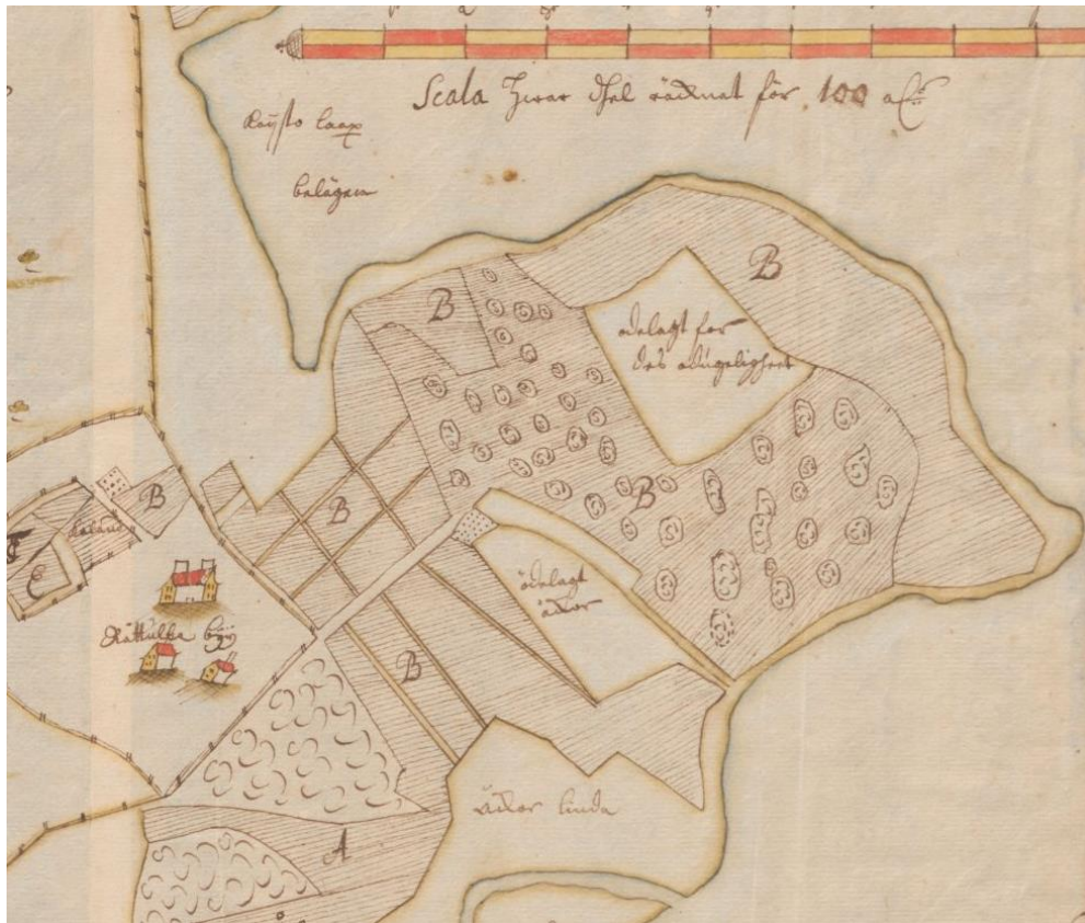
Kuva 7. Ote maanmittari Lars Forssellin laatimasta tiluskartasta vuodelta 1691, jossa Myllymäen kohdalla on peltoa ja useita kumpareita.