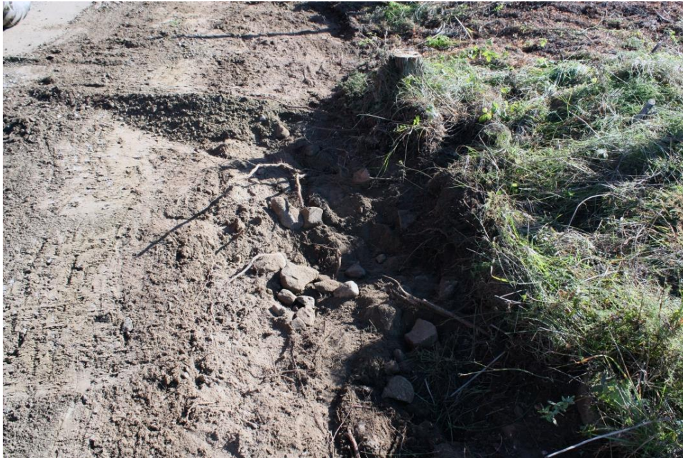
Kuva 10. Kiveyshavainto 1, kuvattu lounaasta. AKDG 4909:7

Noin 1,5 m matkalla paljastui tieleikkauksesta nyrkinkokoisista kivistä koostuva kiveys. Kivien välissä oli hiekkaa ja multaa. Kiveyksessä ei ollut nokea tai muita palamisen merkkejä eikä kiveyksestä havaittu löytöjä. Kiveys jatkuu matalana turpeen peittämänä kuohumana tiealueen eteläpuolelle ja sen päältä on kaadettu kataja. Kiveys saattaa liittyä vieressä olevaan rökkiöön nro 108.