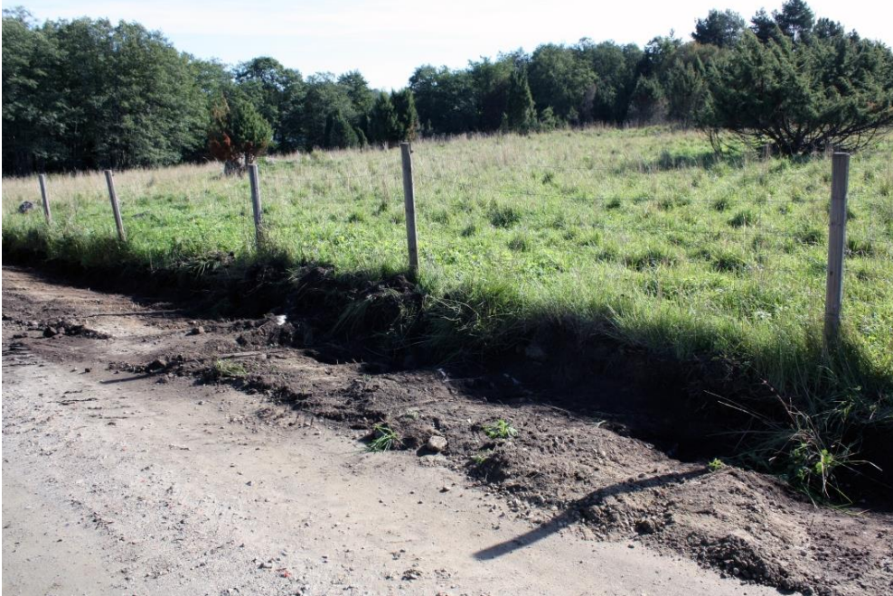
Kuva 16. Kiveyshavainto 5, kuvattu lännestä. AKDG 4909:13

Noin 8,1 m matkalla paljastui tieleikkauksesta matala maan- ja kivensekainen kiveys. Kivien välissä oli no- kista multaa ja leikkauksesta löytyi pala palanutta luuta. Kiveys jatkuu varsin matalana turpeen peittämänä kohoumana tiealueen eteläpuolelle.