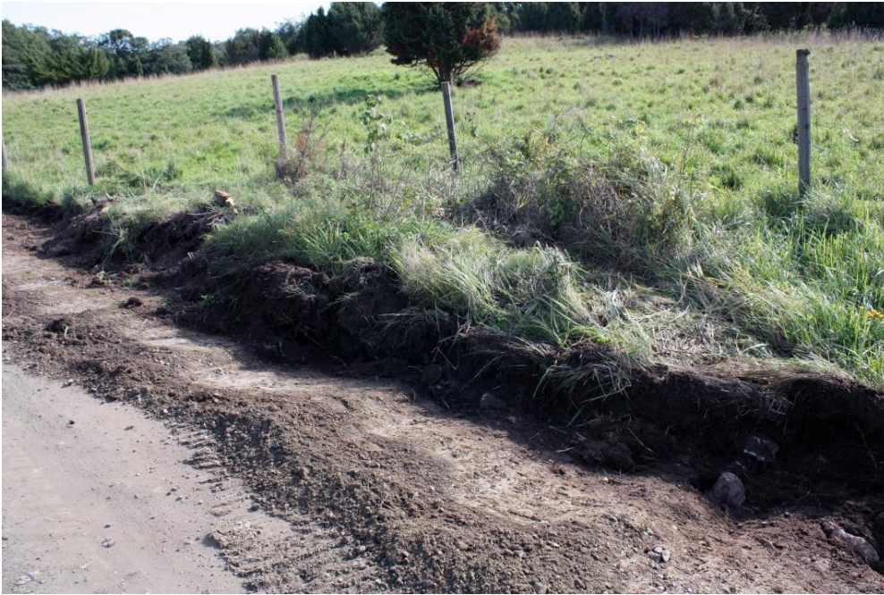
Kuva 14. Kiveyshavainto 3, kuvattu lännestä. AKDG 4909:11

Kiveyshavainto 4, N 6785459,1 E 356324,9