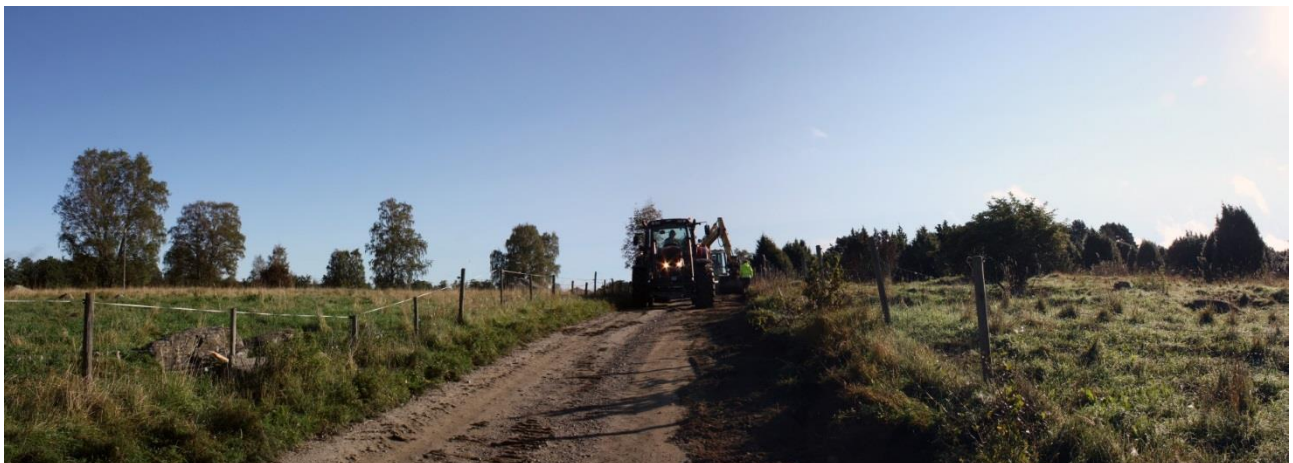
Kuva 1. Valvottavan tieosuuden länsipää, kuvattu lounaasta. AKDG 4909:1

Tutkimuskohde sijaitsee Vanajaveden itäosassa olevalla Retulansaarella noin 2,5 km Tyrvännön kirkosta pohjoiseen. Saaren itäosassa on rannan tuntumassa Myllymäki -niminen ja aika loivapiiteinen mäki, jonka halki kulkee lounais-koillisuuntaisesti kunnostettava Retulansaarentie. Mäki on noin 400 x 300 m laaja ja noin 6 m korkea. Mäen melko laaja laki on tasainen ja sen korkein kohta on noin 91,5 m mpy (N2000). Pohjoisessa mäen rinne on verrattain loiva, kun taas etelässä rinne on jonkin verran jyrkempi. Suurin osa mäestä on avonaista laidunmaata, jossa kasvaa yksittäisiä katajia ja koivuja. Ainoastaan idässä ja kaakossa on hieman yhtenäisempää mäntymetsää. Mäen juurella on havaittavissa noin 83 m korkeudella Vanajaveden vanha rantatörmä. Vanajaveden nykyisen vedenpinnan korkeus on noin 79,7 m mpy (N2000). Mäen eteläpuolella on viljeltyä peltoa ja sen pohjoispuolella metsittynyttä vesijättömaata.