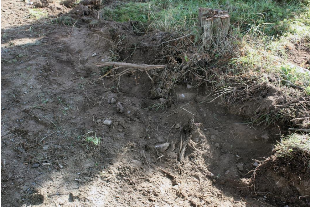
Kuva 12. Kiveyshavainto 2, kuvattu lännestä. AKDG 4909:8

Noin 2,3 m matkalla paljastui tieleikkauksesta melko harvaksen muutamia pään kokoisia kiviä ja vähäinen määrä tiilenmurskaa. Kivien välissä oli multaa eikä maassa ollut nokea tai muita palamisen merkkejä. Kiveys jatkuu matalana turpeen peittämänä kohoumana tiealueen eteläpuolelle ja sen päältä on kaadettu kataja. Kiveys saattaa liittyä vieressä olevaan röykkiöön nro 109.