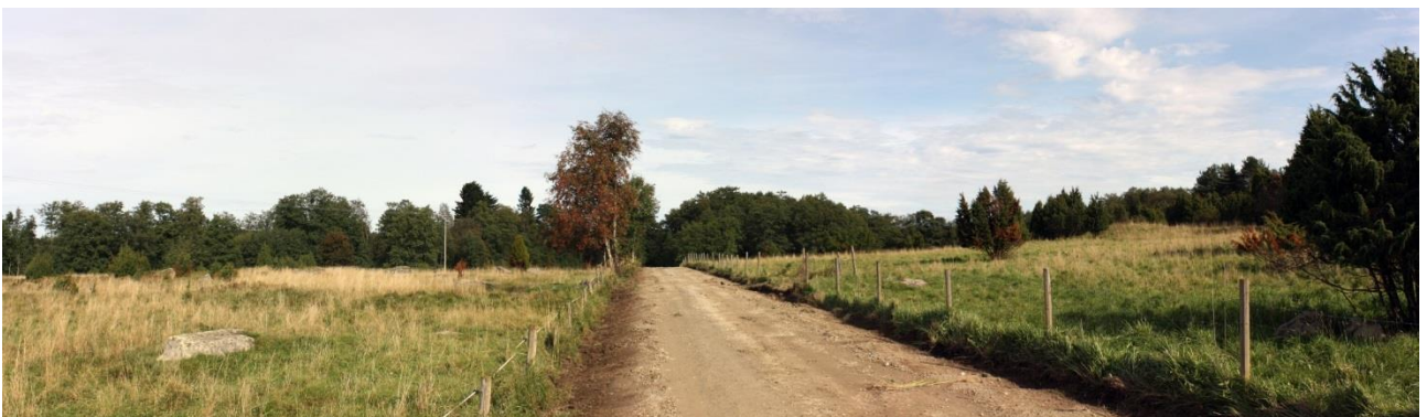
Kuva 5. Valvottavan tieosuuden itäosa, kuvattu lounaasta. AKDG 4909:5