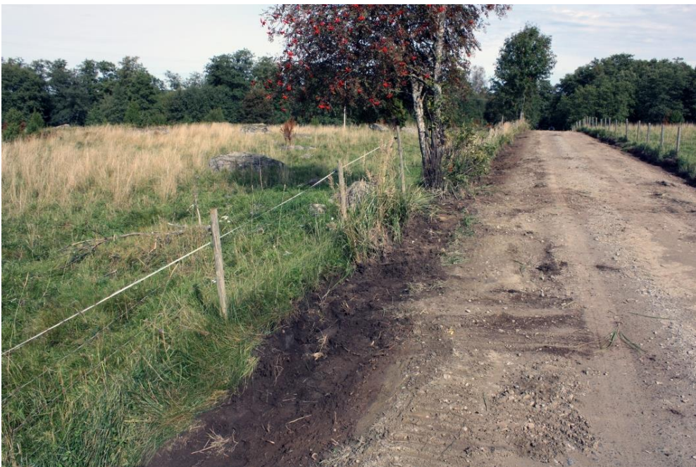
Kuva 17. Kiveyshavainto 6, kuvattu lounaasta. AKDG 4909:14

Noin 1,7 m matkalla paljastui tieleikkauksesta melko epämääräinen keskittymä päänkokoisia kiviä. Kivien välissä oli multaa. Maassa ei ollut nokea tai muita palamisen merkkejä. Kiveyksestä ei saatu löytöjä. Kiveys jatkuu tiealueen pohjoispuolelle matalana turpeen peittämän kohoumana. Kiveys saattaa liittyä vieressä olevaan röykkiöön nro 72.