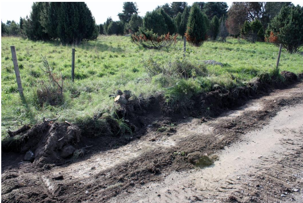
Kuva 13. Kiveyshavainto 3, kuvattu pohjoisesta. AKDG 4909:10

Noin 8,3 m matkalla paljastui tieleikkauksesta matala maan- ja kivensekainen kiveys. Kivien välissä oli multaa eikä maassa ollut nokea tai muita palamisen merkkejä. Kiveyksestä ei myöskään havaittu löytöjä. Kiveys jatkuu matalana turpeen peittämänä kohoumana tiealueen eteläpuolelle ja sen päältä on kaadettu kataja.