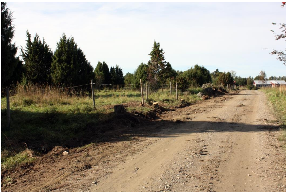
Kuva 11. Näkymä kohti kiveyshavaintoa 1 ja 2, kuvattu koillisesta. AKDG 4909:9