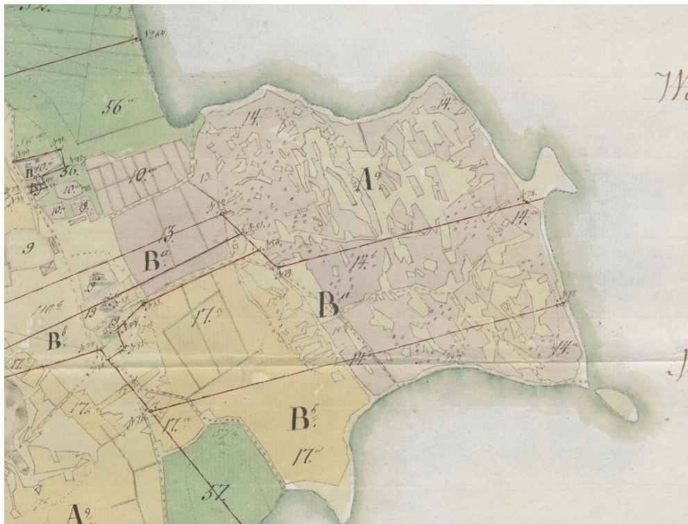
Kuva 8. Ote maanmittari Zittingin laatimasta tiluskartasta vuodelta 1802, jossa Myllymäen kohdalla on peltoa ja lukuisia joutomaakaistoja. Kartta: Kansallisarkisto, H11:9/1