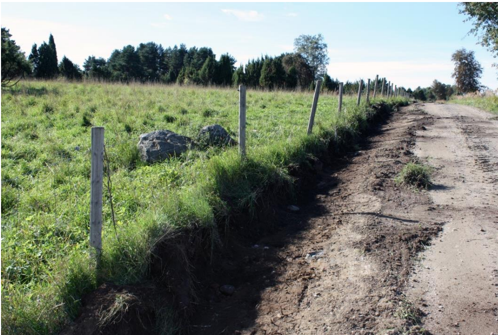
Kuva 15. Kiveyshavainto 4, kuvattu koillisesta. AKDG 4909:12

Noin 7,1 m matkalla paljastui tieleikkauksesta matala maan- ja kivensekainen kiveys. Kivien välissä oli hie- man nokiselta vaikuttavaa multaa ja leikkauksesta löytyi pala palanutta savea. Kiveys jatkuu matalana tur- peen peittämänä kohoumana tiealueen eteläpuolelle.