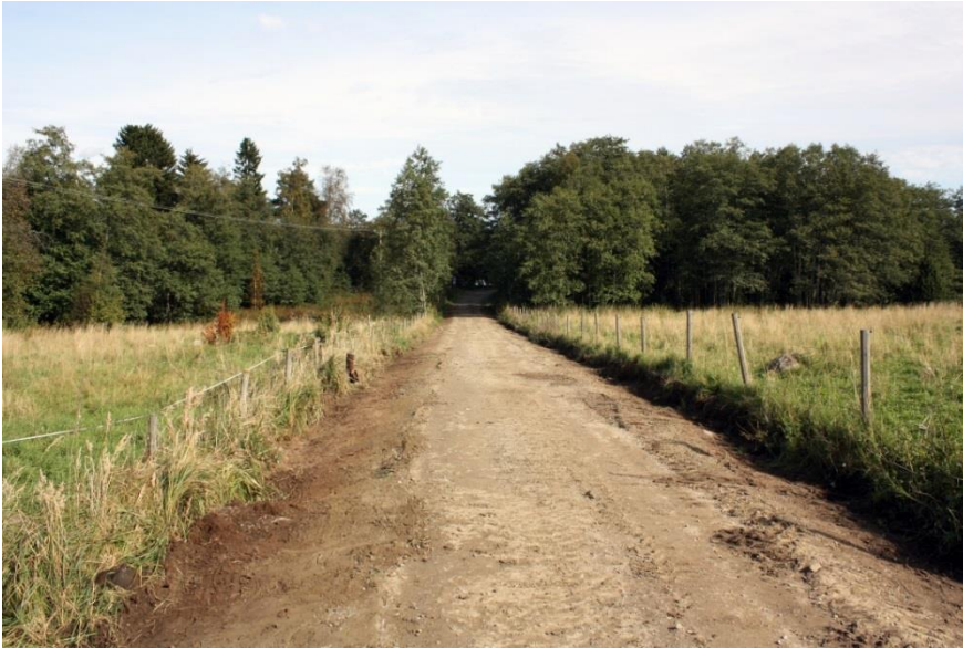
Kuva 6. Valvottavan tieosuuden itäpää, kuvattu lounaasta. AKDG 4909:6

Retulansaarta ympäröivän Kokemäenjoen vesistöön kuuluva Vanjavesi kuroutui Itämerestä noin 8500 vuotta sitten. Koska Vanajaveden lasku-uoma sijaitsi luoteessa, missä maankohoaminen on voimakkaampaa kuin kaakossa, järven vedenpinta on ollut pääsääntöisesti nouseva ja näin aiheuttanut kaakossa tulvia. Kuroutumisajan rannat ovat enimmillään 8-9 m Vanjaveden nykyisen vedenpinnan alapuolella. Korkeimmillaan järven vedet olivat 1700-luvulla, jolloin vedenpinta oli 81,5-82,5 m mpy. ja vedet ulottuivat aivan Myllymäen juurelle asti. 1700- ja 1800-luvulla vedenpintaa laskettiin keinotekoisesti yhteensä 2-3 m nykyiseen tasoon (Mikkola et al. 2001:16; Ojanen 2002:15-17).