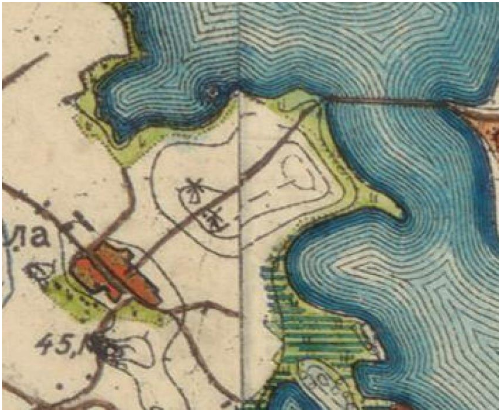
Kuva 9. Ote vuodelta 1899 olevasta venäläisestä topografisesta kartasta, johon Retulansaa-rientie on jo merkitty kulkevan Myllymäen halki. Kartassa mäelle on myös merkitty kaksi tuulimyllyä. Kartta: Kansalliskartoitus, [Sääksmäki] (XV-XVI 26-27)