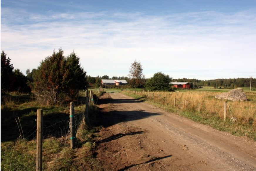
Kuva 2. Valvottavan tieosuuden länsiosa, kuvattu idästä. AKDG 4909:2