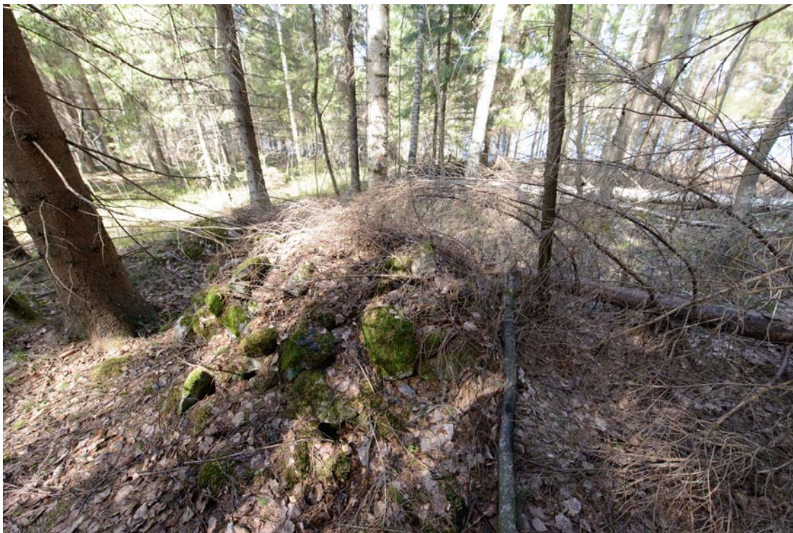
Rautjärvi Ometanmäki. Röykkiö alueen pohjoisosassa, Kosenmaikon lähellä, edustaa mahdollisesti vanhempia raivausröykkiöitä. Taustalla Kivijärvi. Kuvattu etelästä. (AKDG3706:2)