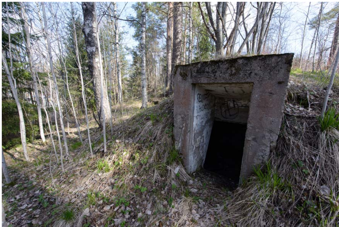
Kellari Ometantien itäpuolella olevan mäen kupeessa. Kuvattu etelästä. (AKDG3706:5)