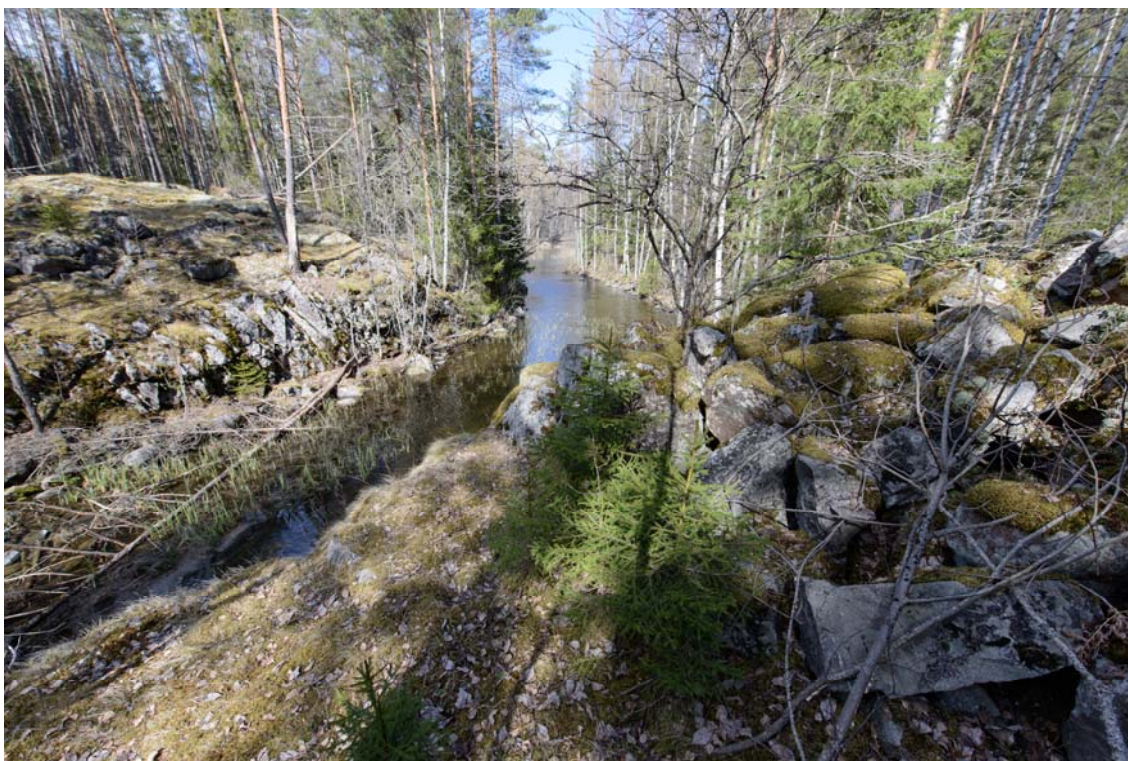
Kosenmaikon kanava. Kuvattu etelästä. (AKDG3706:4)