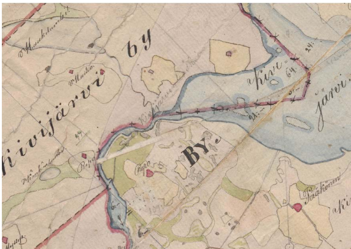
Ote pitäjänkartasta vuodelta 1847. Ometanmäelle on perustettu Repo-niminen tila. Vertaamalla yläpuolella olevaan karttaan selviää myös hyvin kuinka paljon maata saatiin käyttöön, kun järveä laskettiin. (Parikkala 4123 02+4121 1a)