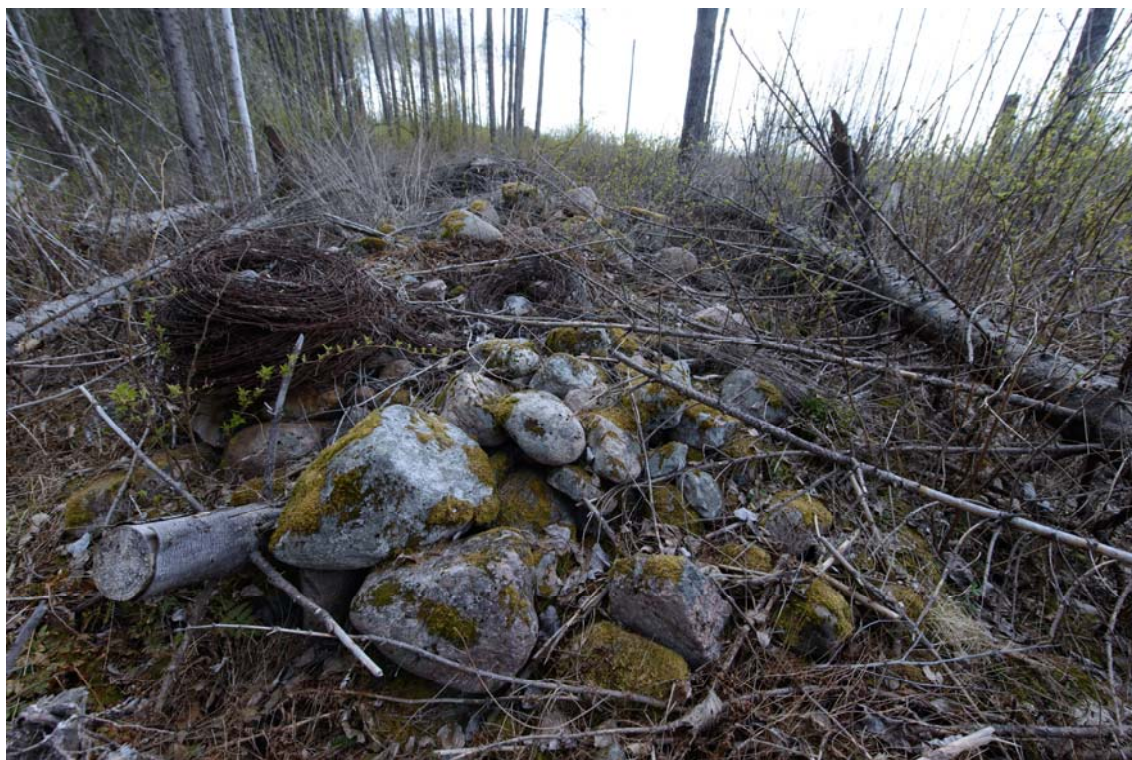
Raivausröykkiö ja piikkilankakerä Ometanmäen länsilaidalla. Kuvattu lounaasta. (AKDG3706:6)