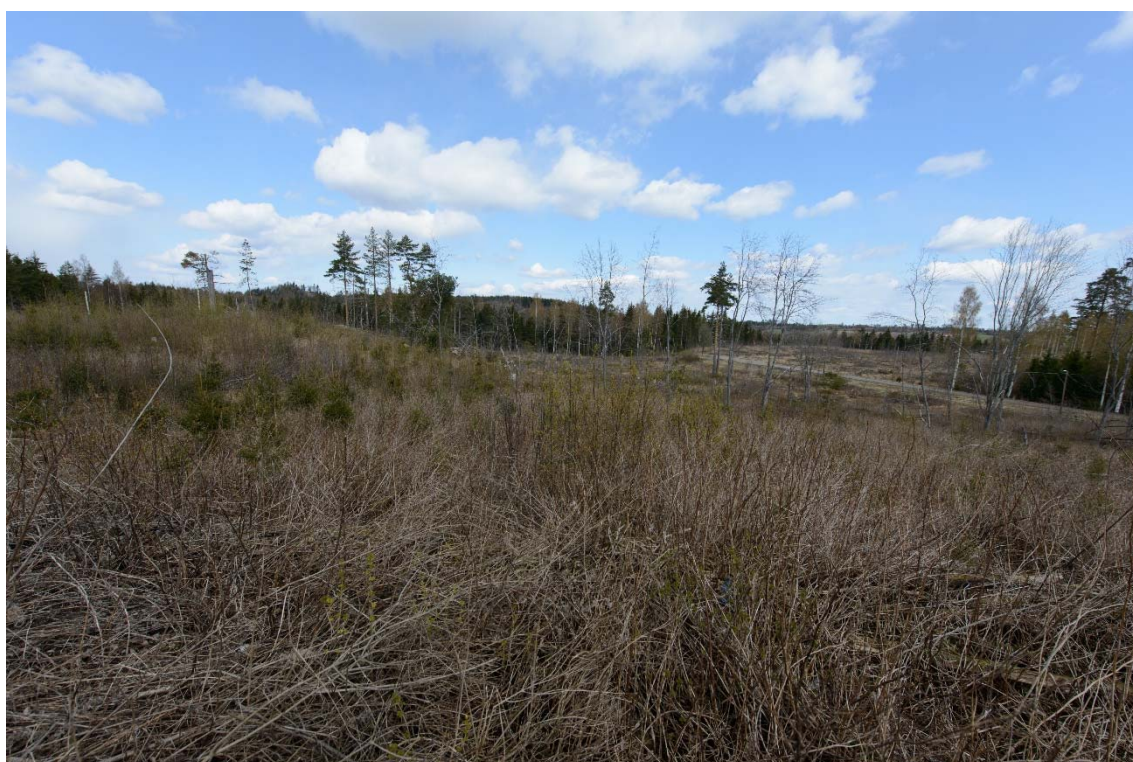
Näkymä entisen navetta-kanalan läheltä kohti asemakaavoitettavaa aluetta. Kuvattu lounaasta. (AKDG3706:8)