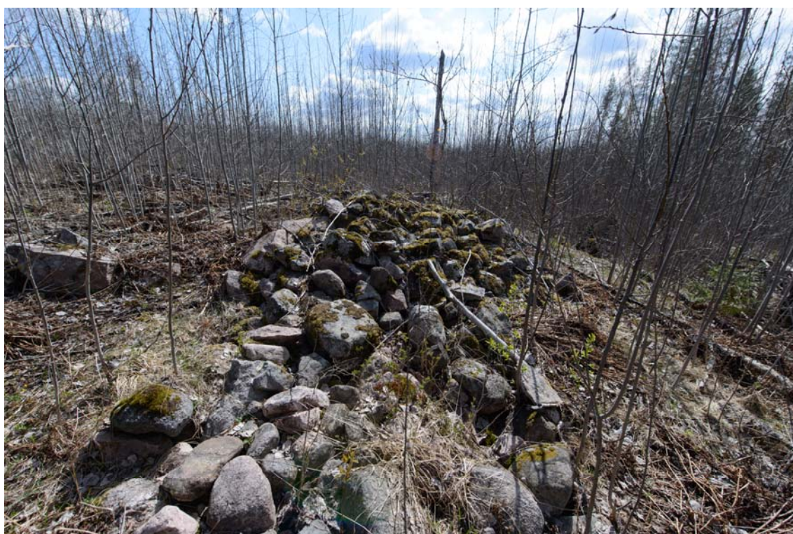
Pitkä raivausröykkiö/kivaita Ometanmäen lounaislaidalla. Kuvattu luoteesta. (AKDG3706:7)