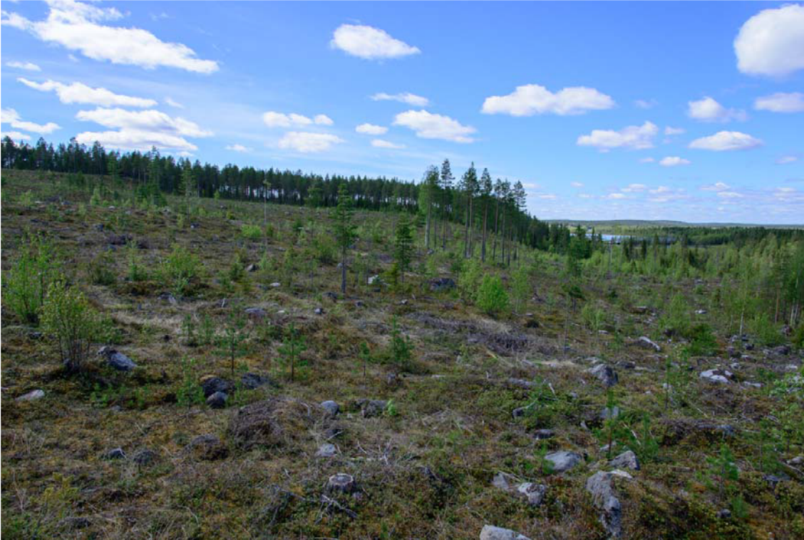
Kuva 2. Inventointialuetta Marjavaaran pohjoisosassa. Kuva luoteeseen. (AKD3729:2)

Rovaniemen alue oli veden peitossa viimeisen jääkauden jälkeen. Maankohoamisen seurauksena Marjavaaran yläosat paljastuivat Ancyclusjärven alta noin 7000–6800 eaa. Ancyclusjärveä seurasi Litorina meren vaihe, jonka korkein ranta on Rovaniemellä noin 90 m mpy ja ajoittuu noin 5800 eaa. Inventointialueella korkein Litorina ranta on Marjavaaran rinteiden puolen välin paikkeilla. Maankohoaminen ei ole kuitenkaan tasaista joka puolella ja siihen vaikuttavat monet tekijät, tämän seurauksena muodostui Valajaisen kohdalle kynnys, joka aiheutti ns. Kolpeneen muinaisjärven syntymisen noin 4000 eaa. Kyseessä oli huomattavan iso järviallas, sen pinta-ala oli noin 200 km 2 . Kolpeneen ylin ranta on noin 81–83 metrin korkeudella, joten tässä vaiheessa inventointialueesta vain Marjavaara oli kuivaa maata. Kolpeneen muinaisjärvi kutistui vaiheittain. Tyypillisen kampakeramiikan aikaan noin 3500–2800 eaa, veden pinta oli noin 76–77 metrin korkeudella mpy. Kivikauden lopulla 2800–1300 eaa pinta laski jo alle 74 m mpy. Järven purku-uomat kasvoivat koko ajan suuremmiksi ja virtaus kasvoi ja lopulta Kolpeneen muinaisjärvi lakkasi olemasta ja muuttui jälleen osaksi Kemijokea noin 1000 eaa.