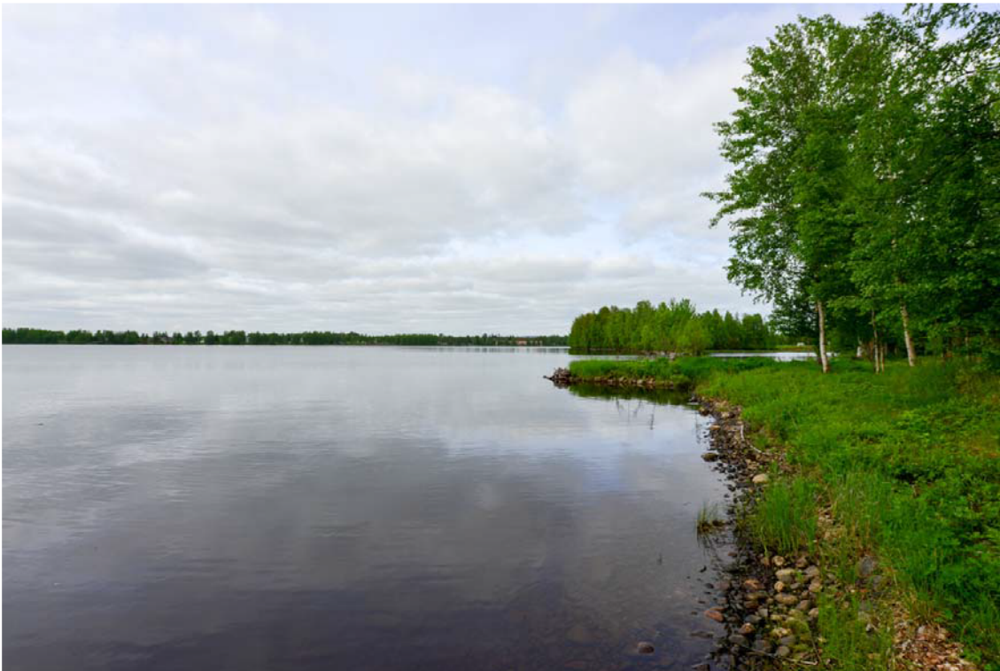
Kuva 3. Maisema uimarannan pohjoispuolelta kohti Paavalniemen pohjoiskärkeä. (AKD3729:4)

Maanmittauslaitokselta saatavissa oleva ilmalaserkeilausaineisto oli myös käytössä inventointia suunniteltaessa. Aineistosta tehdyn korkeusmallin pohjalta tehtiin inventoinnin valmisteluvaiheessa havaintoja mahdollisista anomaliaista eli kohteista, jotka erottuvat kuvissa mahdollisina ihmisen tekeminä rakenteina. Yleensä esimerkiksi tervahaudat, hiilimiilut ja sotahistorialliset kohteet erottuvat tässä aineistossa. Laserkeilausaineiston avulla ei tällä kertaa löytynyt uusia kohteita, mutta Oinaan kohteessa olevat kuopat näkyvät siinä. Kyseessä on kuitenkin jo tunnettu kohde ja kuopat liittyvät 1800–1900 -lukujen asutukseen.