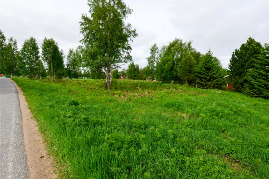
Oinas, mahdollinen muinaisjäännös. Tontilla on jäännöksiä 1800-1900-luvun asutuksesta mm. kaivo. Kuva luoteeseen Paavalniemen tieltä. (AKD3730:1)