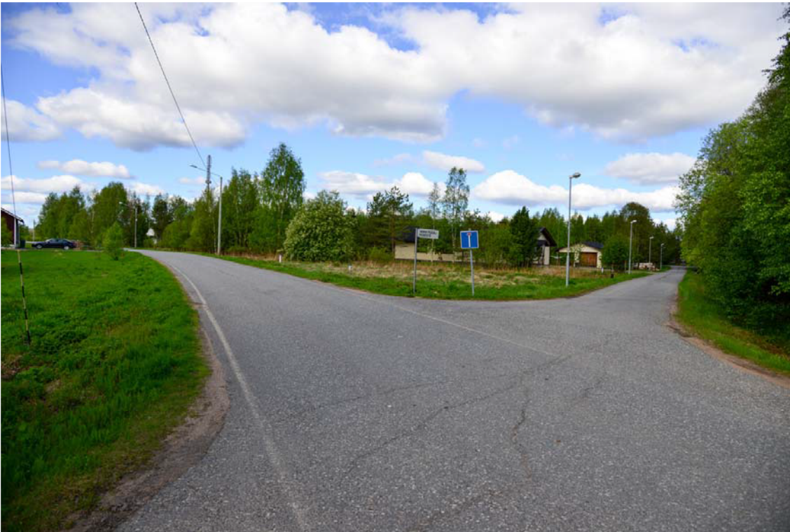
Kuva 1. Paavalniementie kulkee kaava-alueen pohjoisosan poikki, alueella on laajenevaa omakotitaloasutusta. (AKD3729:1)

Inventoitu kaava-alue on kooltaan noin 360 hehtaaria. Se sijaitsee Kemijoen eteläpuolella vastapäätä Rovaniemen kaupungin eteläosan taajama-asutusta ja Teollisuuskylää. Alue rajautuu itäosastaan Kemijoen itäpuolentiehen ja muualla Kemijokeen. Kaupungin keskustasta Paavalniemeen on tietä pitkin matkaa noin seitsemän kilometriä.