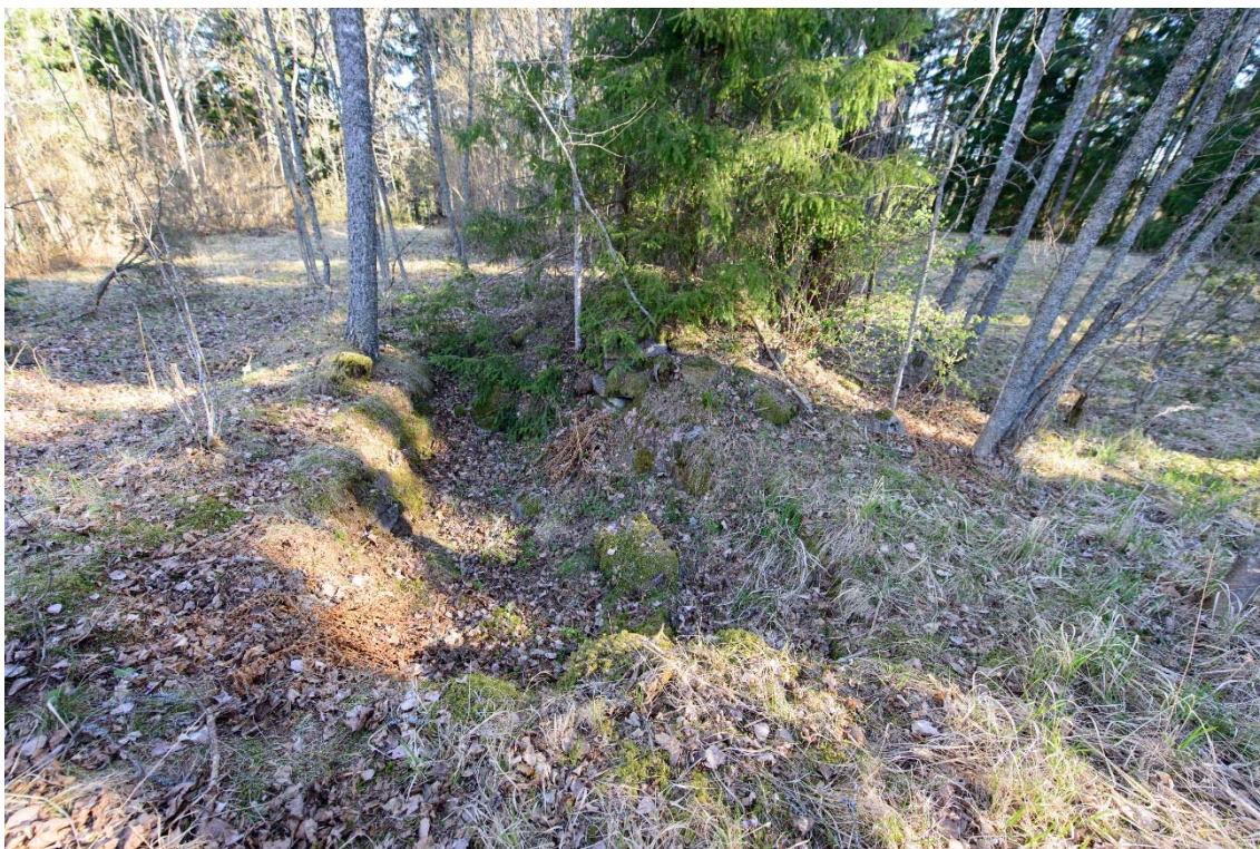
Raasepori, Västerudden. Rakennuksen pohja ja kuusen kohdalla uunin jäännökset, kuva etelästä. (AKDG3921:2)