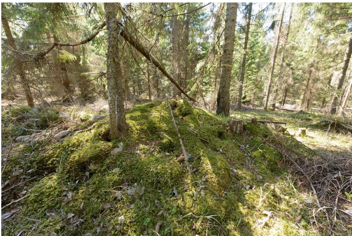
Sammaloitunut röykkiö nro 5. Kuvattu pohjoisesta. (AKDG3920:2)