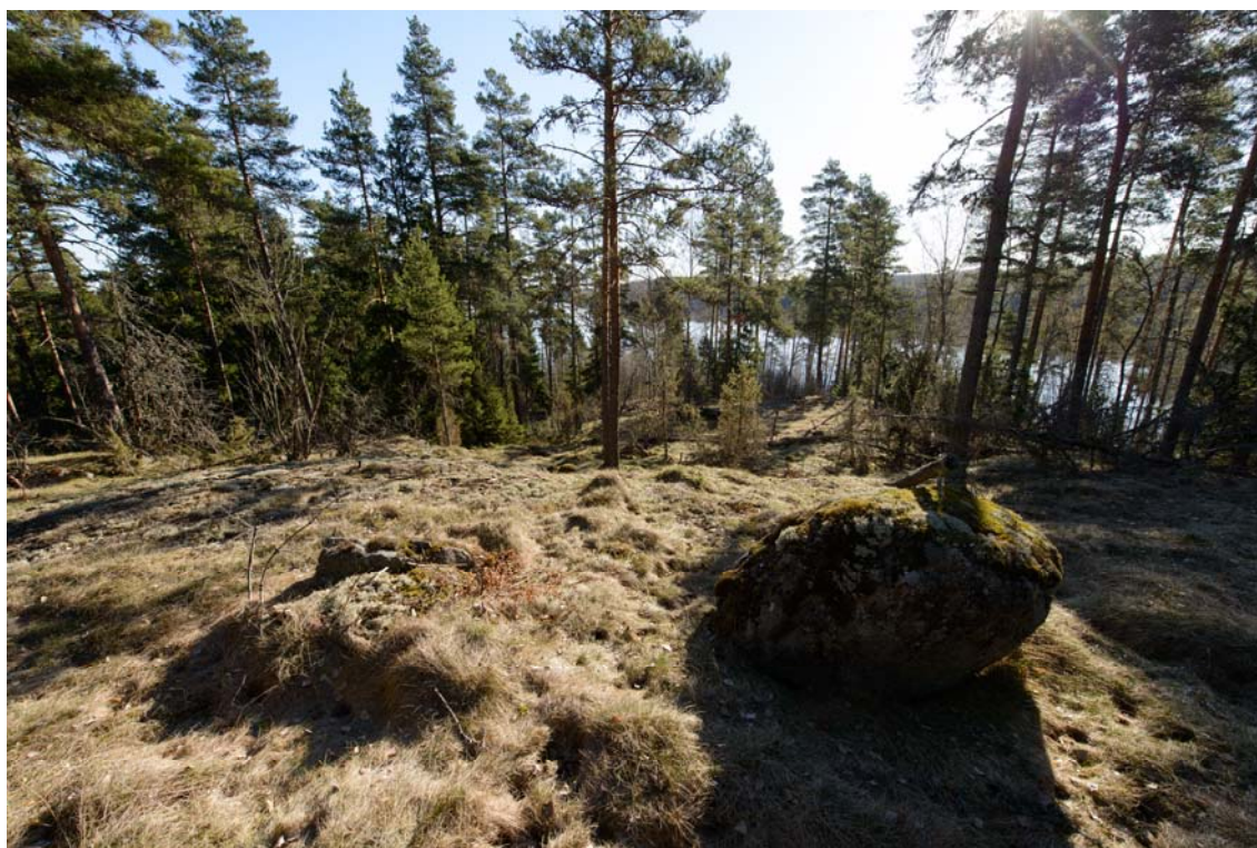
Raasepori, Västerudden. Maisemaan mäen päältä pohjoiseen. (AKDG3921:5)