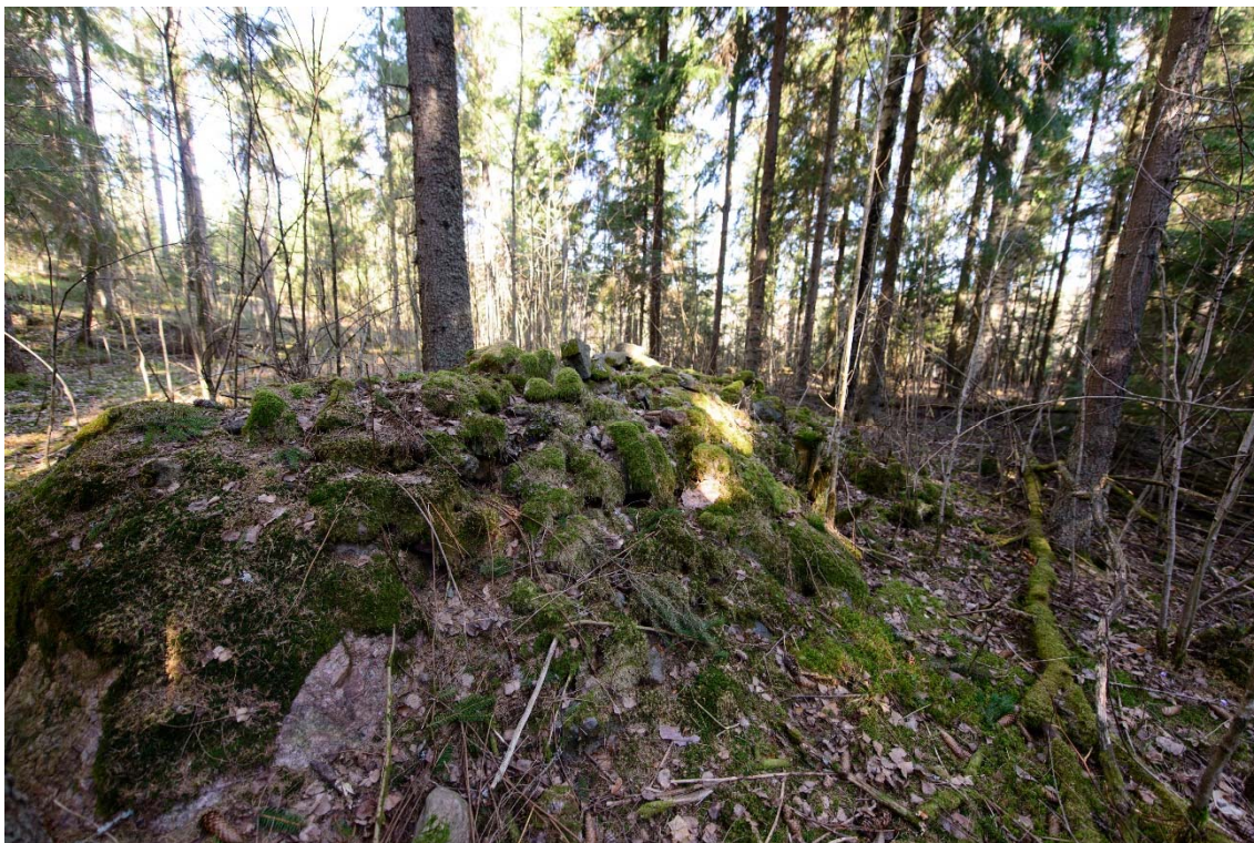
Raasepori, Västerudden. Iso raivausröykkiö niemen kärjessä, kuva idästä. (AKDG3921:3)