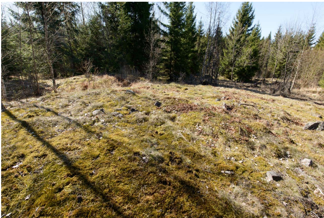
Matala, todennäköisesti hajotettu, kiviröykkiö kallion päällä. Kuvattu koillisesta. (AKDG3920:1)