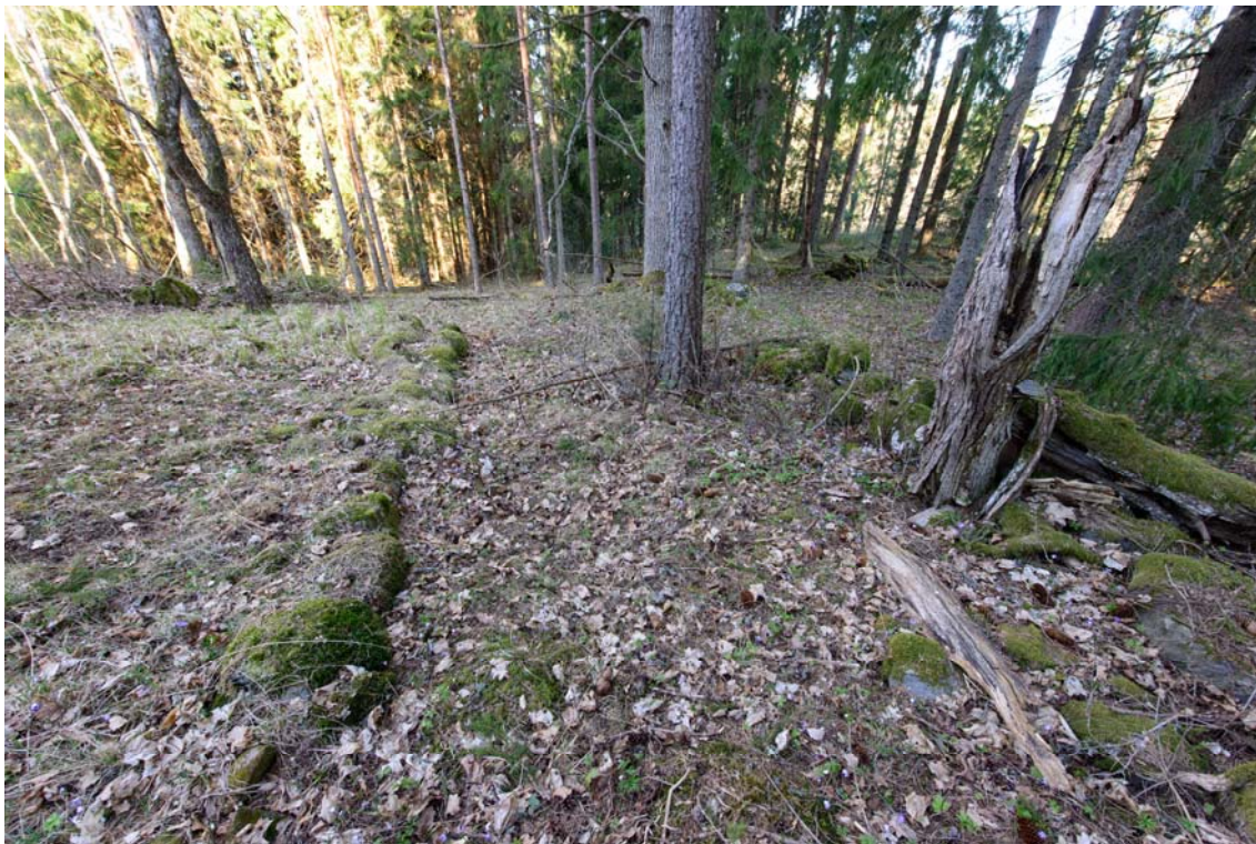
Raasepori, Västerudden. Rakennuksen kivijalka, koillisesta. (AKDG3921:1)