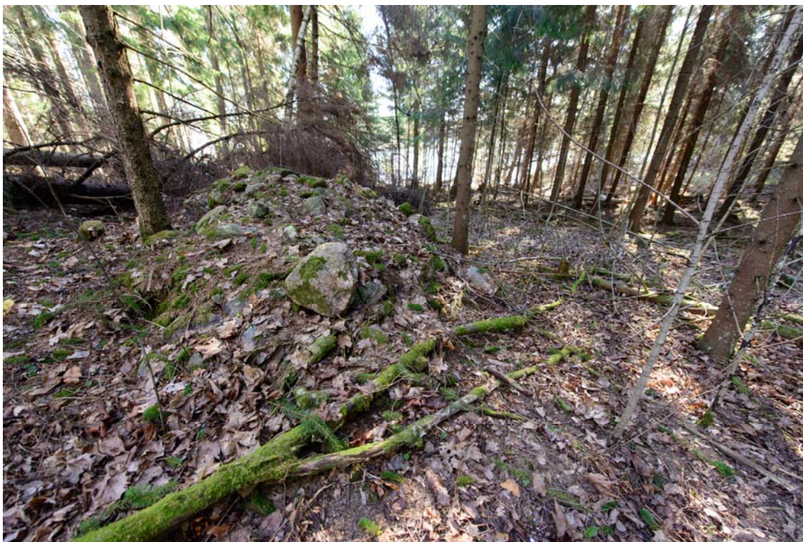
Raasepori, Västerudden. Raivausröykkiö niemen kärjessä, kuva luoteesta. (AKDG3921:4)