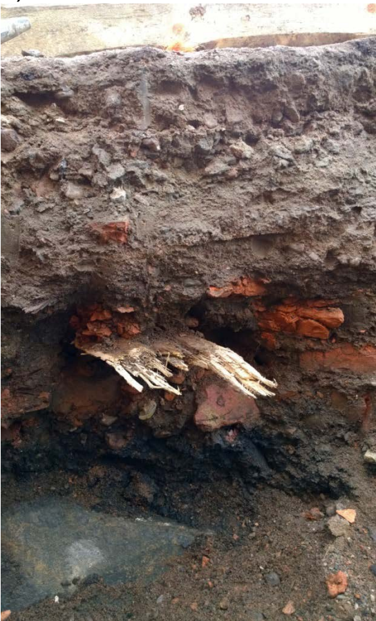
AKDG 5125:16. Puujänne luoteisseinän itäosan profiilissa, kaakosta.