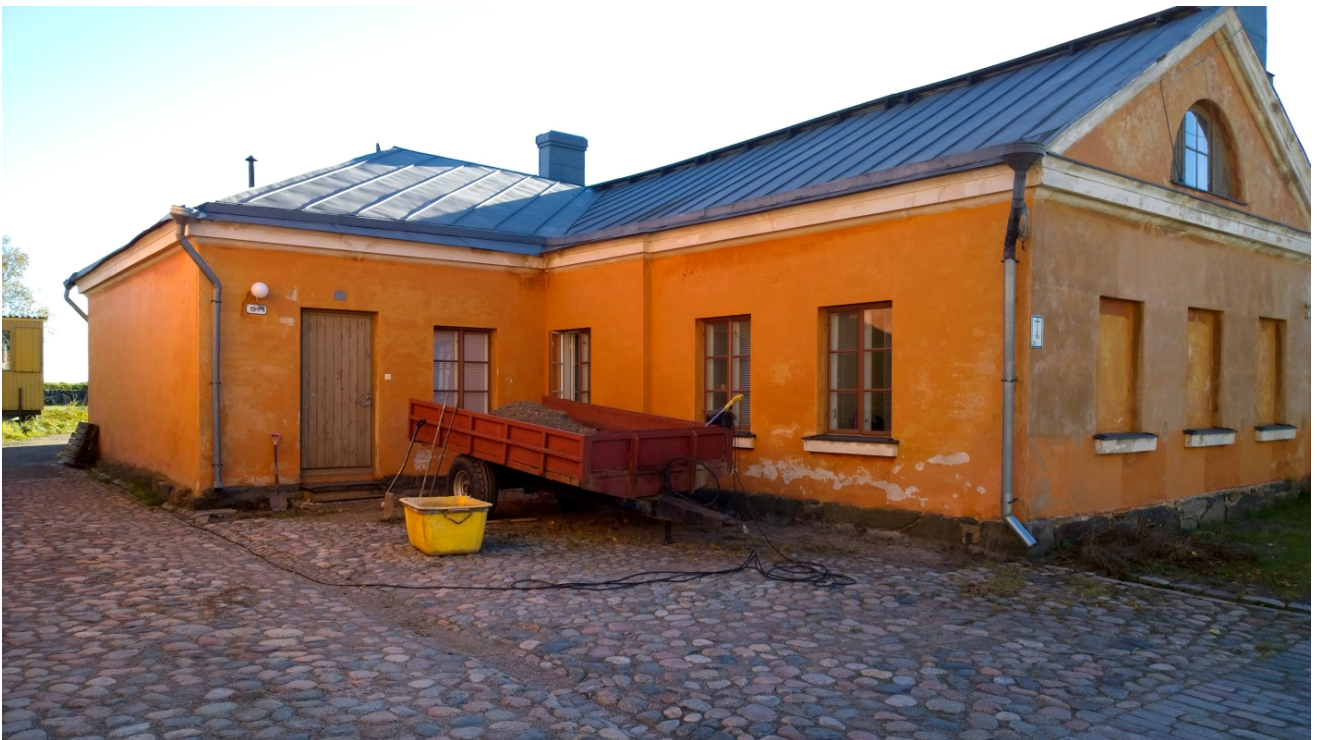
AKDG 5125:12. Rakennus C86, luoteesta.