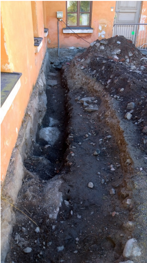
AKDG 5125:8. Luoteisseinän itäosa, koillisesta.

Luoteisseinän länsiosa kaivettiin viimeisenä. Täällä oli useita kaapeleita eteisrakennuksen luoteisnurkalla eikä siellä kaivettu 35 cm syvemmälle. Sen sijaan eteisen lounaisnurkkaan tehtiin liki metrin syvyinen kaivanto. Kallio tuli luoteisseinän länsiosan pitkällä sivulla vastaan noin 40-50 cm syvyydessä. Täälläkin kallio oli leikattu rakennuksen perustuksia varten.