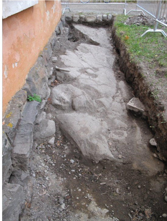
AKDG 5125:15. Kaivun lopputilanne rakennuksen koillisseinällä, kaakosta.