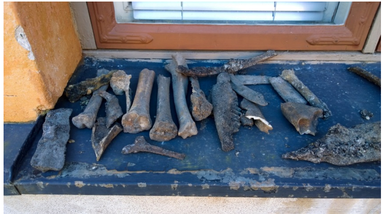
AKDG 5125:9. Löytöjä C86 kaivannosta.