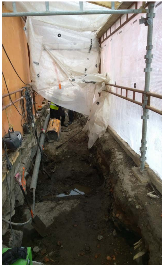
AKDG 5125:18. Yleiskuva luoteisseinän itäosan kaivannosta 20.2.2017, koillisesta.