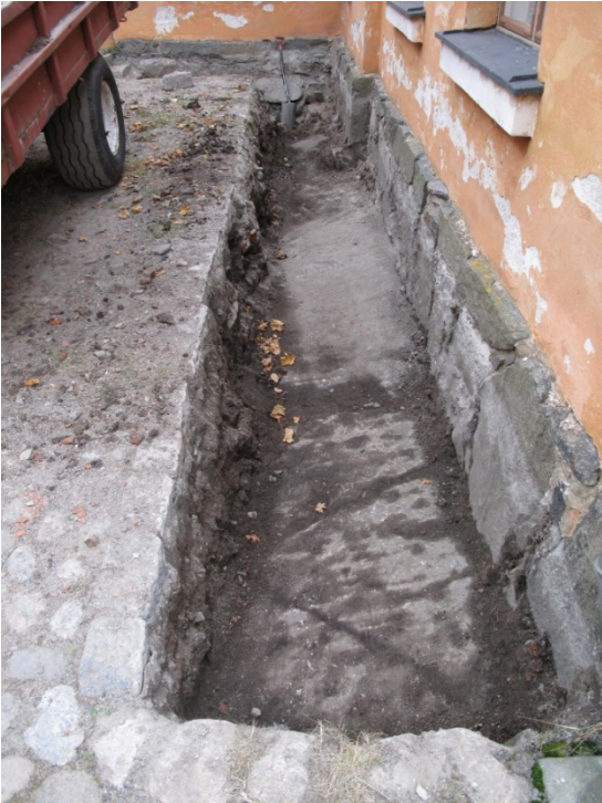
AKDG 5125:13. Kallion pinta luoteisseinän länsiosan kaivannossa, lounaasta.