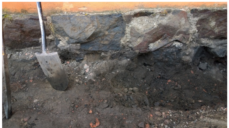
AKDG 5125:7. Luoteisseinän profiilia, luoteesta.