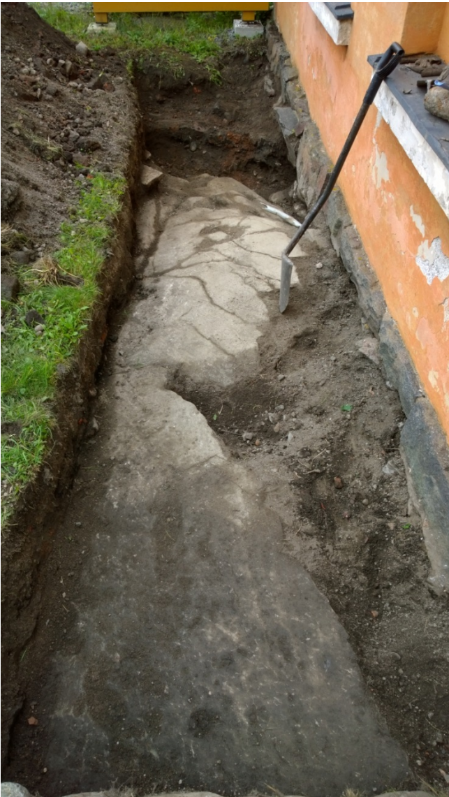
AKDG 5125:4. Kaivutilanne koillisella 15.9 aamupäivällä, luoteesta.