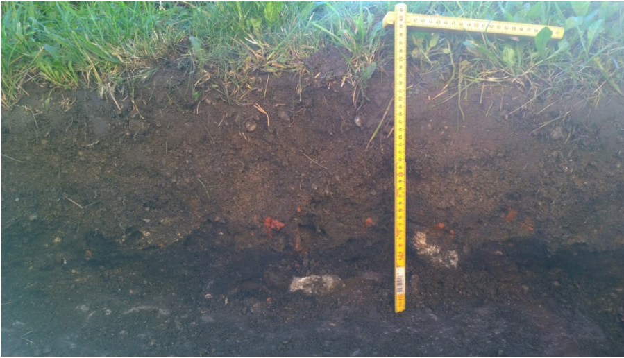
AKDG 5125:1. Hiilikerros näkyvässä kaivannon profiilissa, lounaasta.

Kalliota on louhittu perustuksia varten ja kallion pinta laskee poispäin rakennuksesta, itään. Aivan kallion pinnalla oli multa- ja purku(?)kerroksen alla noin 3-5 cm paksu hiilinen ja musta kerros. Kaivannon eteläosassa oli runsaasti tiiliä ja tiilimurskaa sekä yksittäinen muotoiltu laakakivi.