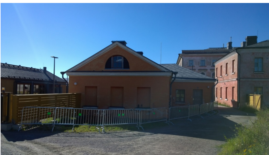
AKDG 5125:3. Rakennus C86 työmaa aidattuna, koillisesta.