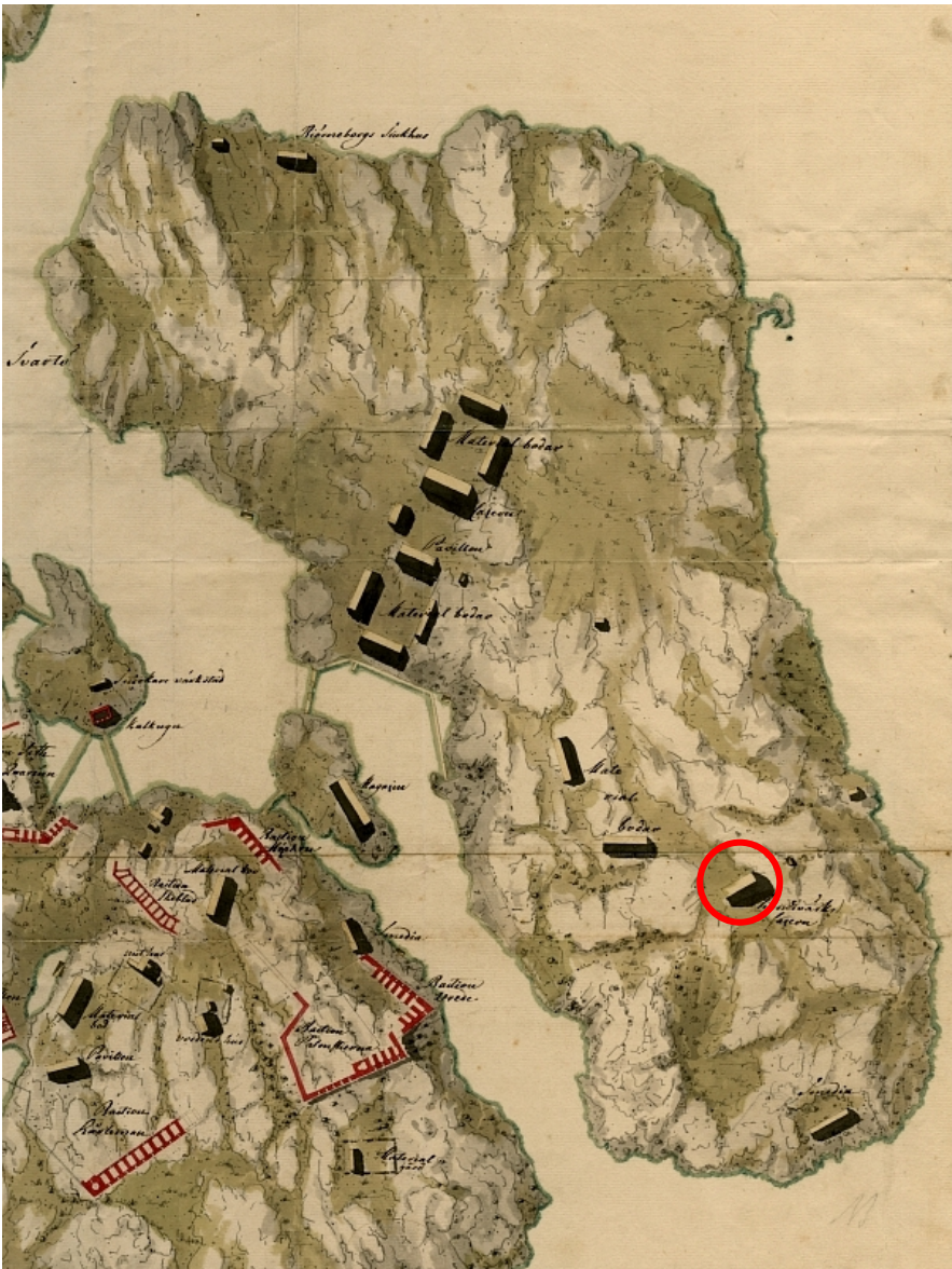
Ote vuoden 1750 yleissilmäskartasta. Käsiyöläisten kasarmi ympäröity punaisella.