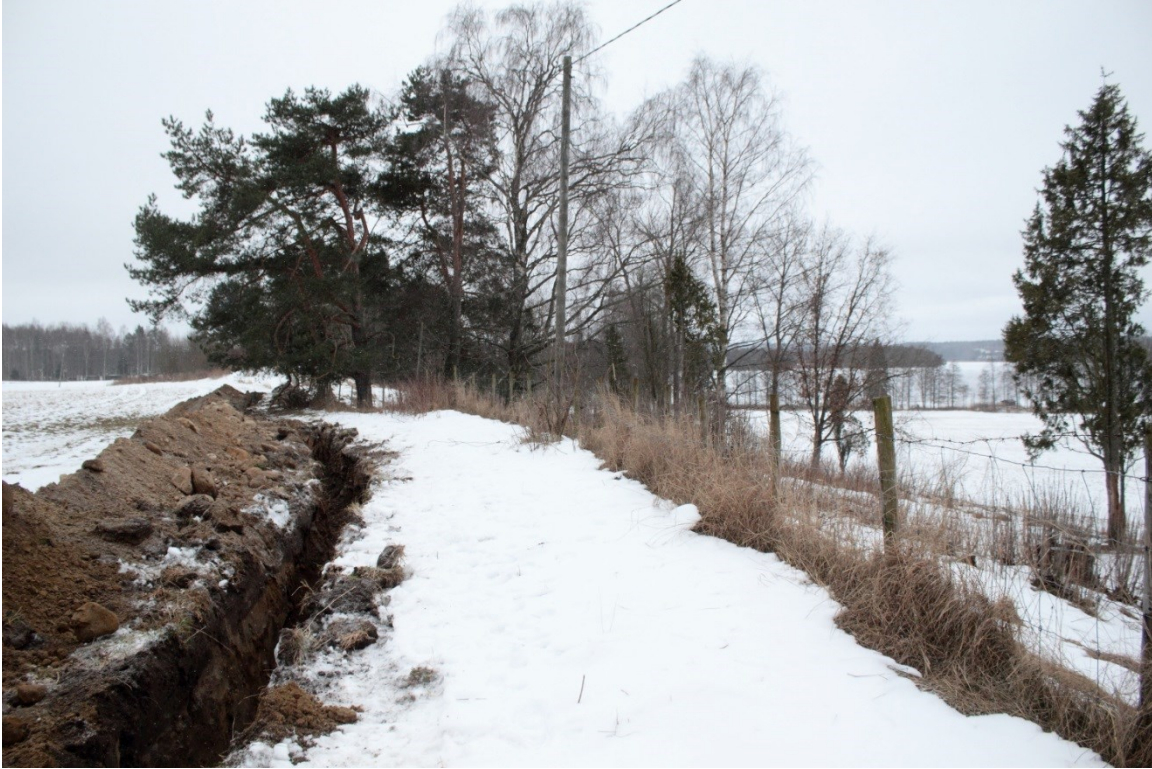
Kuva 2. Asikkala Äpätti. Kaapelikaivannon sijainti muinaisjäännösalueen itäpuolella. Kuvattu pohjoisesta. (DIGMAV2017001:2)