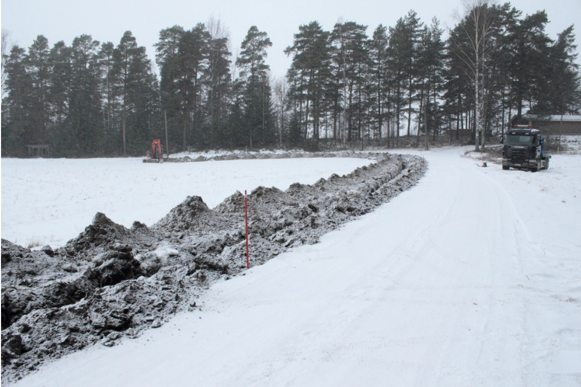
Kuva 3. Asikkala Ojaintien pelto. Valvottu kaapelikaivanto muinaisjäännösalueen reunalla. Ojan päädyssä, kaivinkoneen luota, kaivanto siirtyy tien yli metsän puolella ja kääntyy kohti pohjoista. Pelto on savea tai silttiä, mutta sen korkeimmalla (risteysalue sekä siitä etelään kaivinkoneen luokse) kohdalla on hiekkaa ja soraa. Kuvattu idästä. (DIGMAV2017001:4)