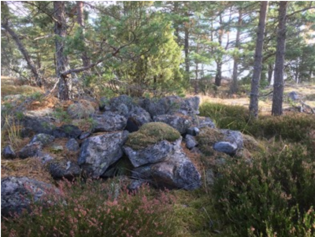
Kuva: Uuni 2, taustalla meri. Kaakosta. 6.10.2016.

Uuni 2 on tehty kallion seinää vasten. Uunin koko on 1,8 x1,8 metriä ja korkeus 0,6 metriä. Uunin suuaukko on lounaaseen eli rantaan päin. Uuni on noin 40 metriä rannasta.