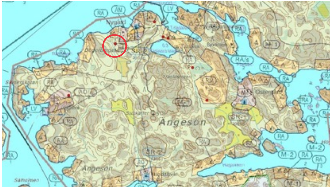
Karttaote: Nygård. Pohjakartta Maanmittauslaitos. Kaavakartta Sweco Oy. Kartan käsittely Jouni Taivainen, Arkebuusi.