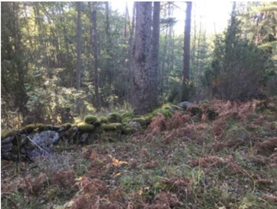
Kuva: Kiviaita 2. Idästä. 5.10.2016.

Kiviaita 2 sijaitsee edellisestä hieman kaakkoon mäen lounaisrinteellä. Se on kaakko-luode -suuntainen ja pituudeltaan noin 30 metriä. Aidan korkeus on noin 0,7 metriä ja leveys 0,8 - 1 metriä.