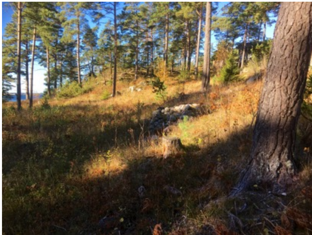
Kuva: Röykkiö numero kaksi kuvan keskellä. Idästä. 7.10.2016.

Röykkiö 3 on kooltaan noin 1 x 2 metriä ja korkeudeltaan noin 0,3 metriä.