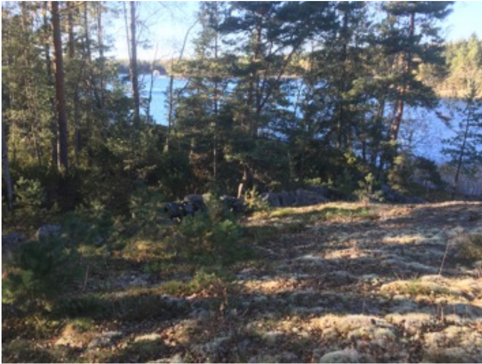
Kuva: Kiviaita 1 kallion juurella. Lounaasta. 5.10.2016.

Kiviaita 2 sijaitsee edellisestä hieman kaakkoon mäen lounaisrinteellä. Se on kaakko-luode -suuntainen ja pituudeltaan noin 30 metriä. Aidan korkeus on noin 0,7 metriä ja leveys 0,8 - 1 metriä.