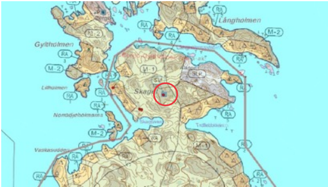
Karttaote: Skaget. Pohjakartta Maanmittauslaitos. Kaavakartta Sweco Oy. Kartan käsittely Jouni Taivainen, Arkebuusi.