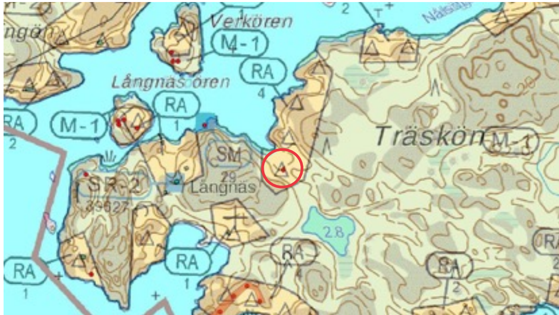
Karttaote: Träskön 1. Pohjakartta Maanmittauslaitos. Kaavakartta Sweco Oy. Kartan käsittely Jouni Taivainen, Arkebuusi.