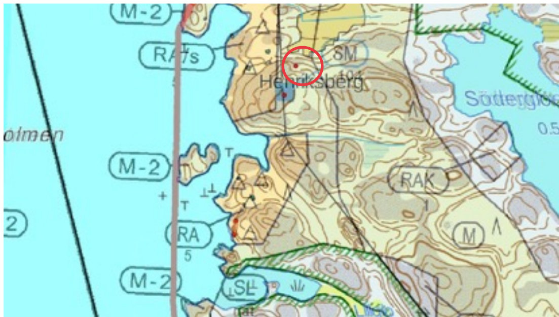
Karttaote: Henriksberg 1. Pohjakartta Maanmittauslaitos. Kaavakartta Sweco Oy. Kartan käsittely Jouni Taivainen, Arkebuusi.