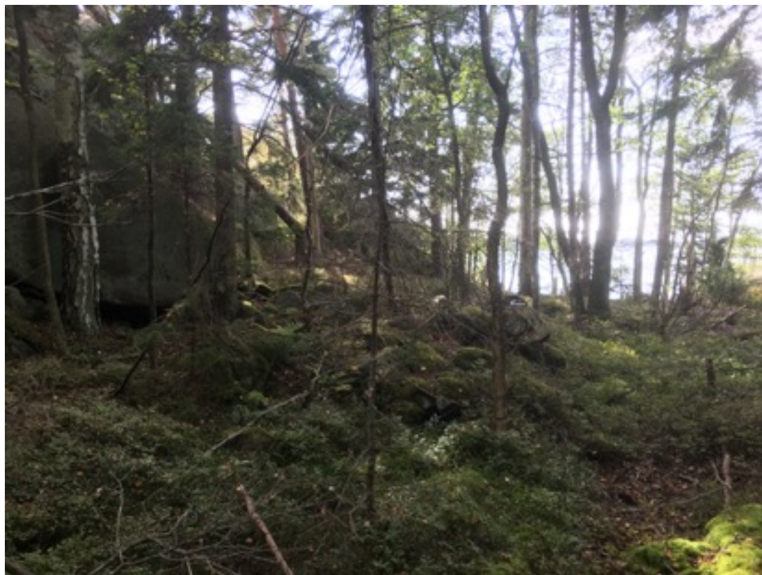
Kuva:Tuliaseman jäännös kuvan keskellä. Koillisesta. 10.9.2016.

Kohdekuvaus: Kohde löytyi inventoinnissa 10.9.2016. Kyseessä on kivirakenne, joka sijaitsee kalliojyrkänten juurella noin 20 metriä rannasta. Rakenne on kooltaan noin 5 x 5 metriä ja metrin korkea. Kallio nousee sen itäreunasta suoraan noin 6-7 metriä ylöspäin. Kivirakenteen pohjoispuolella on noin metrin leveä ja 2,5 metriä pitkä syvennys etelään päin, jonka seinustassa on erittäin lahoa puuta ja paksuhkoa rautalankaa. Kivirakenne on tehty luonnonkivistä. En aluksi oikein osannut tulkita rakenteen tarkoitusta tai ajoitusta, mutta kun löysin vastaavan paremmin säilyneen kohteen (Själglooden 2) samaisen länteen kurottavan niemen kärjestä pystyin tulkitsemaan sen toisen maailmansodan aikaiseksi tuliasemaksi. Siitä käsin on voitu hallita saaren lounaispuolelta kulkevaa laivaväylää.