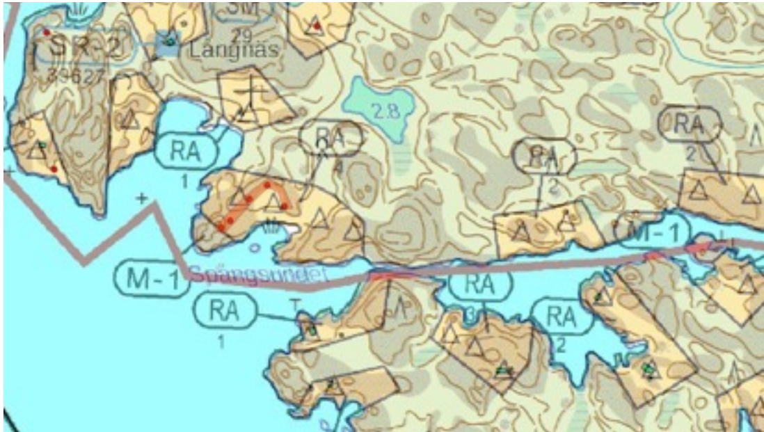
Karttaote: Spångnäs 1. Pohjakartta Maanmittauslaitos. Kaavakartta Sweco Oy. Kartan käsittely Jouni Taivainen, Arkebuusi.