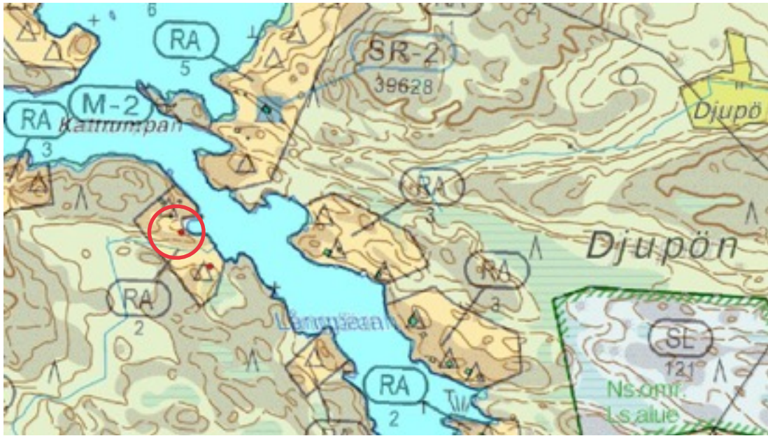
Karttaote: Långpärans1. Pohjakartta Maanmittauslaitos. Kaavakartta Sweco Oy. Kartan käsittely Jouni Taivainen, Arkebuusi.