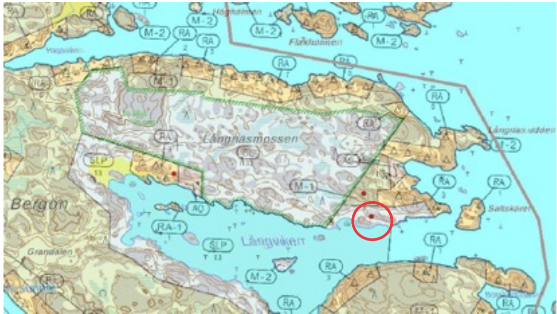
Karttaote: Långviken 2. Pohjakartta Maanmittauslaitos. Kaavakartta Sweco Oy. Kartan käsittely Jouni Taivainen, Arkebuusi.