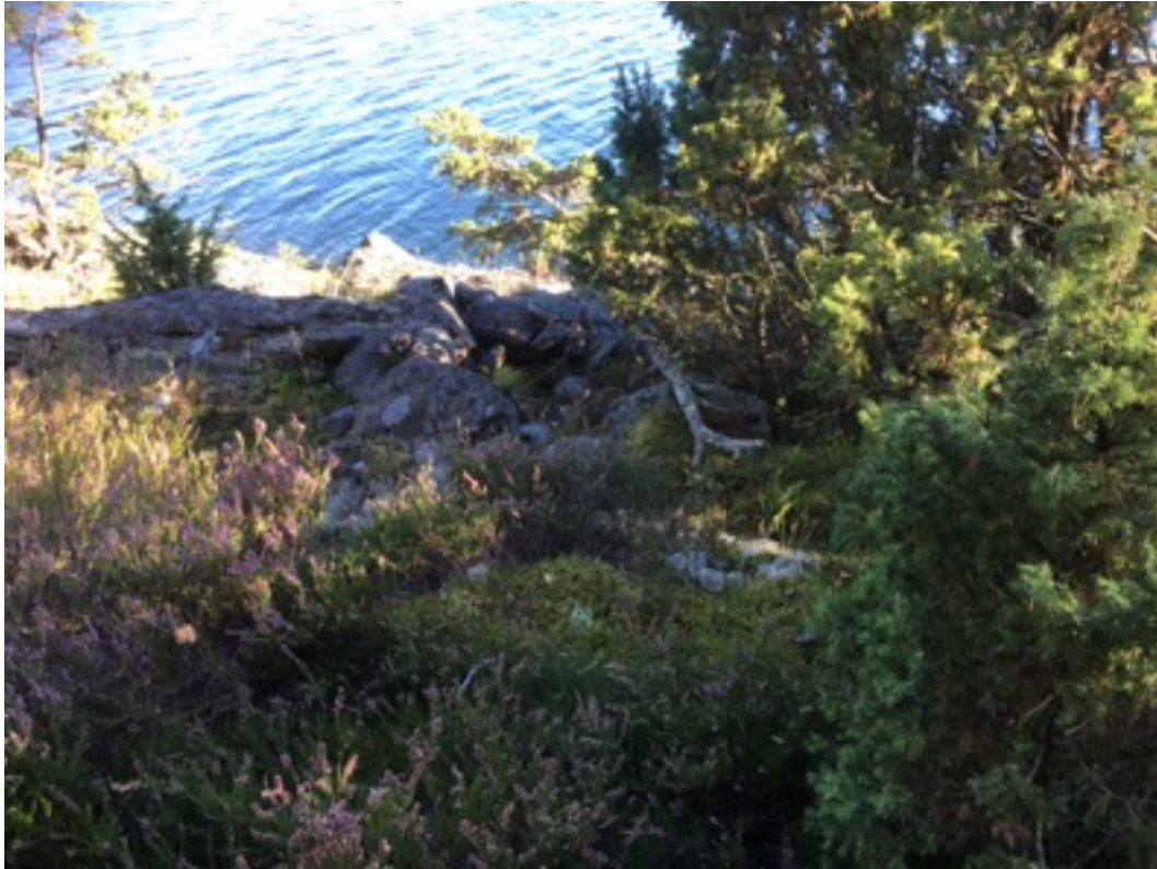
Kuva: Ryssänuuni 6. Pohjoisesta. 8.9.2016.

Uuni 6 sijaitsee edellisestä noin viisi metriä länsilounaaseen kallion päällä. Etäisyyttä rantaan on noin 10 metriä, uuni sijaitsee osittain katajikon sisällä. Uunin koko on 1,5 x 2 metriä ja korkeus noin 0,3 metriä. Uunin suuaukko on länsilounaaseen.