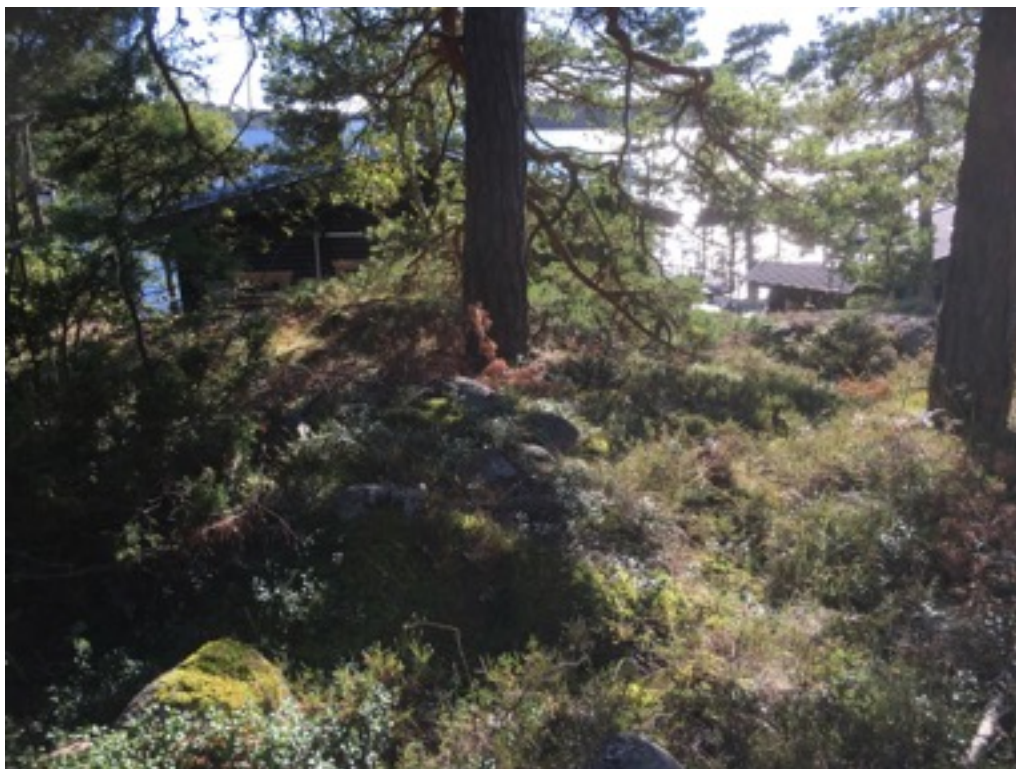
Kuva: Ryssänuuni 15 männyn juurella. Mökki taustalla. Idästä.

Uuni 15 sijaitsee kesämökistä noin 15 metriä itään. Uunin koko on 1,5 x 2 metriä, korkeus 0,5 metriä. Uuni on lähes kauttaaltaan sammalen, varpujen ja jäkälän peitossa. Uunin suuaukkoa ei varmuudella pysty havaitsemaan.