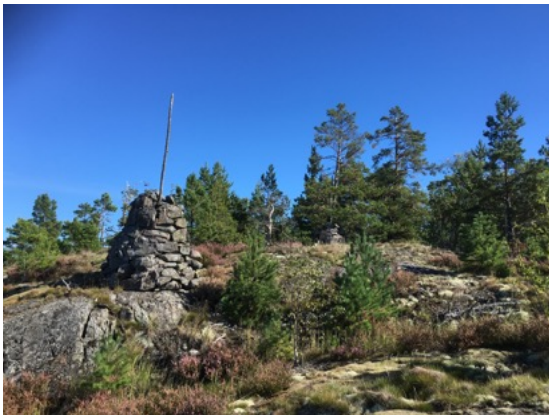
Kuva: Kummelit mereltä päin nähtynä. Lännestä. 8.9.2016.

Itäisempi kummeli on rauennut, sillä sen juurella kasvaa mänty, jonka juurakko on hajoittanut kummelia. Nykyisellään kummelin korkeus on noin 1,2 metriä ja halkaisija juurelta noin 1,5 metriä. Kummelin laella on maalaamaton puusalko (karsittua puuta), joka nousee noin kolmen metrin korkeuteen ja nojaa vanhaan mäntyyn (jonka juurakko on hajoittanut kummelia).