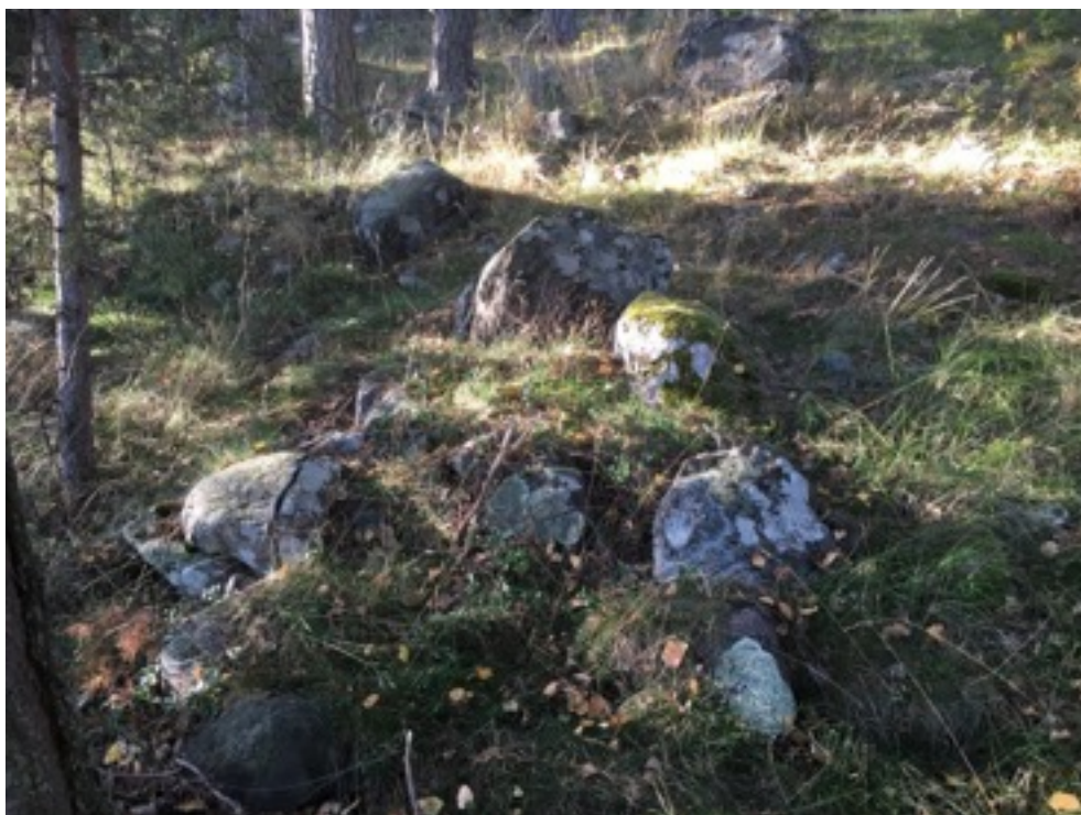
Kuva: Ryssänuuni 10 rannasta päin. Etelästä. 8.9.2016. Jouni Taivainen.

Uuni 10 sijaitsee edellisestä noin kaksi metriä länteen. Uunin pohjoispäässä eli ylärinteen puolella on maakivi, jonka edustalle uuni on rakennettu. Uunin mitat ovat 1,5 x 2 metriä, korkeus 0,4 metriä. Suuaukko on merelle eli etelään päin.