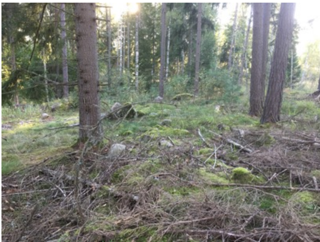
Kuva: Kiviaita. Koillisesta. 10.9.2016.

Kohdekuvaus: Kohde löytyi inventoinnissa 10.9.2016. Kyseessä on kiviaita, jonka leveys on noin kaksi ja pituus 15 metriä, korkeus on 0,4 metriä. Aita on lähes kokonaan sammalen peittämä. Ympäristön metsä on kuusivaltaista sekametsää loivassa lounaisrinteessä ja aidan lounaispuolella rehevämpää sekä kosteampaa lehtimetsää. Vuoden 1966 peruskartassa alue on merkitty metsäksi. Paikalla lienee joskus ollut pelto tai niitty, jonka reunaan kivet on aitamaisesti raivattu.