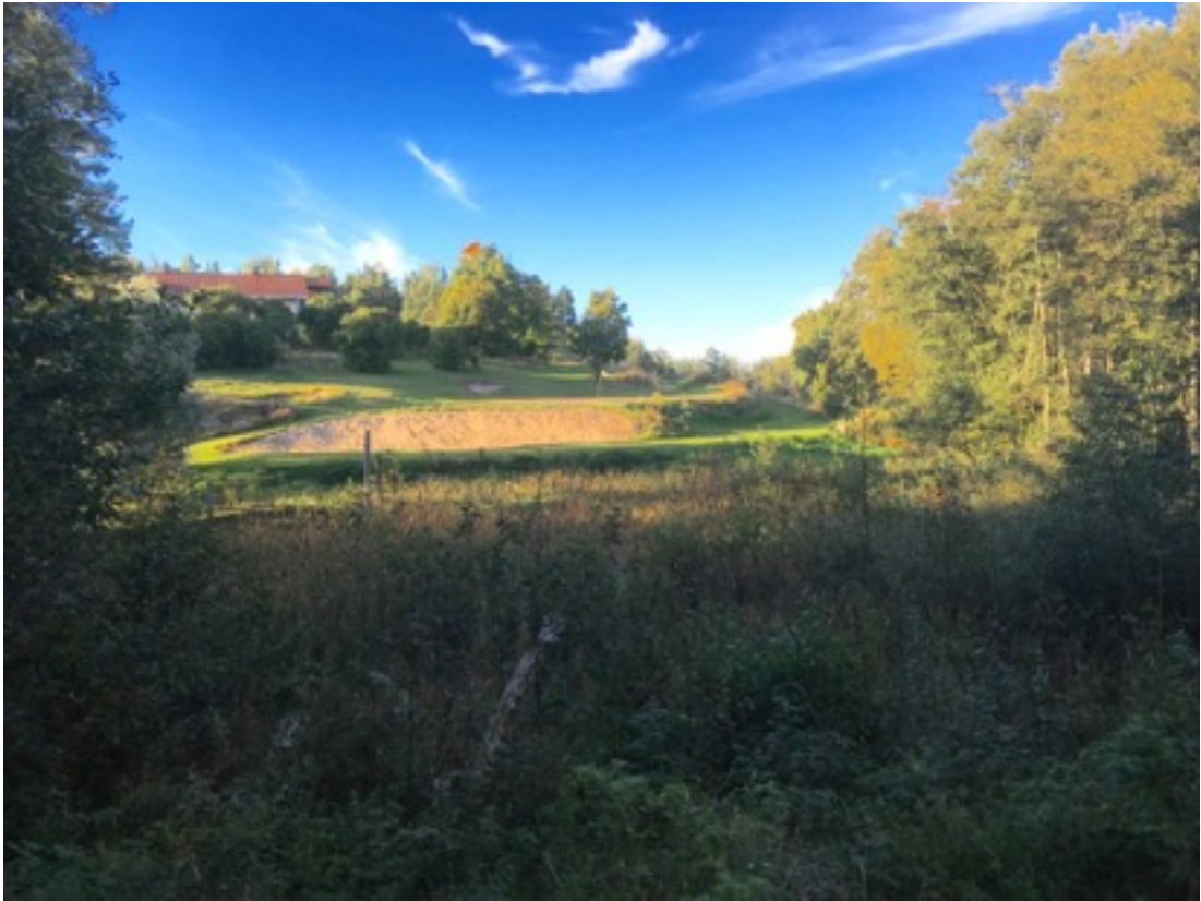
Kuva: Mellangårdin päärakennus. Etelästä. 10.9.2016.