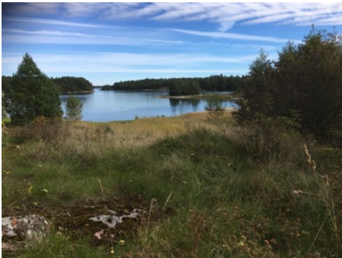
Kuva: Kiviperustuksen 2 tulisija erottuu kuvan keskellä kumpareena. Luoteesta. 9.9.2016.

Kiviperustus 2 jakaantuu kahteen osaan. Koillispäässä tulisijan yhteydessä on noin 5 x 5 metrin yhtenäinen peruskiveys, jonka korkeus vaihtelee rinteeseen mukaan 0,5-0,8 metrin välillä ja leveys puolen-metrin välillä. Lounaispäässä peruskiveys (noin 5 x 8 metriä) on harvempaa ja sitä on oikeastaan vain nurkkien ja päädyn alueella sekä perustuksen sisäosassa. Maa viettää tällä kohtaa alemmas, joten rakennus lienee ollut lattiastaan irti maasta (yksittäisten kivien varassa). Kyseessä lienee päärakennuksen jäännös.