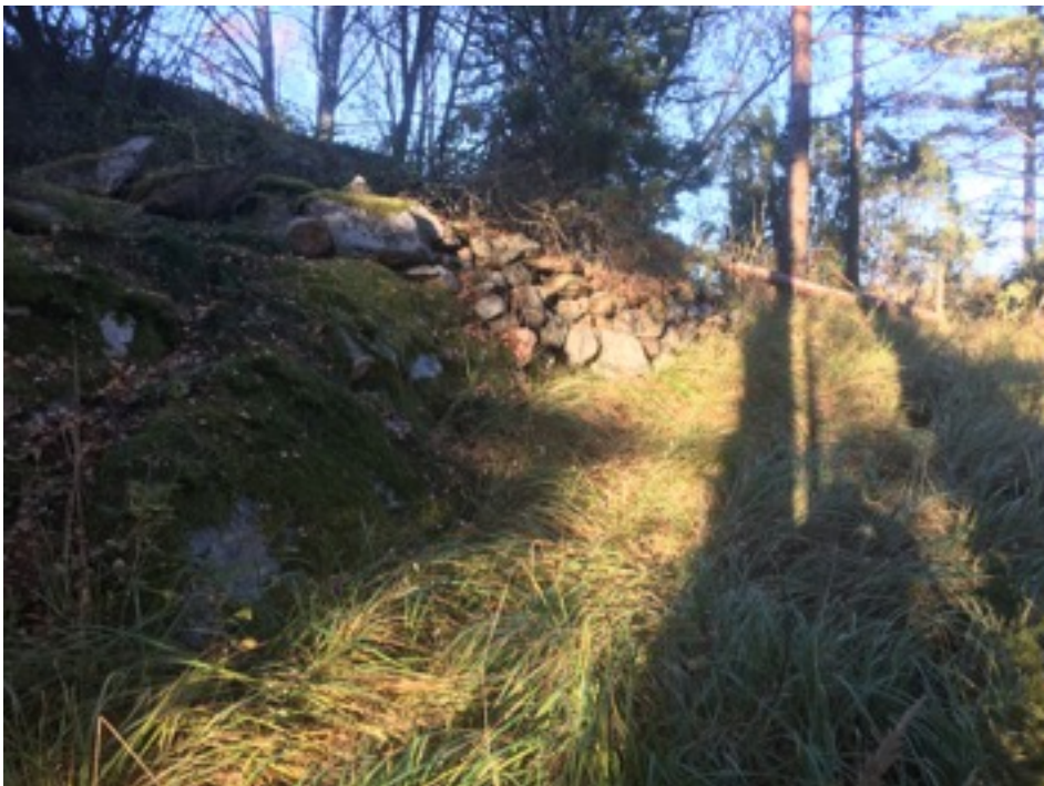
Kuva: Pengerrystä. Lounaasta. 5.10.2016.

Kivipengerrys on tehty kallion eteläreunaan, ehkä tien tai polun pohjaksi. Se on itä-länsi -suuntainen ja pituudeltaan noin 20 metriä. Pengerryksen korkeus vaihtelee 0,3 - 1,5 metrin ja leveys 0,5 -1 metrin välillä.