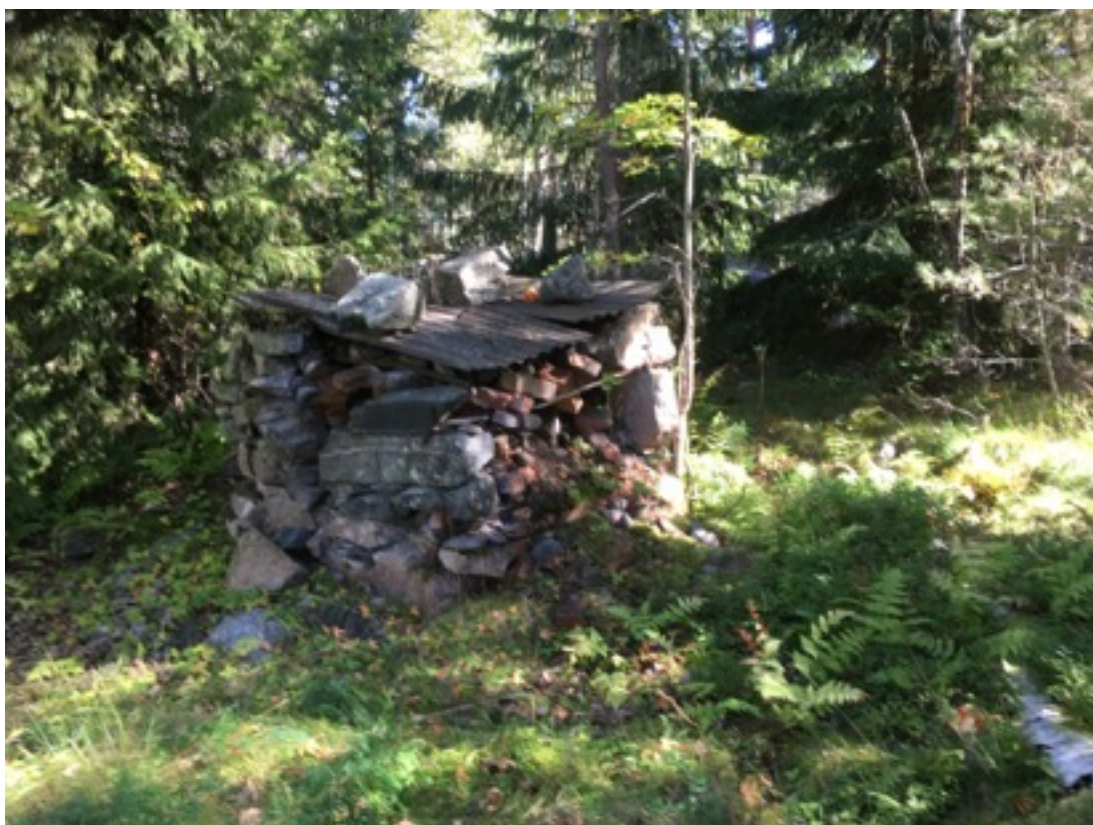
Kuva: Kiuas. Etelästä. 10.9.2016.

Kiuas sijaitsee noin kuusi metriä Uppgård -kiviaidasta länteen. Sen koko on 1,5 x 2 metriä ja korkeus reilun metrin. Sen päälle on pantu peltisuoja.