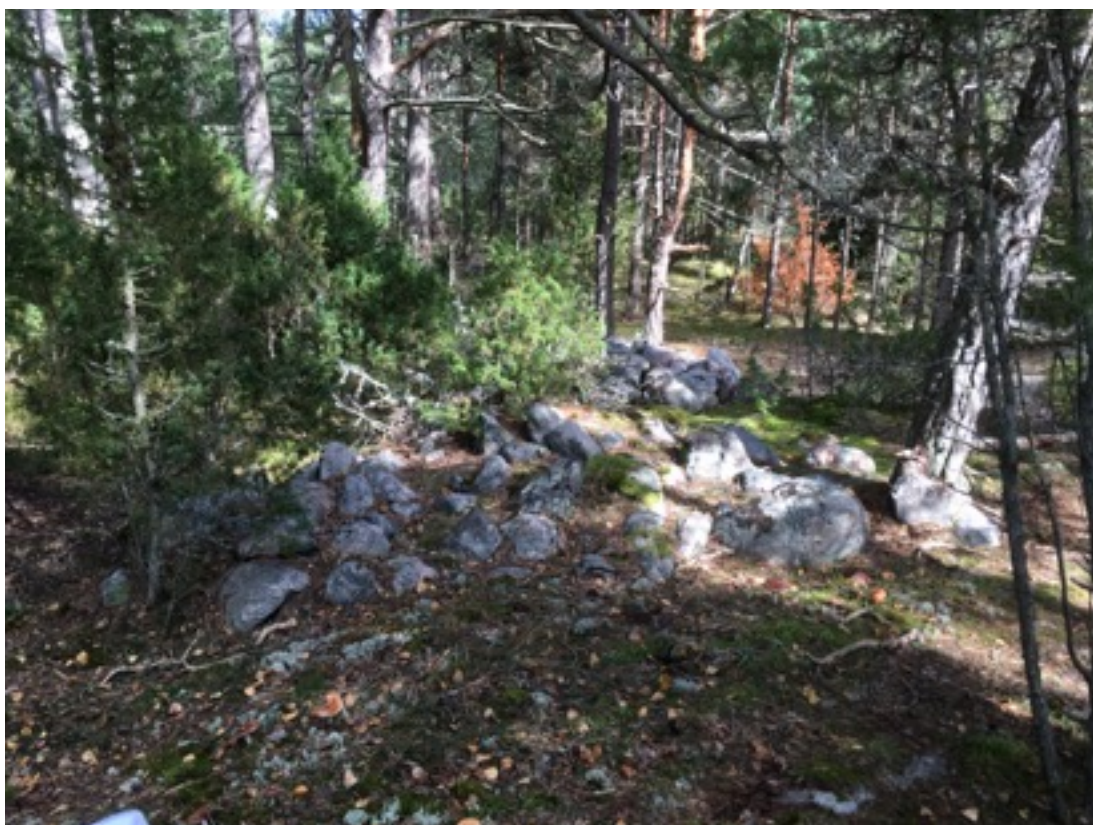
Kuva: Röykkiö. Lännestä. 7.9.2016. Jouni Taivainen.

Kohdekuvaus: Kohde havaittiin inventoinnissa 7.9.2016. Se sijaitsee kahden vanha pellon välisellä, pääasiassa mäntyä kasvavalla kallioalueella. Kyseessä on itä-länsisuuntainen röykkiö, jonka leveys on länsipäässä noin 3,5 metriä ja itäpäässä noin kaksi metriä. Röykkiön pituus on 7,5 metriä ja korkeus 0,5 metriä. Röykkiön kivet ovat sammalen ja jäkälän peitossa. Röykkiön länsipää vaikuttaa osittain hajotetulta, ehkä kaivellulta.