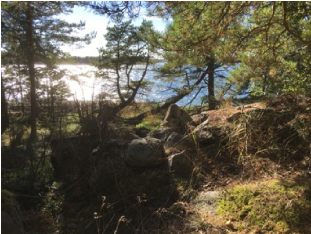
Kuva: Ryssänuuni 8. Idästä. 8.9.2016. Jouni Taivainen.

Uuni 8 sijaitsee kallion päällä, pienen jyrkänteen reunalla, noin 25 metriä rannasta. Uuni on kooltaan 1,5 x 2 metriä, korkeudeltaan noin 0,4 metriä. Suuaukkoa ei varmuudella pysty havaitsemaan.