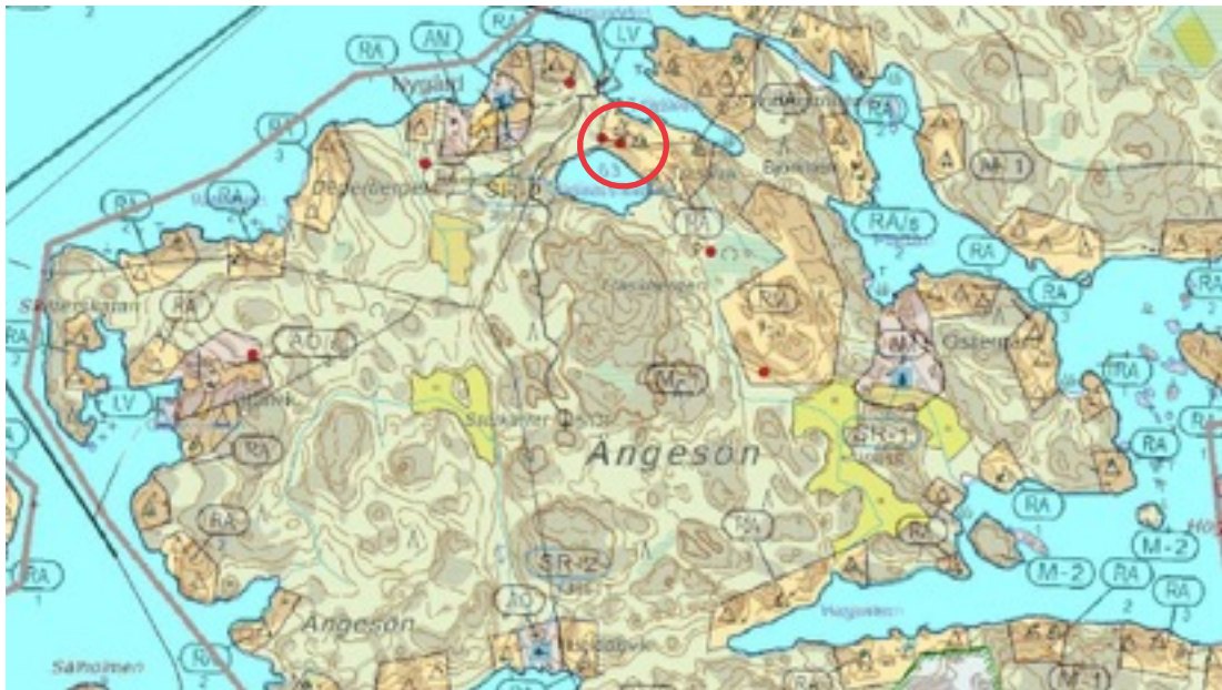
Karttaote: Träskars träsket 1. Pohjakartta Maanmittauslaitos. Kaavakartta Sweco Oy. Kartan käsittely Jouni Taivainen, Arkebuusi.