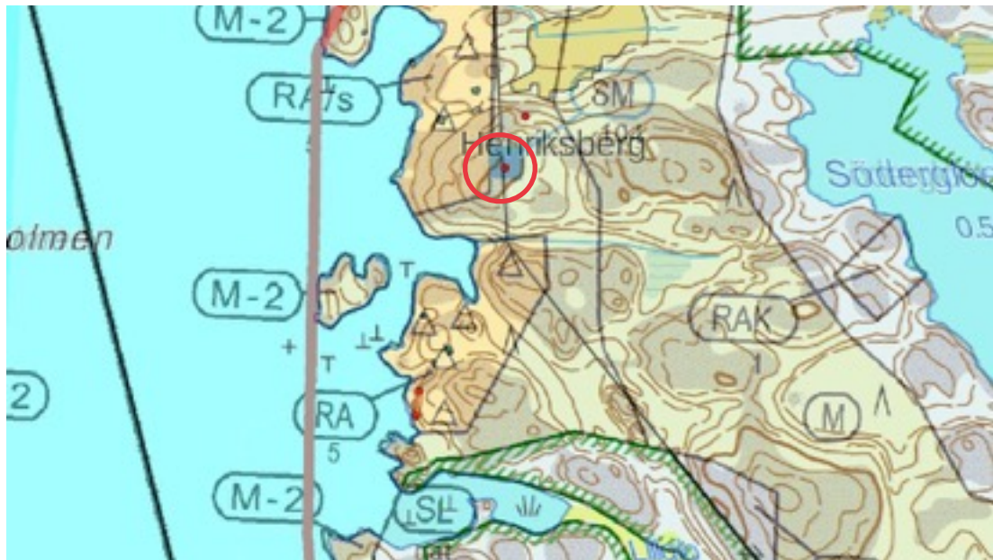
Karttaote: Henriksberg. Pohjakartta Maanmittauslaitos. Kaavakartta Sweco Oy. Kartan käsittely Jouni Taivainen, Arkebuusi.