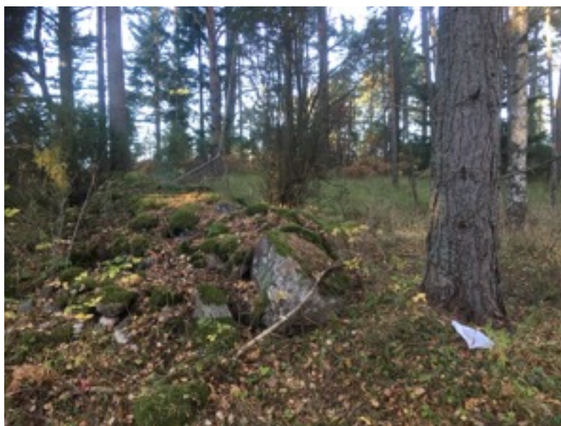
Kuva: Kiviaita 5. Etelästä. 5.10.2016.

Kiviaita 5 on oikeastaan aitamainen viljelyröykkiö, joka sijaitsee vanhan peltoalueen länsireunassa. Sen pituus on noin kahdeksan, leveys noin kaksi metriä ja korkeus noin 0,8 metriä.