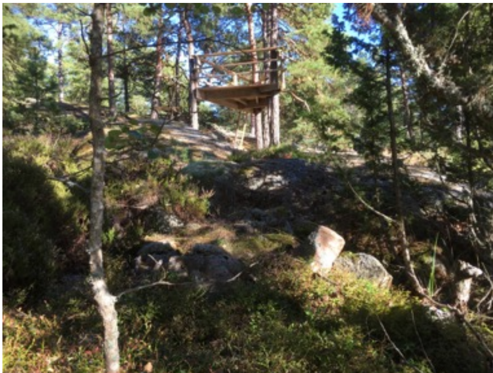
Kuva: Ryssänuuni 14 kallion juuressa, taustalla maja. Luoteesta. 8.9.2016. Jouni Taivainen.

Uuni 14 sijaitsee edellisestä noin kolme metriä lounaaseen. Uunin koko on 1 x 1,5 metriä, korkeus noin 0,4 metriä. Suuaukko on ehkä ollut luoteeseen.