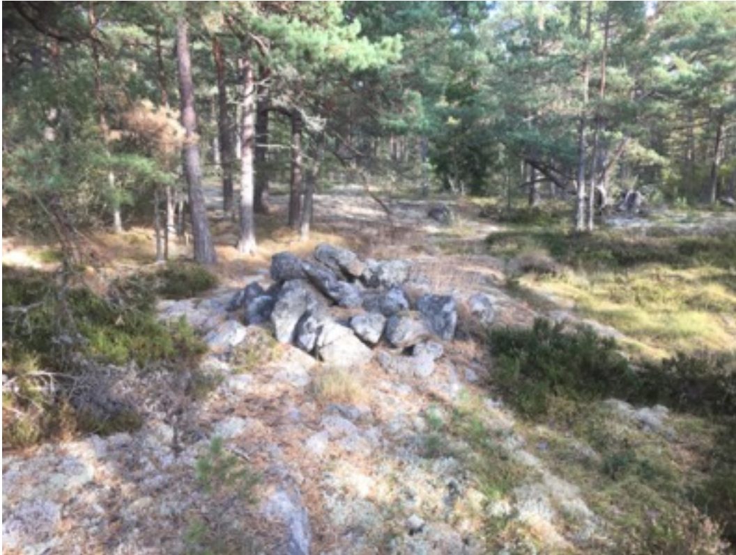
Kuva: Ryssänuuni 4 kallion laella. Lounaasta. 6.10.2016.

Uuni 4 sijaitsee kallion laella. Uunin koko on 2 x 2 metriä, korkeus 0,6 metriä. Uuni on romahtanut, suuaukko on lounaaseen.