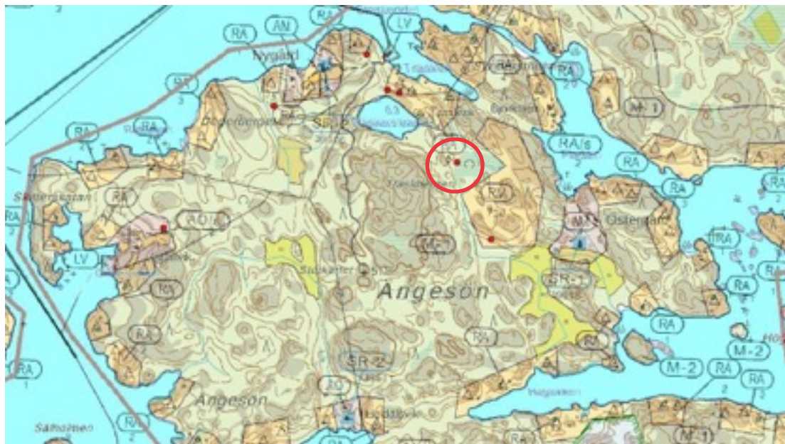
Karttaote: Träskbergen 1. Pohjakartta Maanmittauslaitos. Kaavakartta Sweco Oy. Kartan käsittely Jouni Taivainen, Arkebuusi.