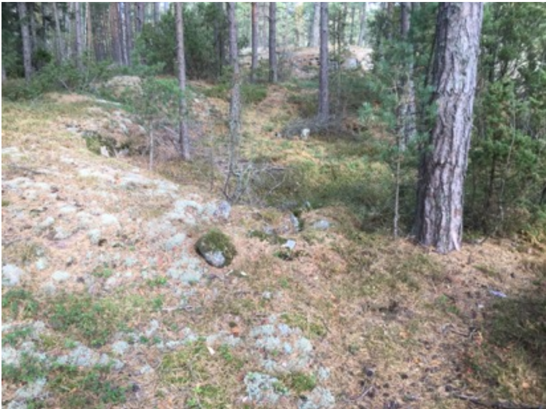
Kuva: Ryssänuuni nro 3. Taustalla venevaja. Luoteesta. 7.10.2016.

Uuni 3 sijaitsee venevajasta noin 25 metriä luoteeseen, kalliopohjalla. Se on rakennettu maakiviä hyväksi käyttäen. Uunin koko on 2,2 x 2 metriä, korkeus metrin. Uuni on romahtanut.