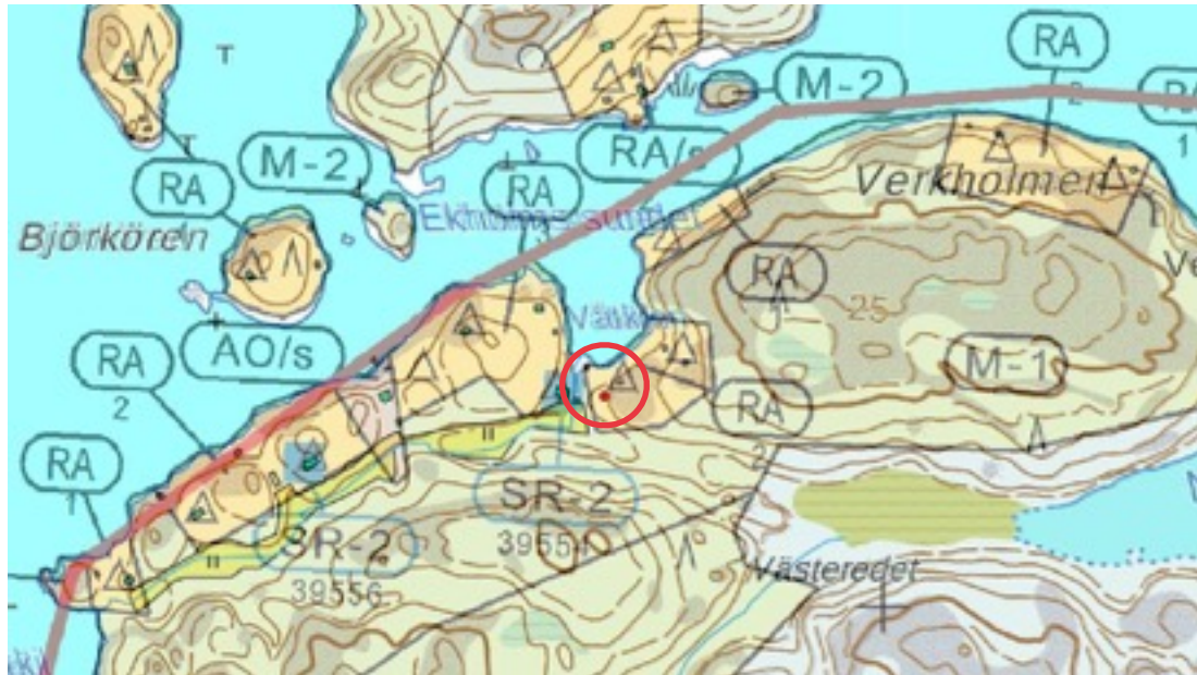
Karttaote: Våtkilen 1. Pohjakartta Maanmittauslaitos. Kaavakartta Sweco Oy. Kartan käsittely Jouni Taivainen, Arkebuusi.