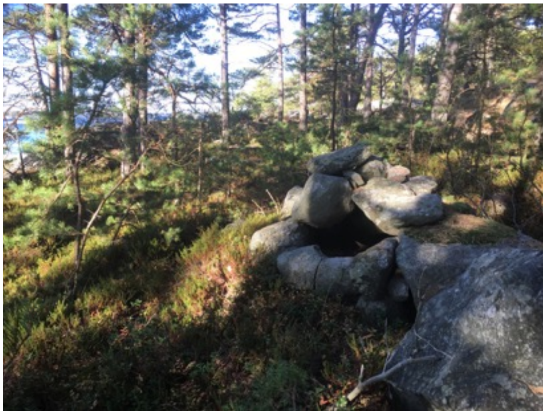
Kuva: Ryssänuuni nro 1. Kaakosta. 7.10.2016.

Uuni 1 sijaitsee noin 25 metriä rannasta. Uunin rakenne on täysin säilynyt. Uunin koko on 2 x 2 metriä, korkeus metrin. Uunin suuaukko on kaakkoon. Uuni on sisältä noin 0,7 metriä leveä ja metrin pitkä.