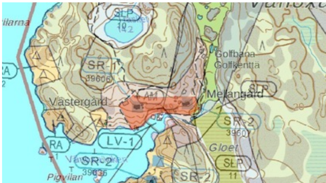
Karttaote: Vänoxa. Pohjakartta Maanmittauslaitos. Kaavakartta Sweco Oy. Kartan käsittely Jouni Taivainen, Arkebuusi.