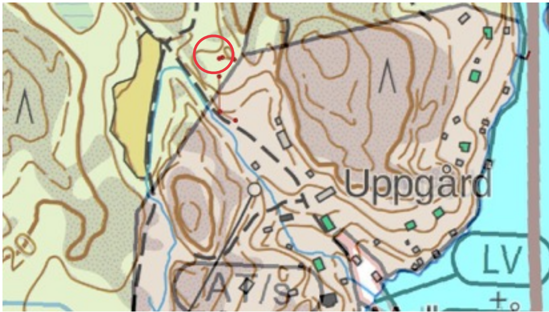
Karttaote: Uppgård 1. Pohjakartta Maanmittauslaitos. Kaavakartta Sweco Oy. Kartan käsittely Jouni Taivainen, Arkebuusi.