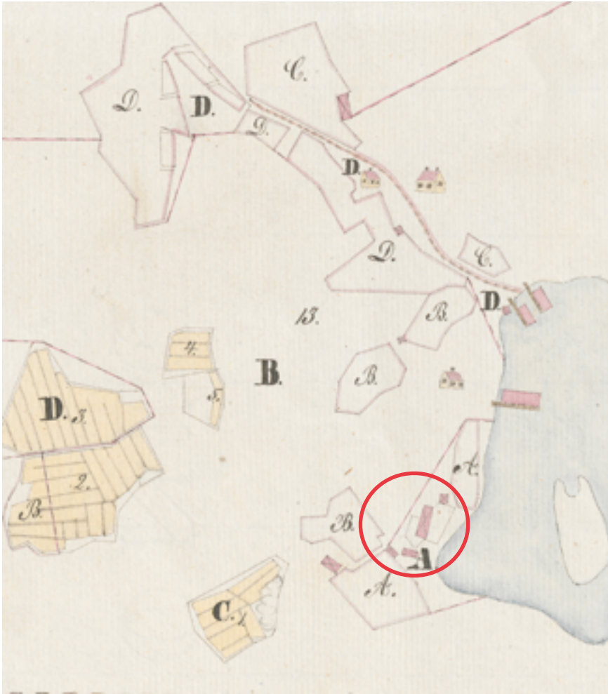
Karttaote: Vuoden 1834 Biskopsön sikopiiristä. Södergårdin tontti on ison A -kirjaimen kohdalla. ( Biskopsö_Sikopiirimaan_kartta_ja_jako-asiakirjat_1)