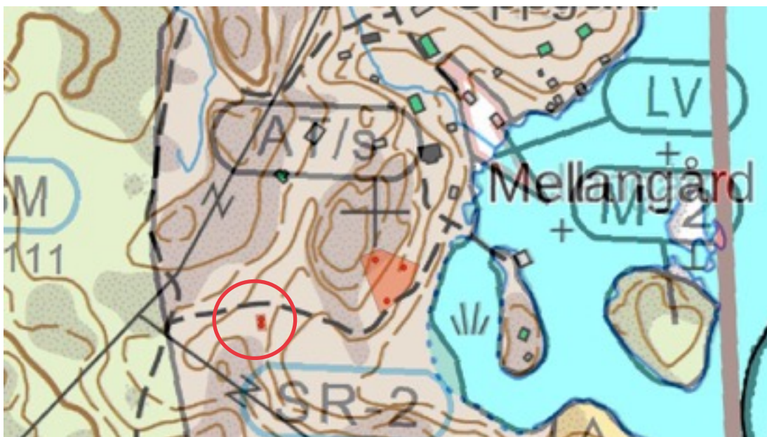
Karttaote: Nässkäta 1. Pohjakartta Maanmittauslaitos. Kaavakartta Sweco Oy. Kartan käsittely Jouni Taivainen, Arkebuusi.