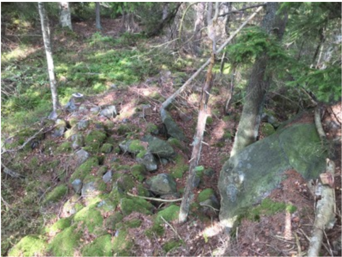
Kuva: Tulaseman jäännös ylhäältä kalliolta katsottuna. Idästä. 10.9.2016.