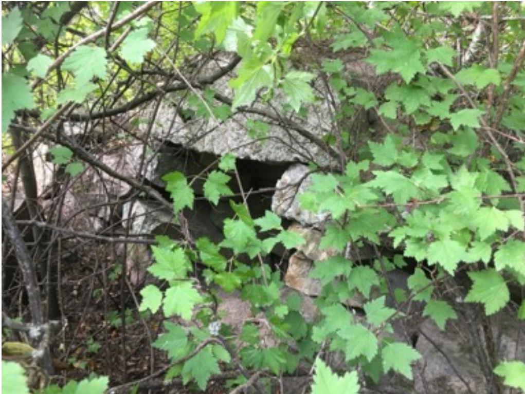
Kuva: Kellarin suuaukko. Kaakosta. 9.9.2016.