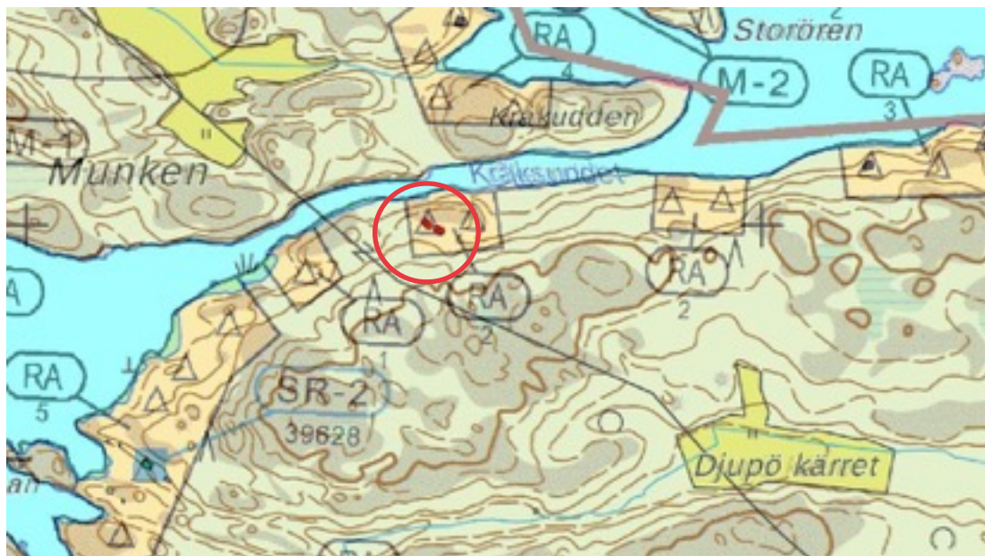
Karttaote: Kräksundet. Pohjakartta Maanmittauslaitos. Kaavakartta Sweco Oy. Kartan käsittely Jouni Taivainen, Arkebuusi.