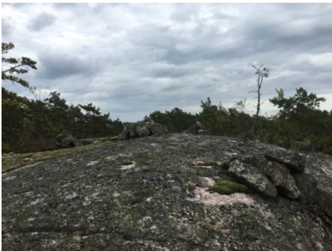
Kuva: Kivilatomukset kallion päällä. Lännestä. 10.9.2016.

Kohdekuvaus: Kyseessä on Långvikenin suun pohjoispuolinen korkea kalliomäki, jonka laella on neljä pientä kivilatomusta, joista yksi on keskimäinen ja kolme muuta ovat suunnilleen kolmion muodossa sen ympärillä noin 3 - 4 metrin välein. Latomusten halkaisija on noin metrin ja korkeus noin 0,3 -0,5 metriä. Kivet ovat jäkälöityneitä lohkareita. Latomusten tarkoitus jää hämärään peittoon. Merimerkkejä ne tuskin ovat pienen kokonsa vuoksi. Mikään tiedossa oleva rajakaan ei ole kallion laen kautta kulkenut.