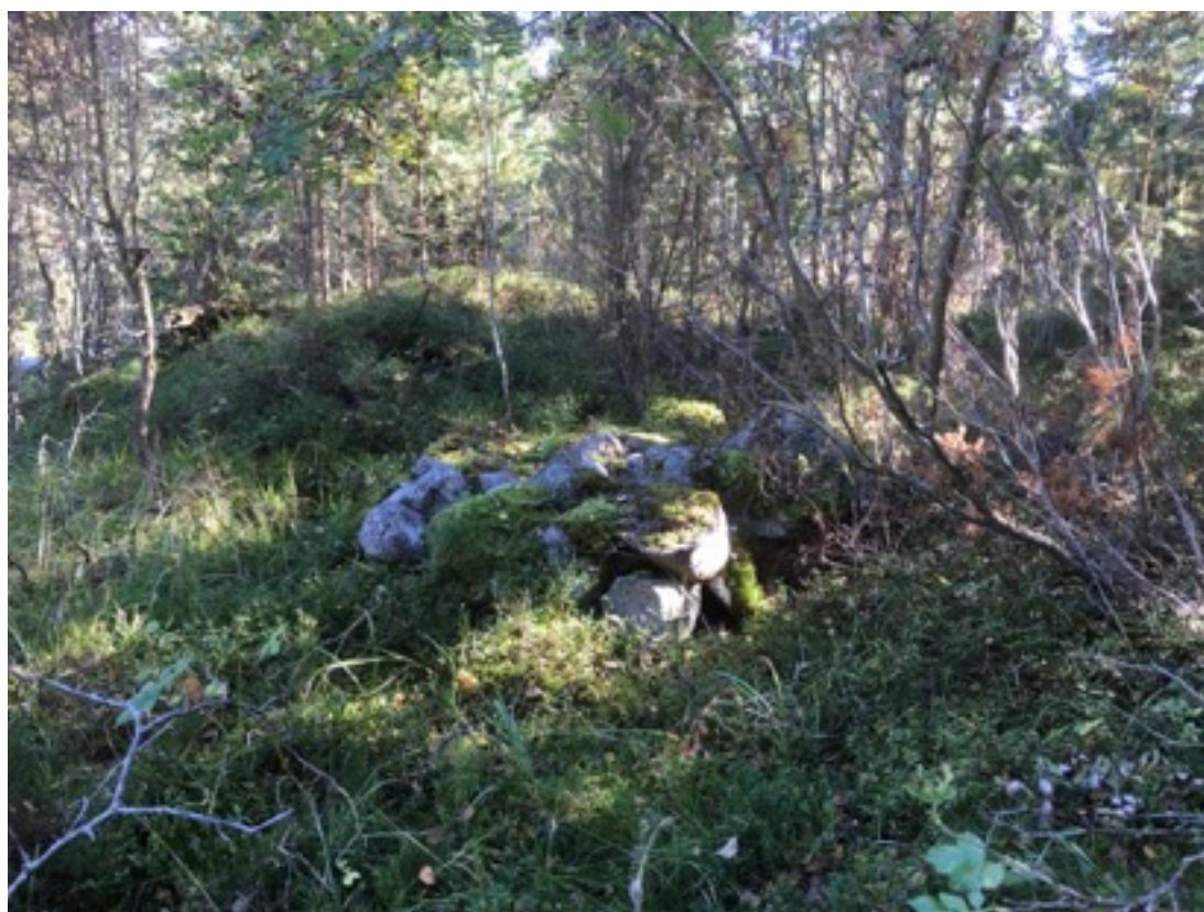
Kuva: Ryssänuuni nro 1. Kaakosta. 10.9.2016.

Ryssänuuni 1 on kooltaan 1,5 x 1,5 metriä ja korkeudeltaan 0,5 metriä. Uuni on romahtanut eikä sen suuaukkoa pystynyt varmuudella havaitsemaan.