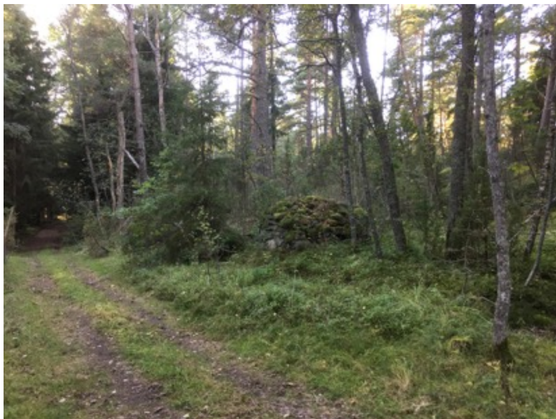
Kuva: Kiukaan jäännös metsätien oikealla puolella kuvan keskellä. Kaakosta. 7.9.2016.

Kyseessä lienee riihen tms. jäännös. Se lienee 1800-1900 -luvulta, vaikkakaan sitä ei ole merkitty enää vuoden 1968 peruskarttaan (Maanmittauslaitoksen digitaalinen kartta-aineisto/103413_201213_1968-2).