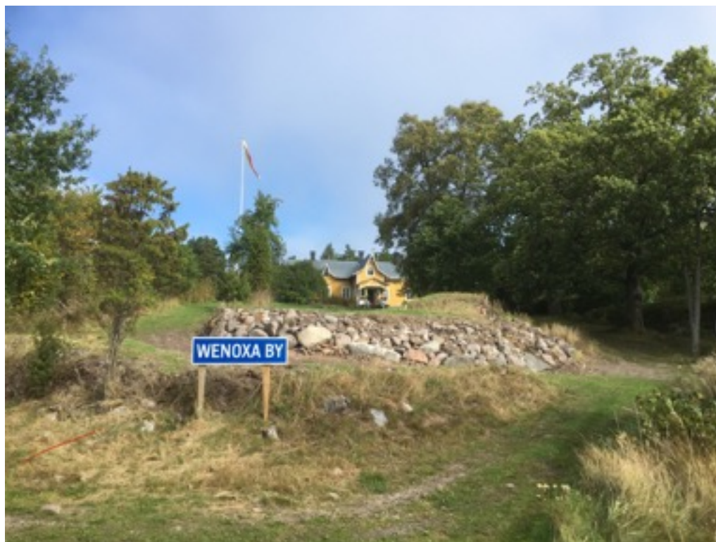
Kuva: Västergårdin päärakennus yhteysaluslaiturilta kuvattuna. Etelästä. 11.9.2016.

Inventointihavaintojen perusteella kylän alue on säilynyt hyvin. Oletettavasti maanalaiset kulttuurikerrokset ovat osittain tuhoutuneet myöhempien viemäri- ja sähkö yms. rakentamisten seurauksena. Rajaus on tehty kenttähavaintojen ja historiallisen kartta-aineiston perusteella.