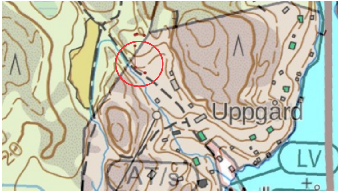
Karttaote: Uppgård 2. Pohjakartta Maanmittauslaitos. Kaavakartta Sweco Oy. Kartan käsittely Jouni Taivainen, Arkebuusi.