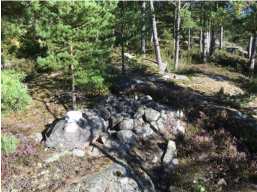
Kuva: Ryssänuuni 9. Luoteesta. 8.9.2016.

Uuni 9 on ladottu maakiven yhteyteen kalliolle, noin 10 metriä rannasta ja noin 40 metriä kesämökistä lounaaseen. Uunin koko on 1,5 x 2 metriä, korkeus 0,4 metriä. Suuaukko on etelään.