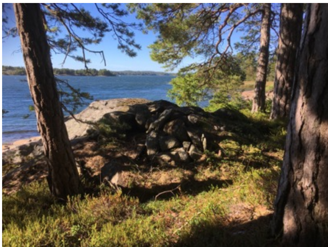
Kuva: Rantakallion ryssänuuni nro 1 kuvan keskellä. Idästä. 8.9.2016. Jouni Taivainen

Uuni nro 1 sijaitsee rantakalliolla männikössä, noin 10 metriä rannasta. Uunin leveys on noin 1,5 metriä, pituus kaksi ja korkeus puoli metriä. Uunin suu on etelään. Uunin rakenne on rauennut. Kivet ovat sammalen ja jäkälän peittämät.