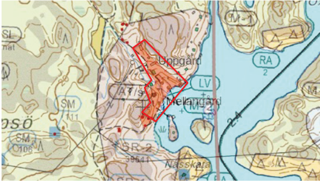
Karttaote: Biskopsö. Pohjakartta Maanmittauslaitos. Kaavakartta Sweco Oy. Kartan käsittely Jouni Taivainen, Arkebuusi.