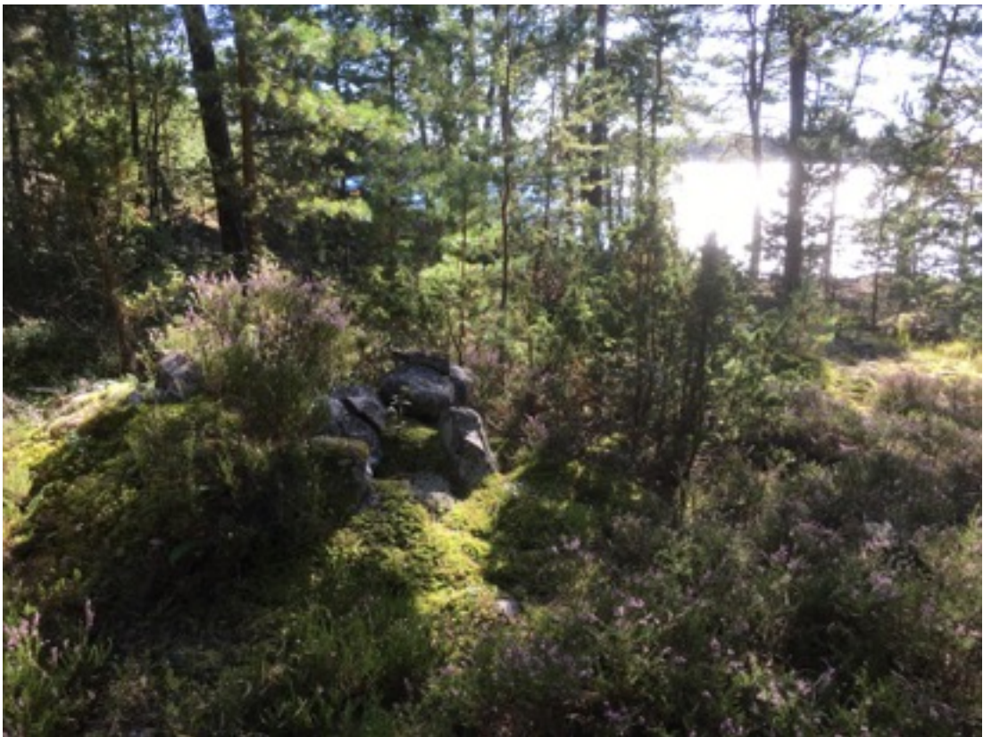
Kuva:Ryssänuuni 2 kuvan keskellä. Koillisesta. 8.9.2016.

Uuni 2 sijaitsee edellisestä noin kuusi metriä itään. Se on kooltaan 1,5 x 2 metriä, korkeudeltaan noin 0,4 metriä. Suuaukko on rantaan eli länteen päin.