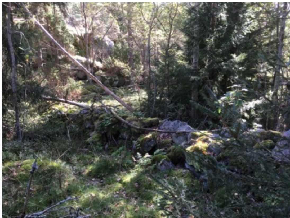
Kuva: Kiviaitaa keskivaiheilta. Luoteesta. 10.9.2016.

Aita on osittain rauennut, mutta pääpiirteissään hyvässä kunnossa. Aidan leveys on noin 1,5 metriä alaosasta ja metrin yläosasta. Aidan korkeus on noin metrin. Aita on suunnilleen kaakko-luode -suuntainen ja arviolta viitisenkymmentä metriä pitkä.