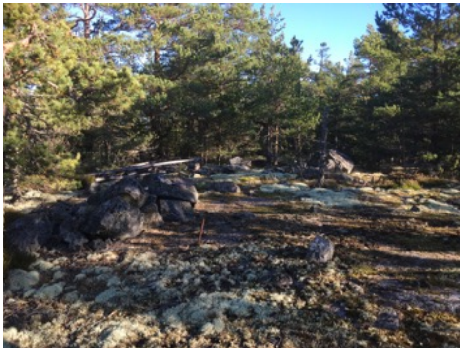
Kuva: Eteläisin latomus vasemmalla, sen edustalla toinen kiinnitysrauta. Etelästä. 7.10.2016.

Vaikea sanoa, lienevätkö kivikasat esim. hajonneiden kummelien jäännöksiä vai onko paikalla ollut joku muu merenkulkuun, viestintään tai maanmittaukseen liittynyt rakennelma. Joka tapauksessa se on pahoin hajonnut.