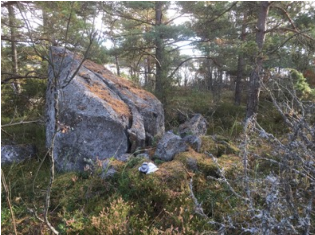
Kuva: Ryssänuuni 3 maakiven kyljessä. Luoteesta. 6.10.2016.

Uuni 3 on tehty ison maakiven länsikylkeen. Uunin koko on 1,2 x 2 metriä. Uuni on romahtanut, eikä suuaukon suuntaa varmuudella pysty määrittämään.