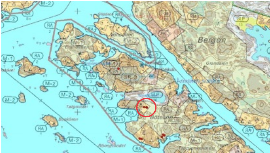
Karttaote: Botesöträsket 1. Pohjakartta Maanmittauslaitos. Kaavakartta Sweco Oy. Kartan käsittely Jouni Taivainen, Arkebuusi.