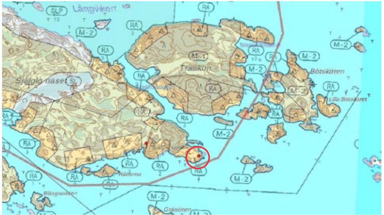
Karttaote: Själglödden 2. Pohjakartta Maanmittauslaitos. Kaavakartta Sweco Oy. Kartan käsittely Jouni Taivainen, Arkebuusi.