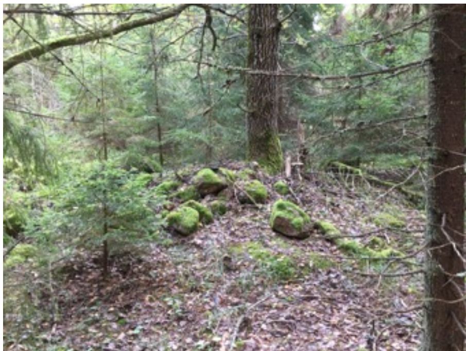
Kuva: Viljelyröykkiö 1. Kaakosta. 10.9.2016.

Viljelyröykkiö 1 sijaitsee vanhan peltoalueen reunassa, metsän puolella. Vanha peltoalue erottuu tasaisempaan maapohjana ja sitä kiertää maaton oja. Röykkiön halkaisija on noin 2,5 metriä ja korkeus noin 0,5 metriä. Röykkiön päällä kasvaa iso haapa. Röykkiöstä noin kaksi metriä pohjoiseen on itä-länsi -suuntainen kiviainan pätkä. Aidan leveys on noin 1,5 metriä, korkeus noin 0,5 metriä ja pituus noin viisi metriä.