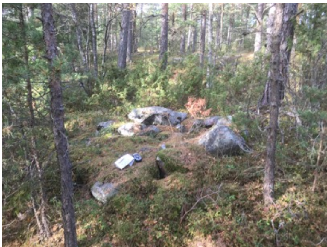
Kuva: Uuni 1. Kaakosta

Uuni 1 sijaitsee noin 20 metriä rannasta. Uunin mitat ovat 2 x 2,5 metriä, korkeus 0,6 metriä. Uuni on romahtanut, suuaukko on lounaaseen eli rantaan päin.