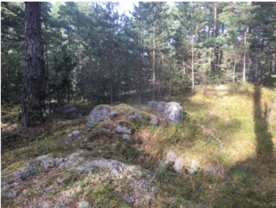
Kuva: Ryssänuuni 5 kallion laella. Etelästä. 6.10.2016.

Uuni 5 sijaitsee kallion laella, sen mitat ovat 2 x 2 metriä, korkeus 0,6 metriä. Uuni on romahtanut, eikä suuaukon suuntaa pysty varmuudella määrittämään.