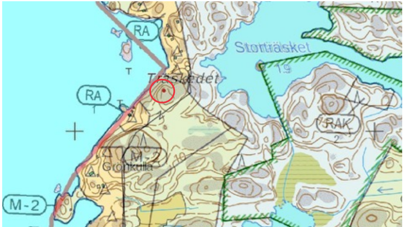
Karttaote: Träskedet 1. Pohjakartta Maanmittauslaitos. Kaavakartta Sweco Oy. Kartan käsittely Jouni Taivainen, Arkebuusi.