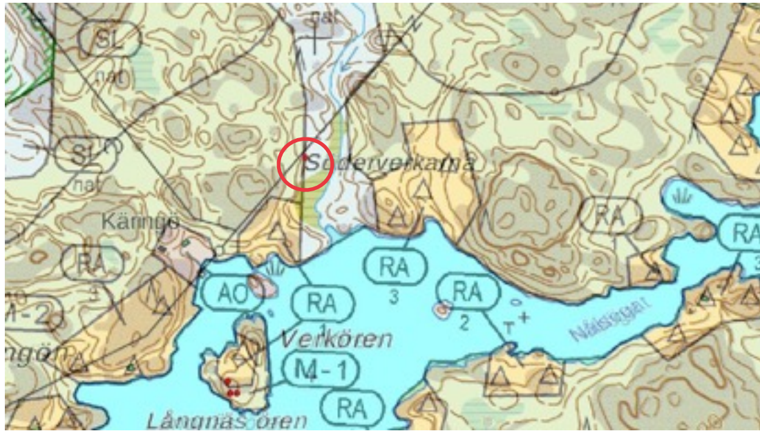
Karttaote: Söderverkarna 1. Pohjakartta Maanmittauslaitos. Kaavakartta Sweco Oy. Kartan käsittely Jouni Taivainen, Arkebuusi.