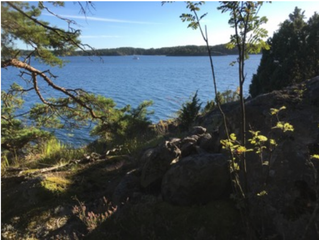
Kuva: Ryssänuuni 5. Pohjoisesta. 8.9.2016.

Uuni 5: Sijaitsee rantakalliolla, noin 10 metriä rannasta. Se on kasattu kallionreunaa hyväksi käyttäen. Uunin mitat ovat 1 x 1,5 ja korkeus 0,4 metriä. Suuaukko on etelään eli merelle päin.