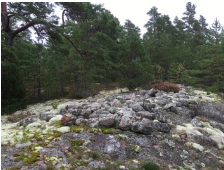
Kuva: Kivirakenne. Koillisesta. 10.9.2016.

Inventoinnissa 10.9.2016 kohde oli täysin ennallaan.1