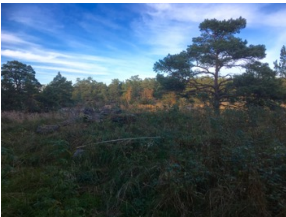
Kuva: Perustus kuvan keskellä. Valkoinen mitta on perustuksen eteläkiveyksellä. Etelästä 6.10.2016.

Kyseessä on jonkin 1800- tai 1900 -luvun alkupuolen rakennuksen, ehkä torpan jäännös.