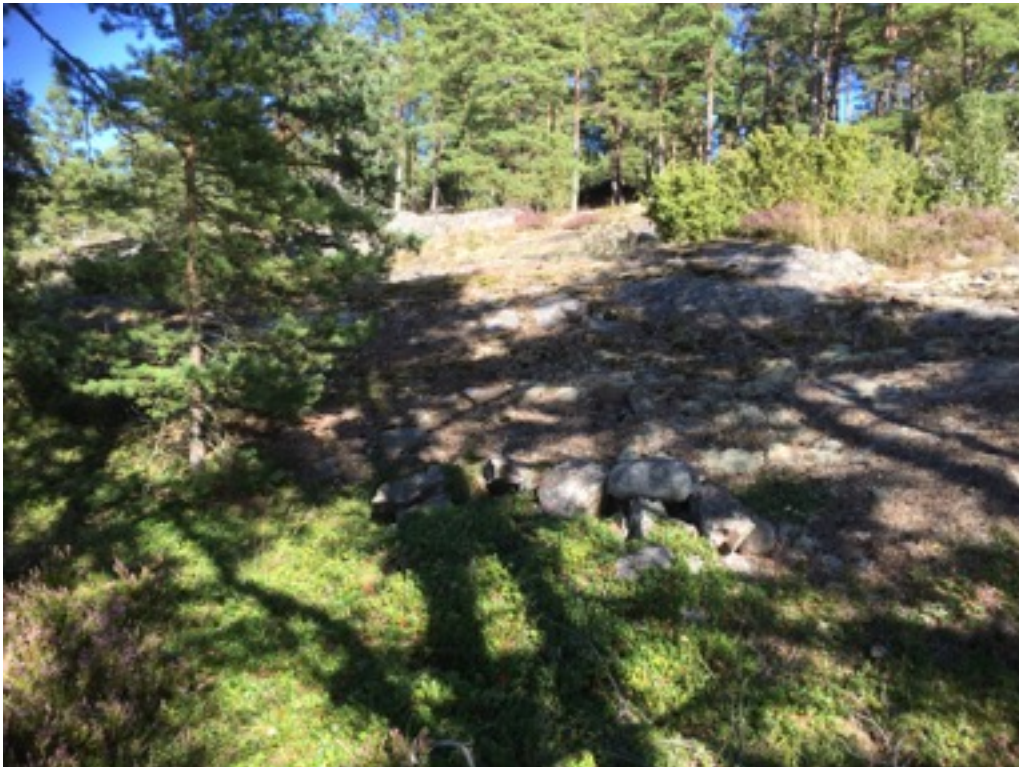
Kuva: Ryssänuuni 5 kallion reunassa. Lounaasta. 8.9.2016. Jouni Taivainen

Uuni 5 sijaitsee kallion reunassa ja on kooltaan 1,5 x 2 metriä, korkeudeltaan noin 0,3 metriä. Uuni on täysin rauennut. Kivet ovat jäkälöitynieta ja osin varpujen peitossa. Suuaukkoa ei pysty erottamaan.