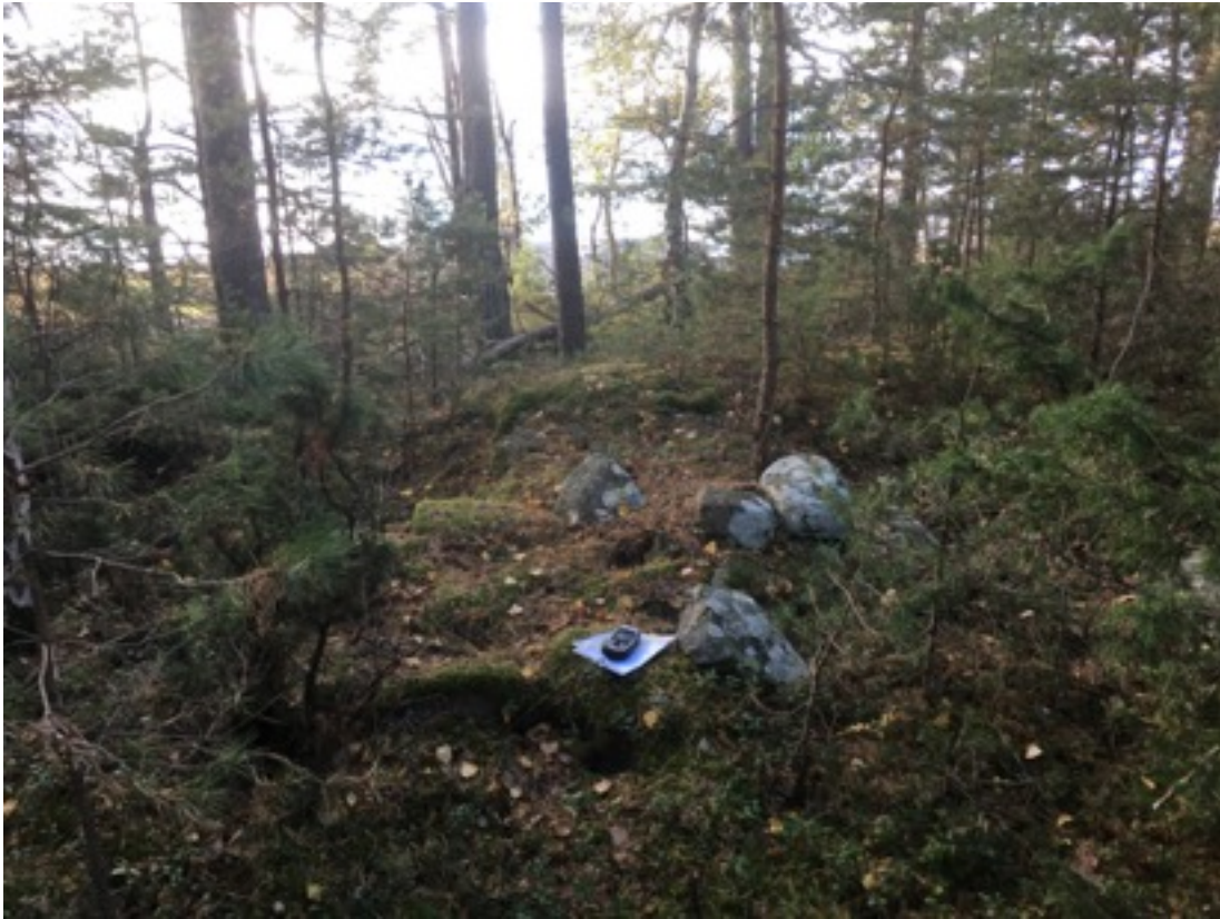
Kuva: Ryssänuuni nro 2. Koillisesta. 7.10.2016.