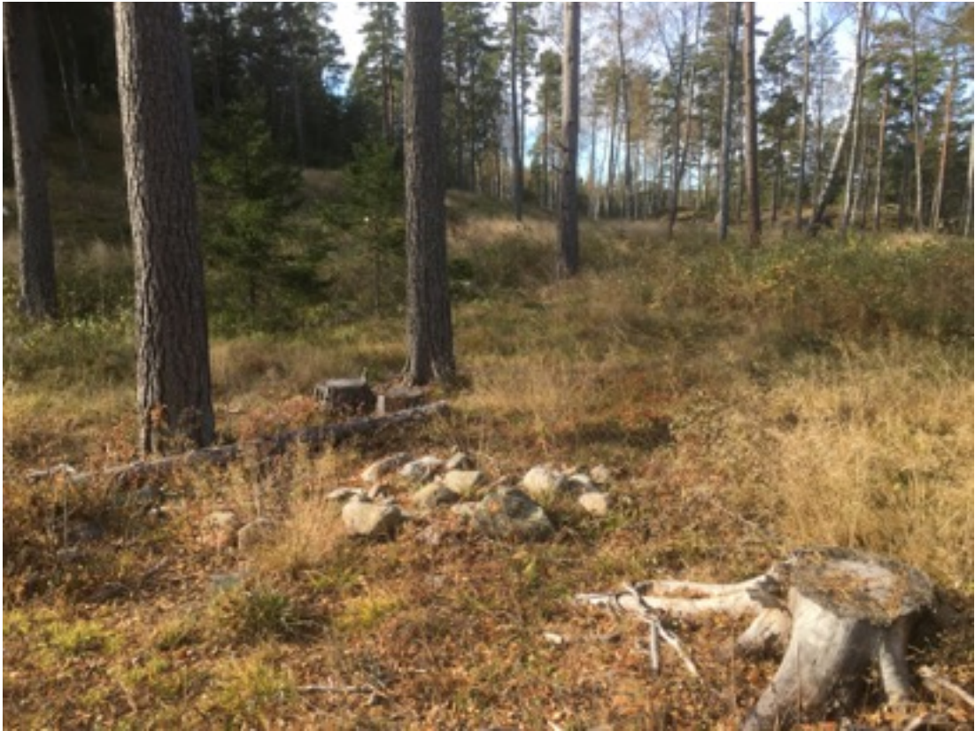
Kuva: Eteläisin, eli viljelyröykkiö nro 4. Taustalla vanhoja mäntyjä ja etualalla männyn kanto. Koillisesta. 6.10.2016.