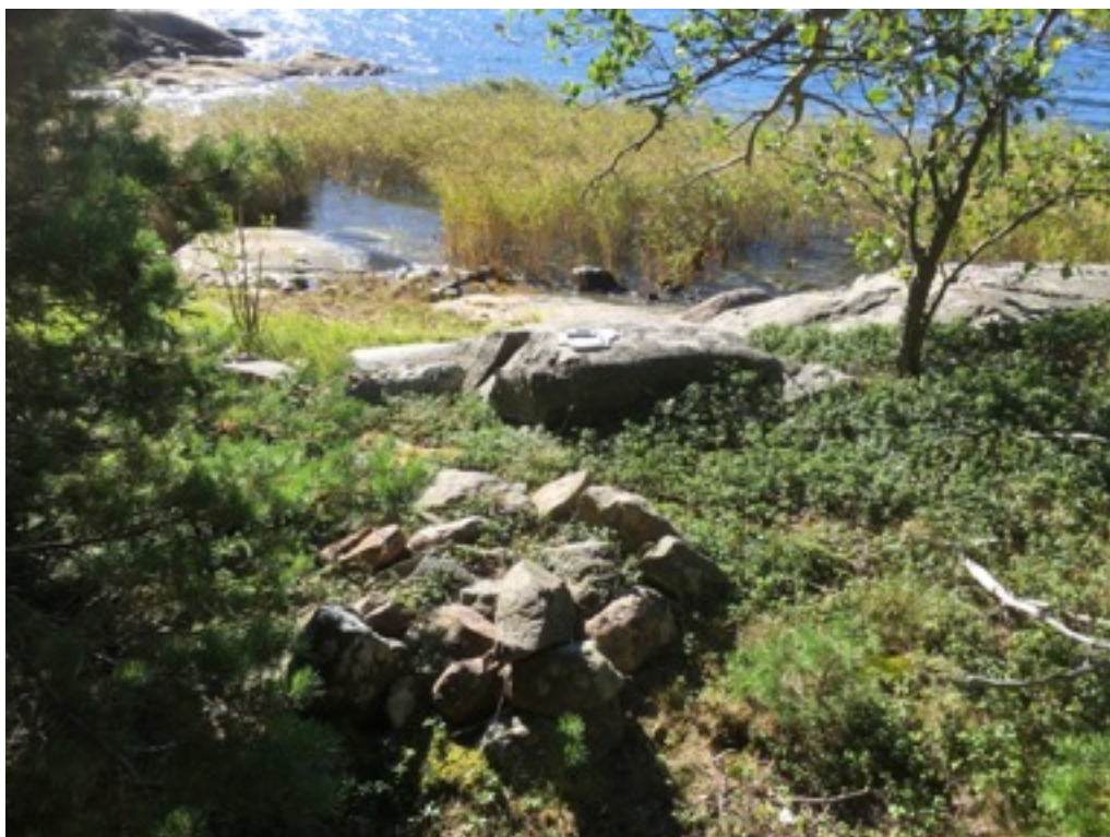
Kuva: Ryssänuuni nro 3. Koillisesta. 8.9.2016.

Uuni nro 3 sijaitsee edellisistä noin 20 metriä etelään kalliopohjalla, noin 5 metriä rannasta. Uunin koko on 1,5 x 2 metriä, korkeus noin 0,4 metriä. Uunin suu on etelään. Uunin rakenne on rauennut ja se on varpujen sekä sammalen peittämä.