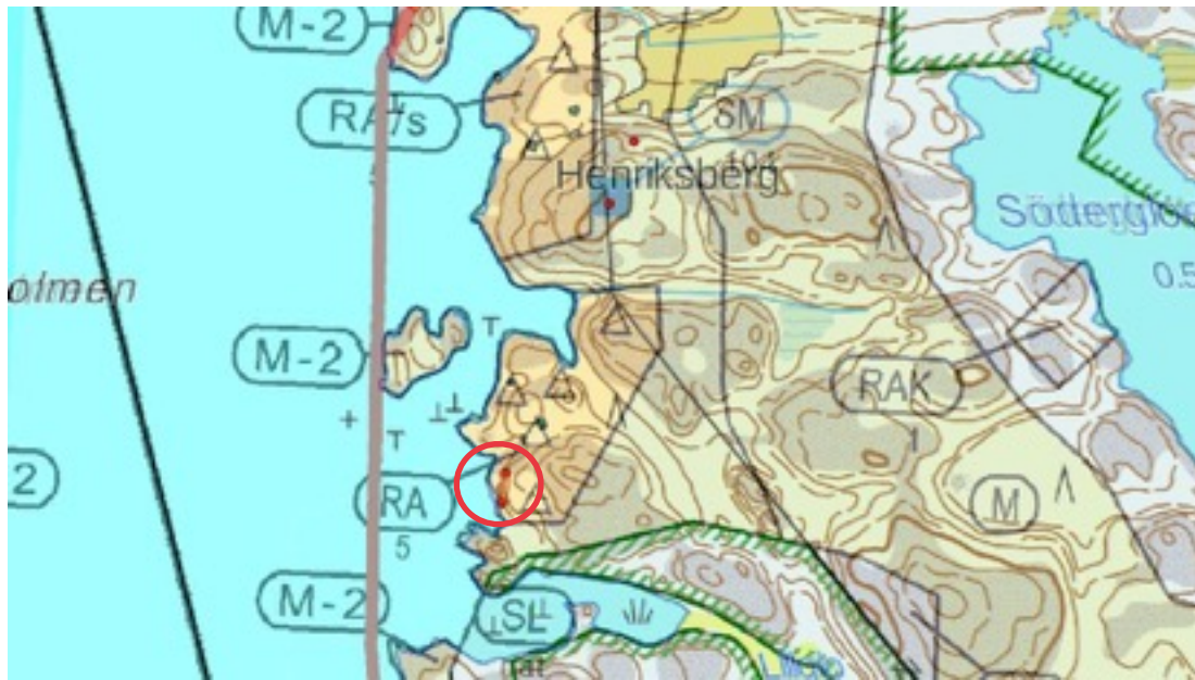
Karttaote: Lillglo 1. Pohjakartta Maanmittauslaitos. Kaavakartta Sweco Oy. Kartan käsittely Jouni Taivainen, Arkebuusi.