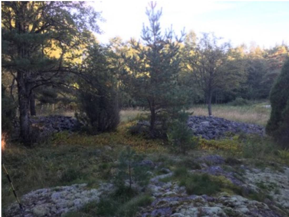
Kuva: Viljelyröykkiöt 1 ja 2. Länneestä. 10.9.2016.