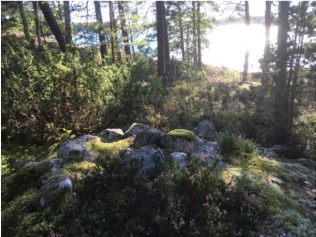
Kuva: Ryssänuuni 1 kuvan keskellä. Koillisesta. 8.9.2016. Jouni Taivainen

Uuni 2 sijaitsee edellisestä noin kuusi metriä itään. Se on kooltaan 1,5 x 2 metriä, korkeudeltaan noin 0,4 metriä. Suuaukko on rantaan eli länteen päin.