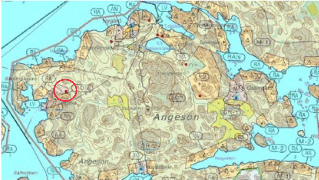
Karttaote: Grönvik. Pohjakartta Maanmittauslaitos. Kaavakartta Sweco Oy. Kartan käsittely Jouni Taivainen, Arkebuusi.