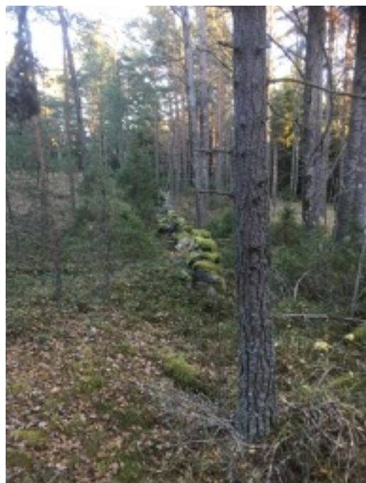
Kuva: Kiviaita 1. Lännestä. 5.10.2016.

Kiviaita 1 sijaitsee mäentörmän yläreunalla, vanhan peltoalueen pohjoisreunassa. Se on itä-länsi -suuntainen. Aidan pituus on noin 30 metriä, korkeus noin 0,5-1 metriä ja leveys saman verran.