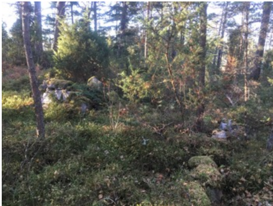
Kuva: Tulisijan jäännös vasemmalla. Kiviperustusta erottuu oikealla. Kaakosta. 5.10.2016.

Kiviperustus sijaitsee suunnilleen alueen keskellä mäkien suojassa. Kyseessä on yksinkertainen luonnonkiviperustus, jonka koko on 5 x 5 metriä. Perustuksen suunta on suunnilleen etelä-pohjoinen ja tulisijan jäännös on sen luoteisnurkassa. Oviaukon sijaintia ei pysty varmuudella sanomaan. Tulisijan koko on 1,6 x 1,6 metriä, korkeus 0,9 metriä, suuaukko on itään. Perustuksen päällä olleesta rakennuksesta ei ole mitään jäljellä. Perustuksen itäreunasta oli hiljattain poistettu hieman sammalta ja sen juuressa oli tuore kaivelujälki. Vaikuttaa siltä, että joku on ollut paikalla metallinpaljastimen kanssa etsimässä "aarteita".