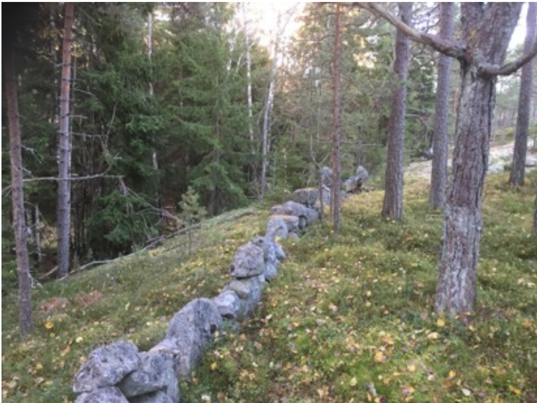
Kuva: Kiviaita 2. Kaakosta. 5.10.2016.

Kiviaita 2 on vanhan peltoalueen länsipuolisella kalliolla. Se on pituudeltaan noin 30 metriä ja suunnilleen kaakko-luode -suuntainen. Aidan korkeus vaihtelee 0,5 - 1 metrin välillä, kuten leveyskin. Aidan kulku on polveileva ja se on tehty kokonaan kallion päälle.