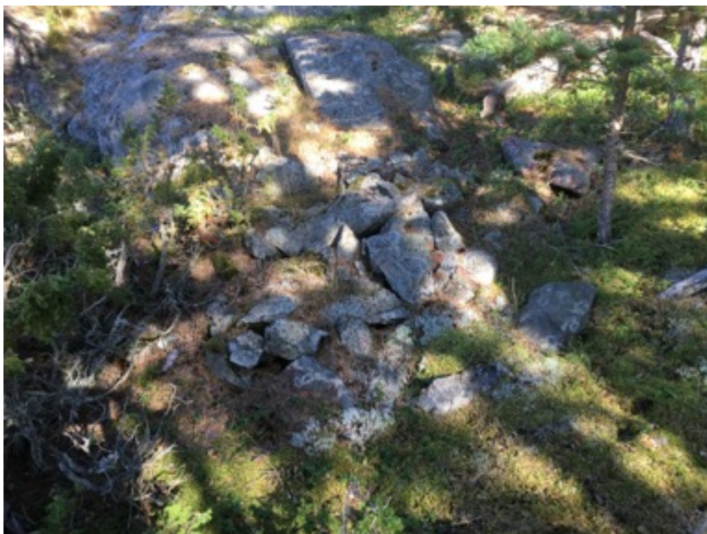
Kuva: Ryssänuuni nro 2. Länneestä. 8.9.2016. Jouni Taivainen

Uuni nro 2 sijaitsee edellisestä noin seitsemän metriä itään hieman korkeammalla. Uunin mitat ovat 1,3 x 1,3 metriä, korkeus noin 0,3 metriä. Uunin suu on lounaaseen eli alarinnettä kohti. Uunin rakenne on rauennut, mutta edelleen hahmotettavissa.