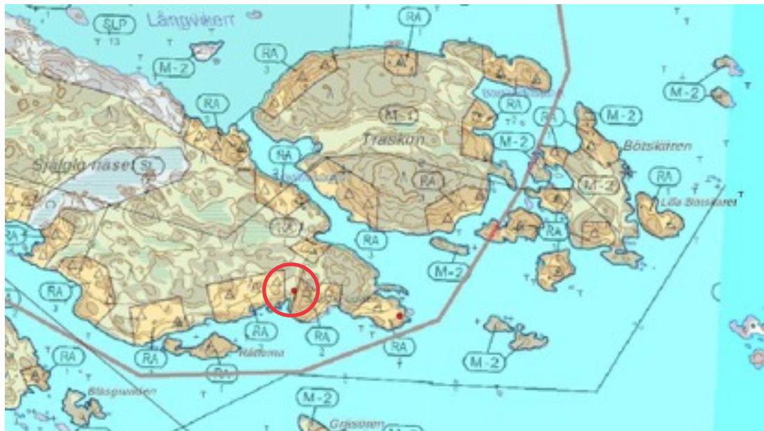
Karttaote: Själgödden 1. Pohjakartta Maanmittauslaitos. Kaavakartta Sweco Oy. Kartan käsittely Jouni Taivainen, Arkebuusi.