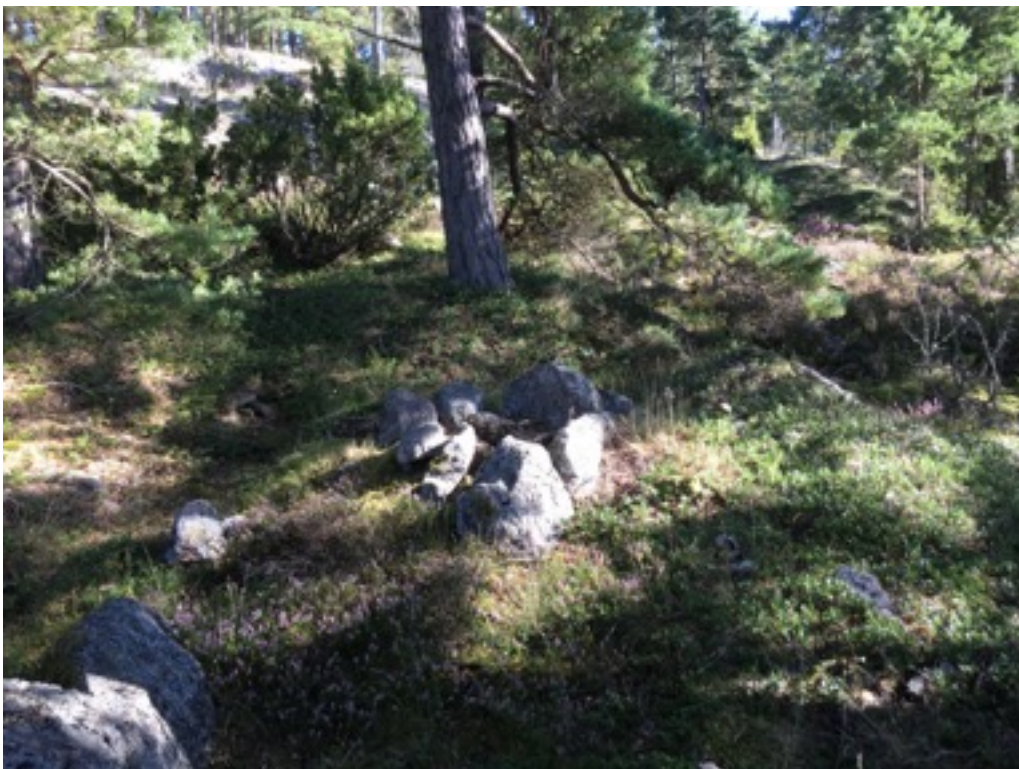
Kuva: Ryssänuuni 6 kalliolla. Lännestä. 8.9.2016.

Uuni 6 sijaitsee kalliopohjalla, noin 20 metriä rannasta. Uunin koko on 1,5 x 2 metriä, korkeus noin 0,4 metriä. Suuaukko on pohjoiseen.