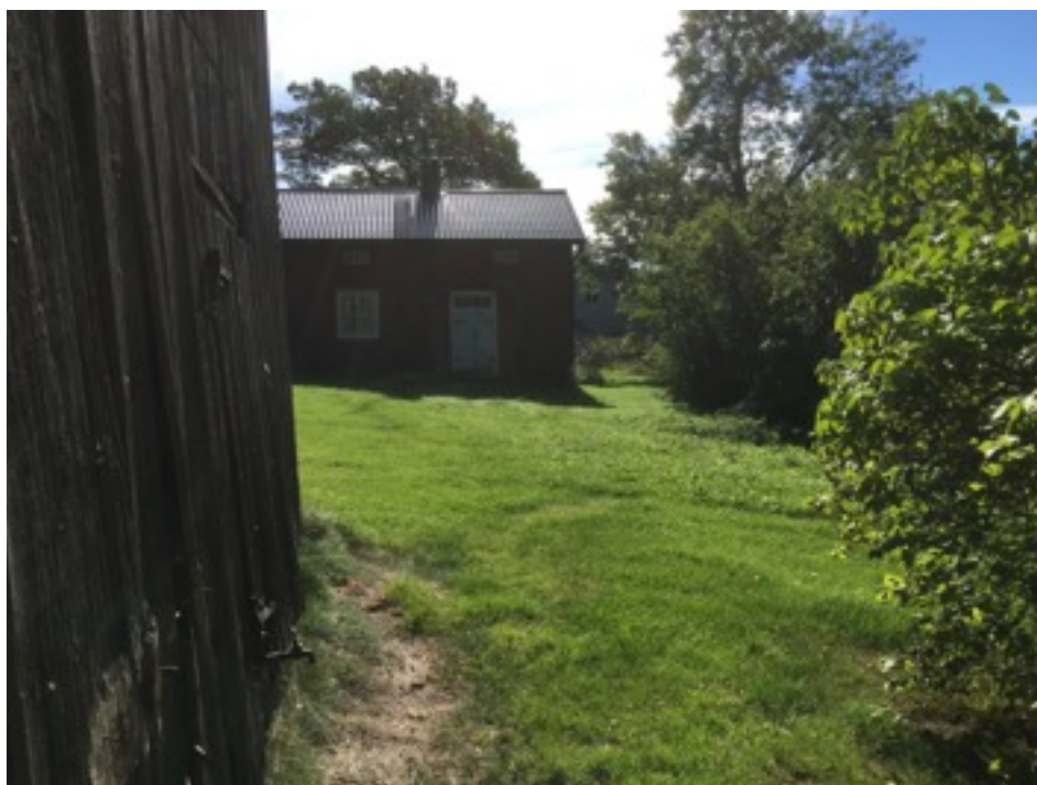
Kuva: Näkymä kylätontilta Uppgårdin alueelta. Luoteesta. 9.9.2016. Jouni Taivainen.

Inventointihavaintojen perusteella kylän alue on säilynyt hyvin. Oletettavasti maanalaiset kulttuurikerrokset ovat osittain tuhoutuneet myöhempien viemäri- ja sähkö yms. rakentamisten seurauksena. Rajaus on tehty kenttähavaintojen ja historiallisen kartta-aineiston perusteella.