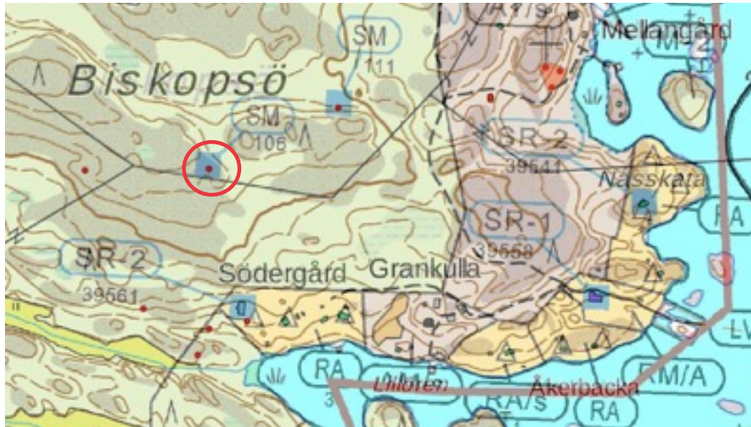
Karttaote: Hiittinen Biskopsö. Pohjakartta Maanmittauslaitos. Kaavakartta Sweco Oy. Kartan käsittely Jouni Taivainen, Arkebuusi.