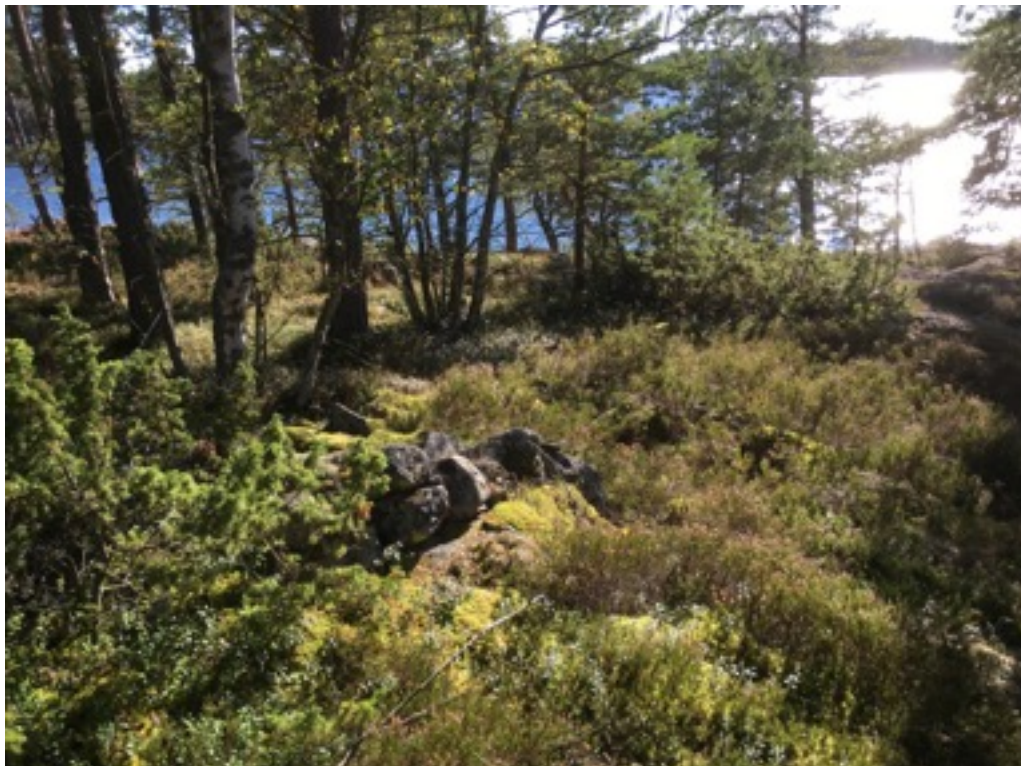
Kuva: Ryssänuuni 10. Luoteesta. 8.9.2016. Jouni Taivainen.

Uuni 10 sijaitsee kalliopohjalla ja on kooltaan 1,7 x 2 metriä, korkeudeltaan 0,6 metriä. Suuaukko on rantaan eli länteen päin.