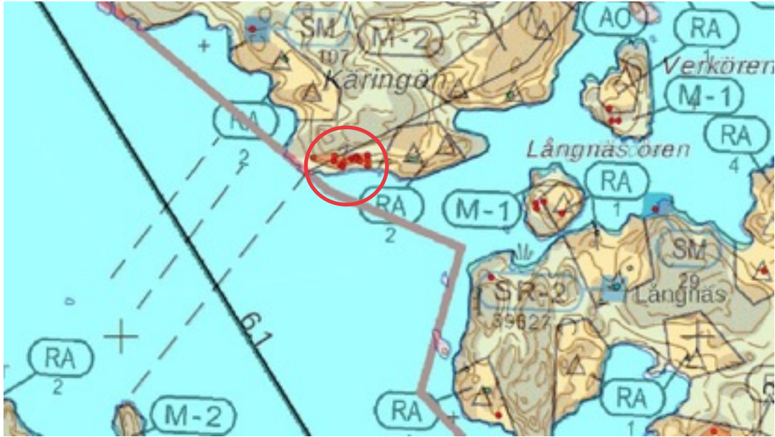
Karttaote: Karingön 1. Pohjakartta Maanmittauslaitos. Kaavakartta Sweco Oy. Kartan käsittely Jouni Taivainen, Arkebuusi.