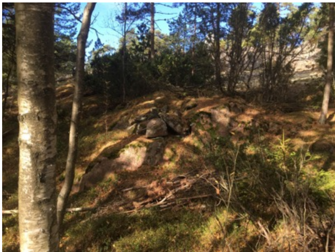
Kuva: Ryssänuuni nro 1 kallioseinällä, kuvattu mökkipolulta. Kaakosta. 7.10.2016.

Uuni 1 on tehty pienen kalliokielekkeen päälle. Uunin koko on 1,5 x 2 metriä, korkeus noin 0,8 metriä. Uuni on romahtanut. Suuaukko on ollut etelään.