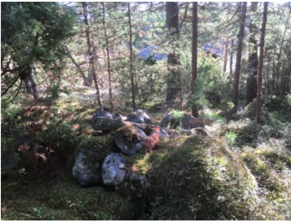
Kuva: Ryssänuuni nro 2 polun reunassa. Etelästä. 7.10.2016.

Uuni 3 sijaitsee venevajasta noin 25 metriä luoteeseen, kalliopohjalla. Se on rakennettu maakiviä hyväksi käyttäen. Uunin koko on 2,2 x 2 metriä, korkeus metrin. Uuni on romahtanut.