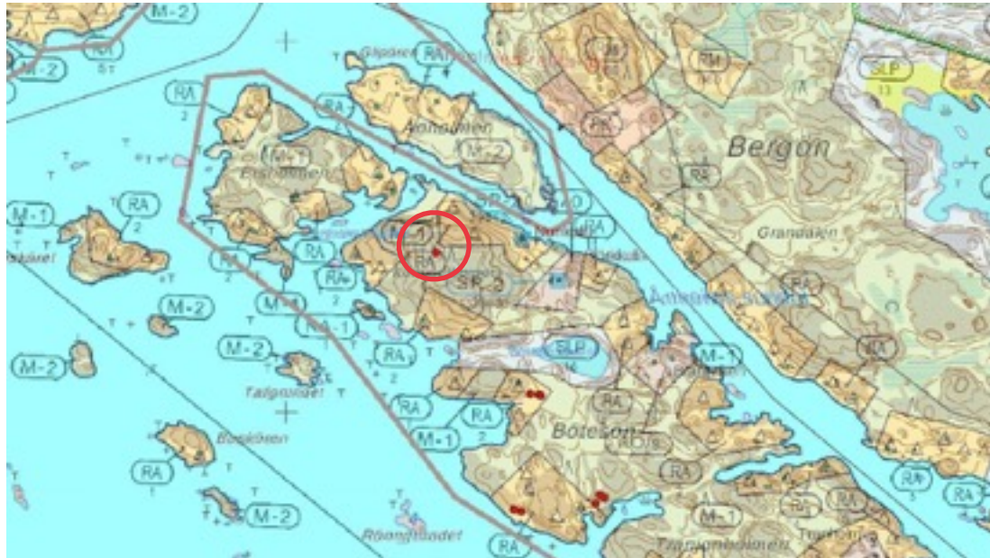
Karttaote: Kummelberget 1. Pohjakartta Maanmittauslaitos. Kaavakartta Sweco Oy. Kartan käsittely Jouni Taivainen, Arkebuusi.