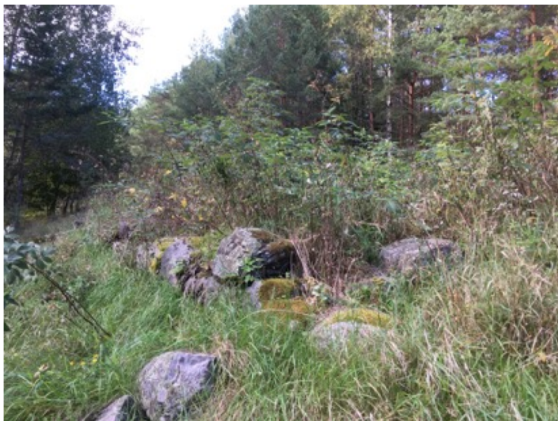
Kuva: Kiviperustus. Kaakosta. 7.9.2016. Jouni Taivainen.

Kohdekuvaus: Kyseessä on yksinkertainen kiviperustus kalliopohjalla. Se on kaksijakoinen siten, että yhtenäisen ja eheän perustuksen koko on 7,2 x 7,2 metriä, mutta perustus jatkuu itään päin hajanaisena, jolloin koko perustuksen koko on noin 12 x 7,2 metriä. Perustuksen korkeus on noin 0,4 metriä ja se enimmäkseen heinikon ja vadelpensaiden alla. Perustuksen sisällä ei ole havaittavissa tulisijan jäännöistä. Perustus on matalan kalliorinteen eteläreunassa. Oviaukko on etelään, eli alarinteeseen.