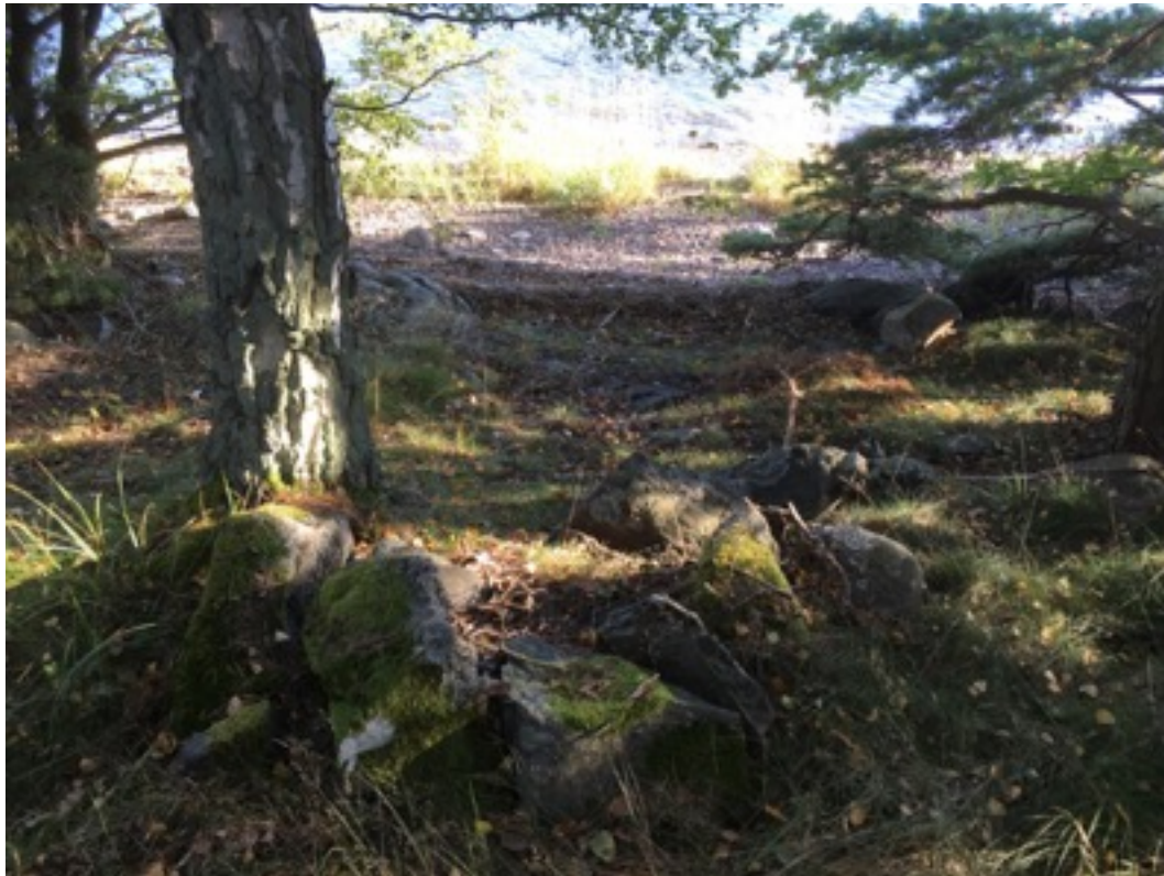
Kuva: Ryssänuuni 9. Pohjoisesta. 8.9.2016.

Uuni 9 sijaitsee noin 30 metriä kesämökistä länteen ja noin kymmenen metriä rannasta. Uunin mitat ovat 1,5 x 1,5 metriä, korkeus 0,4 metriä. Suuaukko on merelle eli etelään päin. Uunin reunassa kasvaa koivu.