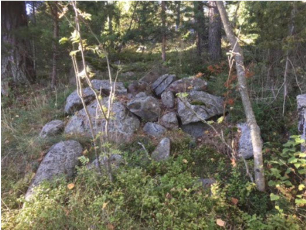
Kuva: Ryssänuuni 4. Kuvattu rannasta päin. Etelästä. 8.9.2016. Jouni Taivainen.

Uuni 5: Sijaitsee rantakalliolla, noin 10 metriä rannasta. Se on kasattu kallionreunaa hyväksi käyttäen. Uunin mitat ovat 1 x 1,5 ja korkeus 0,4 metriä. Suuaukko on etelään eli merelle päin.