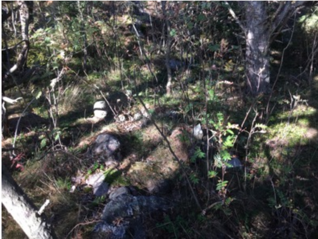
Kuva: Ryssänuuni 7 rannasta päin kuvattuna. Etelästä. 8.9.2016. Jouni Taivainen.

Uuni 8 sijaitsee sähkölinjan alla, osin katajapusikossa. Uuni on tehty noin metrin korkean maakiven kylkeen. Uunin mitat ovat 1,5 x 1,5 metriä, korkeus noin metrin. Suuaukko on etelään eli merelle päin.