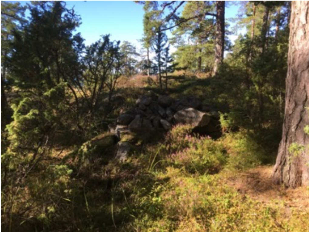
Kuva: Ryssänuuni 7 kalliolla. Etelästä. 8.9.2016.

Uuni 7 sijaitsee kalliopohjalla, noin 40 metriä rannasta. Uunin koko on 1,7 x 2 metriä. Suuaukko on etelään.