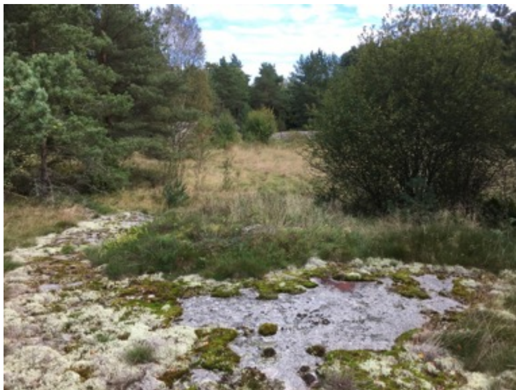
Kuva: Tulisijan jäännös kuvan keskellä kalliolla ruohojen seassa. Taustalla pelto. Idästä. 9.9.2016. Jouni Taivainen.

Tulisijan jäännös sijaitsee pellon luoteiskulmassa kalliolla, noin kymmenen metriä pellon reunasta. Se erottuu melko hyvin kauemmaksikin, vaikka on kokonaan heinien ja sammalen peittämä. Suorakaiteen muotoinen tulisija on tehty kivistä ja sen mitat ovat 2 x 2,25 metriä, korkeus noin 0,6 metriä. Tulisijan päällä olevan sammalen alla on tiilenmuruja. Kyseessä lienee riihen tms. tulisijallisen rakennuksen paikka, mutta rakennuksen perustuksia ei paikalla ole havaittavissa.