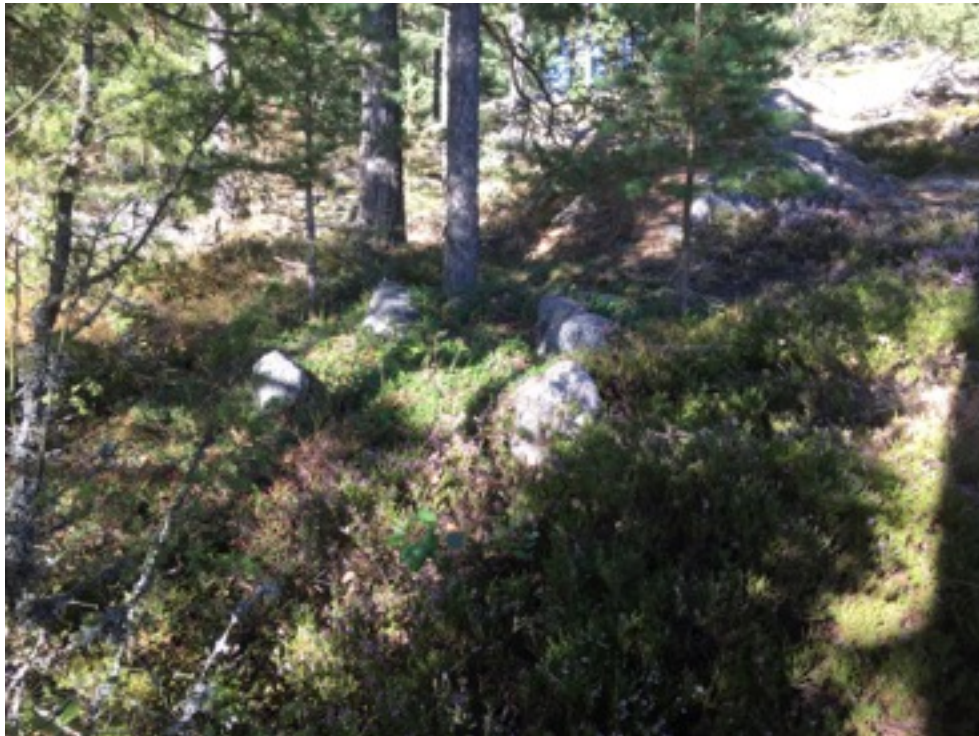
Kuva: Ryssänuuni 13. Lounaasta. 8.9.2016.

Uuni 13 on lähes kokonaan sammalen, varpujen ja jäkälän peitossa. Uunin koko on 1,5 x 2 metriä, korkeus 0,4 metriä. Suuaukko on rantaan eli länteen päin.