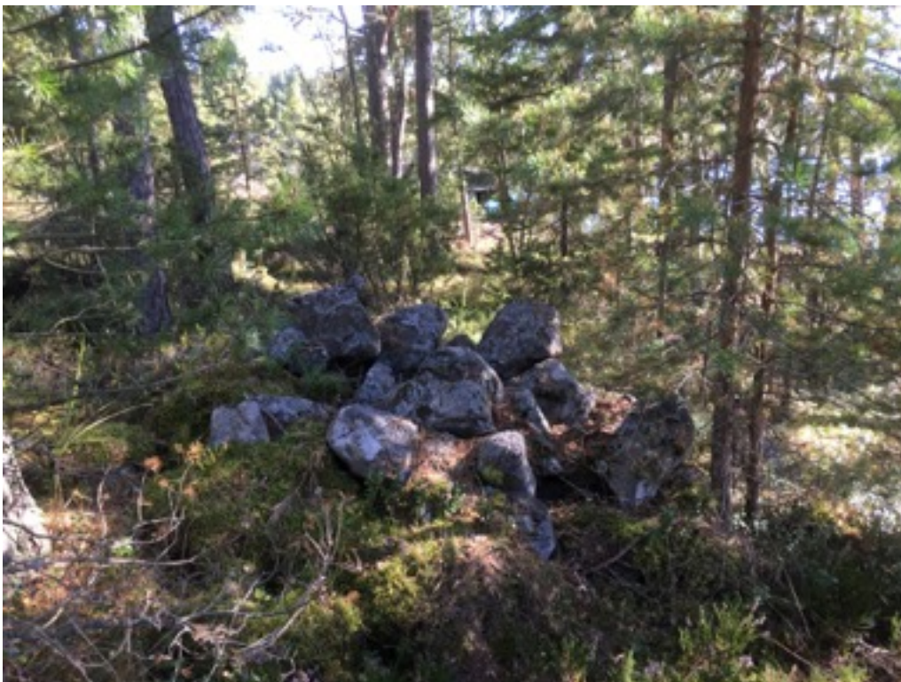
Kuva: Ryssänuuni 12. Luoteesta. 8.9.2016. Jouni Taivainen.

Uuni 12 sijaitsee edellisestä noin viisi metriä etelään. Uunin koko on 1,5 x 1,5 metriä ja korkeus 0,5 metriä. Suuaukko on rantaan eli länteen päin.