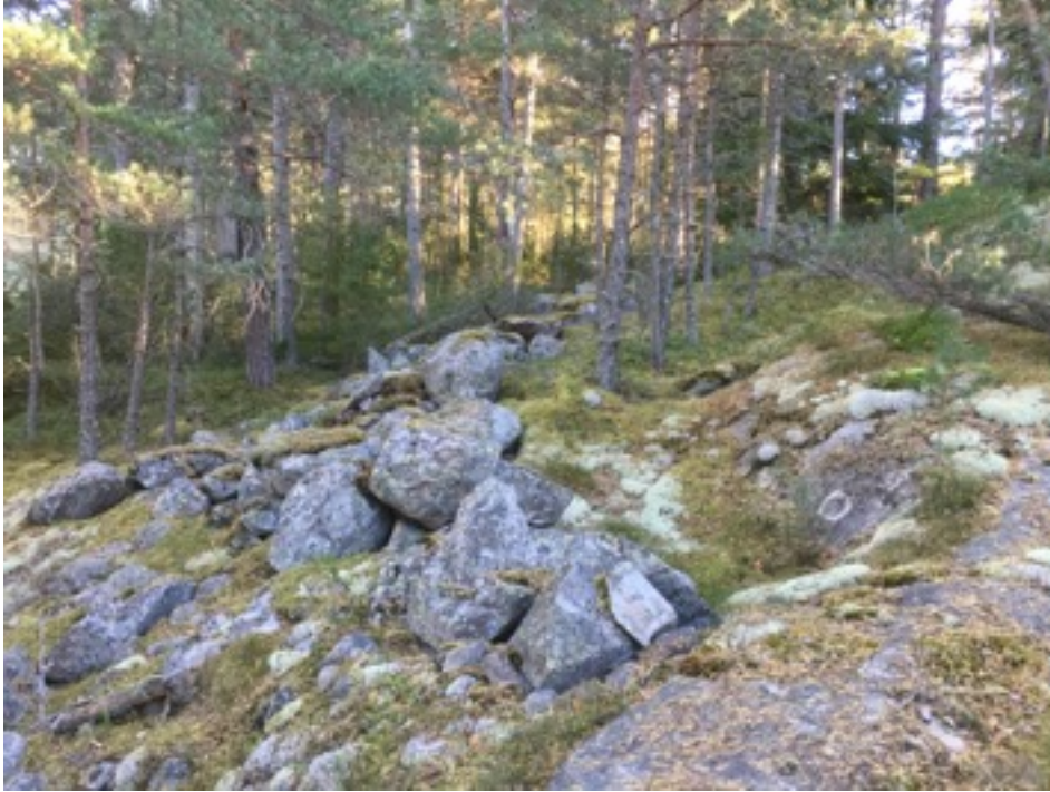
Kuva: Kiviaita 3 meren puolelta. Luoteesta. 5.10.2016.

Kiviaita 4 on edellisestä noin 10 metriä itään. Myös siinä näyttää käytetyn luonnonkivikkoa hyväksi. Aidan pituus on noin 20 metriä ja se on suunnaltaan suunnilleen etelä-pohjoinen. Aidan leveys on 1-2 metriä ja korkeus 0,4-0,6 metriä.