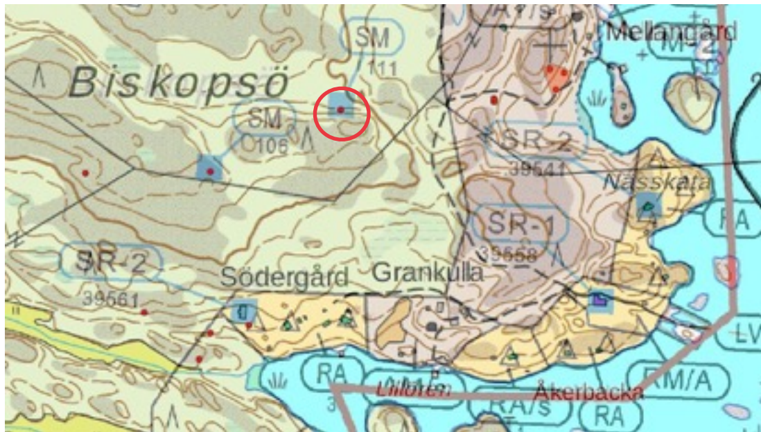
Karttaote: Hemlands skogen 1. Pohjakartta Maanmittauslaitos. Kaavakartta Sweco Oy. Kartan käsittely Jouni Taivainen, Arkebuusi.