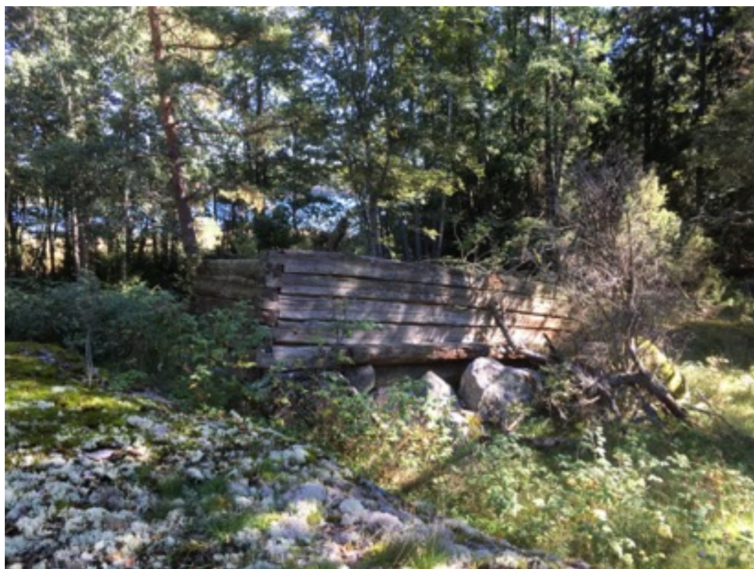
Kuva: Ladonjäännös, taustalla merenlahti. Pohjoisesta. 7.9.2016. Jouni Taivainen.

Kohdekuvaus: Kohde havaittiin inventoinnissa 7.9.2016. Kyseessä on kiviperustaisen hirsiladon tms. jäännös, joka sijaitsee pienen kalliokohouman laella. Jäännöksen koko on noin 5,5 x 5,5 metriä. Hirret on salvottu, veistetty sileiksi ja varattu (ei kuitenkaan täysin tiiviiksi), nurkat ovat lyhyet ja sahatut. Perustus on luonnonkivistä tehty. Eniten hirsiseinästä on jäljellä pohjoisseinustalla, jonka korkeus on noin kaksi metriä. Eteläseinusta on käytännössä lahonnut kokonaan, itä- ja länsiseinustoista on hieman jäljellä. Rakennuksen sisällä ei ole tulisijaan. Oviaukko on länteen.