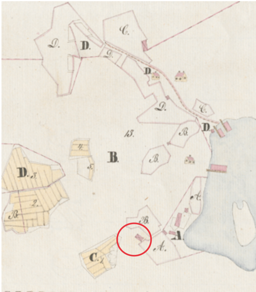
Karttaote: Vuoden 1834 Biskopsön sikopiiristä ( Biskopsö_Sikopiirimaan_kartta_ja_jako-asiakirjat_1)