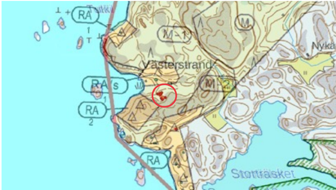
Karttaote: Västerstrand 1. Pohjakartta Maanmittauslaitos. Kaavakartta Sweco Oy. Kartan käsittely Jouni Taivainen, Arkebuusi.