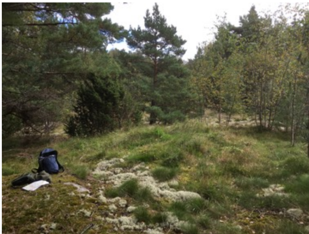
Kuva: Kumpare kuvan keskellä. Luoteesta. 9.9.2016. Jouni Taivainen.

Tein kumpareen keskelle pienen koepiston lastalla. Pintanurmen alla oli tummaa maata noin 15 sentin syvyyteen ja siitä alaspäin maa muuttui ruskeaksi, hiekkansekaiseksi mullaksi. Noin 30 sentin syvyydessä tuli esiin tiilenmuruja, palaneen saven kappale ja kirkas kalansuomu. Lopetin kaivamisen tähän. Löytöjä ei otettu talteen.