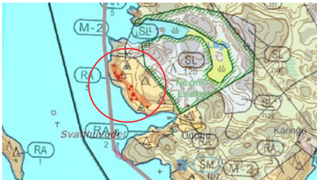
Karttaote: Lillglo 2. Pohjakartta Maanmittauslaitos. Kaavakartta Sweco Oy. Kartan käsittely Jouni Taivainen, Arkebuusi.