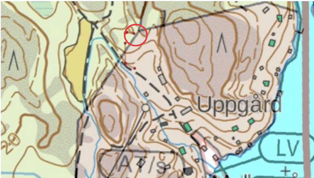
Karttaote: Uppgård. Pohjakartta Maanmittauslaitos. Kaavakartta Sweco Oy. Kartan käsittely Jouni Taivainen, Arkebuusi.