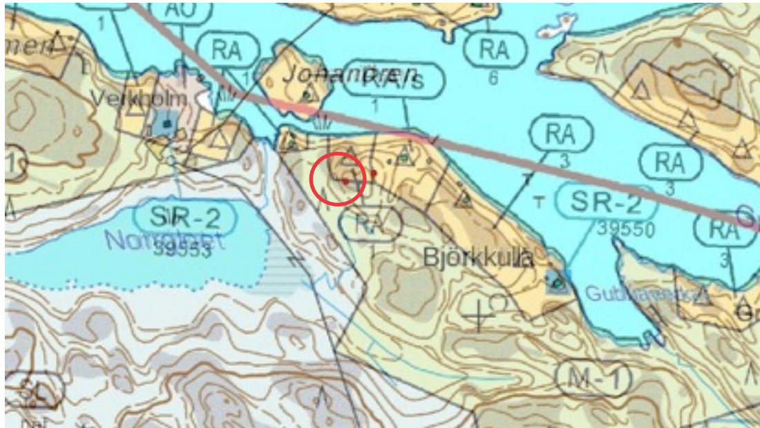
Karttaote: Björkkulla 2. Pohjakartta Maanmittauslaitos. Kaavakartta Sweco Oy. Kartan käsittely Jouni Taivainen, Arkebuusi.