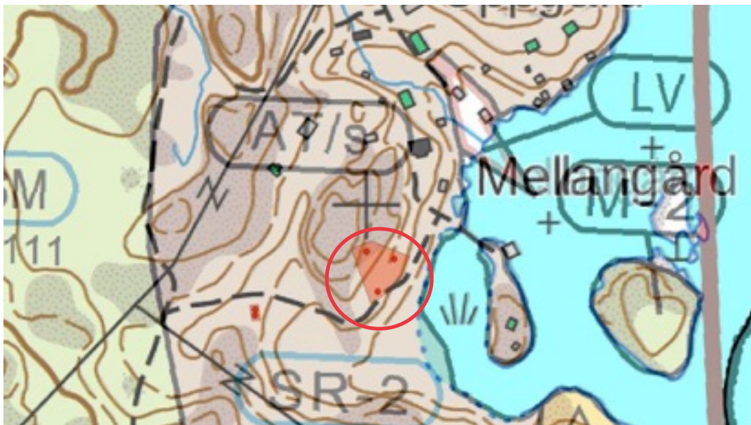
Karttaote: Biskopsö Södergård. Pohjakartta Maanmittauslaitos. Kaavakartta Sweco Oy. Kartan käsittely Jouni Taivainen, Arkebuusi.