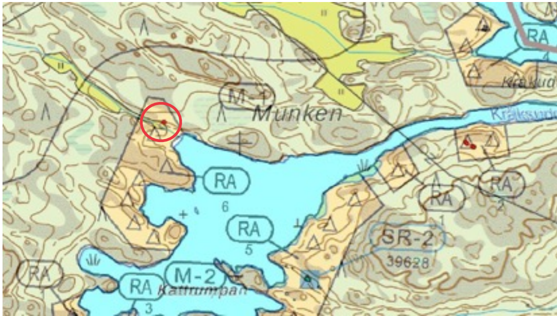
Karttaote: Munken 1. Pohjakartta Maanmittauslaitos. Kaavakartta Sweco Oy. Kartan käsittely Jouni Taivainen, Arkebuusi.