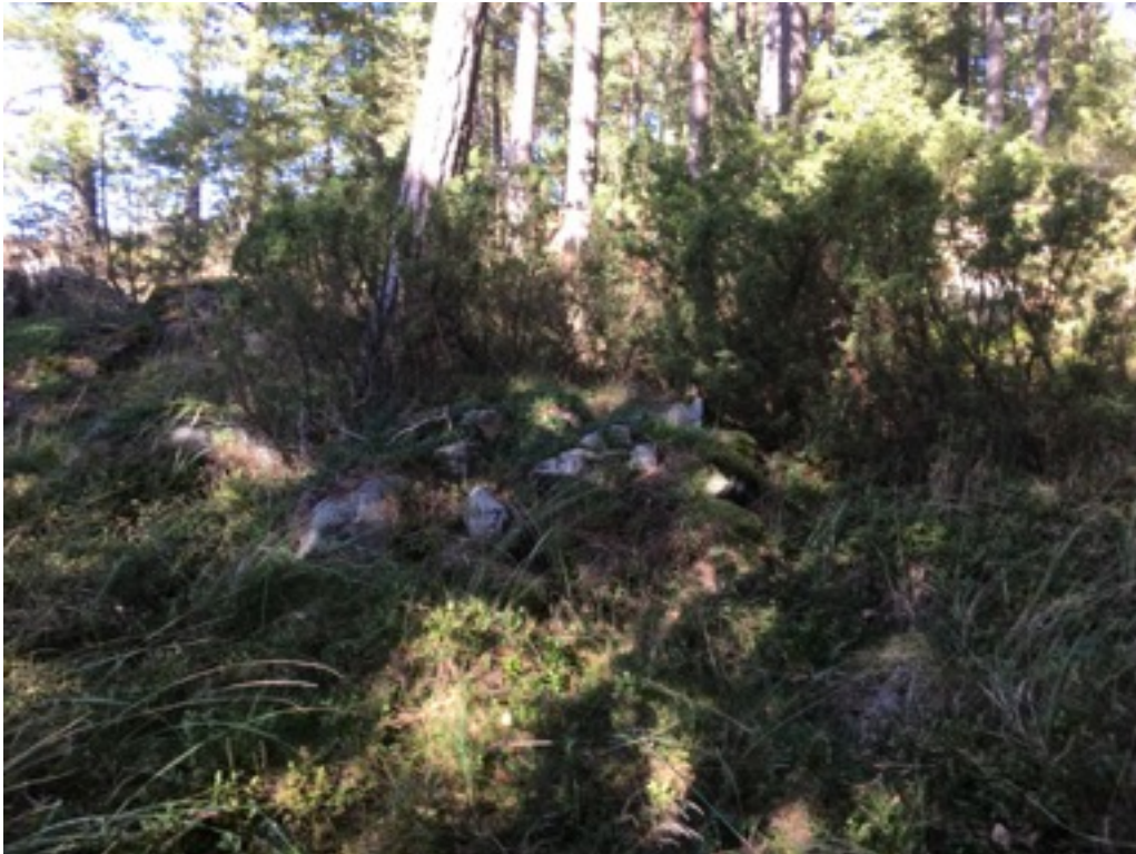
Kuva: Ryssänuuni 3 kuvan keskellä. Lounaasta. 8.9.2016. Jouni Taivainen

Uuni 3 sijaitsee kallion reunassa. Se on kooltaan 2 x 2,5 metriä, korkeudeltaan 0,4 metriä. Suuaukko on rantaan eli länteen päin.