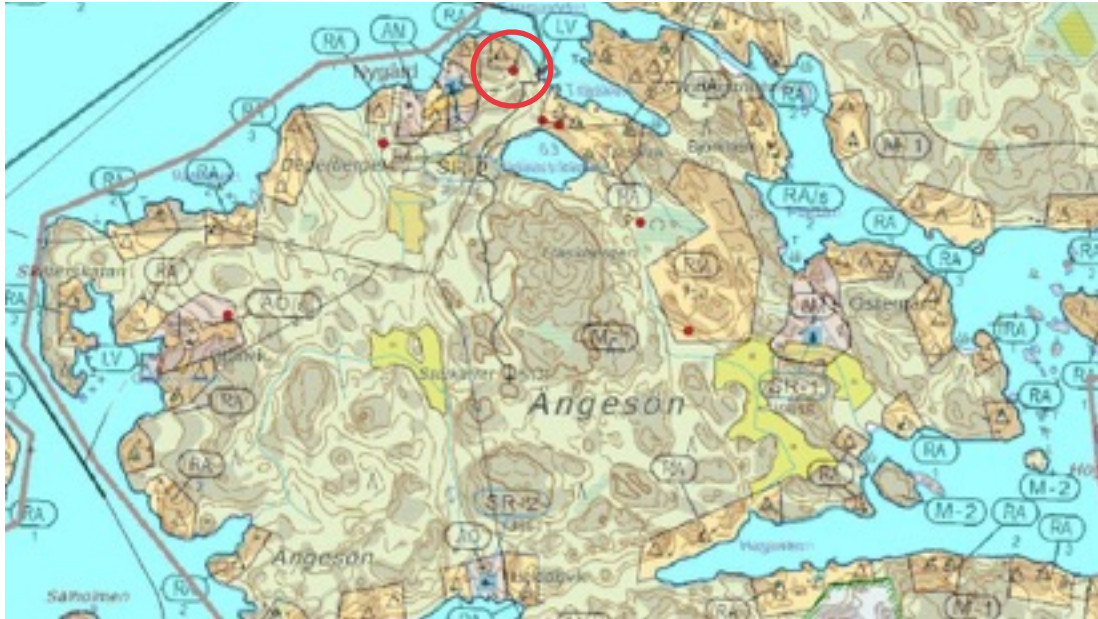
Karttaote: Storsundet 1. Pohjakartta Maanmittauslaitos. Kaavakartta Sweco Oy. Kartan käsittely Jouni Taivainen, Arkebuusi.