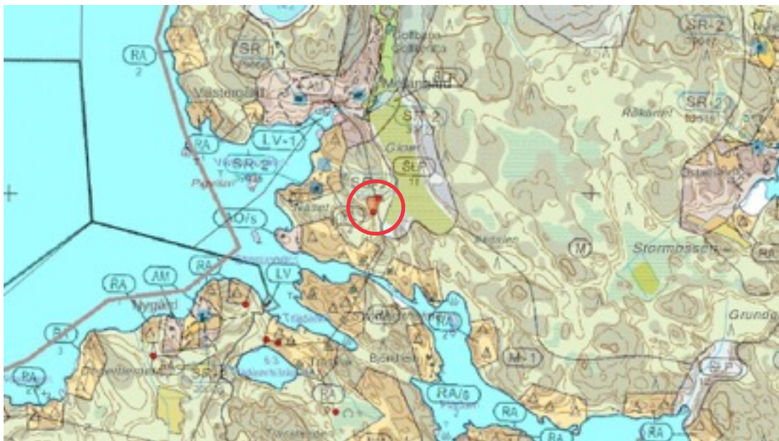
Karttaote: Gloet 1. Pohjakartta Maanmittauslaitos. Kaavakartta Sweco Oy. Kartan käsittely Jouni Taivainen, Arkebuusi.

Inventointi, Esa Laukkanen 2012. Inventointinumero 330. Kemiönsaaren Dragsfjärdin arkeologinen inventointi vuosina 2011 ja 2012. Varsinais-Suomen maakuntamuseo.