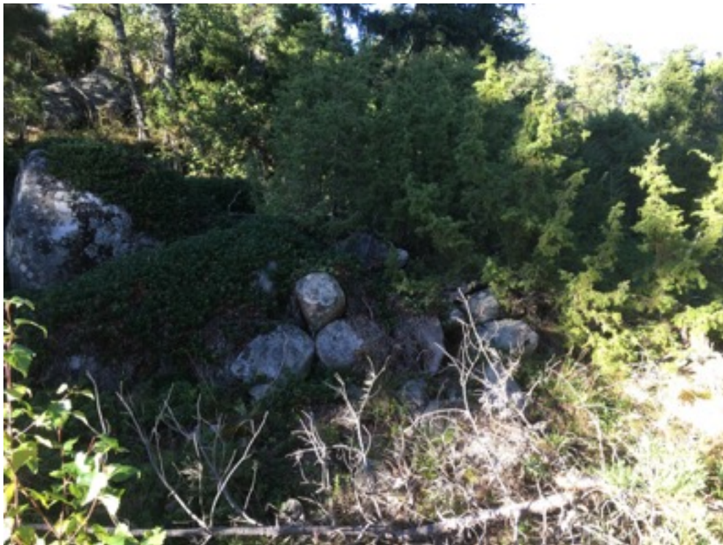
Kuva: Ryssänuuni 8 rannasta päin kuvattuna. Etelästä. 8.9.2016. Jouni Taivainen.

Uuni 8 sijaitsee sähkölinjan alla, osin katajapusikossa. Uuni on tehty noin metrin korkean maakiven kylkeen. Uunin mitat ovat 1,5 x 1,5 metriä, korkeus noin metrin. Suuaukko on etelään eli merelle päin.