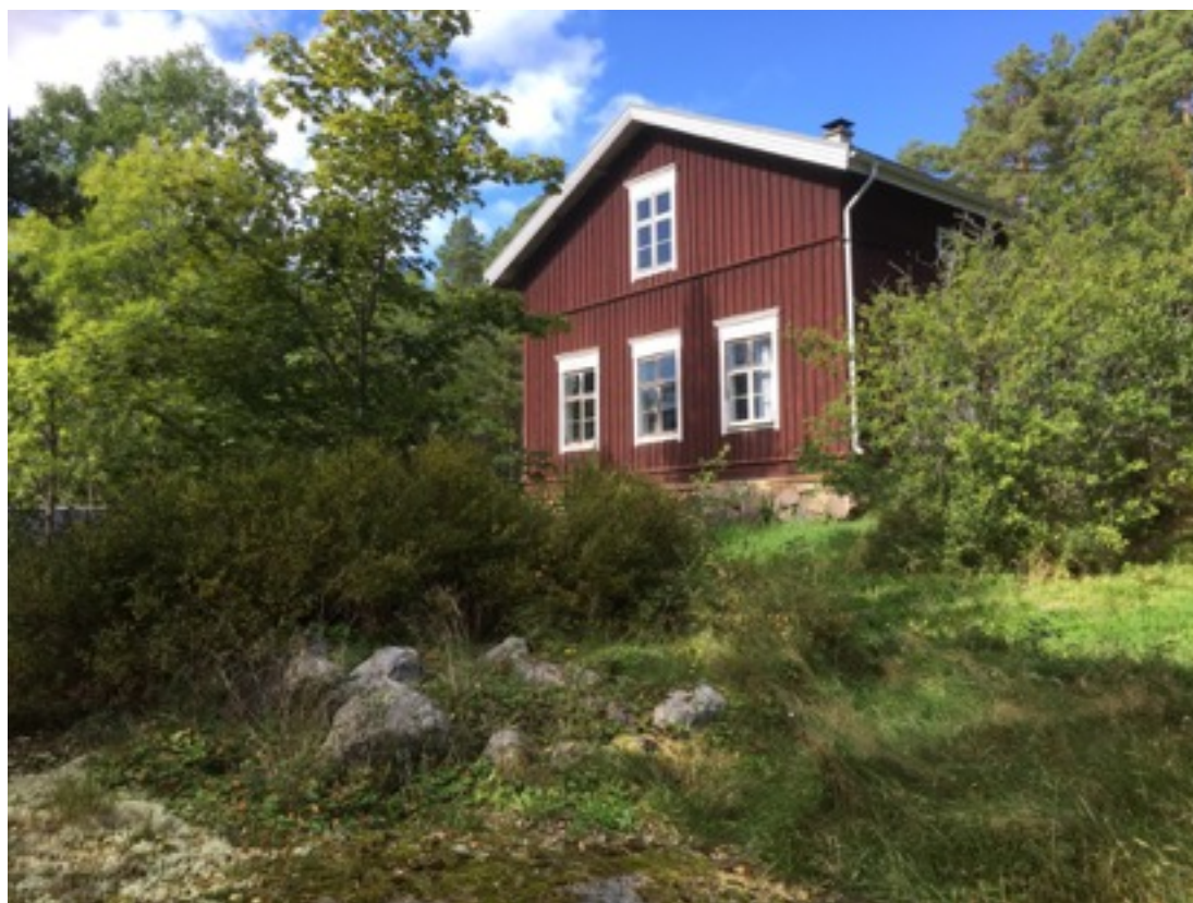
Kuva: Kiviröykkiö etualalla. Taustalla Södergårdin päärakennus. Kaakosta. Jouni Taivainen. 7.9.2016.

Kohdekuvaus: Kyseessä on soikea maansekainen kiviröykkiö, joka havaittiin inventoinnissa 7.9.2016. Se sijaitsee kalliopohjalla, noin 10 metriä etelä-kaakkoon Södergårdin päärakennuksen eteläpäädyistä. Röykkiö on itä-länsisuuntainen, mitoiltaan 2,5 x 3,5 metriä, korkeudeltaan 0,6 metriä. Röykkiön länsipää on pusikon alla.