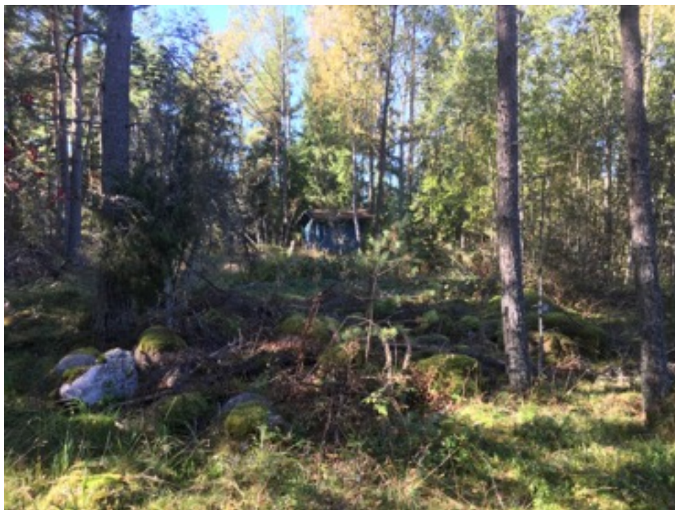
Kuva: Latomus kuvan keskellä. Kaakosta. 10.9.2016.

Missään vanhassa tai uudemmassa kartassa ei paikalla ole mitään rakennusta. En pysty varmuudella tulkitsemaan kohdetta muinaisjäänökseksi, mutta mielestäni sitä olisi varmuuden vuoksi varottava. Jossain määrin se muistuttaa esim. Biskopsön ja Skagetin latomuksia, jotka tosin sijaitsevat korkeammalla avokalliolla.