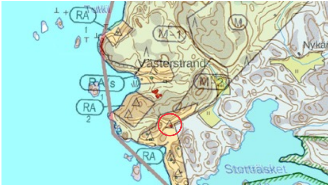
Karttaote: Västerstrand 2. Pohjakartta Maanmittauslaitos. Kaavakartta Sweco Oy. Kartan käsittely Jouni Taivainen, Arkebuusi.