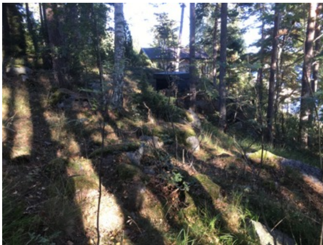
Kuva: Ryssänuuni 1 kuvan edessä keskellä. Lännestä. 8.9.2016. Jouni Taivainen.

Uuni 1 sijaitsee mäntyä kasvavassa etelärinteessä, noin 30 metriä rannasta ja noin 10 metriä länteen kesämökin kaivosta ja noin 30 metriä länteen kesämökistä. Uuni on mitoiltaan 1,5 x 2 metriä ja korkeudeltaan 0,3 metriä. Uuni on vinottain rinteeseen kulkuun nähden, suuaukko on lounaaseen.