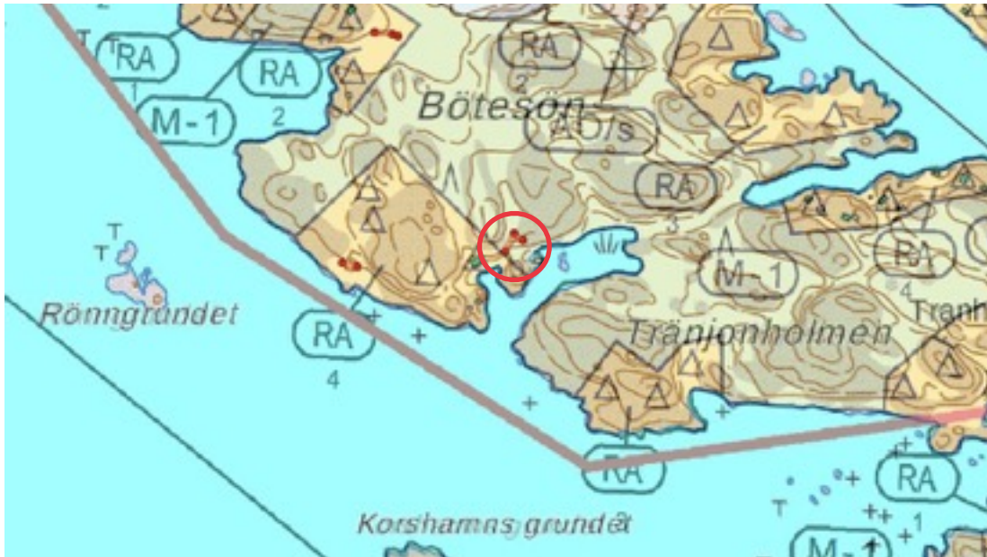
Karttaote: Bötösön 2. Pohjakartta Maanmittauslaitos. Kaavakartta Sweco Oy. Kartan käsittely Jouni Taivainen, Arkebuusi.