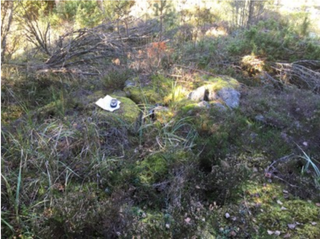
Kuva: Ryssänuuni nro 2. Kaakosta. 10.9.2016.