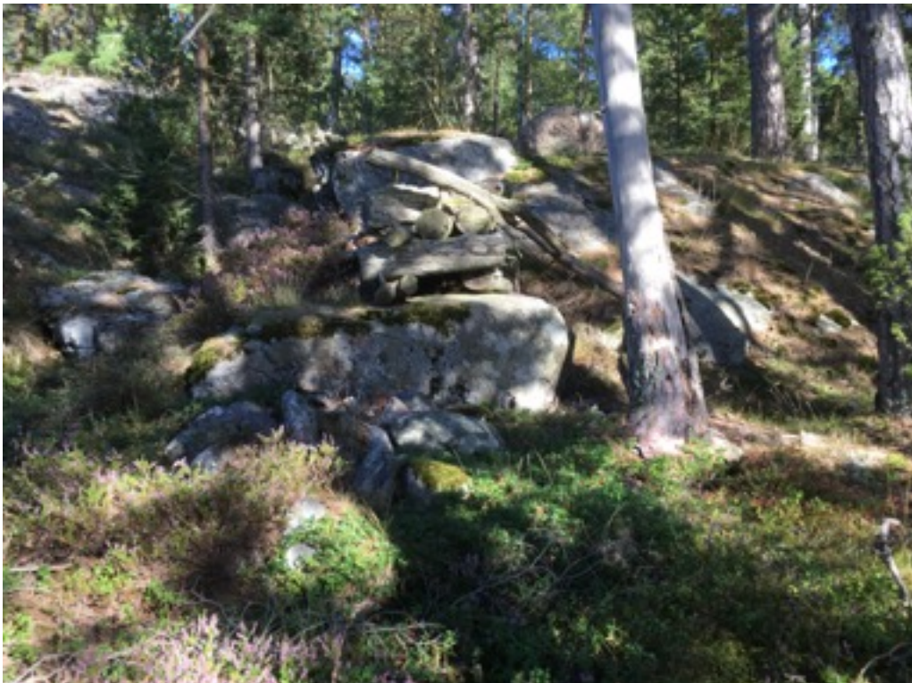
Kuva: Ryssänuuni 4 kuvan keskellä. Lännestä. 8.9.2016. Jouni Taivainen

Uuni 4 sijaitsee kallion reunassa, noin 20 metriä rannasta. Se on kooltaan 1,5 x 2 metriä, korkeudeltaan noin 0,3 metriä. Uuni on täysin rauennut ja lähes kokonaan sammalen ja varpujen peitossa. Suuaukkoa ei pysty erottamaan.