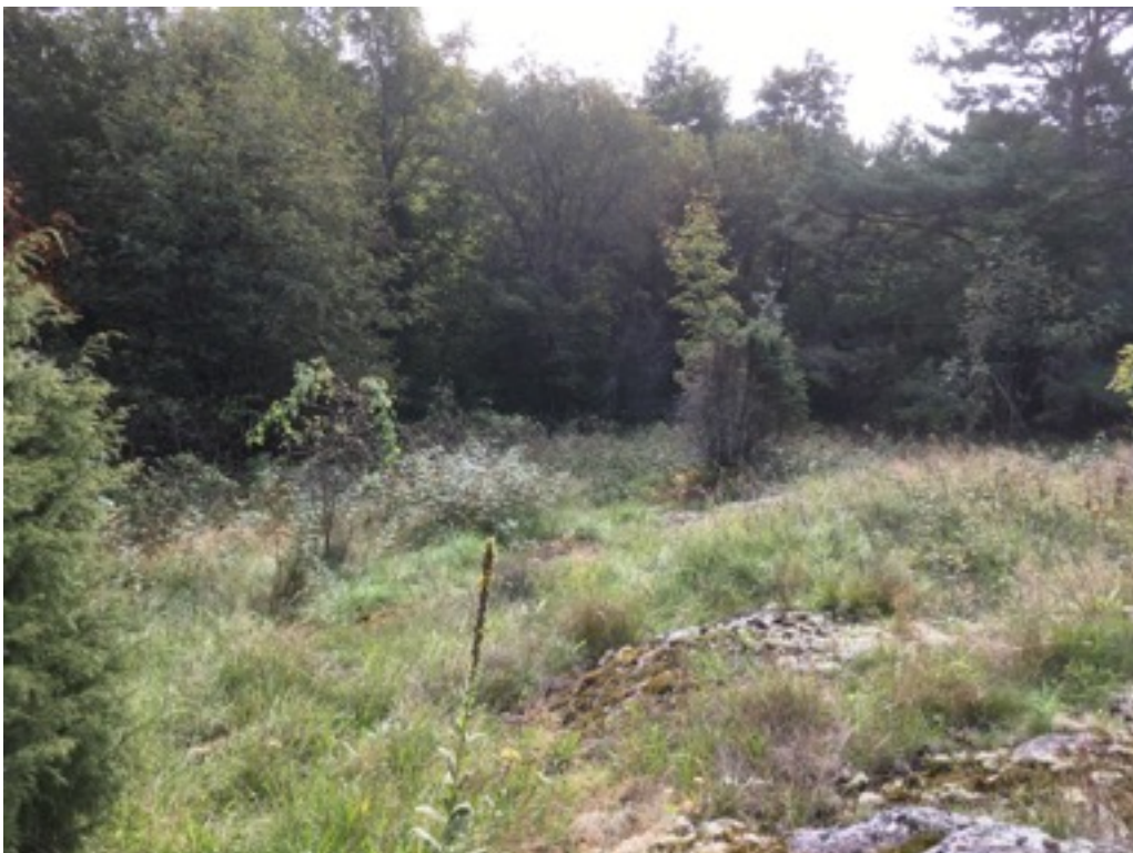
Kuva: Kellari taustalla näkyvien puiden alla. Kuvan keskellä tummatulisija. Pohjoisesta. Jouni Taivainen.

Kiviperustus 1 sijaitsee tontin yläosassa kalliolla, puiden ja pensaiden alla. Kyseessä on matala, maataytteen kiviperustus, jonka mitat ovat 3 x 6 metriä. Perustuksen suunta on kaakko-luode.