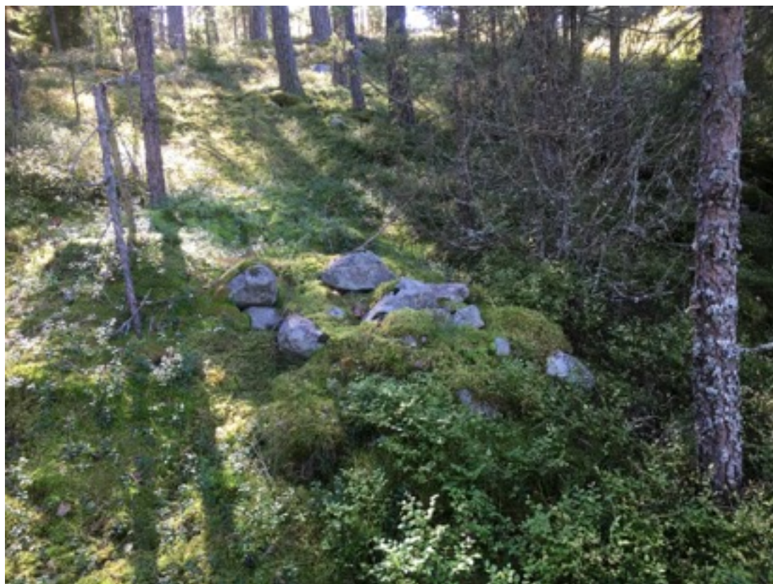
Kuva: Kiviröykkiö kuvan keskellä. Pohjoisesta. 8.9.2016. Jouni Taivainen.

Röykkiön funktio jäi inventoinnissa avoimeksi, mutta ainakaan se ei liene viljelyröykkiö, sillä se sijaitsee kalliorinteellä sen verran kaukana pellon reunasta, että sinne ei olisi kiviä sieltä tuotu. Mittojensa ja muotonsa puolesta kyseessä voisi olla ryssänuunikin, mutta sen rakenne ei varmuudella tue tätä tulkintaa ja lisäksi se sijaitsee melko kaukana rannasta, vaikkakin 2,5 metrin korkeuskäyrä tulee sitä melko lähelle pohjoisen puolella, nykyisellä peltoalueella. Sijaintikorkeutensa puolesta kiviröykkiö voi olla esihistorialliseltakin ajalta. Melko lähellä saman kallion laella on entuudestaan tunnettu Henriksbergin suurehko kivilatomus, joka on tulkittu esihistorialliseksi muinaisjäänökseksi.