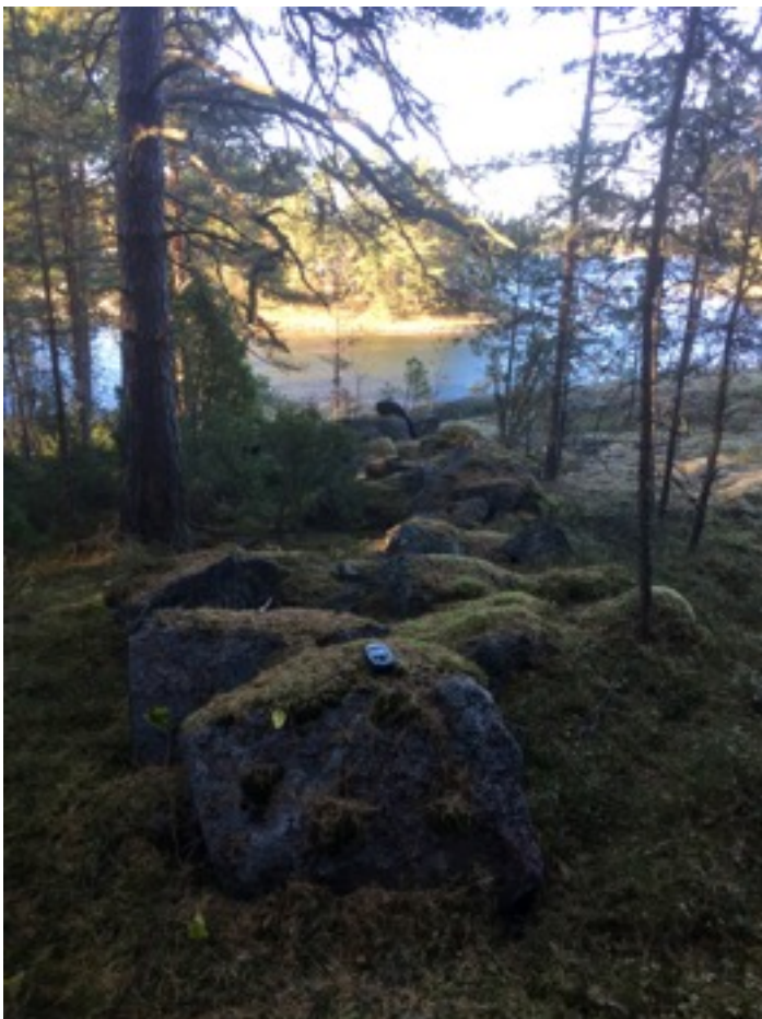
Kuva: Kiviaita 4. Etelästä. 5.10.2016.

Kiviaita 4 on edellisestä noin 10 metriä itään. Myös siinä näyttää käytetyn luonnonkivikkoa hyväksi. Aidan pituus on noin 20 metriä ja se on suunnaltaan suunnilleen etelä-pohjoinen. Aidan leveys on 1-2 metriä ja korkeus 0,4-0,6 metriä.