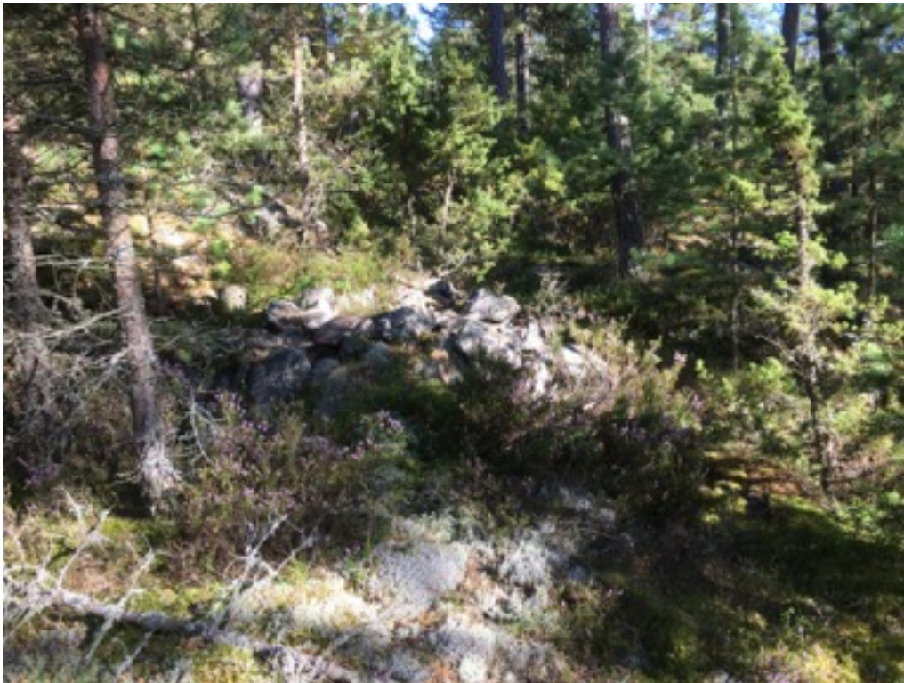
Kuva: Ryssänuuni 11. Luoteesta. 8.9.2016.

Uuni 11 sijaitsee edellisestä noin kuusi metriä koilliseen. Uunin koko on 1,5 x 1,5 metriä ja korkeus 0,5 metriä. Suuaukko on rantaan eli länteen päin.