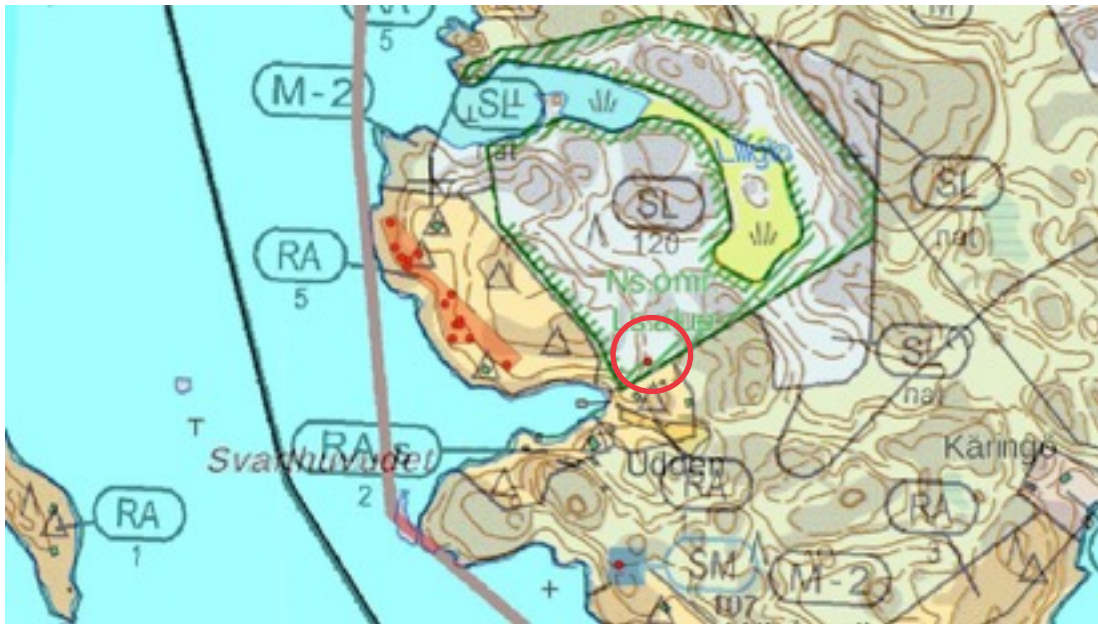
Karttaote: Udden 1. Pohjakartta Maanmittauslaitos. Kaavakartta Sweco Oy. Kartan käsittely Jouni Taivainen, Arkebuusi.