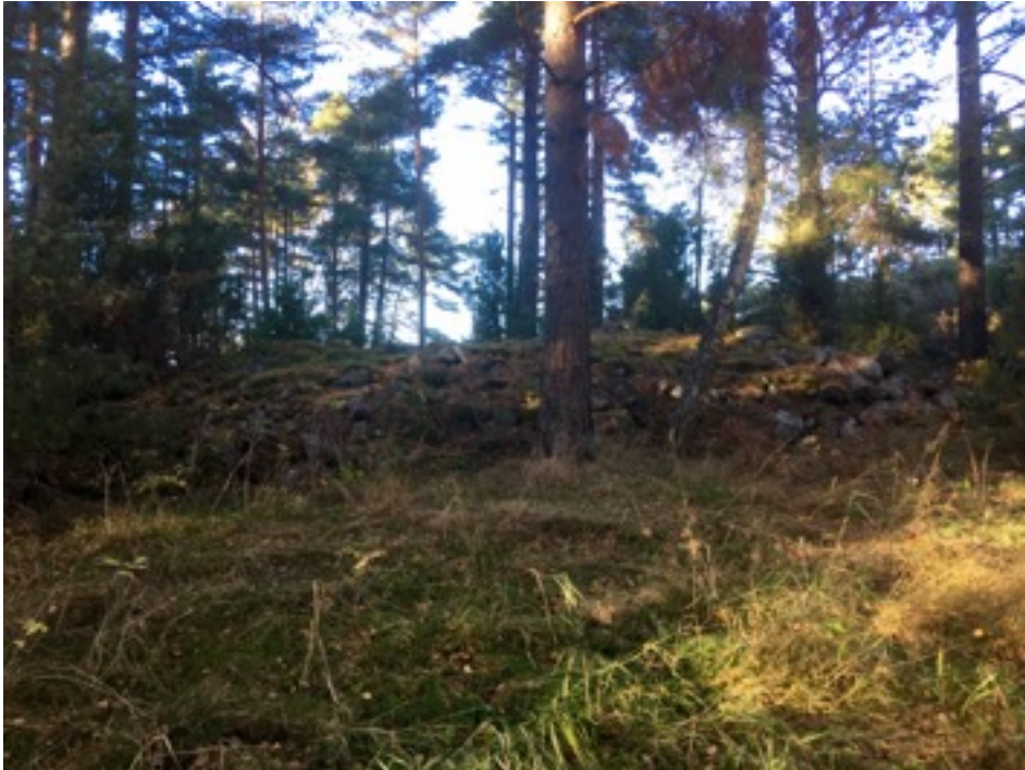
Kuva: Kiviröykkiö nro 1. Etelästä. 5.10.2016.

Kiviröykkiö 1 on suurikokoinen pelloilta kasattujen kivien raivausröykkiö. Se on muodoltaan epäsäännöllisen neliskulmainen, kooltaan 7 x 9 metriä ja korkeudeltaan 1,2 metriä. Röykkiö on keskus on hieman reunoja alempana. Se sijaitsee vanhan peltoalueen pohjoisreunassa.