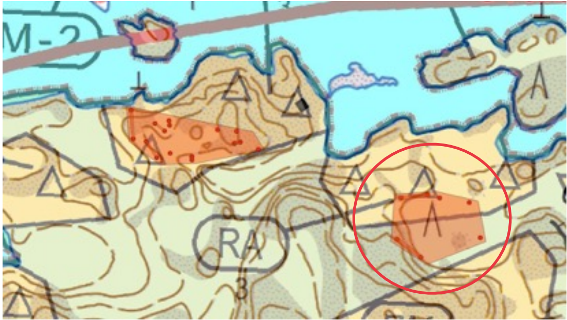
Karttaote: Orglosön 2. Pohjakartta Maanmittauslaitos. Kaavakartta Sweco Oy. Kartan käsittely Jouni Taivainen, Arkebuusi.