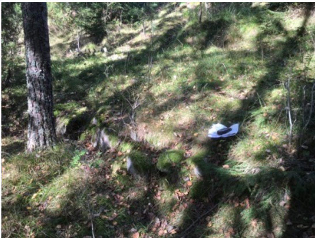
Kuva: Pengerrys. Kaakosta. 10.9.2016.

Kohdekuvaus: Kohde löytyi inventoinnissa 10.9.2016. Kyseessä on vanhan, metsittyneen peltoalueen koillisreunassa, loivassa lounaisrinteessä sijaitseva kivipengerrys, joka sijaitsee noin kaksi metriä metsätiestä pohjoiseen. Pengerrys on alarinteen puolella, pituudeltaan noin 11 metriä. Sen ja rinteän välissä on noin kolme metriä leveä tasainen alue, jolla lienee joskus sijainnut lato tms. rakennus, josta tosin ei ole mitään muuta näkyvää enää jäljellä.