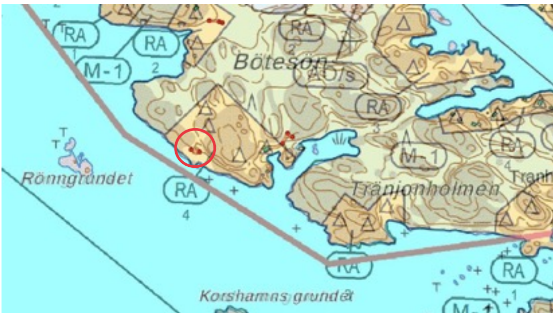
Karttaote: Bötösön 1. Pohjakartta Maanmittauslaitos. Kaavakartta Sweco Oy. Kartan käsittely Jouni Taivainen, Arkebuusi.