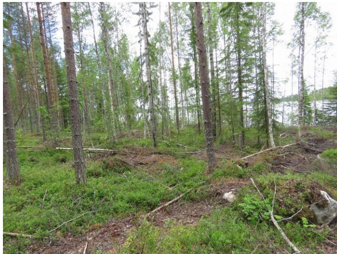
Kuva 2. Rakentamaton alue Myllyniemen pohjoisosassa. Kivinen loiva rinne, hietamoreenia, ranta soistunut.