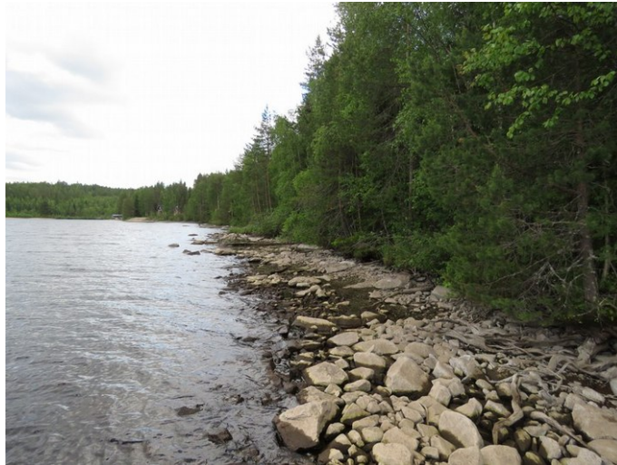
Kuva 1. Itäinen rantavyöhyke kuvattu kaava-alueelta Siikalahden asuinpaikan suuntaan (pieni hiekka-alue taustalla). Huuhtoutunutta kivikkoa, alue rantatörmän yläpuolella on soistunutta hietamoreenia.

Esiselvityksessä arvioitiin lähiseudulla aikaisemmin tehtyjen arkeologisten selvitysten tulokset. Lisäksi käytettiin GTK:n kallio- ja maaperäkartoja, Maanmittauslaitoksen ortoilmakuvia ja korkeusmallia. Maastoinventointi perustui pääosin pintahavainnointiin, koekuoppia tehtiin muutama alueen keskiosasta löytyneen tervahaudan kohdalla. Alue on pääosin tasaista hyvin kivistä hietamoreenia, rantavyöhyke on huuhtoutunutta kivikkoa, joka on paikoitellen soistunut.