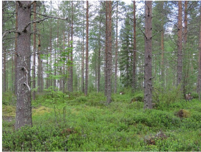
Kuva 3. Kaava-alueen länsiosa kuvattu korkeimmalta kohdalta. Kivistä hietamoreenia, harvennettua nuorta kasvatusmetsikköä.