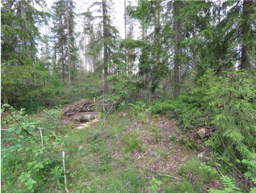
Tervahauta kuvattu itään.