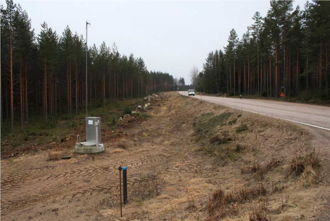
Yleiskuva inventointialueesta Peräläntien risteyksen kohdalta etelään. Kuvattu pohjoisesta. (DIGMAV2017002:5)