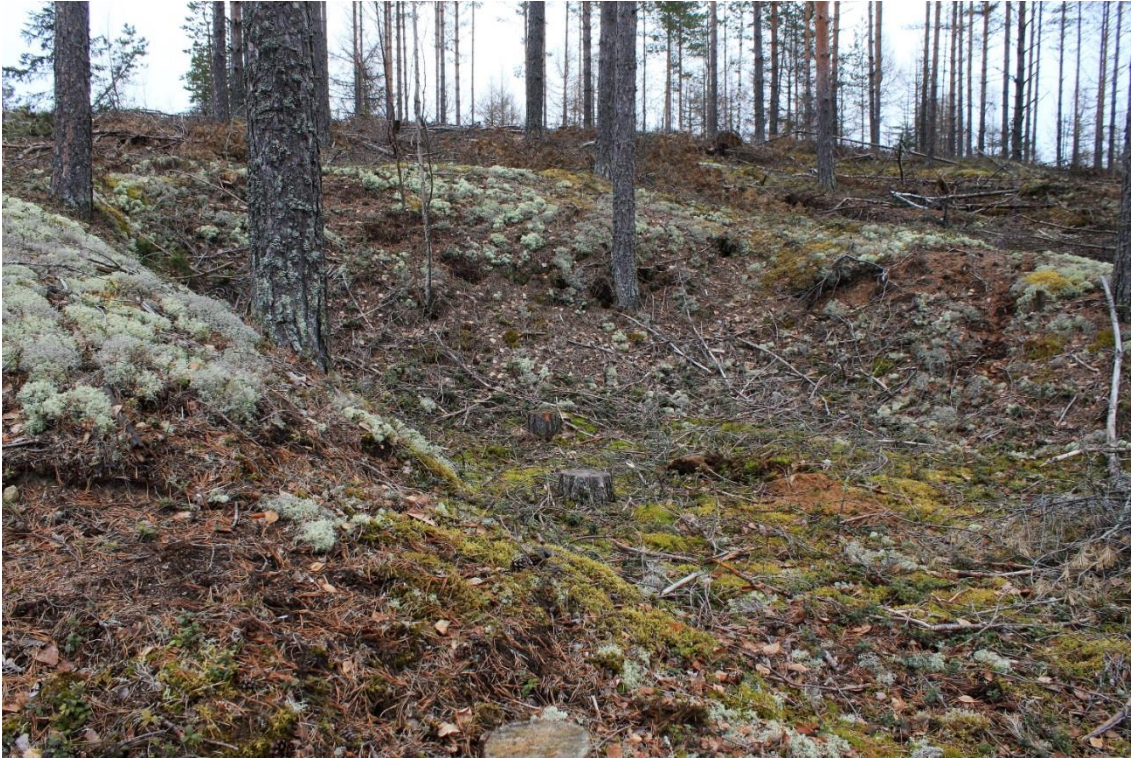
Luumäki Tervalamminsoo. Kevyenliikenteenväylän viereen jäävä kaivanto, jonka sisäpuolelle tehtiin koepisto. Kuvattu lounaasta. (DIGMAV2017002:2)