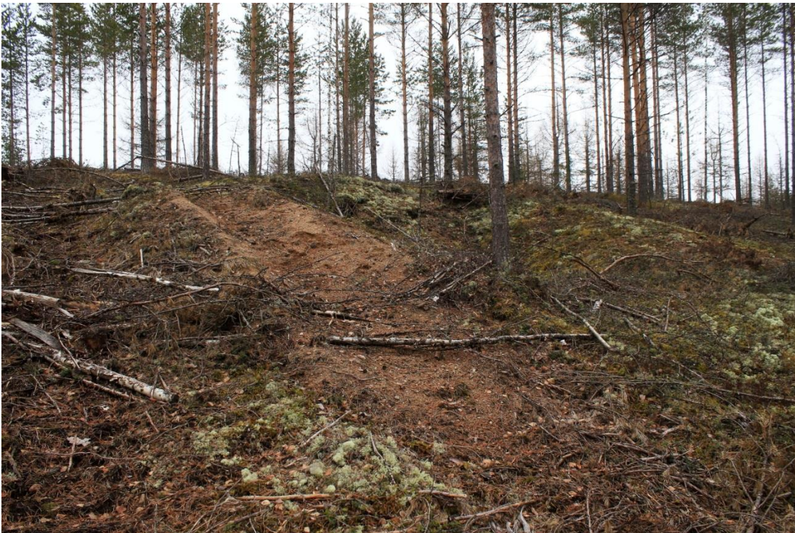
Luumäki Tervalamminsoo. Alueen itäisin kaivanto, jonka reunan päältä on ajettu metsäkoneella. Kuvattu etelästä. (DIGMAV2017002:3)