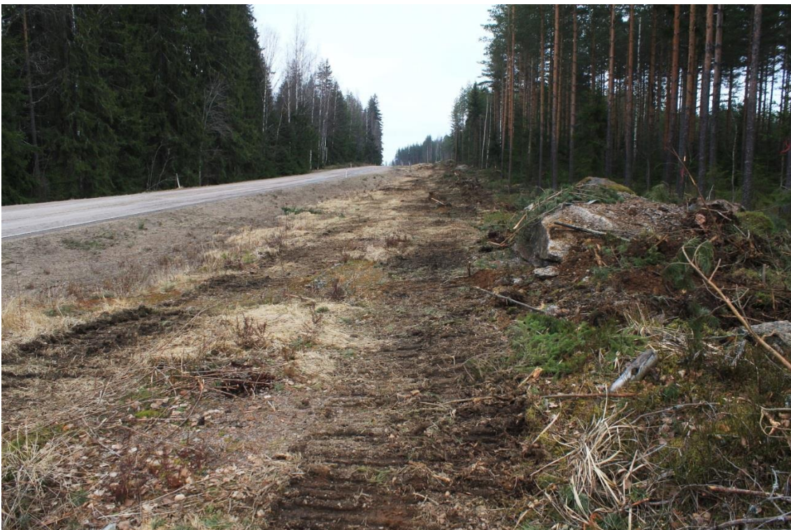
Yleiskuva inventointialueesta Hepoharjun kohdalla. Kuvattu etelästä. (DIGMAV2017002:4)

Maastotyötä aloittaessa havaittiin, että koko kevyenliikenteenväylän linja eli inventointialue oli jo raivattu puista sekä kivistä ilmeisesti telaketjukaivinkoneella. Tämän vuoksi maaperä oli arkeologista inventointia ajatellen muokkautunut niin paljon, ettei raivatulta alueelta ollut mahdollista tehdä havaintoja muinaisjäänöksistä. Tulevan kevyenliikenteenväylän linjaus käveltiin lävitse ja linjauksen itäpuolelle jäävää reunaa havainnoidtiin mahdollisten rakenteiden varalta. Alueelta ei kuitenkaan havaittu uusia kiinteitä muinaisjäänöksiä. Tervalamminsuon ja Perälän/Kukasmäen kohteet tarkastettiin.