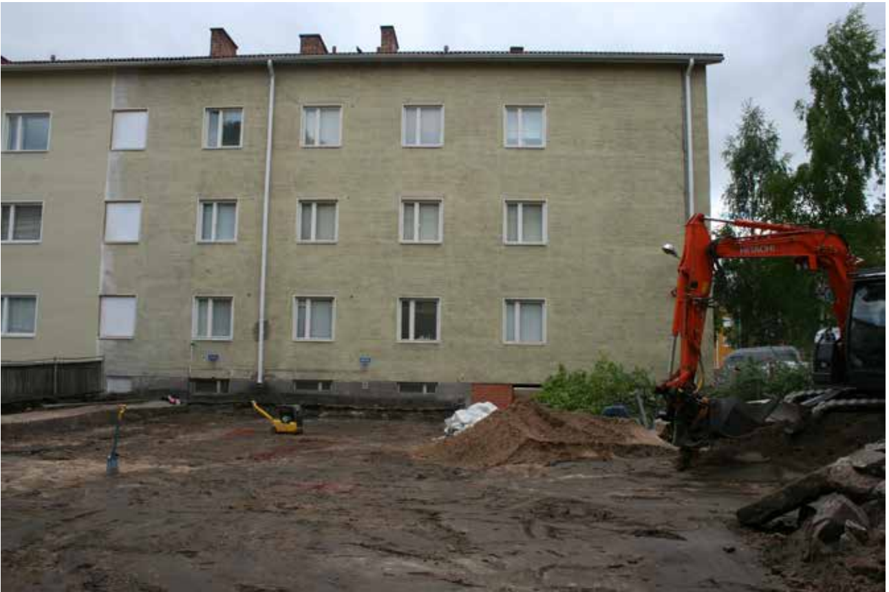
MuTu116015:1. Valvottu alue tavoitesyvyydessä. (JH, luoteesta)