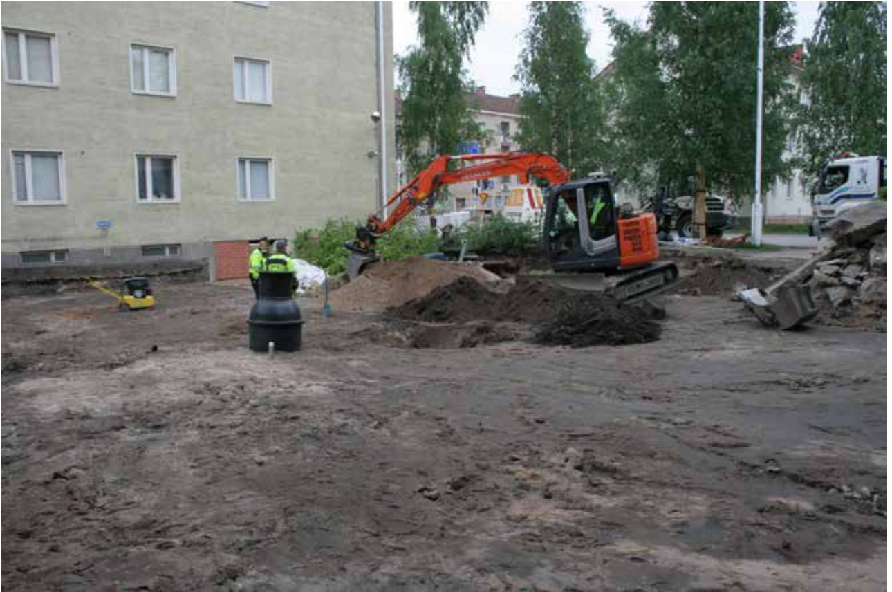
MuTu116015:3. Pihan keskellä tulevan hulevesikaivon paikka. (JH, pohjoisesta)