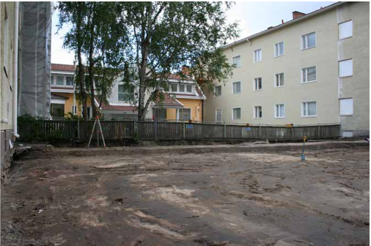
MuTu116015:2. Valvottu alue tavoitesyvyydessä, taustalla aidan edessä talojen väliin rakennettu maanalainen betonikanaali. (JH, lounaasta)