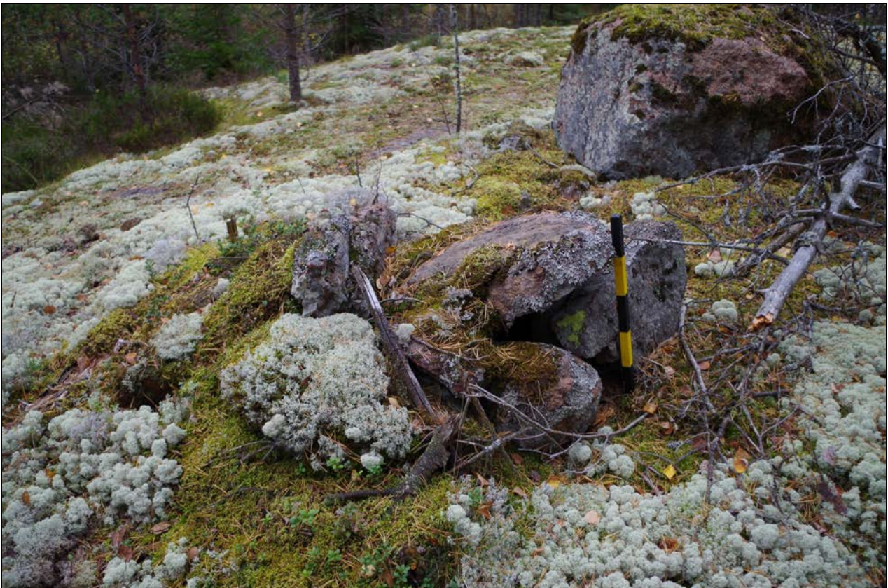
Kuva 2: Rauennut rajamerkki. Lähikuva. NW.