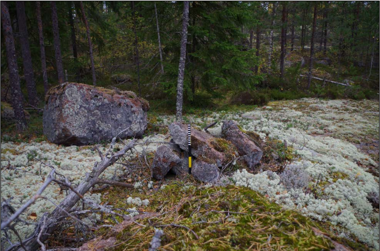
Kuva 1: Kohteen sijainti maastossa. SE.