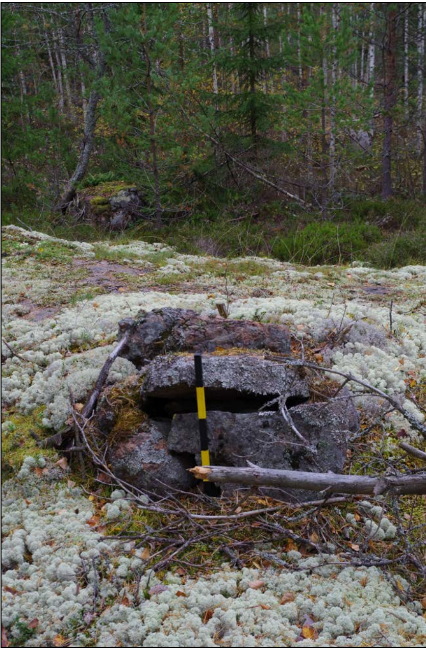
Kuva 3: Lähikuva kohteesta. W.