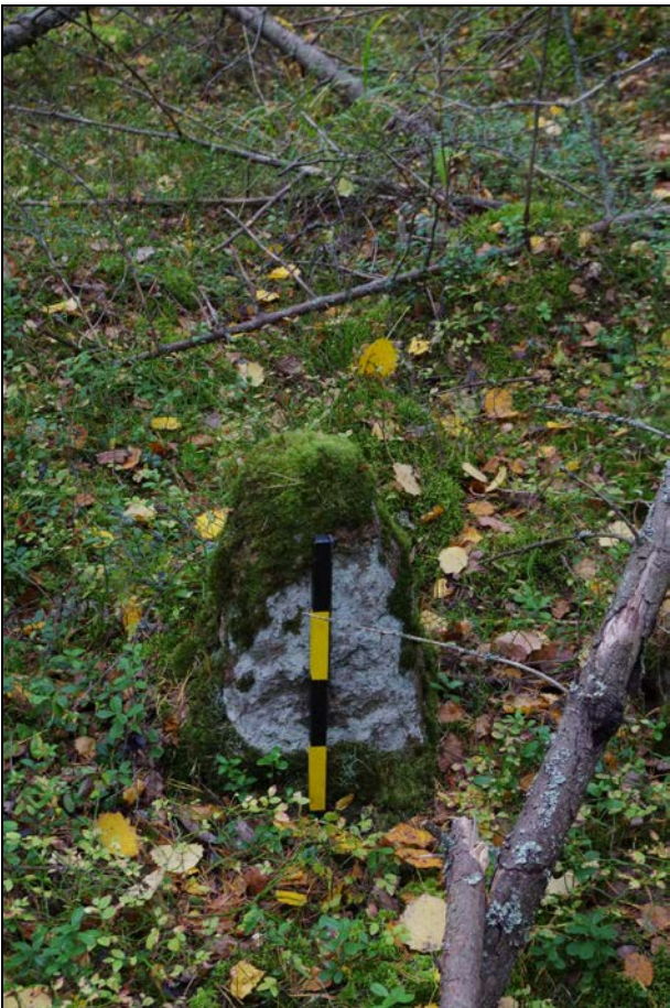
Kuva 3: Lähikuva tarkastetusta kohteesta. W.