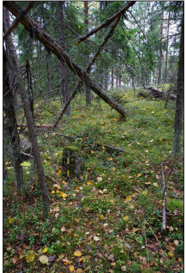
Kuva 1: Rajapyykin sijainti maastossa (vas.). E. Kuva 2: Kohde suunnasta SW (oik.)