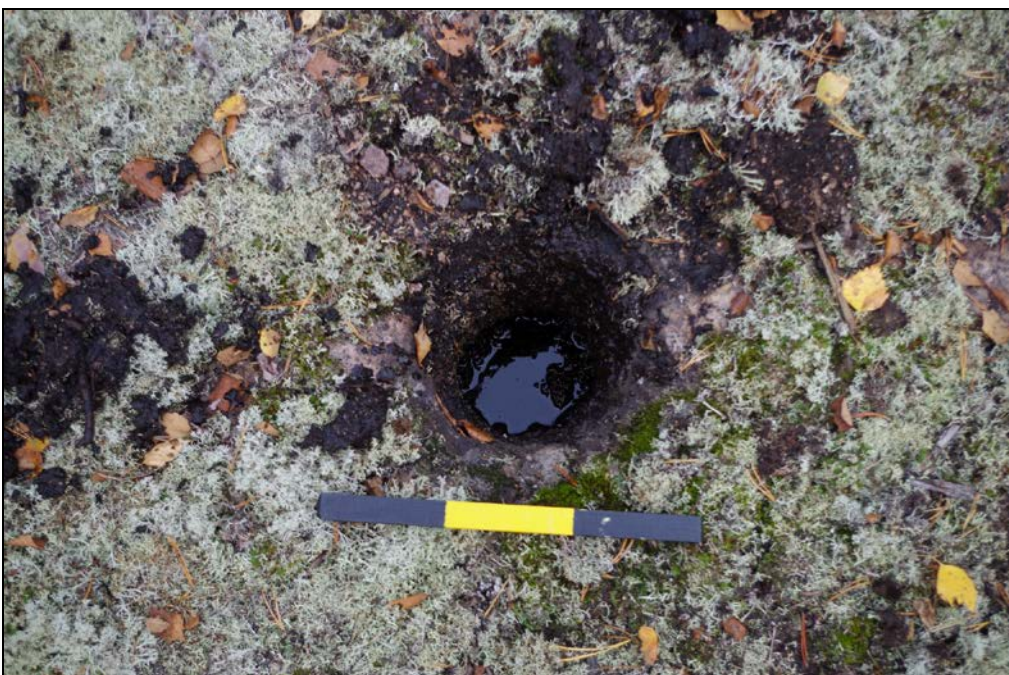
Kuva 2: Pohjoinen reikä. Lähikuva. N.