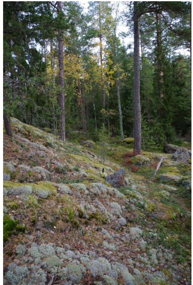
Kuvat 2-3: Kohde suunnasta E (vas.) ja S (oik.).