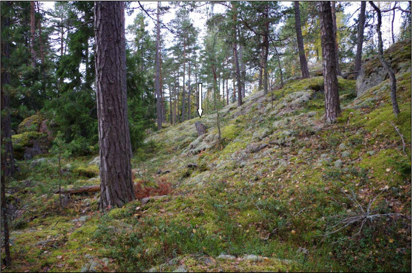
Kuva 1: Kohde ja sitä ympäröivää maastoa. N. Kohde merkittynä nuolella.