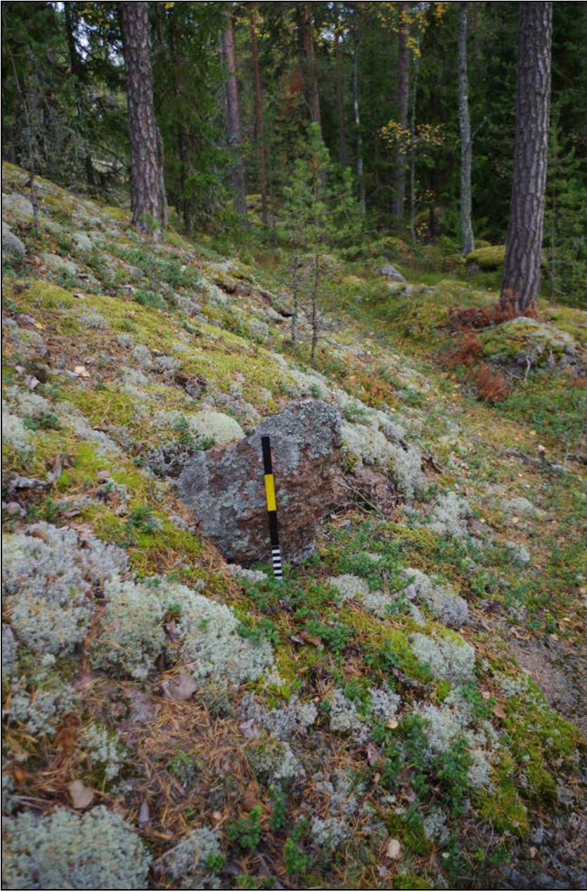
Kuva 4: Kohde suunnasta S. Lähikuva.