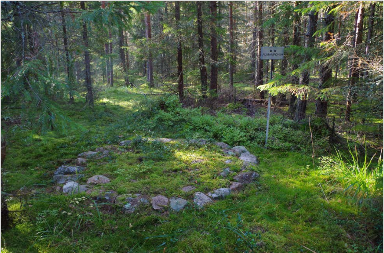
Kuva 1: Kohteen sijainti maastossa. N.