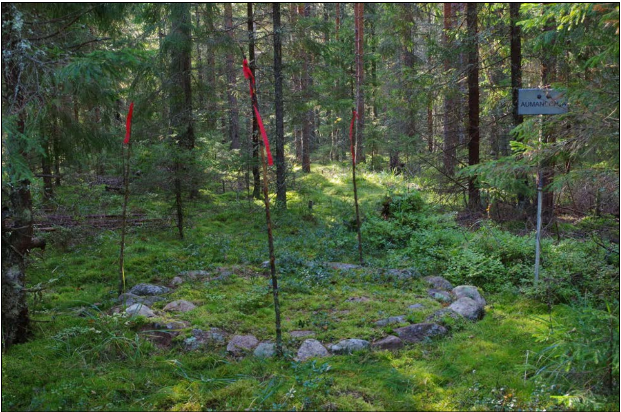
Kuva 3: Kohde merkittynä maastoon kuitunauhoin ja kyltillä. N.