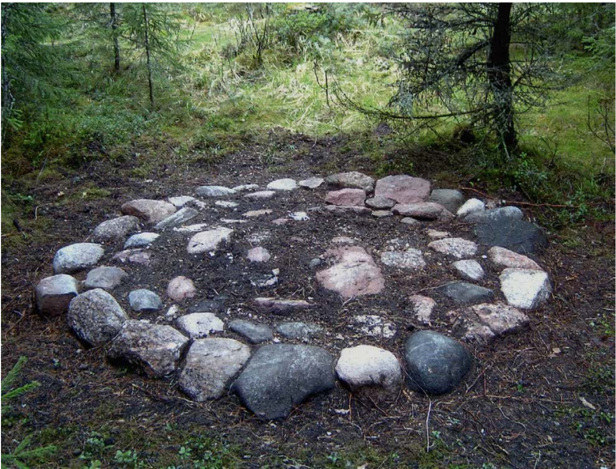
Kuva 4: Aumanpohja vv. 2006-2007 pintaturpeen alta paljastettuna. S.