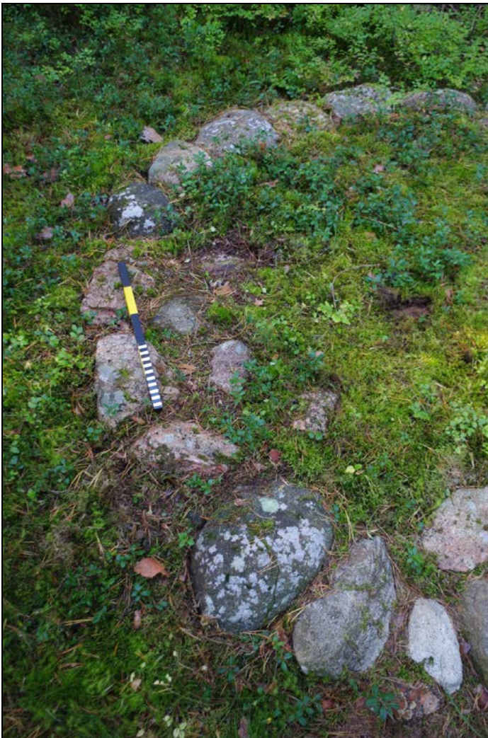
Kuva 2: Aumanpohjan E-NE -sivustaa. Lähi-kuva. N.