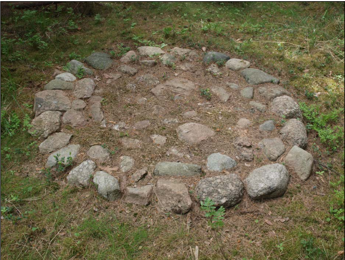
Kuva 5: Aumanpohja vuonna 2009 pintaturpeen alta paljastettuna. N.