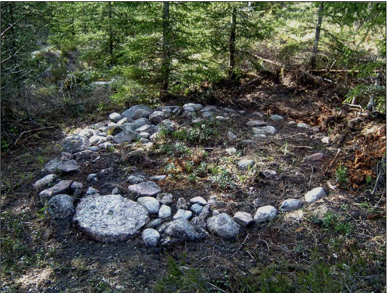
Kuva 4: Aumanpohja 2006-2007 pintaturpeen alta paljastettuna. SE.