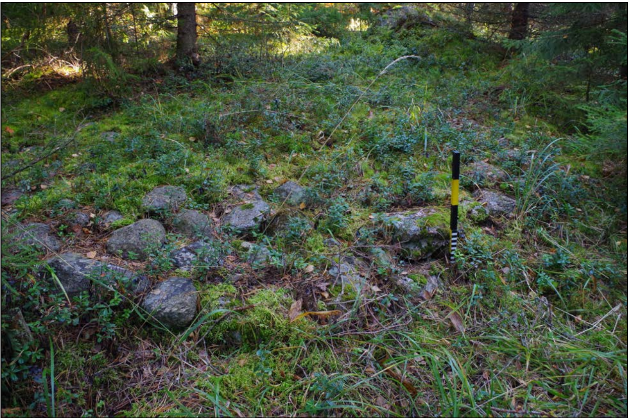
Kuva 3: Aumanpohja suunnasta S.