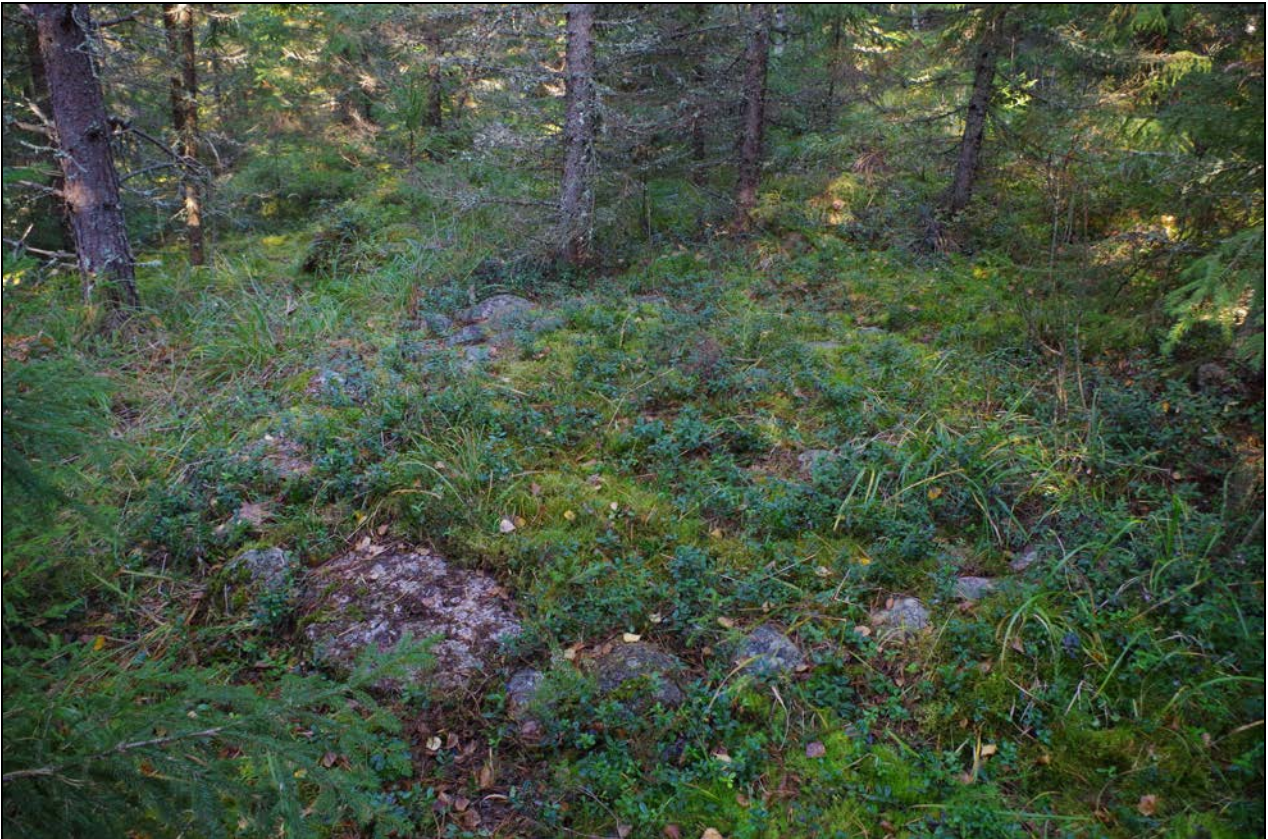
Kuva 1: Aluskasvillisuuden peittämä aumanpohja. SE.