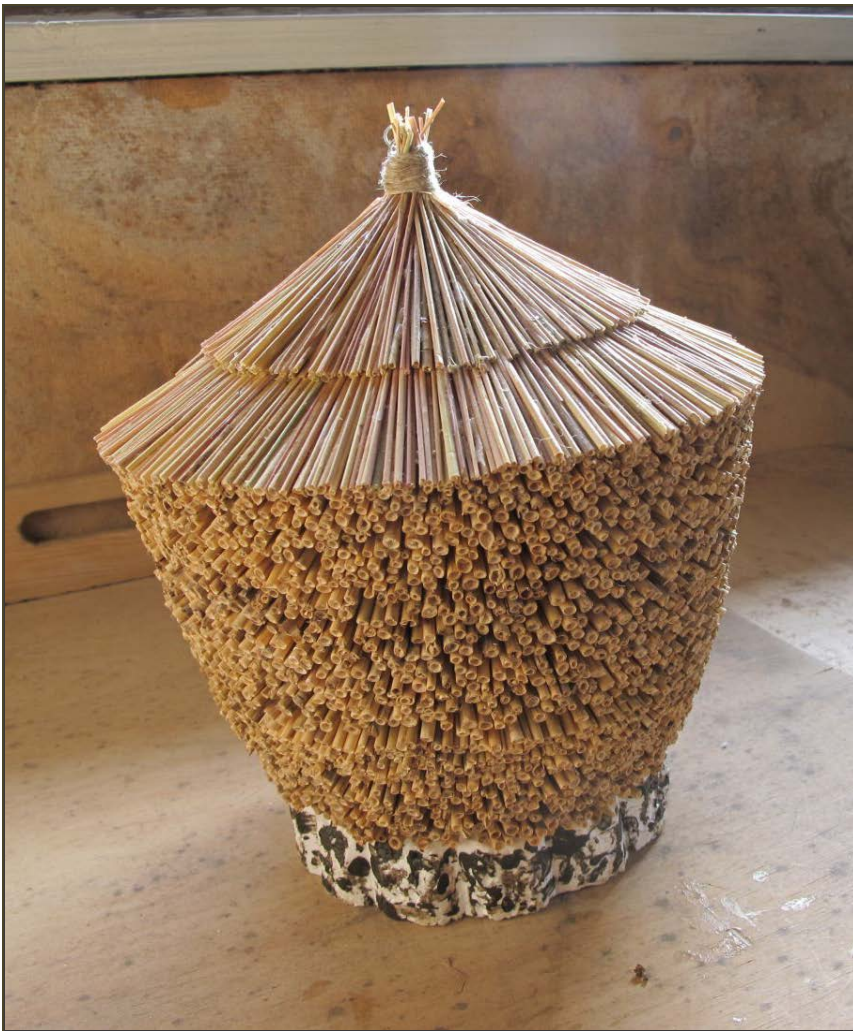
Kuva 5: H. Uusiheimalan tekemä pienoismalli vilja-aumasta. Alinna "kivistä" tehty aumanpohja, jonka päälle viljalyhteet on ladottu.