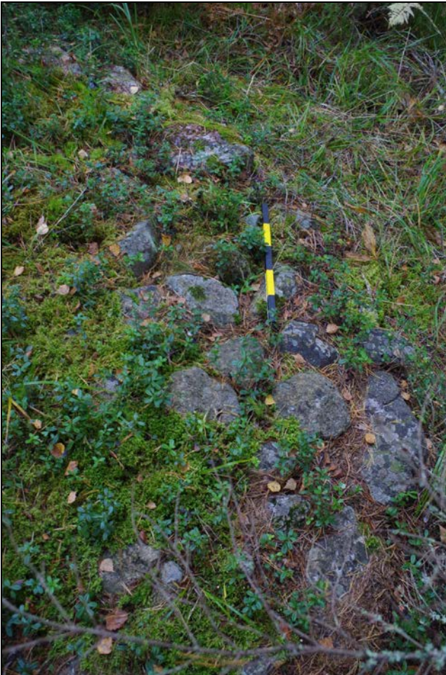
Kuvat 2: Aumanpohjan W-sivustan kivilatomusta. Lähikuva.