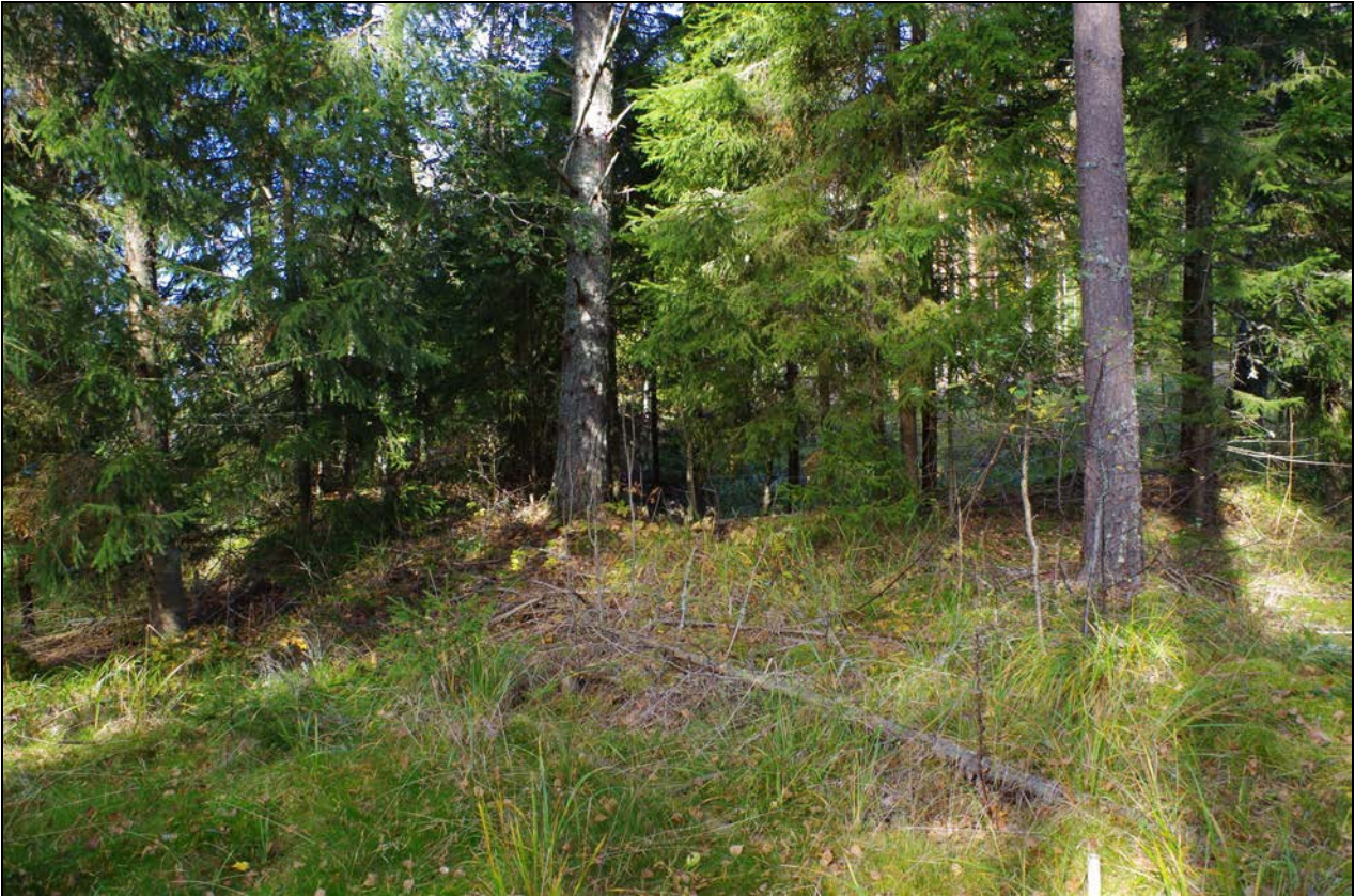
Kuva 1: Kohde suunnasta SE.