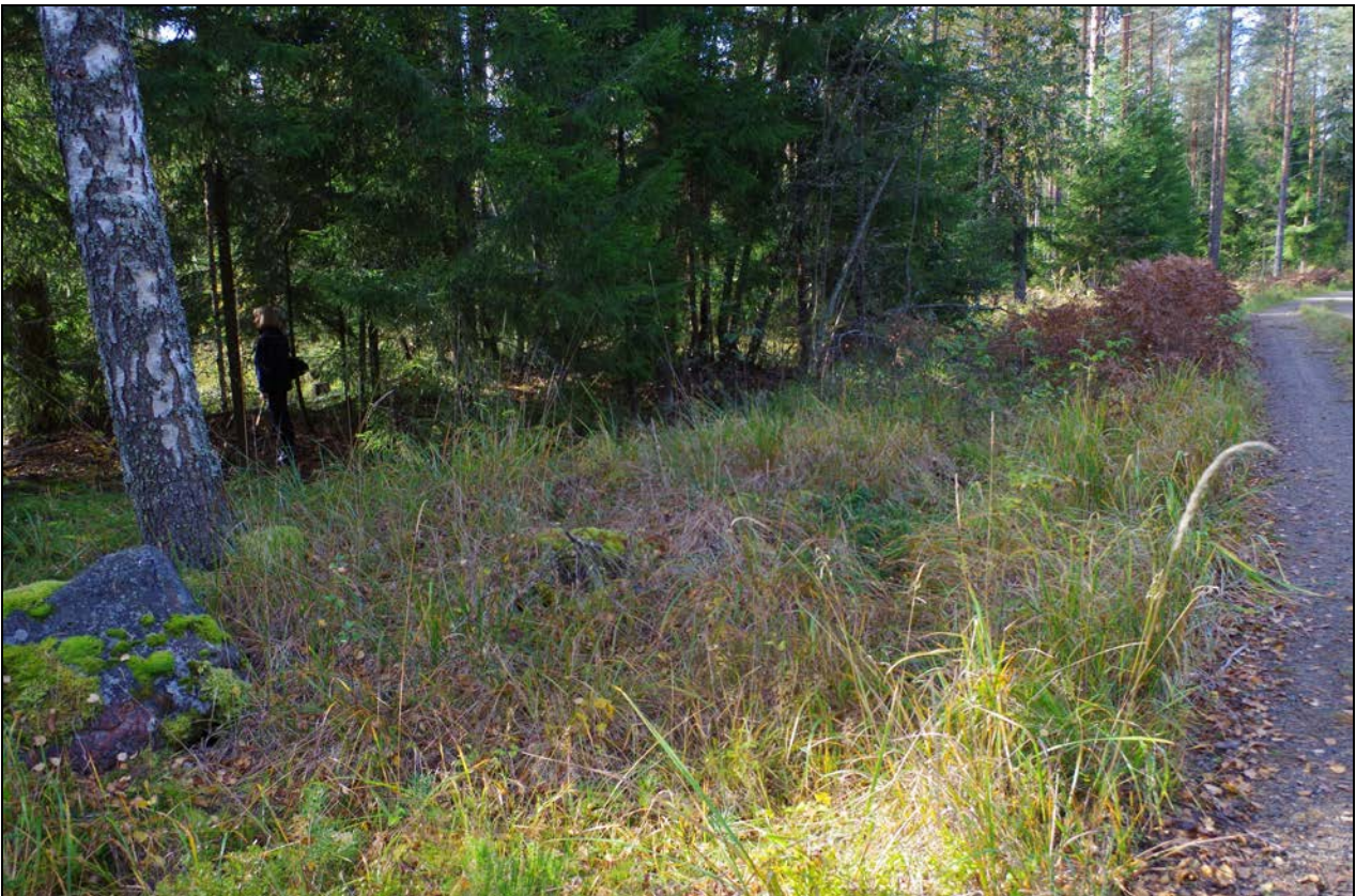
Kuva 2: Armi Oinonen seisomassa tervahaudan keskustassa vasemmalla näkyvän koivun oikealla puolella. Kuvan oikeassa reunassa näkyy Kelomäelle vievä tie. E.