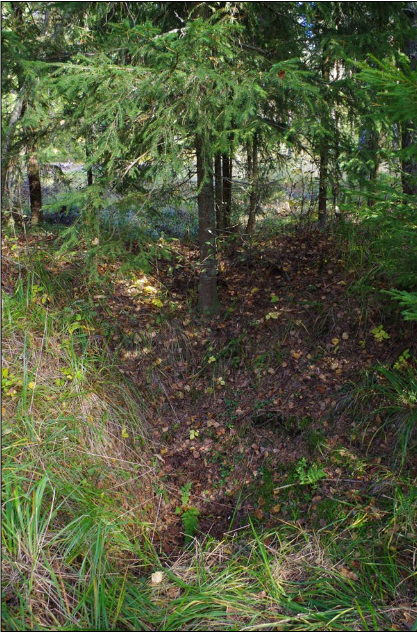
Kuva 3: Tervahaudan halssin kuoppa. S.