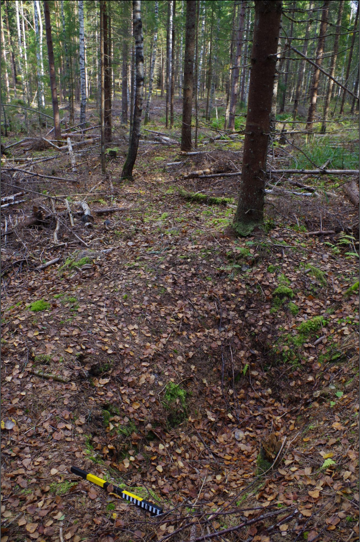
Kuva 3: Aumanpohja ja sitä ympäröivää maastoa. W.