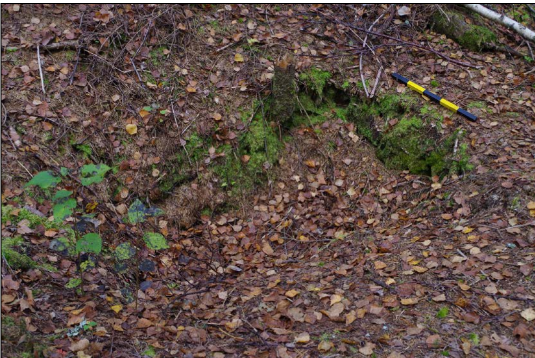
Kuva 2: Maalla täyttyneen nauriskuopan W-pääty. Lähikuva. NE.