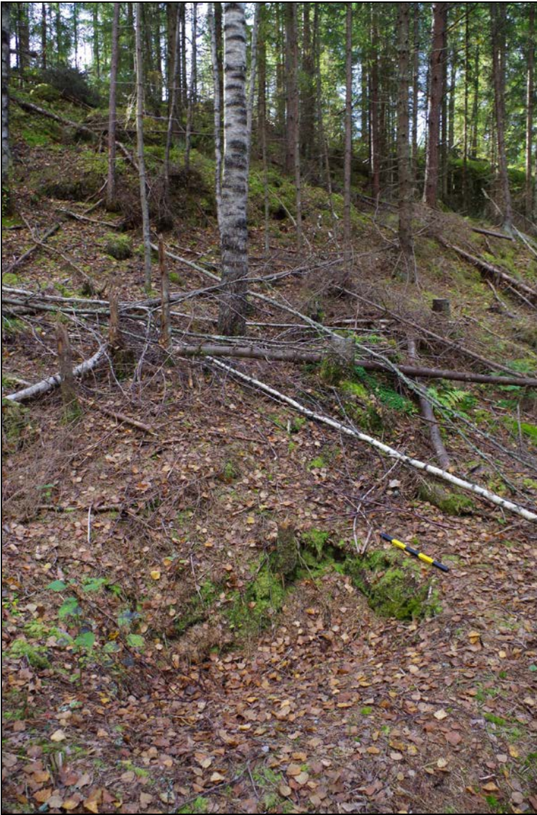
Kuva 1: Kohteen sijainti maastossa. E.