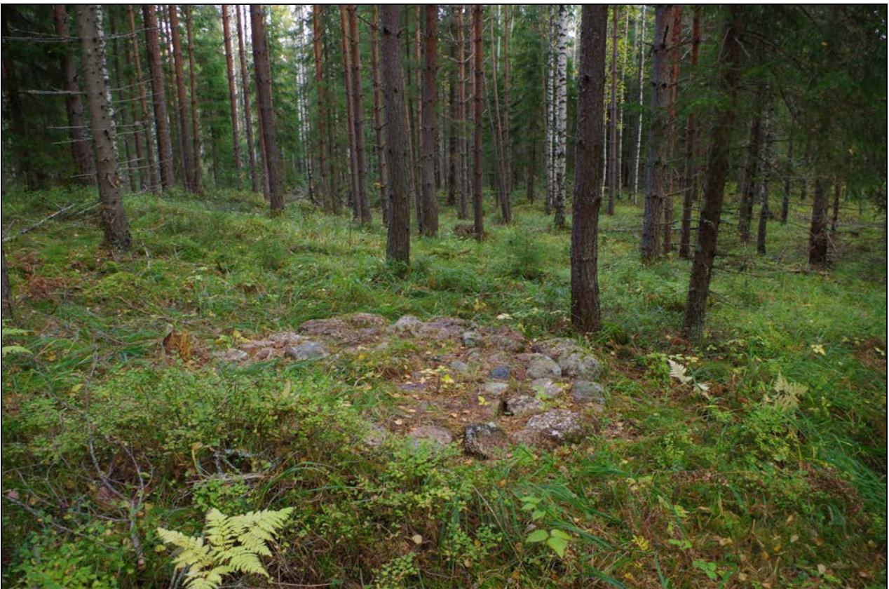
Kuva 2: Aumanpohja suunnasta S.