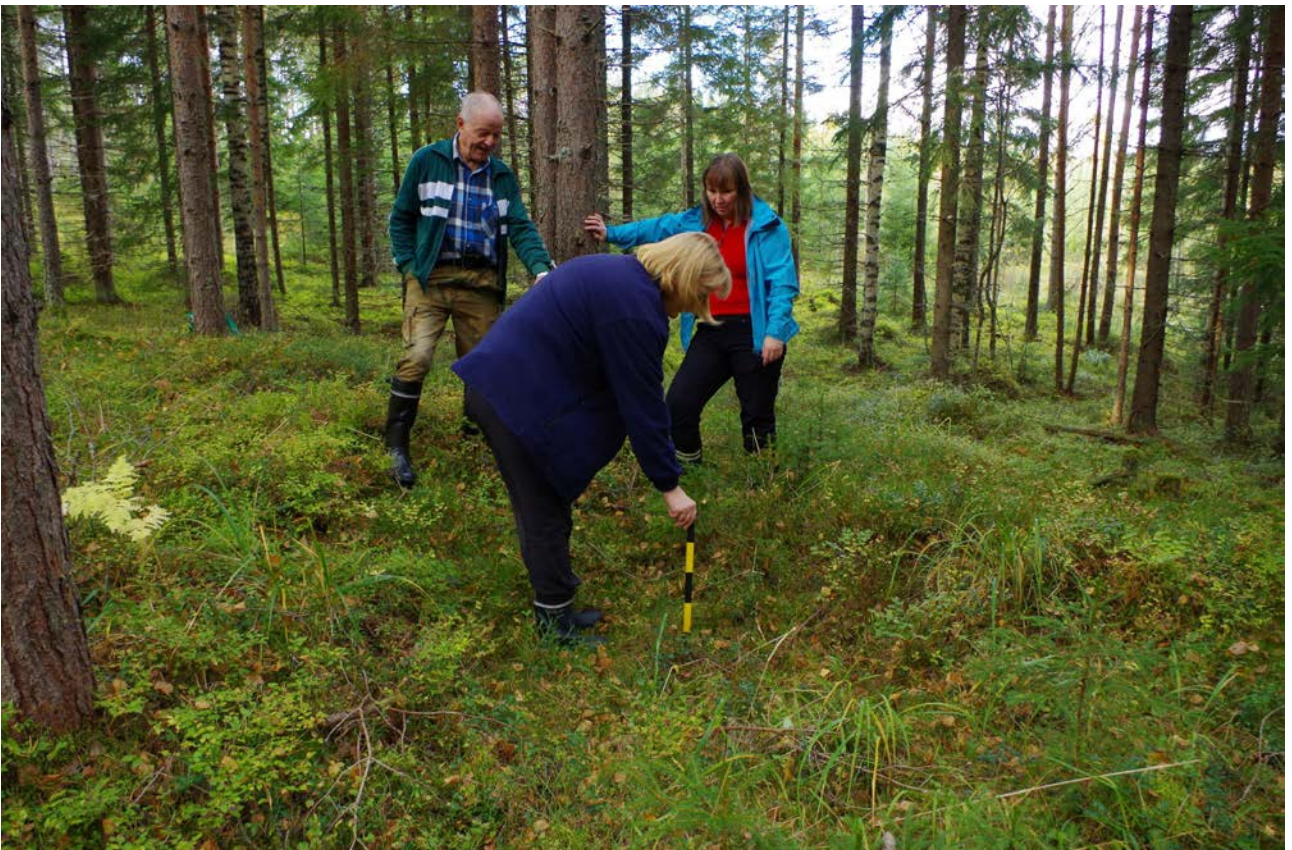
Kuva 4: Aumanpohjan NE-puolella, kymmenisen metrin päässä, erottui maastossa 20-30 cm syvyinen kuopanne. Sen liittyminen aumanpohjaan jäi epäselväksi. Kuvassa oppaana toiminut H. Uusiheimala (vas.), A. Oinonen sekä K. Toivonen (oik.) kuopannetta ihmettelemässä. S.