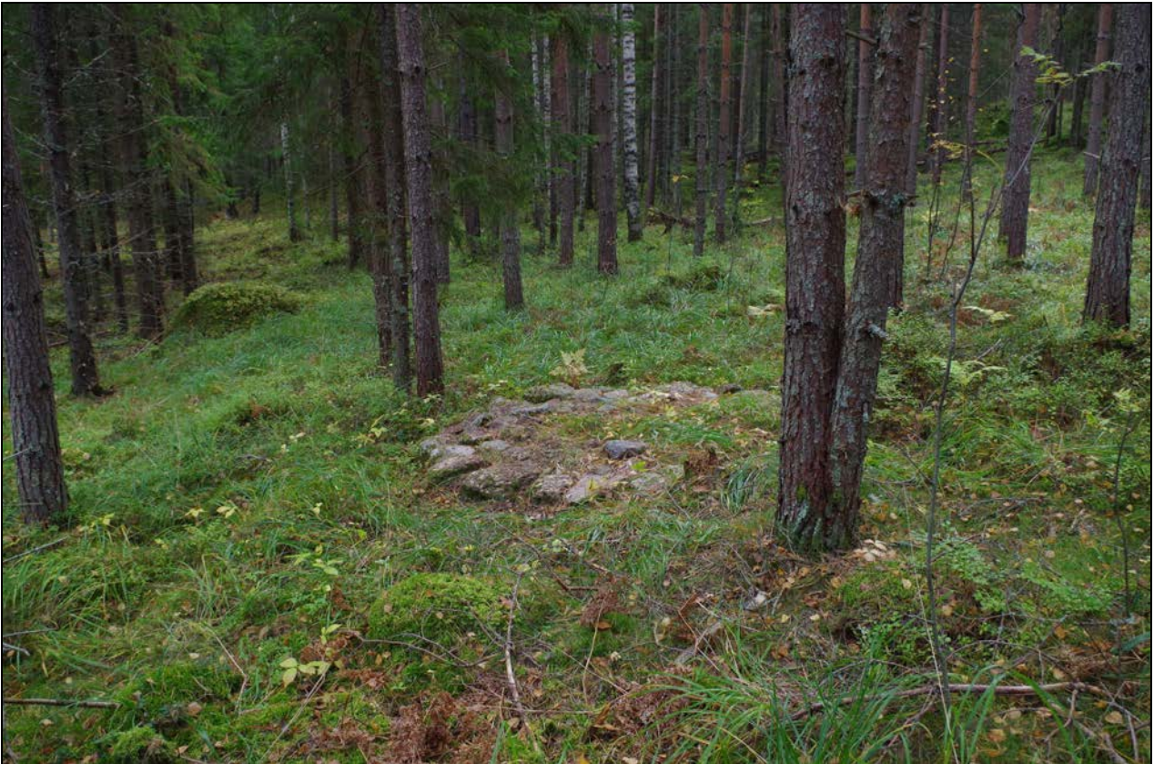
Kuva 1: Kohteen sijainti maastossa. SE.