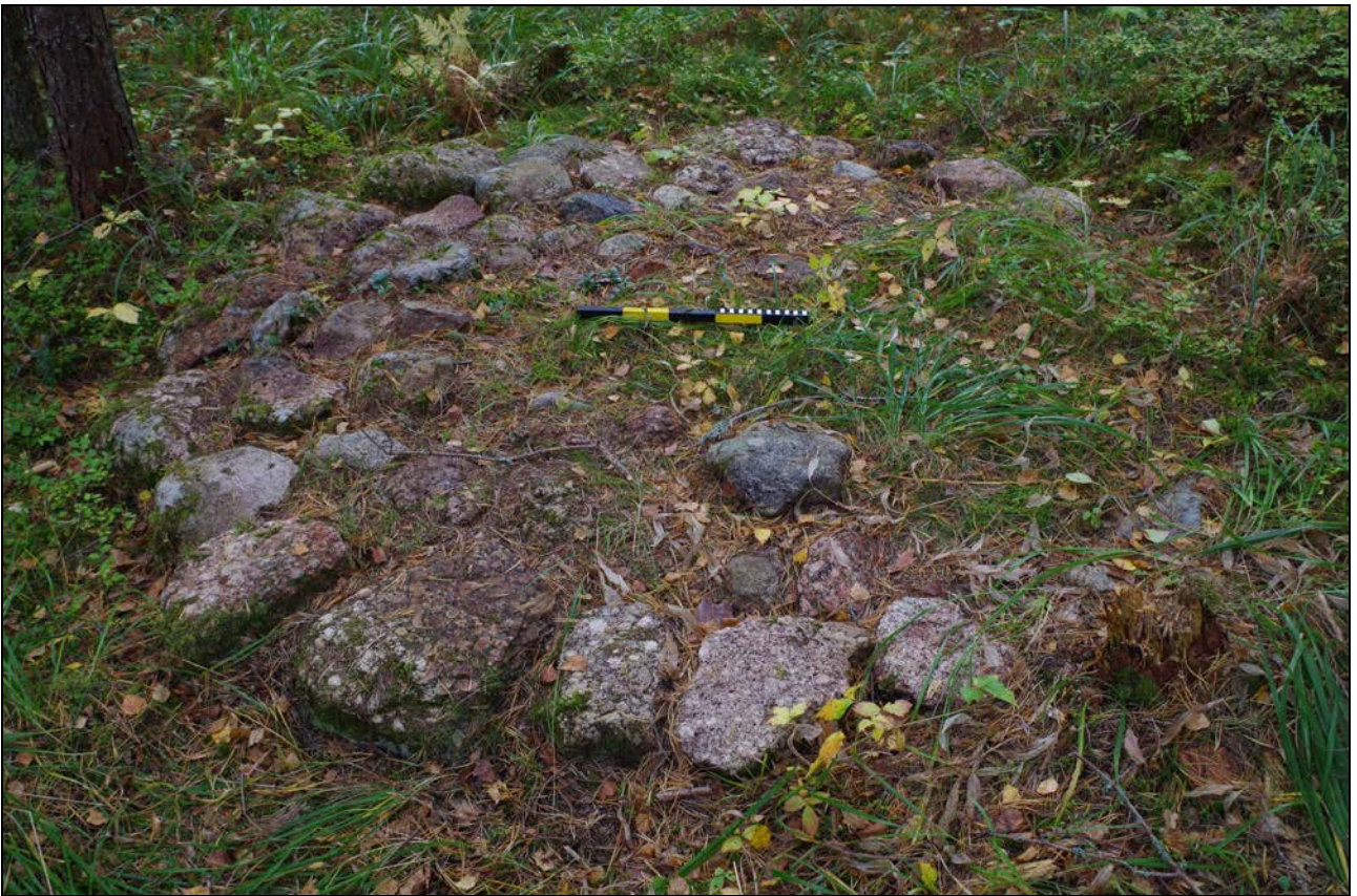
Kuva 3: Aumanpohja, lähikuva. SE.