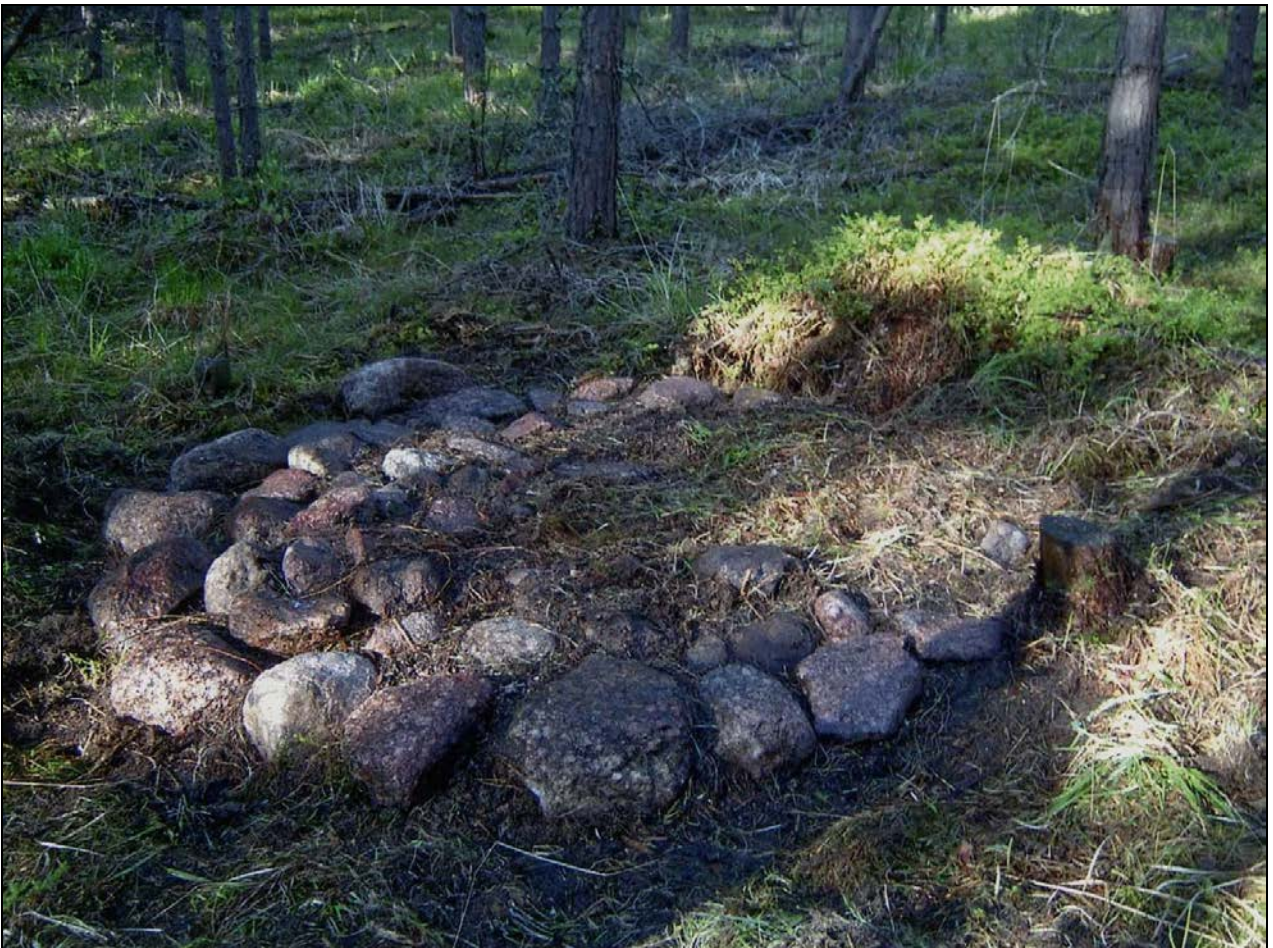
Kuva 5: Aumanpohja vuonna 2006–2007 aluskasvillisuuden alta paljastettuna. Lähikuva. SE.