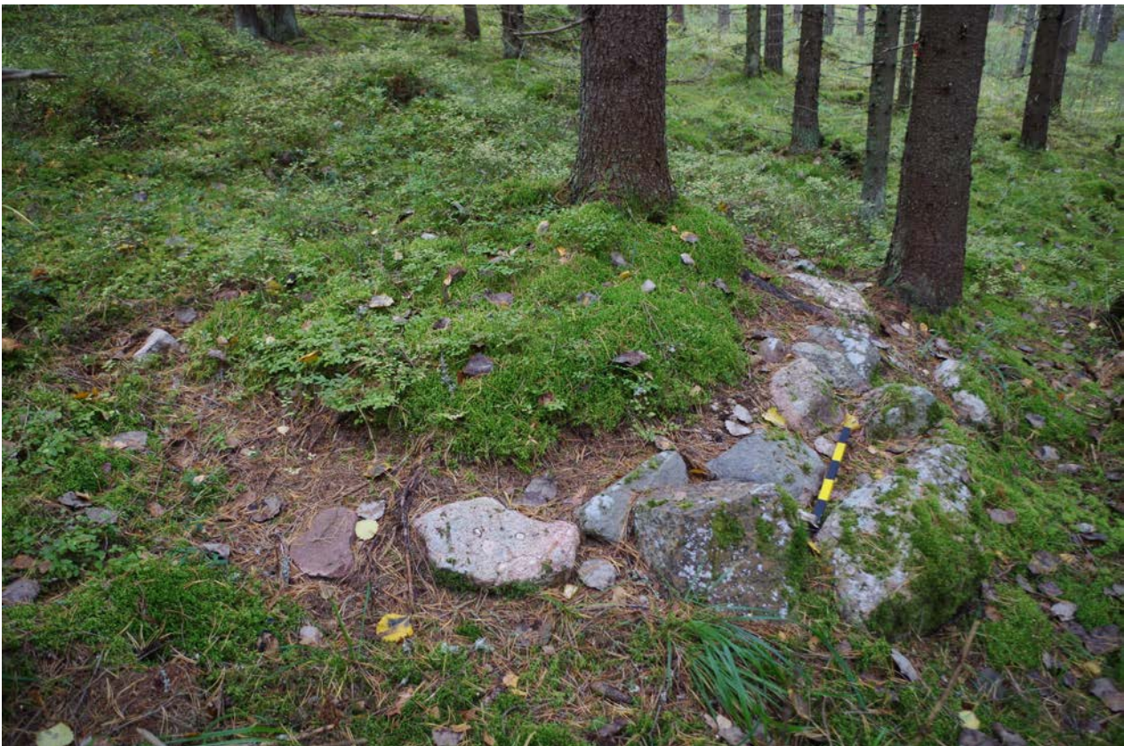
Kuva 2: Aumanpohja suunnasta E. Lähikuva.