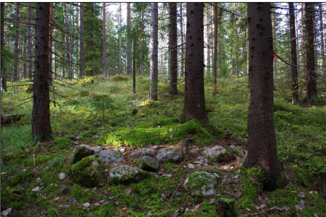
Kuva 5: Kohde suunnasta N.