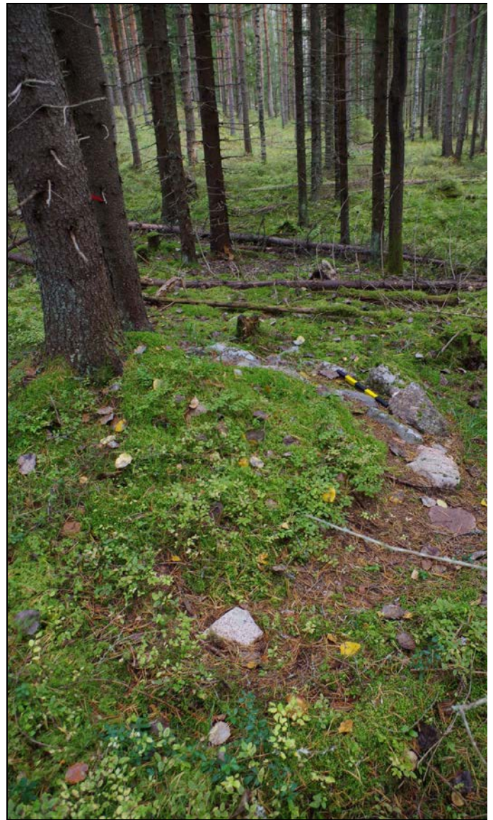
Kuvat 3-4: Vasemmalla aumanpohjan NE-reunustan kiveystä, lähikuva. N. Oikealla näkymä kohteelta suuntaan N.