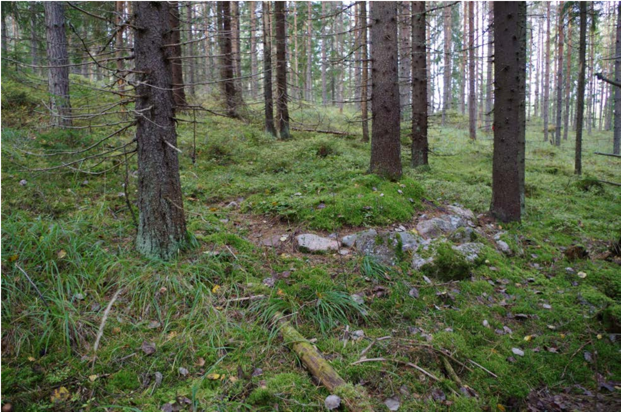
Kuva 1: Kohteen sijainti maastossa. E.