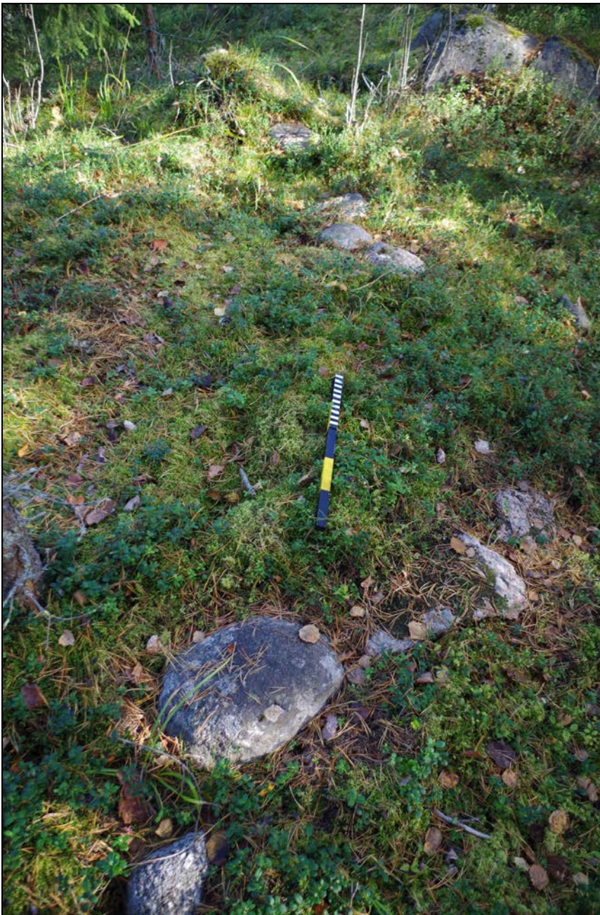
Kuva 3: Aumanpohjan S-sivustan kiveystä, lähikuva. W.