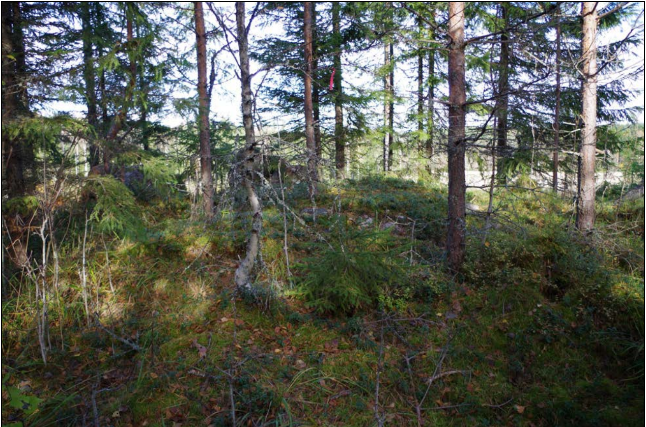
Kuva 1: Kohteen sijainti maastossa. S.