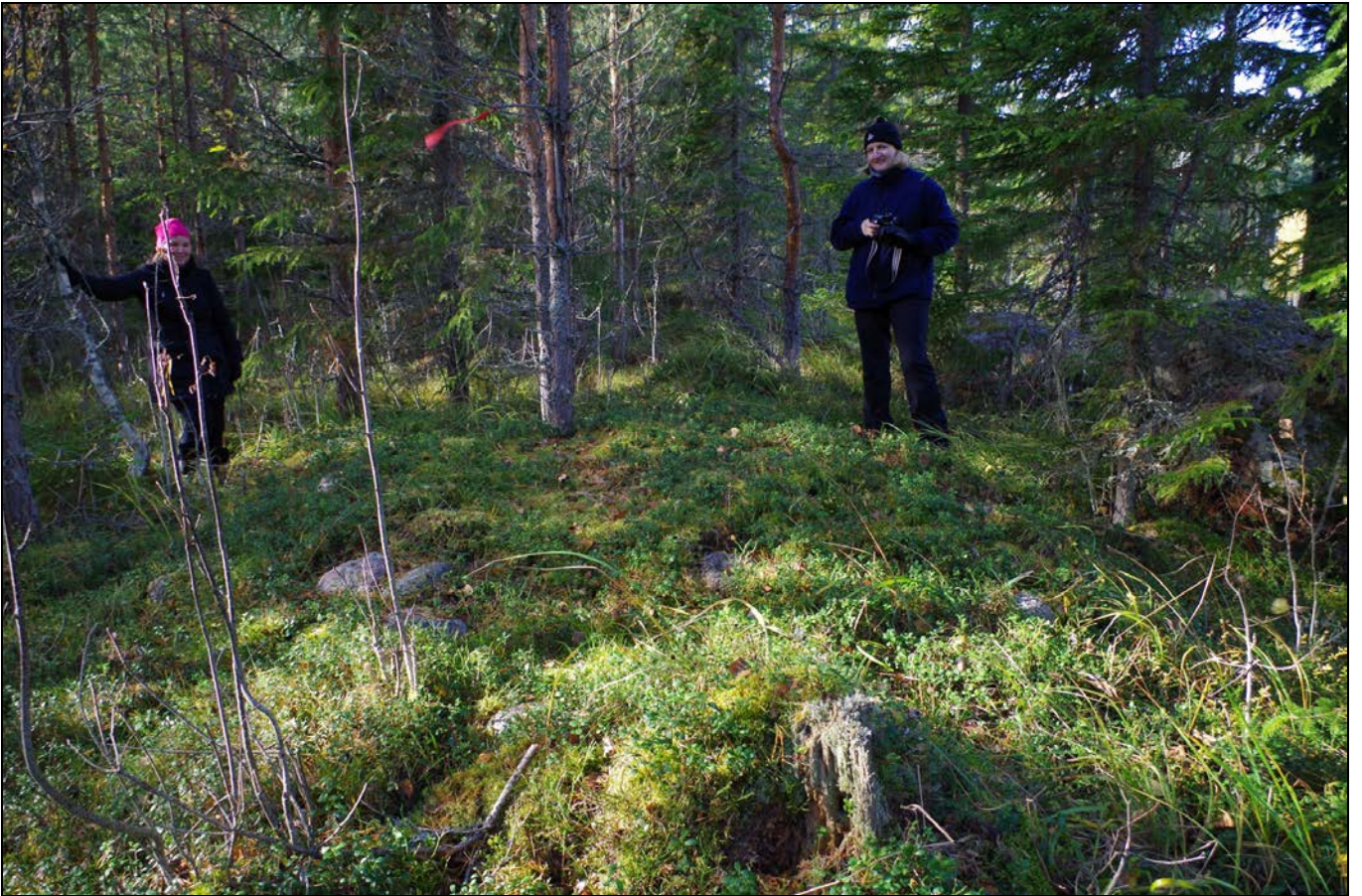
Kuva 5: K. Toivonen (vas.) ja A. Oinonen Rajanotko 3:n aumanpohjaa dokumentoimassa. E.