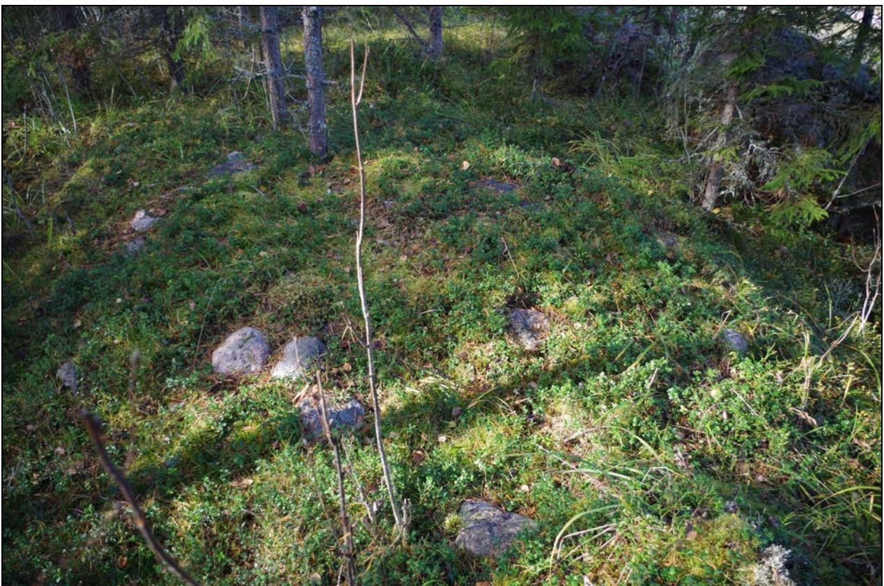
Kuva 2: Aumanpohja suunnasta E.