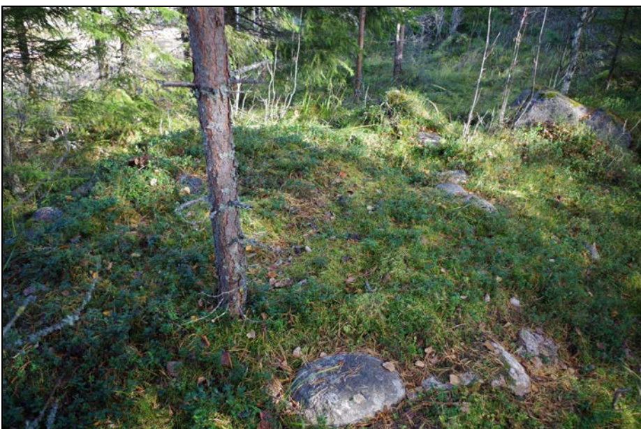
Kuva 4: Aumanpohja suunnasta W.