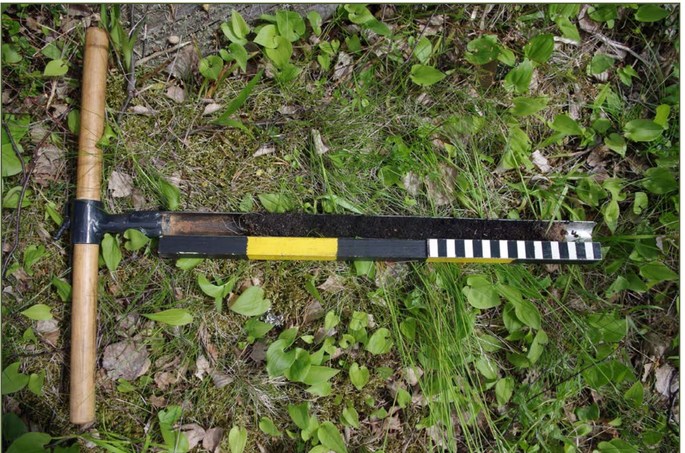
Kuva 4: Miilun keskustasta paljastui kairauksen yhteydessä 30 cm:n paksuinen noki- ja hiilimaakerros.