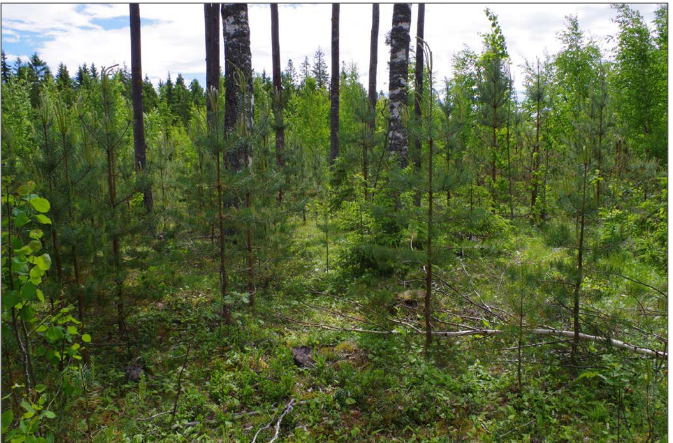
Kuva 2: Miilun keskustaa suunnasta E.