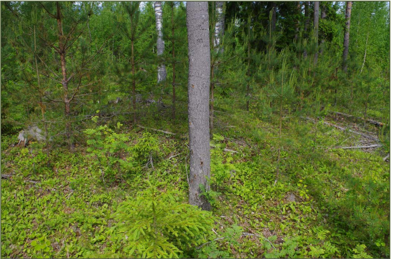
Kuva 3: Miilun SE-sivustaa. SW.