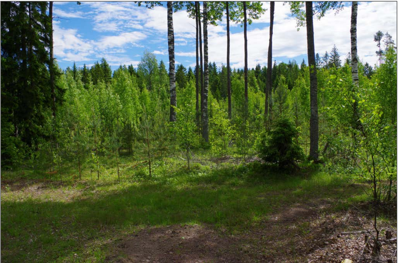
Kuva 1: Miilu suunnasta NE. Kuvassa näkyvät korkeat haavat ja koivut kasvavat miilunpohjan alueella.