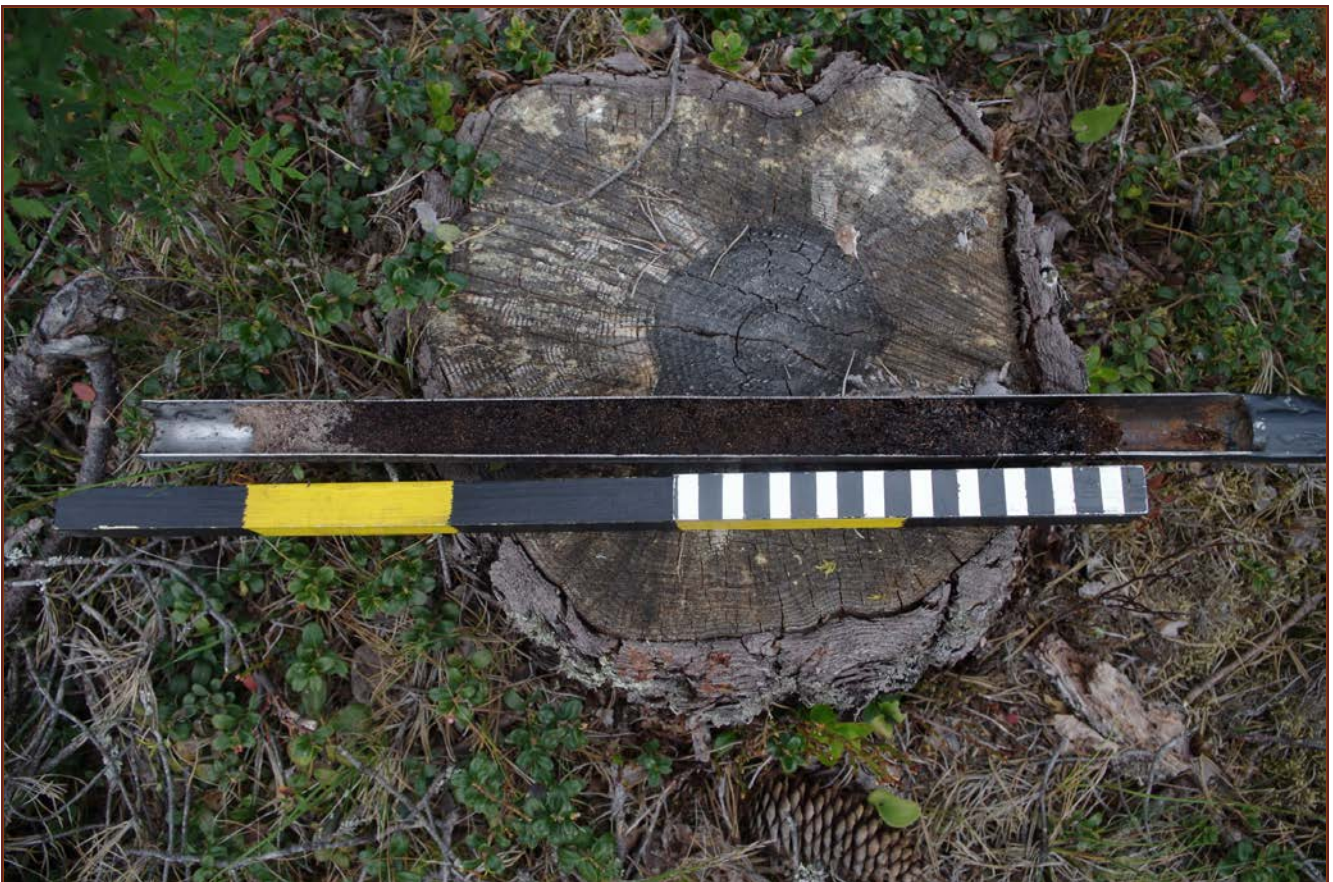
Kuva 4: Kairausnäyte miilusta sisälsi runsaasti puuhiiltä.