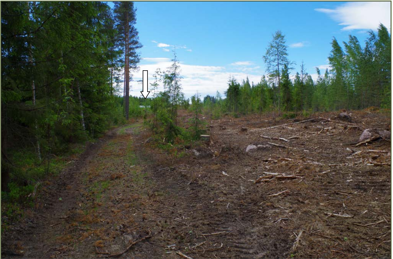
Kuva 1: Pyhtään Korkiaharjun miilumaisemaa. Miilun Korkiaharju 1 sijainti maastossa on merkitty kuvaan nuolella. N.