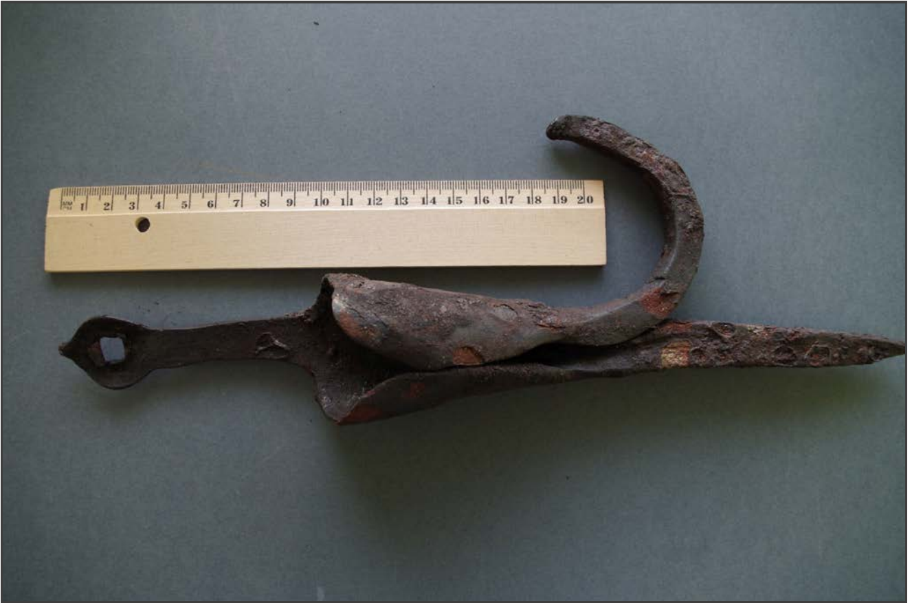
Kuva 5: Miilun keskustasta maan pinnasta löytynyt keksi.