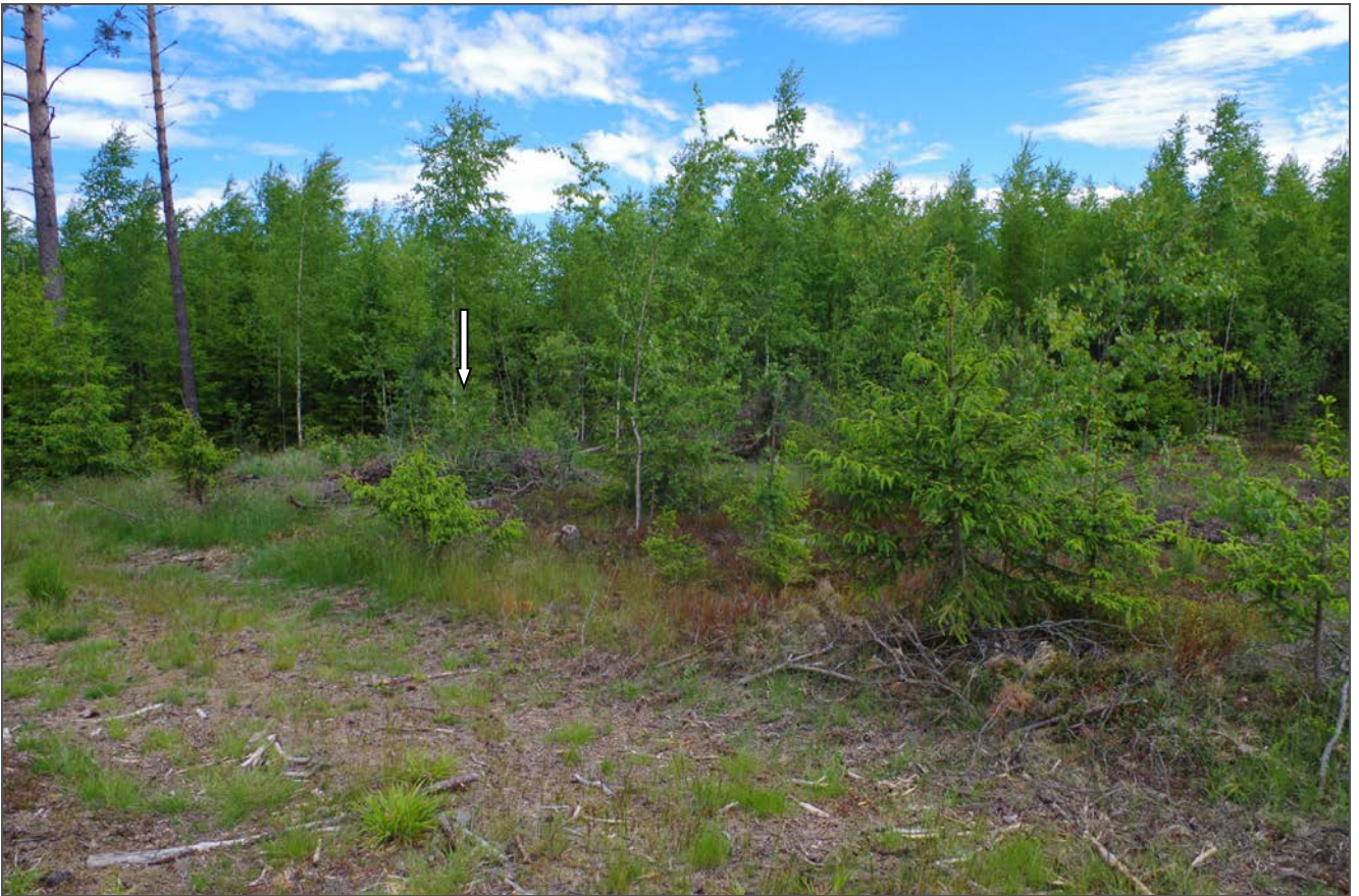
Kuva 3: Miilun suunnasta SW.