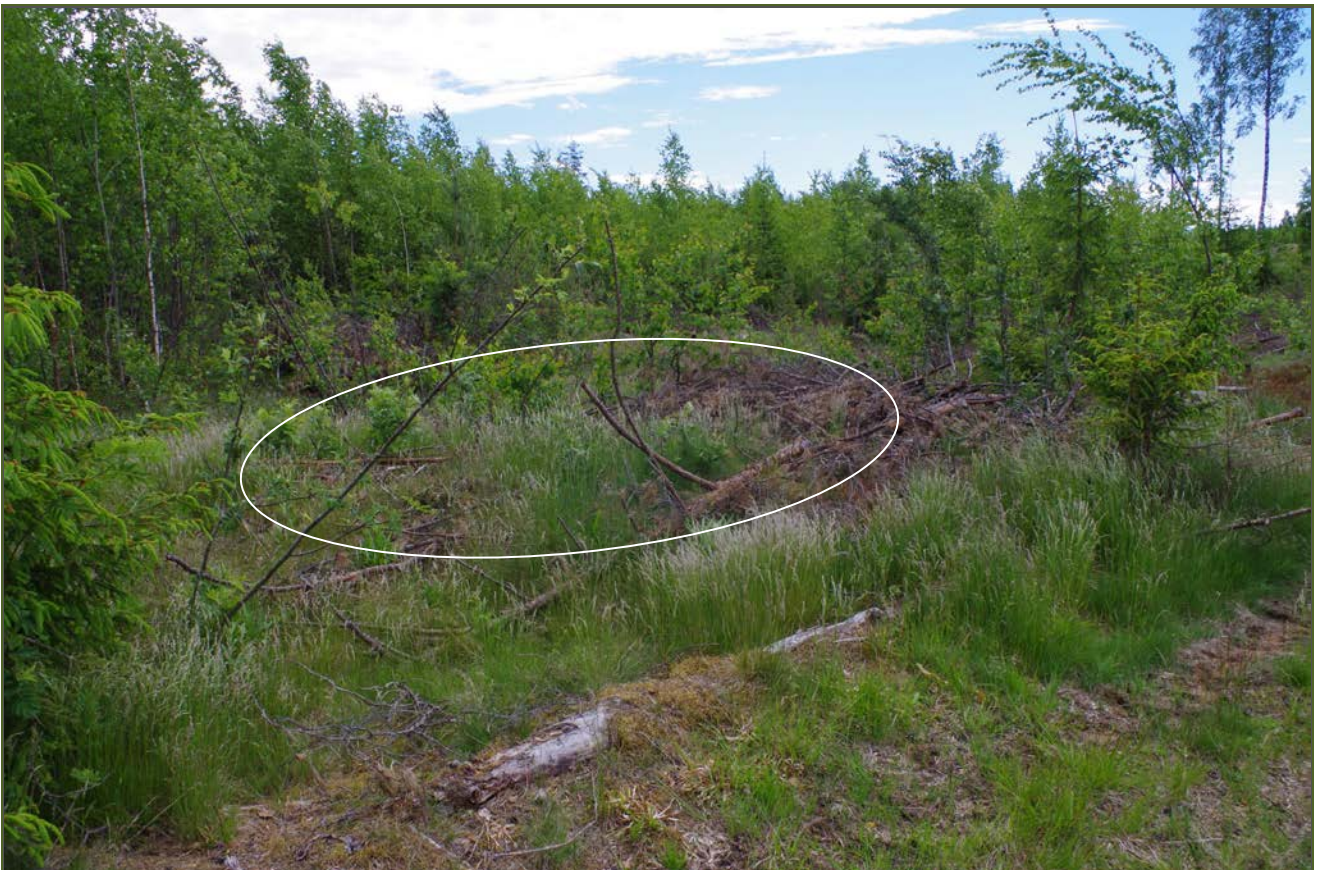
Kuva 2: Miilu suunnasta NW.