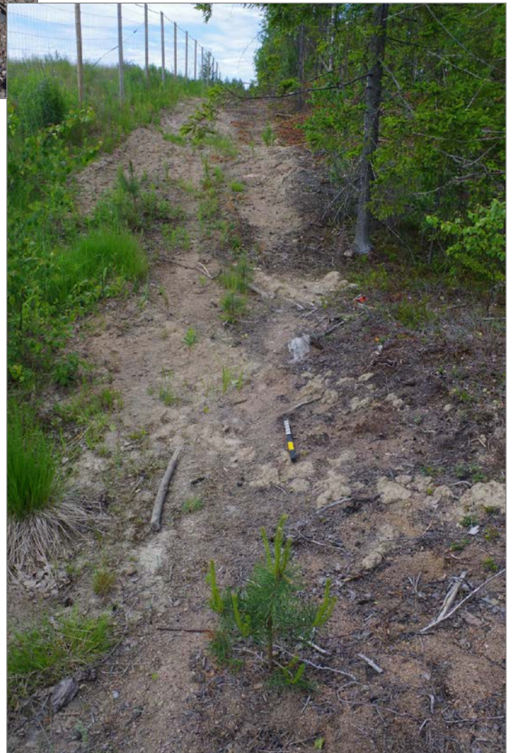
Kuva 4: Puuhiilen palasia ja murusia esiintyi runsaasti maanpinnalla miilun lähistöllä. E.