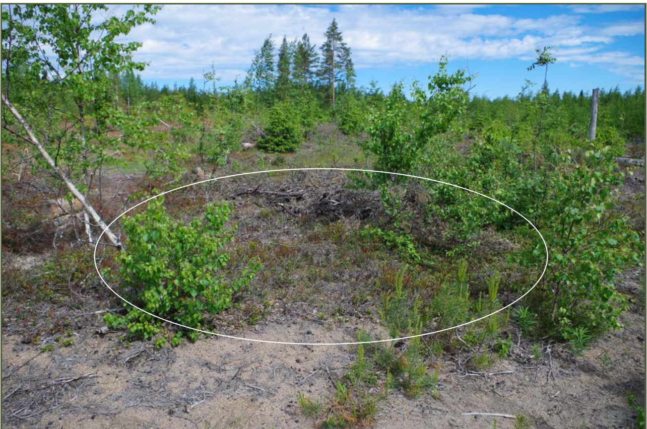
Kuva 2: Miilu suunnasta SW.