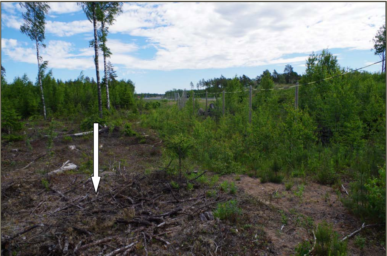
Kuva 1: Kuvassa vasemmalla hakkuujätteen alla sijaitseva miilu, taustalla VT 7. W.