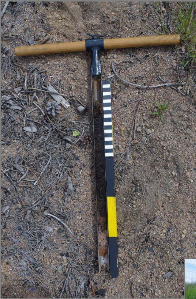
Kuva 3: Miilusta otettu kairausnäyte sisälsi runsaasti nokea ja puuhiiltä.