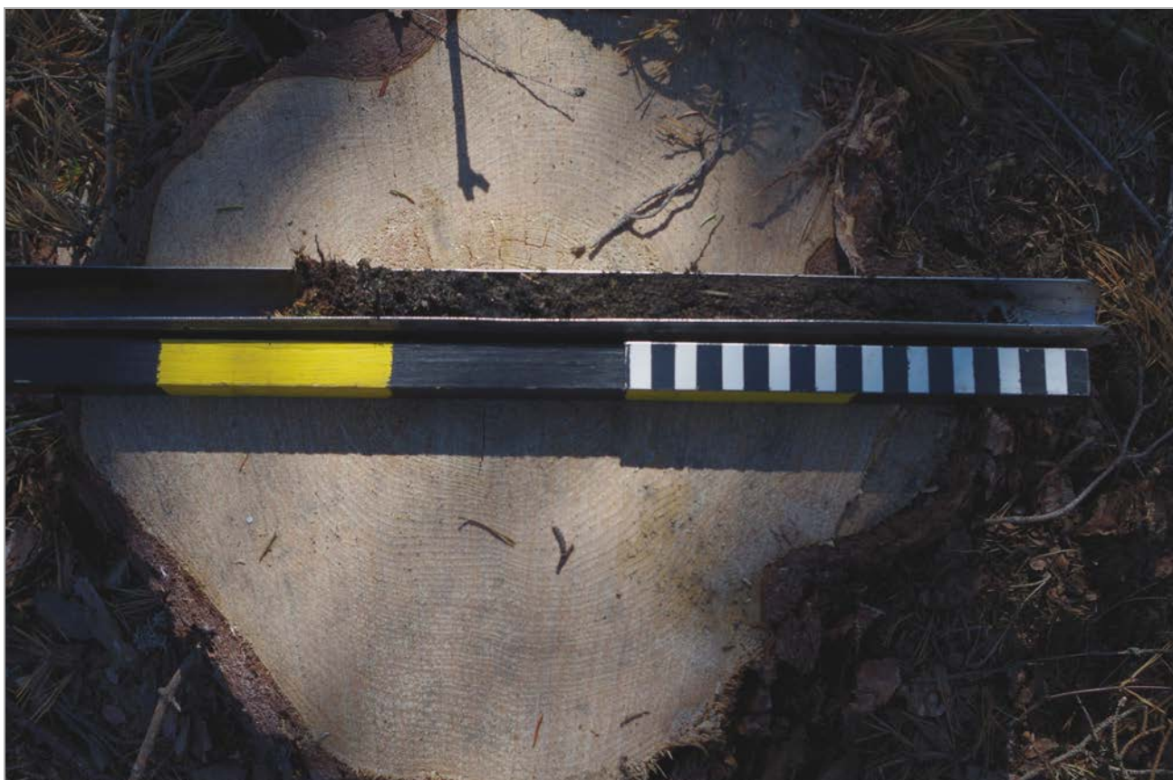
Kuva 4: Miilusta otettu kairausnäyte sisälsi 30 cm:n paksuudelta noen- ja hiilensekaista hiekkaa.