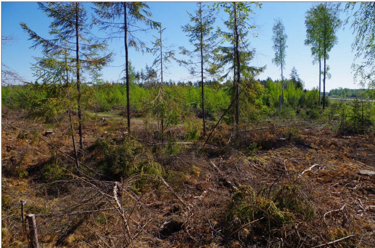
Kuva 3: Miilu suunnasta W. Taustalla oikealla VT 7.