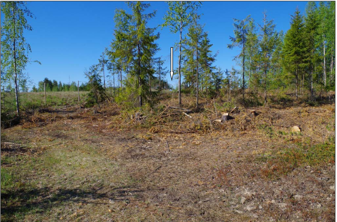
Kuva 1: Miilu suunnasta N. Taustalla VT 7.