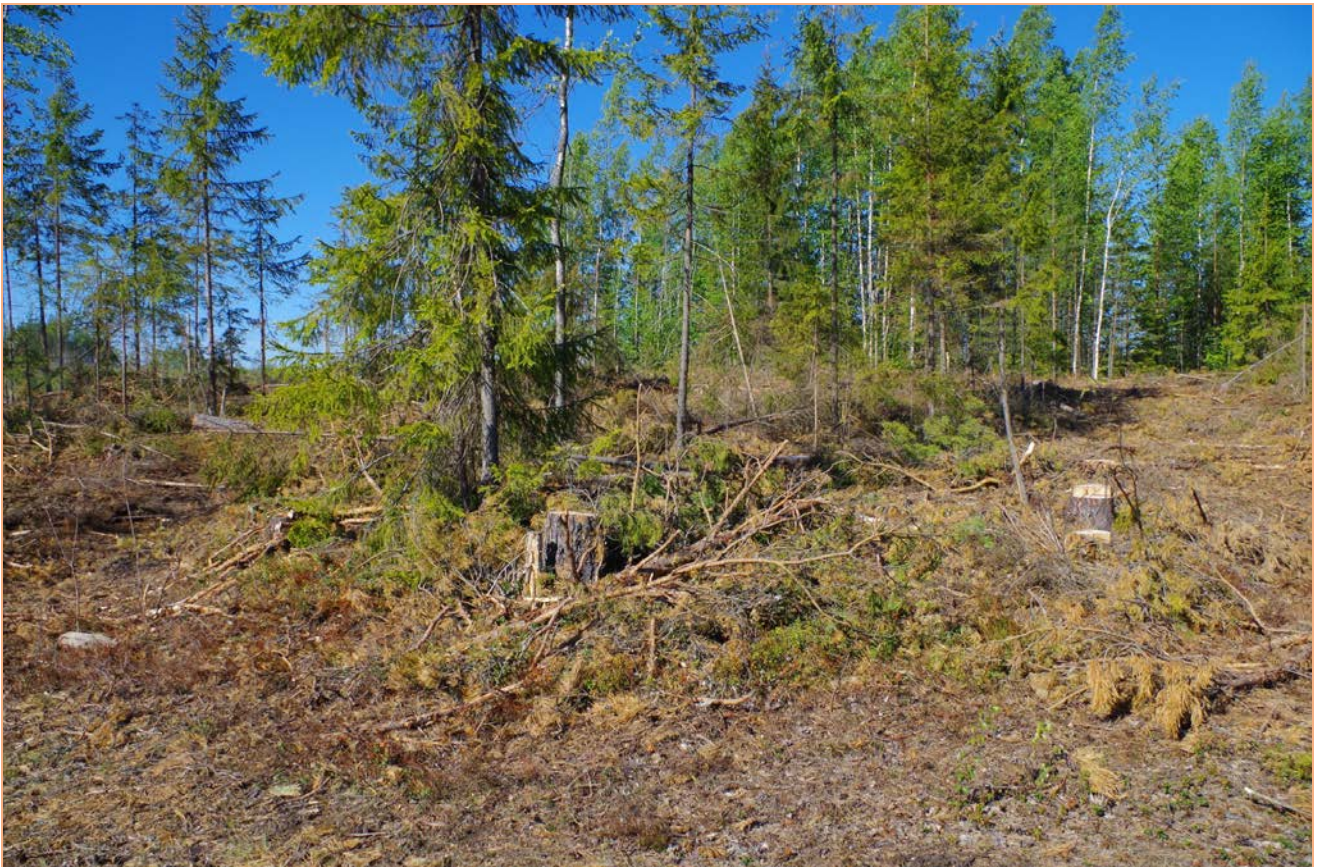
Kuva 2: Miilu suunnasta NE.