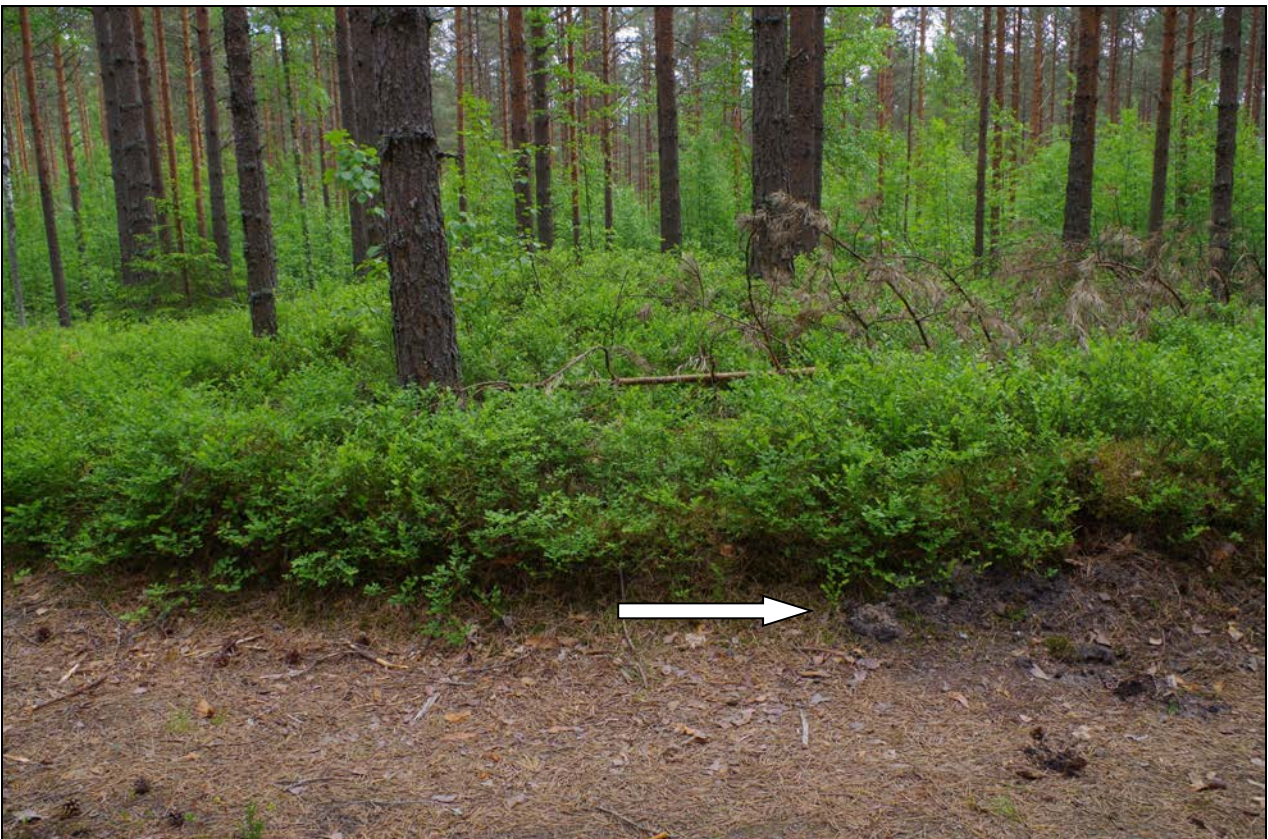
Kuva 4: Miilukohte oli rikkoutunut W-sivustaltaan ja viereisen hiekkatien leikkauksesta paljastui noen- ja hiilensekainen paksu kerrostuma. N.