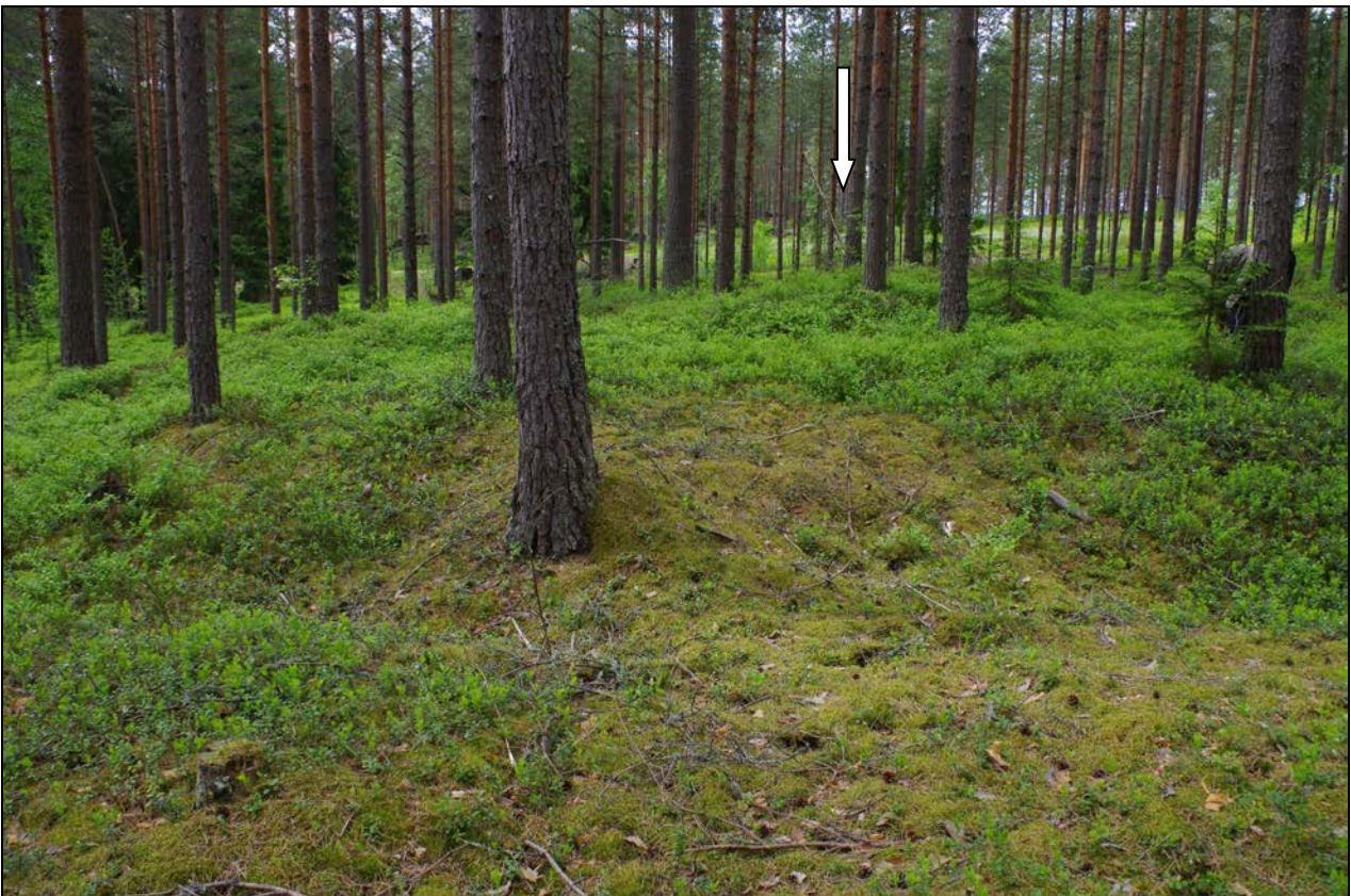
Kuva 2: Miilukohde suunnasta SE.