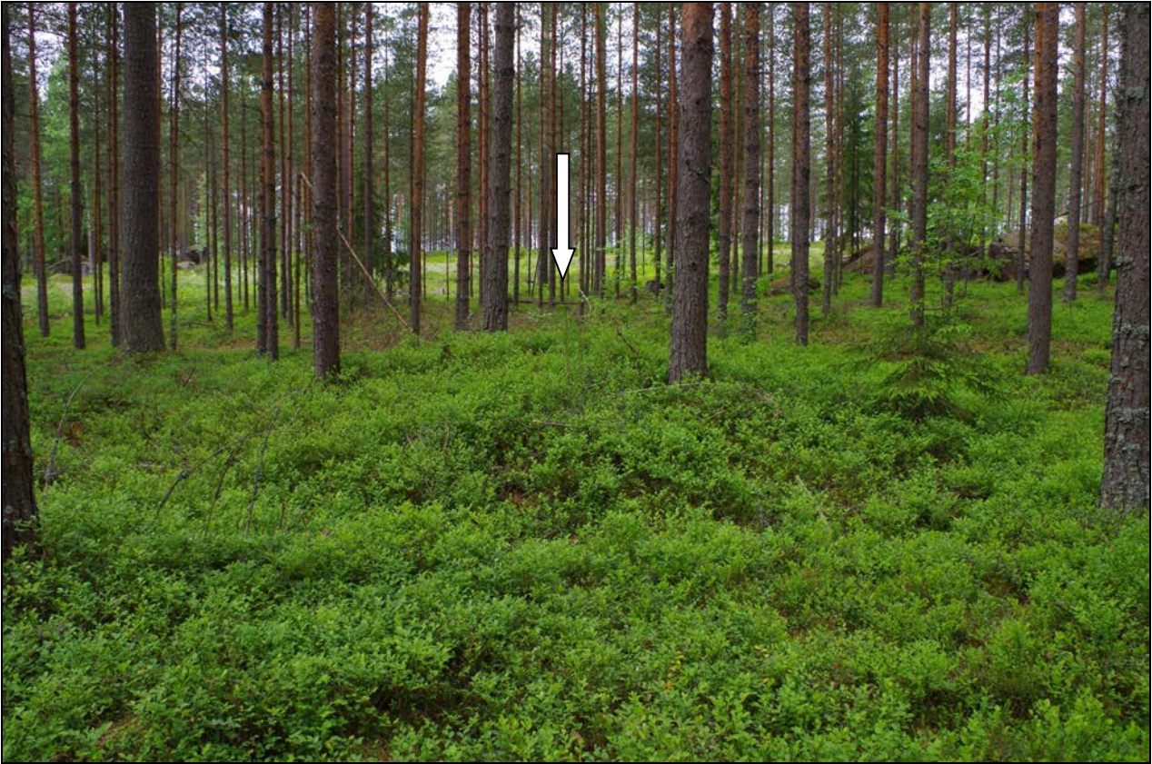
Kuva 3: Laaja-alaisen miilunpohjan keskellä sijainnut kukkuramainen ja ojalla rajattu pienempi miilunpohja.