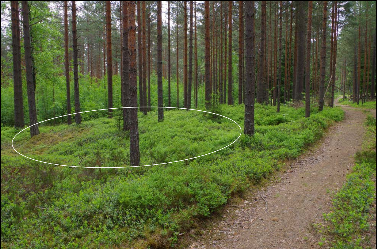
Kuva 1: Miilukohde suunnasta NE. Taustalla kuvassa kulkee Purolantie. Kuva: KyM/M. Kykyri.