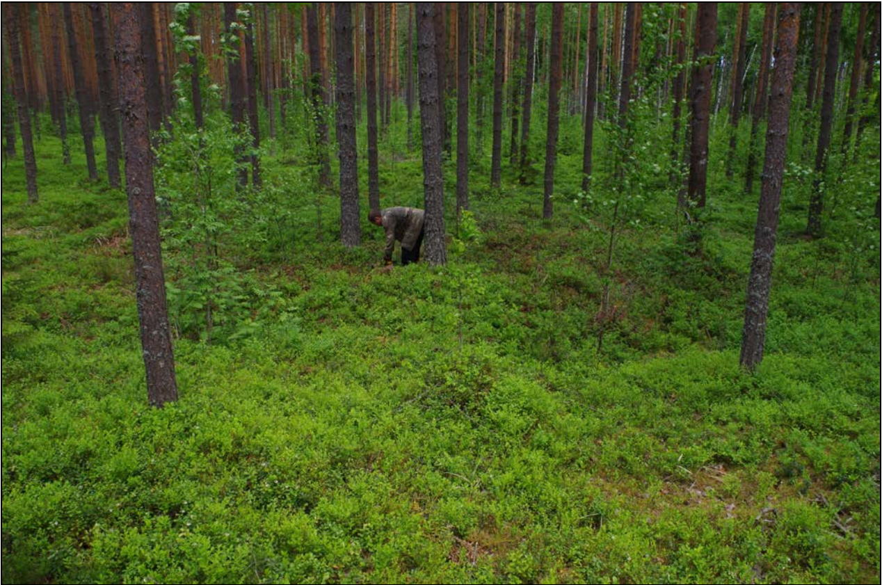
Kuva 1: Rune Nygård ottamassa kairausnäytettä hiilimiilusta Lilla Högåsbacken 3. S.