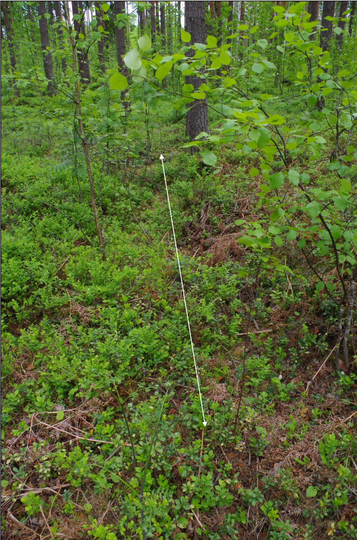
Kuva 3: Miilun ympäri oli kaivettu leveä oja. SE.