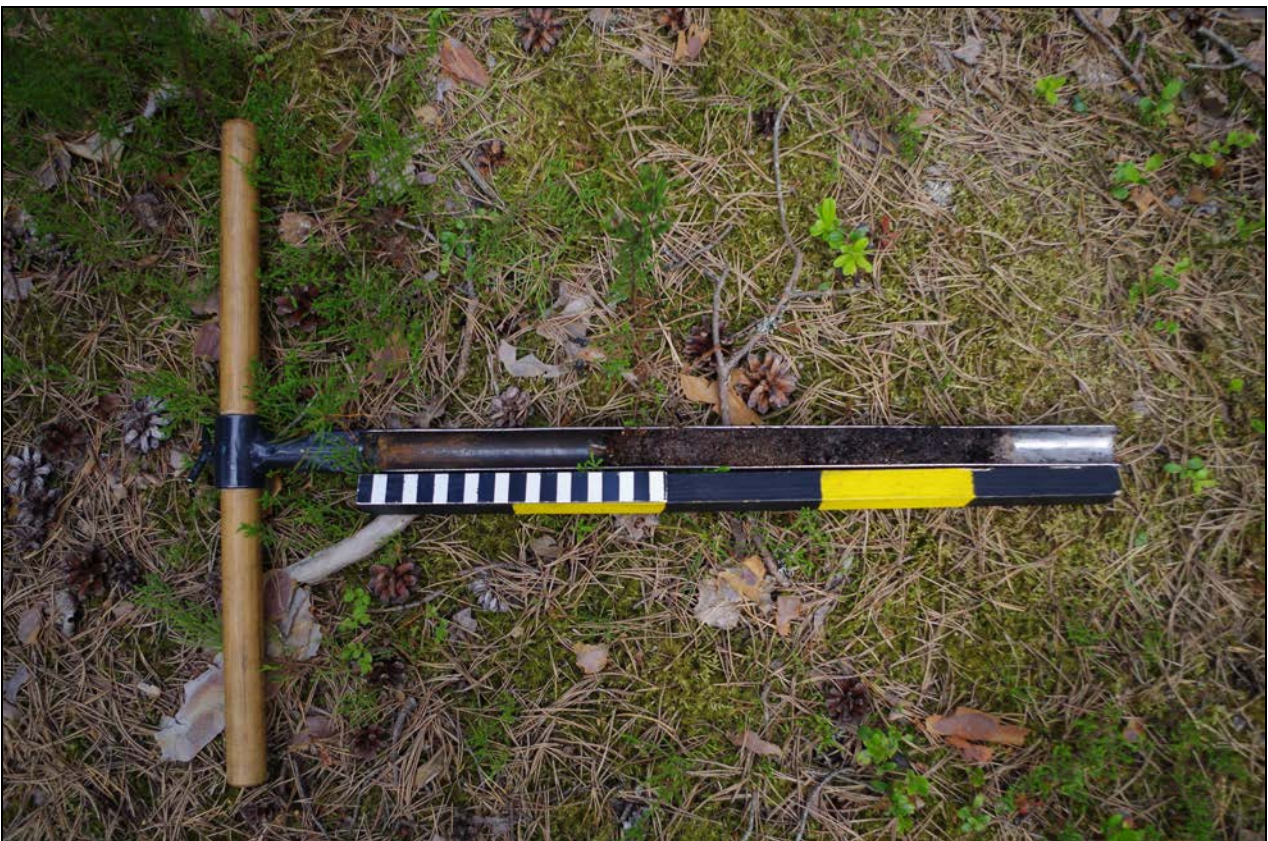
Kuva 2: Kairausnäyte sisälsi runsaasti hiili- ja nokimaata.