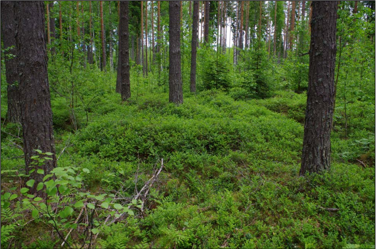
Kuva 1: Miilu erottui maastossa suorakaiteisena kohoutumana. NE.