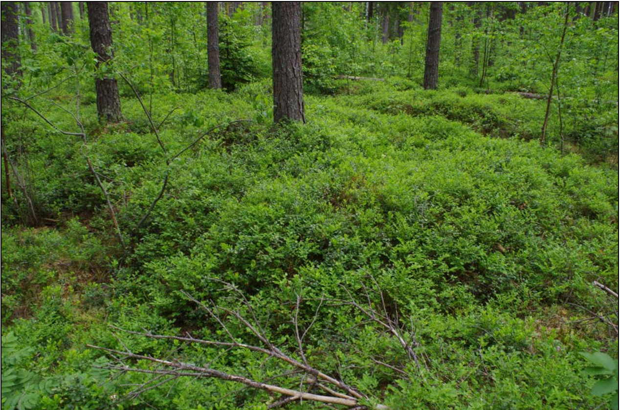
Kuva 3: Miilua ympäröi sen kaikilla sivuilla leveä ja matala oja. W.