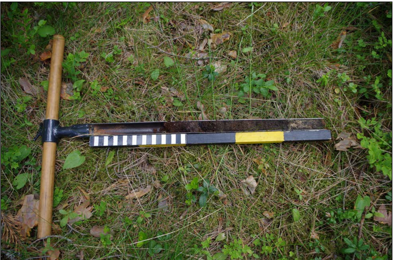
Kuva 2: Kairausnäyte miilusta sisälsi palanutta hiekkaa, nokea, hiiltä ja savea.