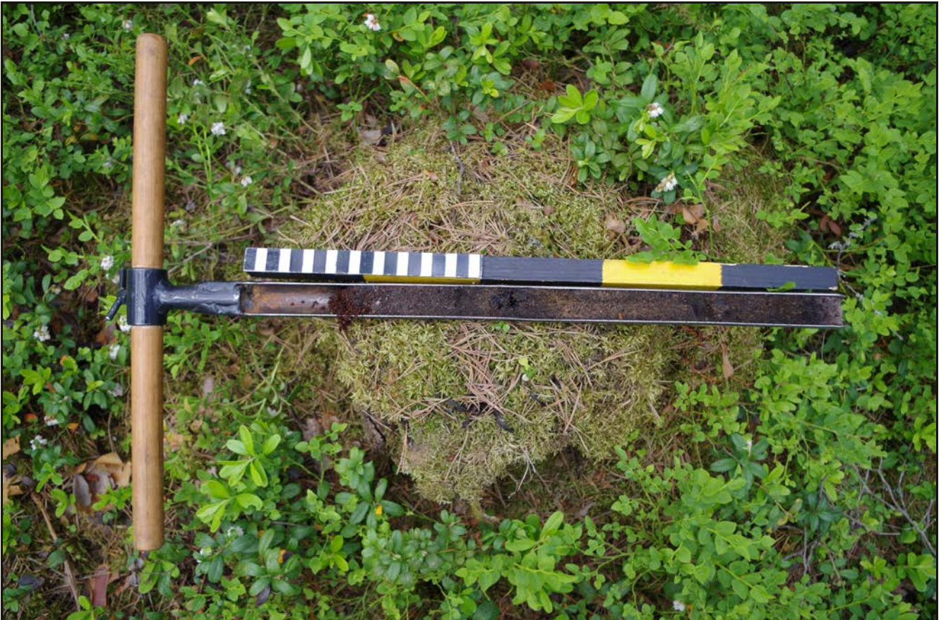
Kuva 2: Miiluun keskustasta otettu näyte sisälsi palanutta hiekkaa, nokea ja puuhiiltä.