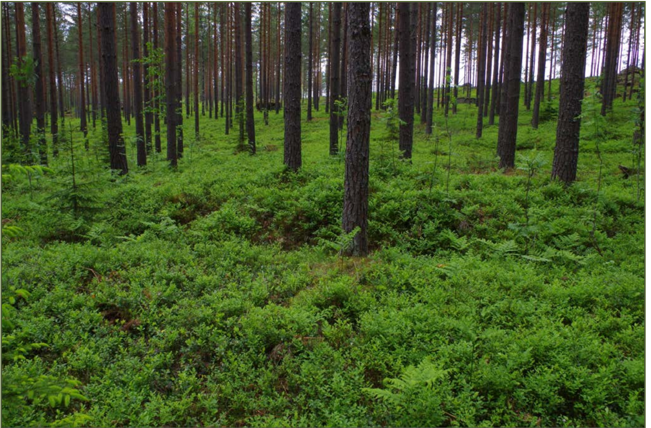
Kuva 1: Miilu suunnasta E.