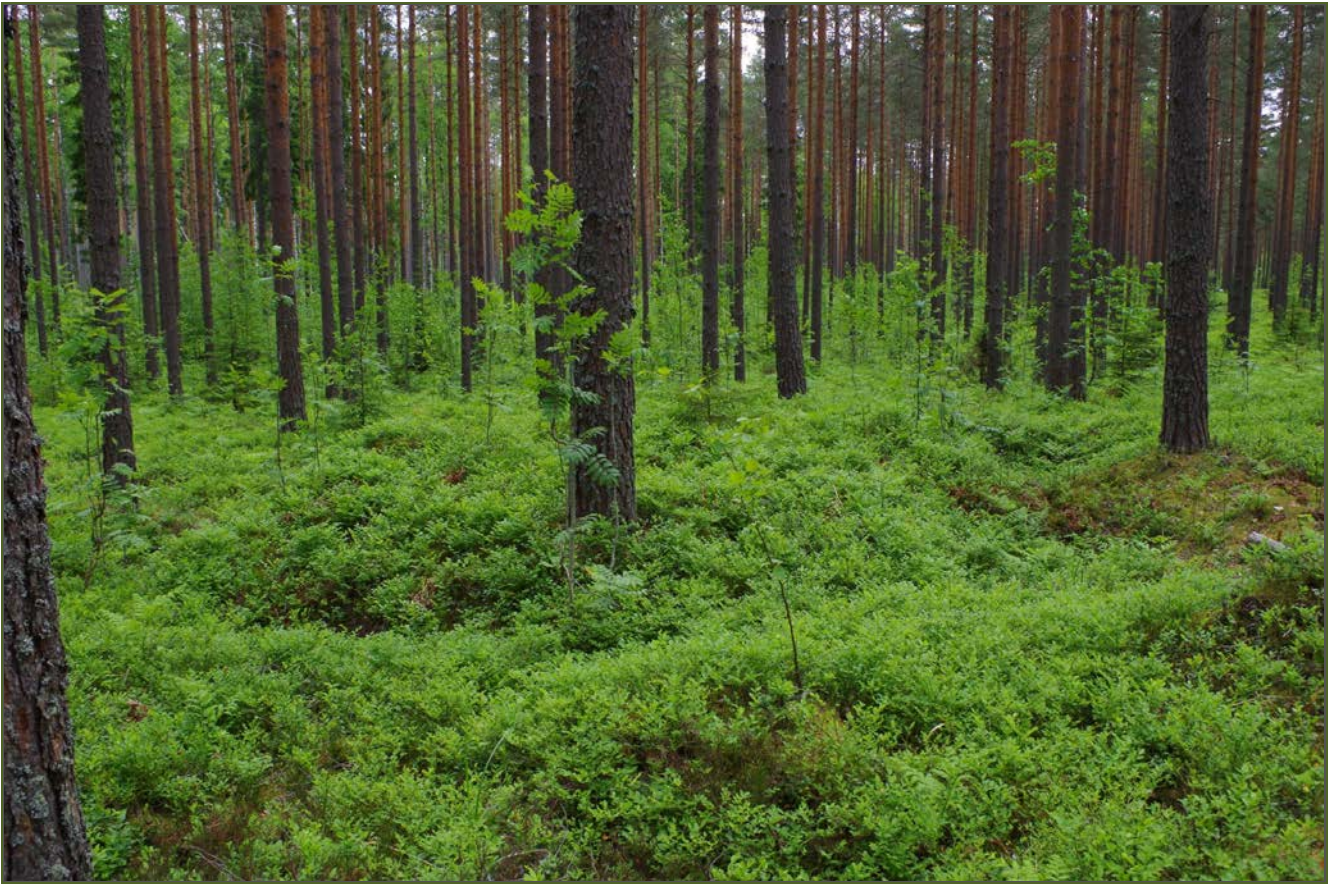
Kuva 3: Miilu suunnasta N.